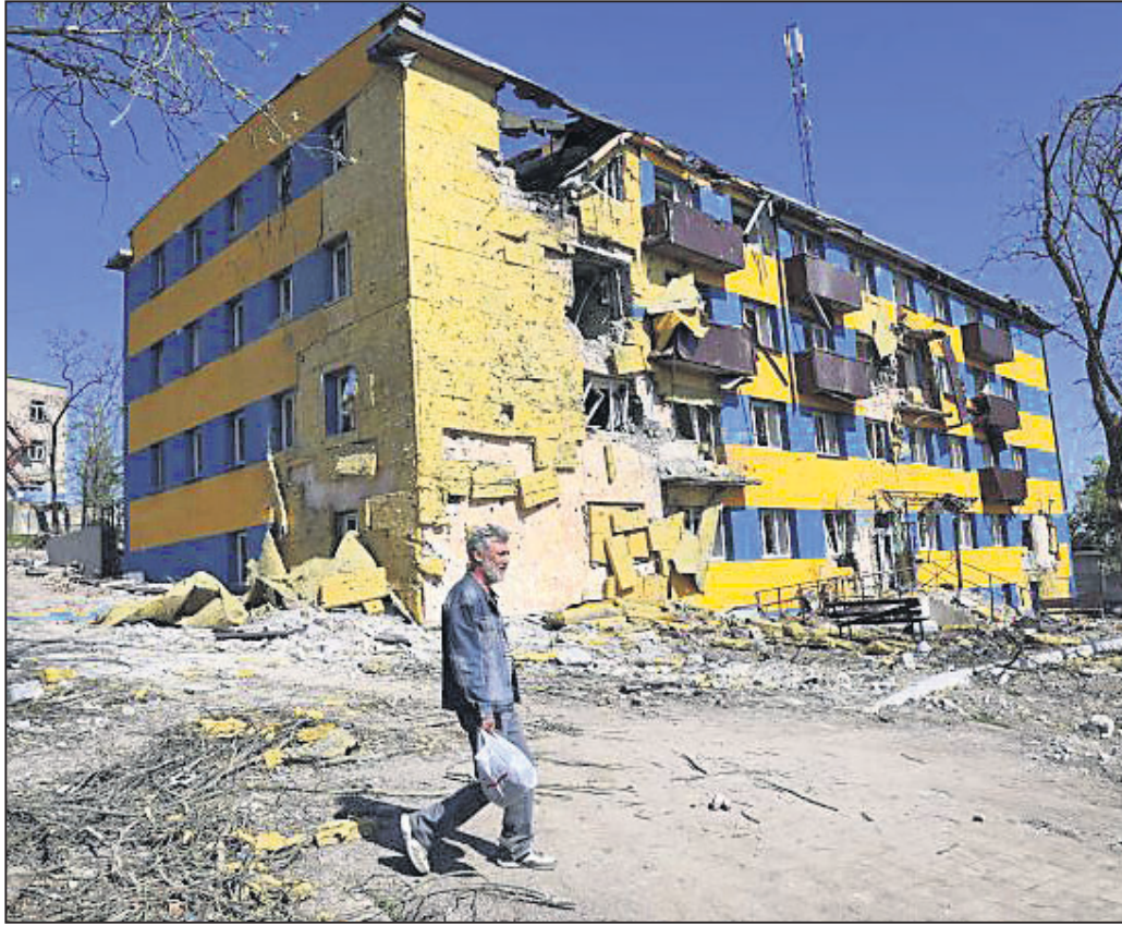
ମାରିଉପୋଲରେ ମୁକ୍ତ ବିଧିସ୍ତ ଏକ ବିଲ୍ଡିଂ ନିକଟ ଦେଇ ଜଣେ ସ୍ଥାନୀୟ ବ୍ୟକ୍ତି ଯାଉଛନ୍ତି।

ଘୋଷ୍ଟ ଅଫ୍ କିଭ୍ ନାମରେ ଜଣା ମୁକ୍ତେନ୍‌ର ଜଣେ ସାହସୀ ଫାଇଟର ପାଇଲଟ୍ ରୁଷିଆ ସହ ମୁକ୍ତେନ୍‌ରେ ନିହତ ହୋଇଛନ୍ତି।