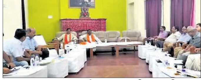
କୋରାପୁଟରେ ଉଚ୍ଚସ୍ତରୀୟ ସମୀକ୍ଷା ବୈଠକରେ କେନ୍ଦ୍ର ମନ୍ତ୍ରୀ ବିଶ୍ୱେଶ୍ୱର ଗୁଡୁ ଜିଲ୍ଲାସ୍ତରୀୟ ଅଧିକାରୀମାନଙ୍କ ସହ ଆଲୋଚନା କରୁଛନ୍ତି ।

କୋରାପୁଟ/କୁନ୍ତୁରା, ୩୦/୪ (ସ.ପ୍ର./ଡି.ଏନ.ଏ.)