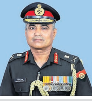
କେନେରାଲ ମନୋଜ ପାଠେ

ମୁକ୍ତେନ୍‌ର ବିଭିନ୍ନ ସହର ଧ୍ରୁବବିଧିସ୍ତ ହେବା ସହ ଆକ୍ରମଣରେ ହଜାର ହଜାର ନିରାହ ପ୍ରାଣ ଯିବା ପରେ ରୁଷିଆ ଖୁବ୍‌ଖୁସୀ ହୋଇ ପୁଟିନ୍ ଘୋଷଣା କରିବାକୁ ଯାଉଛନ୍ତି।