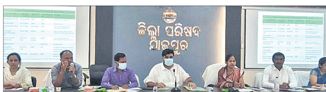
କର୍ମଶାଳାରେ ଜିଲ୍ଲାପାଳଙ୍କ ସମେତ ଅନ୍ୟମାନେ ଉପସ୍ଥିତ।