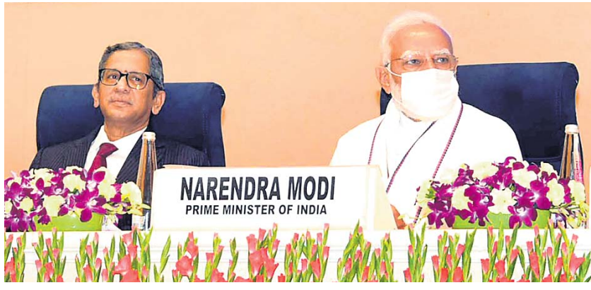
ସିଜେଆଇ ଏନ୍.ଭି. ରମନାଙ୍କ ସହ ପ୍ରଧାନମନ୍ତ୍ରୀ ନରେନ୍ଦ୍ର ମୋଦି।

ଭାରତରେ ପ୍ରତି ୧୦ ଲକ୍ଷ ଜନସଂଖ୍ୟାରେ ମାତ୍ର ୨୦ ଜଣ ବିଚାରପତି ରହିଛନ୍ତି, ଯାହାକି ଅତ୍ୟନ୍ତ କମ୍। ହାଇକୋର୍ଟରୁଟିକର ମଞ୍ଜୁରାପ୍ରାପ୍ତ ବିଚାରପତି ସଂଖ୍ୟା ୧,୧୦୪ ହୋଇଥିବାବେଳେ ସେଥିରୁ ୩୮୮ ପଦବୀ ଖାଲି ପଡ଼ିଛି। ଅଧିକ ବିଚାରପତି ପଦବୀ ସୃଷ୍ଟି ସହ ସେଗୁଡ଼ିକୁ ପୂରଣ କରିବା ଉପରେ ଭାରତର ପ୍ରଧାନ ବିଚାରପତି (ସିଜେଆଇ) ଏନ୍.ଭି. ରମନା ଗୁରୁତ୍ୱ ଦେଇଛନ୍ତି। ବିଚାରପତି-ଜନସଂଖ୍ୟା ଅନୁପାତରେ ବୃଦ୍ଧି ପାଇଁ ସେ ହାଇକୋର୍ଟ ବିଚାରପତିମାନଙ୍କୁ ପରାମର୍ଶ ଦେଇଛନ୍ତି। ନୂଆଦିଲ୍ଲୀ ବିଜ୍ଞାନ ଭବନରେ ଶନିବାର ମୁଖ୍ୟମନ୍ତ୍ରୀ ଓ ହାଇକୋର୍ଟ ମୁଖ୍ୟ ବିଚାରପତିମାନଙ୍କ ମିଳିତ ସମ୍ମିଳନୀକୁ ଉଦ୍‌ବୋଧନ ଦେଇ ସିଜେଆଇ କହିଥିଲେ, ରାଷ୍ଟ୍ରର ୩ ଅଙ୍ଗ ବ୍ୟବସ୍ଥାପକ, କାର୍ଯ୍ୟପାଳିକା ଏବଂ ନ୍ୟାୟପାଳିକାକୁ ସମ୍ବିଧାନ ଅଲଗା ଅଲଗା କ୍ଷମତା ପ୍ରଦାନ କରିଛି। ଏହି ଅଙ୍ଗଗୁଡ଼ିକ ପରସ୍ପର ସହ ସମନ୍ୱୟ ରକ୍ଷାକରି କାର୍ଯ୍ୟ କଲେ ଗଣତନ୍ତ୍ର ସୁରୁତ୍ୱ ହୋଇଥାଏ। ତେବେ କର୍ତ୍ତବ୍ୟ ସମ୍ପାଦନ ବେଳେ 'ଲକ୍ଷ୍ମଣରେଖା'କୁ ସମସ୍ତେ ଧ୍ୟାନରେ ରଖିବା ଉଚିତ ବୋଲି ଜଷ୍ଟିସ୍ ରମନା କହିଛନ୍ତି। ନ୍ୟାୟପାଳିକାର ଯୋଗ୍ୟତା ୧୬ ପୃଷ୍ଠା-୧