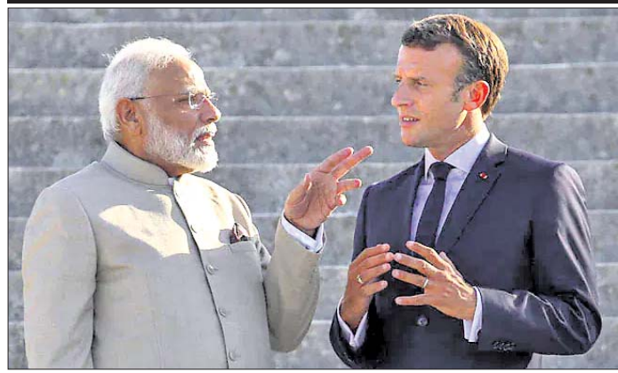
ପ୍ରଧାନମନ୍ତ୍ରୀ ନରେନ୍ଦ୍ର ମୋଦି ଓ ପ୍ରାନ୍ତ ରାଷ୍ଟ୍ରପତି ଏମାନୁଏଲ୍ ମାକ୍ରନ୍ ।

ଭାରତର ଘରୋଇ କମ୍ପାନୀ ଲାଭେନ ଆଣ୍ଡ ଗ୍ରୁପ୍ ଏବଂ ରାଷ୍ଟ୍ରାୟତ୍ତ କମ୍ପାନୀ ମାକ୍ରାଣ୍ଡ ଡିଭିଜନ୍ ତରଫରୁ ଆରୁଏପି ଲକ୍ଷ୍ମୀ ନିର୍ଦ୍ଧାରିତ ପ୍ରାନ୍ତ ରାଷ୍ଟ୍ରପତି ଏମାନୁଏଲ୍ ମାକ୍ରନ୍ଙ୍କୁ ଭେଟିବା କାର୍ଯ୍ୟକ୍ରମ ଥିବାବେଳେ ଏହା ପୂର୍ବରୁ ପ୍ରାନ୍ତ କମିଶନାରୀ ବୁଡ଼ିରୁ ଓହରିଯିବା ଏକ ଶକ୍ତ ଝର୍କା ହୋଇଛି। ଗତବର୍ଷ ଜୁନରେ ପି-୭୫ଆଇ ପ୍ରକଳ୍ପକୁ ପ୍ରତିରକ୍ଷା ମନ୍ତ୍ରାଳୟ ମଞ୍ଜୁରୀ ପ୍ରଦାନ କରିବା ସହ ଏହି କାର୍ଯ୍ୟରେ