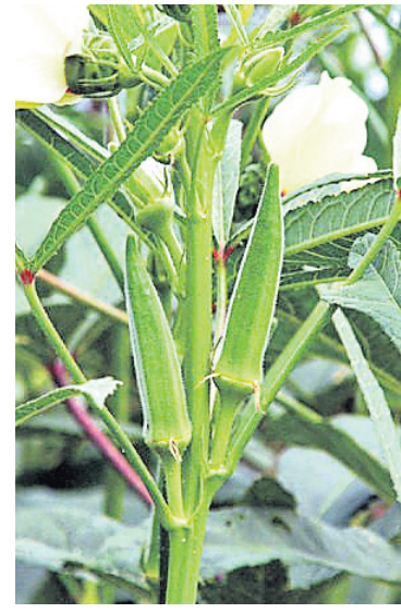
କମିପାଲଆଏ ଓ ଫଳ ବୁଡ଼ା ହୋଇପାଲଆଏ । ଭେଟି ଗଛ ଥଣ୍ଡା ଲାଗି ଛୋଟ ହୋଇଥାଏ ଓ ଫଳ ମଧ୍ୟ ଛୋଟ ହୋଇଥାଏ ।

ଅଧିକ ଅମଳକ୍ଷମ ଭେଟି ପାଇଁ ଭଲ କିସମ ଚୟନ କରନ୍ତୁ । ସେଗୁଡ଼ିକ ମଧ୍ୟରେ ରହିଛି- ଆକା ଅନାମିକା, ଆକା ଅଭୟ, ରକ୍ତକ ଗୌରବ, ପୁଷା-ଏ-୪ । ଭେଟି ଗଛ ମଧ୍ୟରେ ଦୂରତା ୬୦ ସେ.ମି. x ୩୦ ସେ.ମି. ରହିବା ଦରକାର । ହେକ୍ଟର ପିଛା ୨୦ ଗାଡ଼ି ଭଲ ଶହା ଗୋବର ଖତ ସହିତ ୮୦ କି.ଗ୍ରା. ଯବକ୍ଷାରଜାନ, ୪୦ କି.ଗ୍ରା. ଫସଫରସ୍ ଓ ୪୦ କି.ଗ୍ରା. ପଟାସ୍ ସାର ପ୍ରୟୋଗ କରନ୍ତୁ । ଭେଟି ଗାଧ ପାଇଁ ଜମି ପ୍ରସ୍ତୁତ ସମୟରେ ଅନୁମୋଦିତ ଯବକ୍ଷାରଜାନ ସାରର ଅବଶ୍ୟକ ଏବଂ ସମସ୍ତ ଫସଫରସ୍ ଏବଂ ପଟାସ୍ ସାର ମୂଳସାର ହିସାବରେ ସବୁତକ ଖତ ସହିତ ପ୍ରୟୋଗ କରନ୍ତୁ । ବିହନ ଲଗାଇବାର ୩ ସପ୍ତାହ ପରେ କୋଡ଼ାଖୁଆ କରି ବଳକା ଅବଶ୍ୟକ ଯବକ୍ଷାରଜାନ ସାର ପ୍ରୟୋଗ କରନ୍ତୁ । ପ୍ରତି ୫-୬ ଦିନ ବ୍ୟବଧାନରେ ଭେଟି କିଆରିରେ ମାଟିର ବତର ଦେଖି ଜଳସେଚନ କରନ୍ତୁ । ପ୍ରତି ୨ ଦିନରେ ଥରେ ଫଳ ଚୋଳିବା ଉଚିତ । ନଚେତ୍ ଗଛର ବୃଦ୍ଧି ଓ ଫଳ ଧାରଣ ଶକ୍ତି ଓ ଫଳ ମଧ୍ୟ ଛୋଟ ହୋଇଥାଏ ।