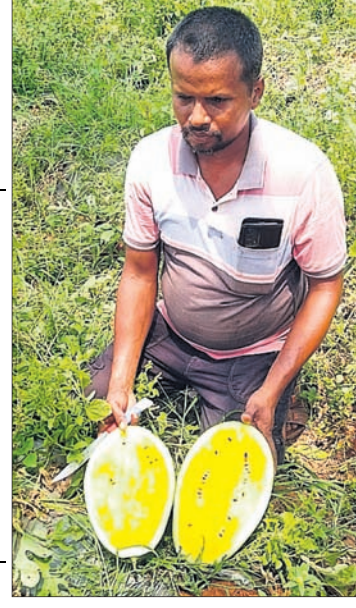
ଛାଡ଼ି ଘରକୁ ଫେରି ଆସିଲି । ଥରେ ଭାବିଲି ଯେ, ଯଦି ମୁଁ ଚାଷକରେ ତେବେ ସେଥିରୁ ମଧ୍ୟ କିଛି ରୋଜଗାର କରିହେବ । ଚଳିତ ବର୍ଷ ନିଜର ୬ ଏକର ଜମିରେ ହଳଦିଆ ସ୍ୱାଦିଷ୍ଟ ତରତୁଳ ଚାଷ କରାଛି । ଚାଷ ପାଇଁ ପାଣିର ଏକାନ୍ତ ଆବଶ୍ୟକ । ତେଣୁ