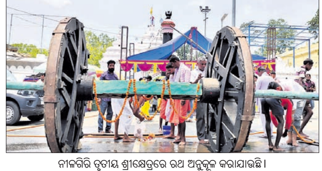
ନୀଳଗିରି ତୃତୀୟା ଶ୍ରୀକ୍ଷେତ୍ରରେ ରଥ ଅନୁକୂଳ କରାଯାଇଛି ।