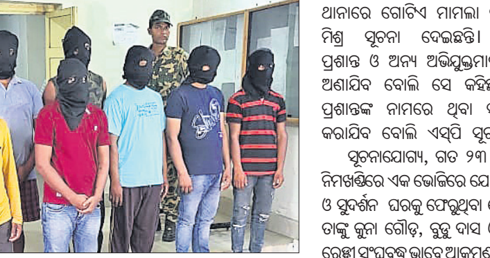
ଗିରଫ ଅଭିଯୁକ୍ତ ।