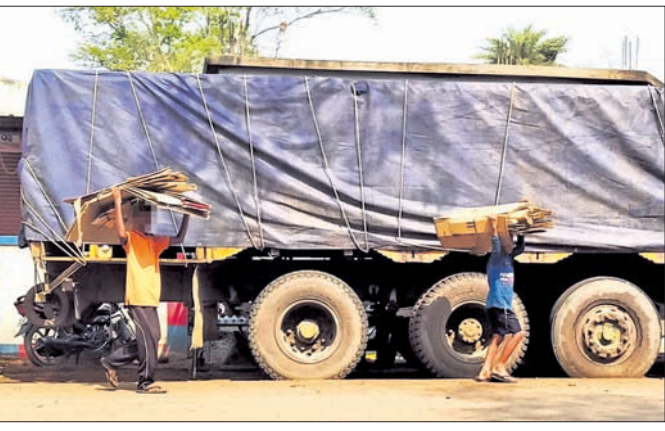
ବୁଦ୍ଧ ନାବାଳକ ମୁଣ୍ଡରେ କାଗଜ ପଟି ବୋହିକି ନେଉଛନ୍ତି ।

ଯେଉଁ ବୟସରେ ସିଲଟ ଖିତିର ଆବଶ୍ୟକତା ସେହି ବୟସରେ ନାବାଳକମାନେ କାଗଜ ପଟି ସାଉଁଟି ଯେତ ପୋଷୁଥିବା ଜଣାଯାଇଛି । ଶ୍ରେଣୀବଦ୍ଧ ହେଉ ଯେତ ସିଲଟ ବିଦ୍ୟାଳୟ ପାଠର ଆବଶ୍ୟକତା ରହିଥିବା ବେଳେ ଜୁନି ଜୁନି ହାତରେ ଅଲିଆ ଆବର୍ଜନା ମଧ୍ୟରୁ ପଟି ସାଉଁଟିବା ଏମାନଙ୍କର ନିତ୍ୟନିଆ କାମ ପାଳିତ ଗଲାଣି । ସୂଚନା ଅନୁସାରେ ଚଞ୍ଚୁଆ ସଦର ମହକୁମାରେ ଏଭଳି ଅବ୍ୟବସ୍ଥା ଦେଖିବାକୁ ମିଳିଛି । ସକାଳ ଭୋରୁ କାଗଜ ମଧ୍ୟରେ ଦୋକାନ ଗୁଡ଼ିକରୁ ବାହାରୁ ଥିବା ଅନାବଶ୍ୟକ ଆବର୍ଜନା