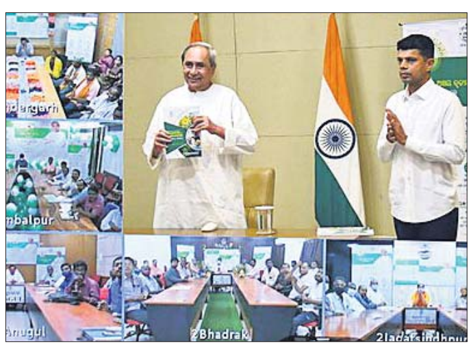
୮ ନୂତନ କାର୍ଯ୍ୟକ୍ରମ ଶୁଭାରମ୍ଭ ଏବଂ ଚାଷୀଙ୍କୁ କାଳିଆ ସହାୟତା ପ୍ରଦାନ ଅବସରରେ ଭିଜିଓ କନ୍ଫରେନ୍ସରେ ଉପସ୍ଥିତ ମୁଖ୍ୟମନ୍ତ୍ରୀ ନବୀନ ପଟ୍ଟନାୟକ ଓ ୫-ଟି ସଚିବ ଭି.କେ. ପାଣ୍ଡିଆନ୍ ।

ଯୋଧପୁର/ଯୋଧପୁର, ୩୫ (ପି.ଟି.): ରାଜସ୍ଥାନ ମୁଖ୍ୟମନ୍ତ୍ରୀ ଅଶୋକ ଗେହଲଟଙ୍କ ନିଜ ସହର ଯୋଧପୁରରେ ଲଢ଼ ପାଳନ ପୂର୍ବରୁ ମଙ୍ଗଳବାର ସକାଳେ ସାମ୍ପ୍ରଦାୟିକ ଦଙ୍ଗା ସୃଷ୍ଟି ହୋଇଛି। ସୋମବାର ରାତିରେ ଜାଲୋରି ଗେଟ୍ ଅଞ୍ଚଳରେ ଲଢ଼ପାଳୀୟ ପତାକା ଲଗାଯିବାକୁ ନେଇ ବିବାଦରୁ ଦୁଇ ସମ୍ପ୍ରଦାୟ ମଧ୍ୟରେ ଉତ୍ତେଜନା ଦେଖାଦେଇଥିଲା। ଉଭୟ ପକ୍ଷ ପରସ୍ପର ଉପରକୁ ଦେଲାମାତ୍ କରିବା ସହ ବିଭିନ୍ନ ସ୍ଥାନରେ ହିଂସାକାଣ୍ଡ ଭିଆଇଥିଲା। ସ୍ଥିତି ନିୟନ୍ତ୍ରଣ କରିବାକୁ ଯାଇ ପୋଲିସ୍ କ୍ଵଳ ପ୍ରୟୋଗ କରିବାକୁ ପଡ଼ିଥିଲା। ମଙ୍ଗଳବାର ସକାଳେ ପୁଣିଥରେ ଉଭୟ ସମ୍ପ୍ରଦାୟ ମଧ୍ୟରେ ସଂଘର୍ଷ ହୋଇଥିଲା। ଉତ୍ତର ମନ୍ଦିର, ନାଗୋରି ଗେଟ୍, ଖଣ୍ଡା ଫଳ୍ପା, ପ୍ରତାପ ନଗର, ଦେବ ନଗର, ସୁର ସାଗର ଏବଂ ସର୍ଦାରପୁରା ଥାନା ଅଞ୍ଚଳରେ ବୁଧବାର ମଧ୍ୟରାତ୍ର ପର୍ଯ୍ୟନ୍ତ କର୍ମ୍ମ ଚାରି କରାଯାଇଛି। ଗୁରୁତ୍ଵ ରୋକିବା ଲାଗି ଯୋଧପୁରରେ ଇଣ୍ଡିଆନ ସେବାକୁ ବନ୍ଦ କରିଦିଆଯାଇଥିବାବେଳେ ପୋଲିସ୍ ସୁରକ୍ଷା ମଧ୍ୟରେ ନମାଜ ପାଠ କରାଯାଇଛି। ମୁଖ୍ୟମନ୍ତ୍ରୀ ଗେହଲଟ ଏକାକି ଘଟଣାକୁ ଦୂର୍ଭାଗ୍ୟଜନକ ବୋଲି କହିବା ସହିତ ଶାନ୍ତି ଓ ସହଭାବ ବଜାୟ ରଖିବା ଲାଗି ଜନସାଧାରଣଙ୍କୁ ନିବେଦନ କରିଛନ୍ତି। ସେ ଏକ ଉଚ୍ଚପ୍ରସାରୀ ବୈଠକରେ ସ୍ଥିତି ସମାପ୍ତ କରିବା ସହ ହେଲିକପ୍ଟର ଯୋଗେ ବରିଷ୍ଠ ଅଧିକାରୀମାନଙ୍କୁ ଯୋଧପୁର ପଠାଇଛନ୍ତି। ଯୋଧପୁରରେ ପୁଷ୍ପା-୪