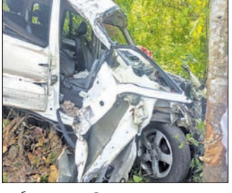
ଦୁର୍ଘଟଣାଗ୍ରସ୍ତ ଗାଡ଼ି ।

ନୟାଗଡ଼ ଜିଲା ନୂଆଗାଁ ଥାନା ଅଧୀନ ଖୋର୍ଦ୍ଧା-ବଲାଙ୍ଗୀର ୫୭ନଂ. ଜାତୀୟ ରାଜପଥରେ ମଙ୍ଗଳବାର ୨ଟି ସଡ଼କ ଦୁର୍ଘଟଣା ଘଟିଛି । ଏଥିରେ ୬ଜଣ ଆହତ ହୋଇଛନ୍ତି । ସେମାନଙ୍କ ଅବସ୍ଥା ଗୁରୁତର ରହିଛି ବୋଲି ଡାକ୍ତରଖାନା କହିଛନ୍ତି । ସୂଚନା ଅନୁଯାୟୀ, ଅପରାହ୍ଣ ପ୍ରାୟ ୧୨ଟାରେ ନୂଆଗାଁ ପଲ୍ଲୀ ନୟାଗଡ଼ ଅତିସଖେ ଯାଉଥିବା ଏକ ଗାଡ଼ି (ନଂ.୭୫୨୫ କେ ୦୫୧୪) ଭାରସାମ୍ୟ ହରାଇ କୃଷ୍ଣଚନ୍ଦ୍ରପୁର ନିକଟ ବ୍ୟାରିକେଡକୁ ଭାଙ୍ଗି ବିପୁଲ୍ ଖୁଣ୍ଟରେ ପଡି ହୋଇଯାଇଥିଲା । ଏହି ଦୁର୍ଘଟଣାରେ ୨ ଜଣ ଆହତ ହୋଇଛନ୍ତି । ନୂଆଗାଁ ଅତିସମାନଙ୍କୁ ଉଦ୍ଧାର କରି ପୋଲିସ ଆହତମାନଙ୍କୁ ଉଦ୍ଧାର କରି ନୟାଗଡ଼ ପୁଖ୍ୟ ଚିକିତ୍ସାଳୟରେ ଭର୍ତ୍ତି କରିଛନ୍ତି । ସେହିଭଳି ଅପରାହ୍ଣ ୩ଟାରେ