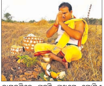
ଗୋଷ୍ଠୀମାନେ ପହଞ୍ଚି ପ୍ରଥମେ ଗୋଟିଏ ଗୋଷ୍ଠୀରେ ମାଟି ଖୋଳି ଧାନ, ପଇସା ଓ କଉଡିକୁ ପୋତିଥିଲେ । ପରେ ସେହି ତୃତୀୟା ପାଳନ କରିଛନ୍ତି । ଅବଶିଷ୍ଟ ଗୋଷ୍ଠୀମାନେ ରହିଥିବା ଗୋଷ୍ଠୀମାନେ ଅକ୍ଷୟ ତୃତୀୟା ପାଳନ କରିଛନ୍ତି । ଏନ୍‌ଏସ୍‌ ଏବଂ ବୁଦ୍ଧ ୩୭ ପଞ୍ଚାୟତରେ ହେଉଥିବା ଆଜିର ଅକ୍ଷୟ ତୃତୀୟା ପାଳନ ଉତ୍ସାହକୁ ପ୍ରମାଣ ମିଳିଛି । ଗୋଷ୍ଠୀମାନେ ସକାଳୁ ସ୍ନାନ ସାରି ଘରେ ଥିବା ଧାନ ବିହନ ସହିତ କୋଦାନ, ଗୋଣି, କଉଡି, ପଇସା, ଗୋଗା ଗୁଆ, ଭୋଗ, ଧୂପ ଧରି

ନୟାଗଡ଼ ଜିଲା ରଣପୁର ଏନ୍‌ଏସ୍‌ ଓ ବୁଦ୍ଧ ୩୭ ପଞ୍ଚାୟତରେ ମଙ୍ଗଳବାର ଗୋଷ୍ଠୀମାନେ ଅକ୍ଷୟ ତୃତୀୟା ପାଳନ କରିଛନ୍ତି । ହେଲେ ପୂର୍ବର ଉତ୍ସାହ ଆଉ ଦେଖିବାକୁ ମିଳିନି । କୋଭିଡ୍ କଟକଣା ଯୋଗୁ ଏହି ପରମ୍ପରା ପାଳନ ଉପରେ କଟକଣା ଲାଗୁ କରାଯାଇଥିଲା । ହେଲେ ଚଳିତ ବର୍ଷ କଟକଣା ହଟିଥିଲେ ମଧ୍ୟ ମାତ୍ର ୬୦ ପ୍ରତିଶତ ଗୋଷ୍ଠୀମାନେ ଅକ୍ଷୟ ତୃତୀୟା ପାଳନ କରିଛନ୍ତି । ଅବଶିଷ୍ଟ ଗୋଷ୍ଠୀମାନେ ରହିଥିବା ଗୋଷ୍ଠୀମାନେ ଅକ୍ଷୟ ତୃତୀୟା ପାଳନ କରିଛନ୍ତି । ଗୋଷ୍ଠୀମାନେ ଗୋଷ୍ଠୀ ପ୍ରତି ବିନକୁଳ ଦିନ ବିପୁଷ୍ପ ହେଉଥିବା ଆଜିର ଅକ୍ଷୟ ତୃତୀୟା ପାଳନ ଉତ୍ସାହକୁ ପ୍ରମାଣ ମିଳିଛି । ଗୋଷ୍ଠୀମାନେ ସକାଳୁ ସ୍ନାନ ସାରି ଘରେ ଥିବା ଧାନ ବିହନ ସହିତ କୋଦାନ, ଗୋଣି, କଉଡି, ପଇସା, ଗୋଗା ଗୁଆ, ଭୋଗ, ଧୂପ ଧରି