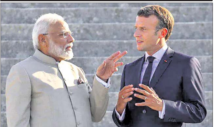
ପ୍ରଧାନମନ୍ତ୍ରୀ ନରେନ୍ଦ୍ର ମୋଦି ଓ ପ୍ରାୟ ରାଷ୍ଟ୍ରପତି ଏମାନୁଏଲ୍ ମାକ୍ରନ୍ ।

ଭାରତର ଘରୋଇ କମ୍ପାନୀ ଲାଭେନ ଆଣ୍ଡ ଗ୍ରୁପ୍ ଏବଂ ରାଷ୍ଟ୍ରପତି କମ୍ପାନୀ ମାକ୍ରନ୍ ଓ ତତ୍ତ୍ୱ ଲିମିଟେଡ୍ ଆର୍କଏସ୍ ଲକ୍ଷ୍ମୀ ନିର୍ଦ୍ଧାରିତ ପ୍ରାୟ ରାଷ୍ଟ୍ରପତି ଏମାନୁଏଲ୍ ମାକ୍ରନ୍ଙ୍କୁ ଭେଟିବା କାର୍ଯ୍ୟକ୍ରମ ଥିବାବେଳେ ଏହା ପୂର୍ବରୁ ପ୍ରାୟ କମିଶନାରି ଓହରିଯିବା ଏକ ଶକ୍ତ ଝର୍କା ହୋଇଛି । ଗତବର୍ଷ ଜୁନରେ ପି-୭୫ଆଇ ପ୍ରକଳ୍ପ ପ୍ରତିରକ୍ଷା ମନ୍ତ୍ରାଳୟ ମାଷ୍ଟରୀ ପ୍ରଦାନ କରିବା ସହ ଏହି କାର୍ଯ୍ୟରେ