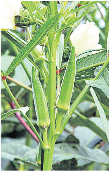
କମିଯାଇଥାଏ ଓ ଫଳ ବୃଦ୍ଧି ହୋଇଯାଇଥାଏ । ଭେଟି ଗଛ ଥଣ୍ଡା ଲାଗି ଛୋଟ ହୋଇଥାଏ ଓ ଫଳ ମଧ୍ୟ ଛୋଟ ହୋଇଥାଏ ।

ଅଧିକ ଅମଳକ୍ଷମ ଭେଟି ପାଇଁ ଭଲ କିସମ ଚୟନ କରନ୍ତୁ । ସେଗୁଡ଼ିକ ମଧ୍ୟରେ ରହିଛି- ଆକା ଅନାମିକା, ଆକା ଅଭୟ, ରକ୍ତକ ଗୌରବ, ପୁଷା-ଏ-୪ । ଭେଟି ଗଛ ମଧ୍ୟରେ ଦୂରତା ୬୦ ସେ.ମି. x ୩୦ ସେ.ମି. ରହିବା ଦରକାର । ହେକ୍ଟର ପିଛା ୨୦ ଗାଡ଼ି ଭଲ ଶୁଖା ଗୋବର ଖତ ସହିତ ୮୦ କି.ଗ୍ରା. ଯବକ୍ଷାରଜାନ, ୪୦ କି.ଗ୍ରା. ଫସଫରସ୍ ଓ ୪୦ କି.ଗ୍ରା. ପଟାସ୍ ସାର ପ୍ରୟୋଗ କରନ୍ତୁ । ଭେଟି ଗାଧ ପାଇଁ ଜମି ପ୍ରସ୍ତୁତ ସମୟରେ ଅନୁମୋଦିତ ଯବକ୍ଷାରଜାନ ସାରର ଅବଶ୍ୟକ ଏବଂ ସମସ୍ତ ଫସଫରସ୍ ଏବଂ ପଟାସ୍ ସାର ମୂଳସାର ହିସାବରେ ସବୁତକ ଖତ ସହିତ ପ୍ରୟୋଗ କରନ୍ତୁ । ବିହନ ଲଗାଇବାର ୩ ସପ୍ତାହ ପରେ କୋଡ଼ାଖୁଆ କରି ବଳକା ଅବଶ୍ୟକ ଯବକ୍ଷାରଜାନ ସାର ପ୍ରୟୋଗ କରନ୍ତୁ । ପ୍ରତି ୫-୬ ଦିନ ବ୍ୟବଧାନରେ ଭେଟି କିଆରିରେ ମାଟିର ବତର ଦେଖି ଜଳସେଚନ କରନ୍ତୁ । ପ୍ରତି ୨ ଦିନରେ ଥରେ ଫଳ ଚୋଳିବା ଉଚିତ । ନଚେତ୍ ଗଛର ବୃଦ୍ଧି ଓ ଫଳ ଧାରଣ ଶକ୍ତି ଓ ଫଳ ମଧ୍ୟ ଛୋଟ ହୋଇଥାଏ ।