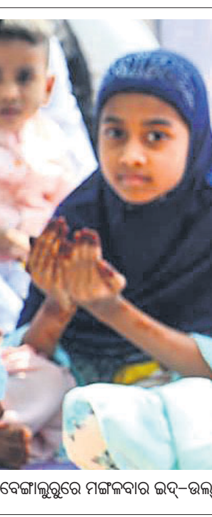
ବେଙ୍ଗାଳୁରୁରେ ମଙ୍ଗଳବାର ଇଦ୍-ଉଲ୍-ଫିତର ପାଳନ ଅବସରରେ ପିଲାମାନେ ନମାଜ ପାଠ କରୁଛନ୍ତି ।