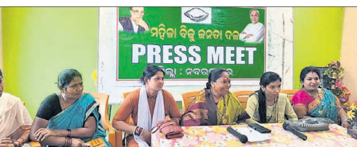
ସମ୍ମିଳନୀରେ ଉପସ୍ଥିତ ଜିଲ୍ଲା ମହିଳା ବିଜେଡିର ସଦସ୍ୟମାନେ।