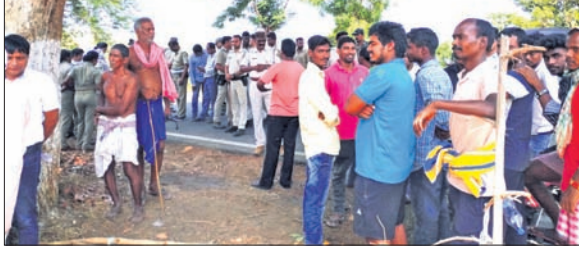
ବିରୋଧ କରୁଥିବା ଗ୍ରାମବାସୀଙ୍କ ପାଇଁ ପୋଲିସ୍ ମୁହଁପତା ପକାଇଥିଲା।

ବିଦ୍ୟୁତ୍ ତାର ଯାଇଥିବାବେଳେ ଯେତେବେଳେ ତାର ଫସଲ ପାଇଁ ୧ ଡିସିମିଟର କ୍ଷତିପୂରଣ ଦିଆଯାଇଥିଲା। ତେବେ ବେସରକାରୀ ଜମିରେ ଲାଗିଥିବା ଶାଗୁଆନ, ଆମ, ମହୁଳା, ପଶାପ ଆଦି ଗଛ କ୍ଷତିପୂରଣ କରାଯାଇ ନାହିଁ।