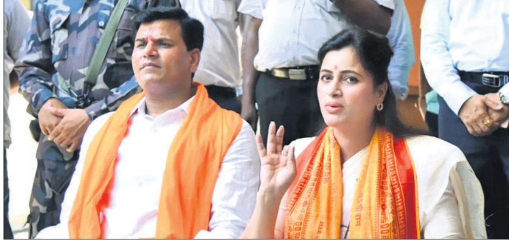
ଏମ୍ପି ନବନୀତ (ତାହାଣ) ଏବଂ ତାଙ୍କ ବିଧାୟକ ସ୍ୱାମୀ ରବି ରାଣା।

ରାଜନୈତିକ ଦଳଗୁଡ଼ିକ ମଧ୍ୟ ଦଳ ମଧ୍ୟରେ ଅପରାଧ ପୁଞ୍ଜିରୁ ଥିବା ପ୍ରାର୍ଥୀମାନଙ୍କ ବିବରଣୀ ନିର୍ବାଚନ ପ୍ରଚାର ସମୟରେ ଖବରକାଗଜ ଓ ଟେଲିଭିଜନ୍ ମାଧ୍ୟମରେ ଜନସାଧାରଣଙ୍କୁ ଅବଗତ କରାଇବା ପାଇଁ ନିର୍ବାଚନ ଆୟୋଗଙ୍କ ନିର୍ଦ୍ଦେଶ ଥିବା ପୁଞ୍ଜି ନିର୍ବାଚନ ଅଧିକାରୀ ସୂଚନା ଦେଇଛନ୍ତି।