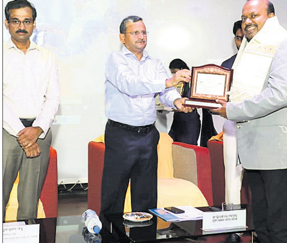
ରାଜ୍ୟ ସରକାରଙ୍କ ପକ୍ଷରୁ ସମ୍ମାନିତ କରାଯାଇଛି।

ରାଜ୍ୟ ସରକାରଙ୍କ ମହ୍ୟ ଓ ପଶୁ ସମ୍ପଦ ବିକାଶ ବିଭାଗ ପକ୍ଷରୁ ଗତ ୩୦ ତାରିଖରେ ଭୁବନେଶ୍ୱରରେ ଆୟୋଜିତ ବିଶ୍ୱ ପ୍ରାଣୀଚିକିତ୍ସା ଦିବସ କାର୍ଯ୍ୟକ୍ରମରେ ଅନୁଗୋଳ ଜିଲ୍ଲାରୁ ରାଜ୍ୟର ପ୍ରଥମ ପୁରସ୍କାର ମିଳିଛି। ପଶୁ ସମ୍ପଦ ବିକାଶ ଓ ଚିକିତ୍ସା କ୍ଷେତ୍ରରେ ରାଜ୍ୟ ସରକାରଙ୍କ ଯୋଜନାକୁ ଜିଲ୍ଲାରେ କାର୍ଯ୍ୟକାରୀ କରିବା କ୍ଷେତ୍ରରେ ରାଜ୍ୟ ପାଇଁ ଉଲ୍ଲେଖନୀୟ କାର୍ଯ୍ୟ ପାଇଁ ଅନୁଗୋଳ ଜିଲ୍ଲାରୁ ଏହି ପୁରସ୍କାର ପ୍ରଦାନ କରାଯାଇଛି।