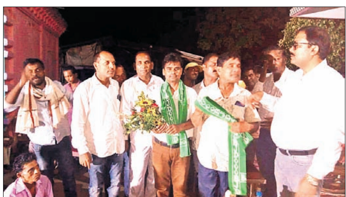
ଦଳରେ ନୂଆକରି ଯୋଗଦେଇଥିବା କର୍ମୀଙ୍କୁ ସ୍ଵାଗତ କରାଯାଉଛି।