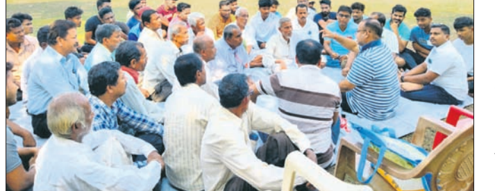
ପ୍ରସ୍ତୁତି ବୈଠକରେ ରଜ ମହୋତ୍ସବ ପାଳନ ସମ୍ପର୍କରେ ଆଲୋଚନା କରାଯାଇଛି ।

ସାମନାଗର, ୪।୫ (ଡି.ଏନ୍.ଏ.): ଭଦ୍ରକ ଜିଲ୍ଲା ସାମନାଗର ଏନ୍.ଏସି ଥାନା ଆବର୍ଗ ବିଦ୍ୟାଳୟ ଠାରେ କୁଳ ପ୍ରସାସ ସାଧୁ ବିଦ୍ୟାଳୟ ଉପରେ ପ୍ରତିଷ୍ଠା କରାଯାଇଛି । ଏଥିରେ ମୁଖ୍ୟ ଅତିଥି ଭାବେ ଭଦ୍ରକ ଏମ୍.ପି.ମି. ମଞ୍ଜୁଳା ମଞ୍ଜୁଳା ଯୋଗ ଦେଇଥିଲେ । ଏଥିରେ ମୁଖ୍ୟ ଅତିଥି ଭାବେ ଭଦ୍ରକ ଏମ୍.ପି.ମି. ମଞ୍ଜୁଳା ମଞ୍ଜୁଳା ଯୋଗ ଦେଇଥିଲେ ।