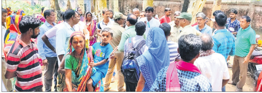
ସ୍ଵାସ୍ଥ୍ୟ ଶିବିରରେ ଉତ୍ତରଜନା।

ବାଲେଶ୍ଵର ଜିଲା ବାଲିଆପାଳ ବ୍ଲକ୍ ତରା ପଞ୍ଚାୟତ କାର୍ଯ୍ୟାଳୟ ପରିସରରେ ସୁବର୍ଣ୍ଣରେଖା ବନ୍ଦର ପ୍ରାଇଭେଟ ଲିମିଟେଡ୍ ଓ ଲାଇଟ୍ ହୁଲ୍ ବାଲେଶ୍ଵର ପକ୍ଷରୁ ମିଳିତ ଭାବେ ରୁଧିରା ମେଗା ସ୍ଵାସ୍ଥ୍ୟ ଶିବିର ଅନୁଷ୍ଠିତ ହୋଇଯାଇଛି।