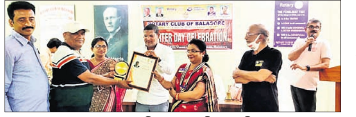
କୁଳ ସଭ୍ୟଙ୍କୁ ଅତିଥିମାନେ ସମର୍ଥନ କରୁଛନ୍ତି ।

ବାଲେଶ୍ଵର ଅଫିସ, ୪।୫ ବାଲେଶ୍ଵର ସହର ଏଡିଏମ୍ ଛକସ୍ଥିତ ପ୍ରକଳ୍ପରେ ୧୪ ସଭ୍ୟଙ୍କୁ ସମର୍ଥନ ଦିଆଯାଇଛି । ରୋଗୀଙ୍କୁ କୁଳ ବାଲେଶ୍ଵର ପ୍ରତିଷ୍ଠା ଦିବସ ମହାସମାବେଶରେ ପାଳିତ ହୋଇଥିଲା । ଆର୍ଥିକ ଖାଲିପାଟଣା ଘଟଣାରେ ରୋଗୀଙ୍କୁ ସମର୍ଥନ ଦିଆଯାଇଛି ।