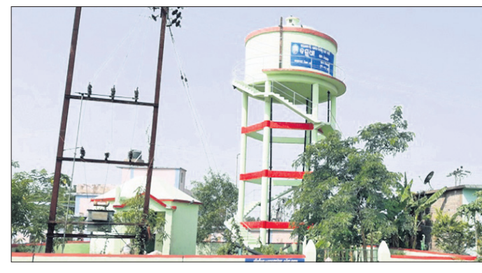
ପ୍ରକଳ୍ପ ନିର୍ମାଣ କାର୍ଯ୍ୟ ସରିବା ପରେ ପରବର୍ତ୍ତୀ ଅବସ୍ଥାରେ ଉଦ୍ଦେଶ୍ୟ ରଖି ଲୋକସେବା କରାଯାଉଥିବା ସମ୍ବନ୍ଧରେ ଉପରୋକ୍ତ ପଦକ୍ଷେପ ଗ୍ରହଣ କରିବାକୁ ନିର୍ଦ୍ଦେଶ ଦିଆଯାଇଛି ।

ଭଦ୍ରକ ଜିଲ୍ଲା ବନ୍ଧୁ କୁଳର ୨୫ ପଞ୍ଚାୟତରେ ବସୁଧା ଯୋଜନାରେ ପାନୀୟ ଜଳ ଯୋଗାଣ ପ୍ରକଳ୍ପ ନିର୍ମାଣ ହୋଇଥିବା ବେଳେ ତାହା ଅସମ୍ପୂର୍ଣ୍ଣ ଥିବା ଯୋଗୁଁ ସାଧାରଣ ଲୋକେ ପାନୀୟ ଜଳ ପାଇବାକୁ ବହୁତ ହେଉଥିବା ଅଭିଯୋଗ ହୋଇଛି । ଗତ ୫ ବର୍ଷ ପୂର୍ବେ ନିର୍ମାଣ କାର୍ଯ୍ୟ ଆରମ୍ଭ ହୋଇଥିବା ସତ୍ତ୍ୱେ ମଧ୍ୟ ପାନୀୟ ଜଳ ଯୋଗାଣ ପ୍ରକଳ୍ପ ନିର୍ମାଣ କାର୍ଯ୍ୟ ସରିବା ପରେ ପରବର୍ତ୍ତୀ ଅବସ୍ଥାରେ ଉଦ୍ଦେଶ୍ୟ ରଖି ଲୋକସେବା କରାଯାଉଥିବା ସମ୍ବନ୍ଧରେ ଉପରୋକ୍ତ ପଦକ୍ଷେପ ଗ୍ରହଣ କରିବାକୁ ନିର୍ଦ୍ଦେଶ ଦିଆଯାଇଛି ।