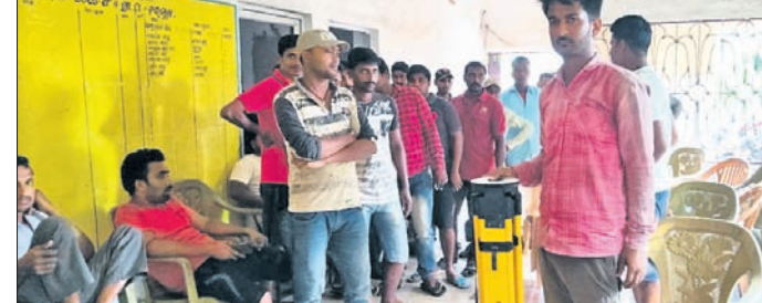
ବାଲିଆପାଳ ପଞ୍ଚାୟତର କାର୍ଯ୍ୟକ୍ରମରେ ଭିତ୍ତି

ବାଲେଶ୍ଵର ଜିଲ୍ଲା ବାଲିଆପାଳ କୁଳର ଦକ୍ଷିଣ ବାଲିଆପାଳର ସମୁଦ୍ର ଉପକୂଳରେ ପ୍ରାୟ ୧୫୦ ପରିବାର ବସବାସ କରୁଥିବା ବେଳେ ସୁରକ୍ଷା ପ୍ରଦାନ କରିବା ପାଇଁ ପ୍ରକଳ୍ପ ଗ୍ରହଣ କରାଯାଇଛି । ଉପକୂଳରେ ବସବାସ କରୁଥିବା ଲୋକମାନଙ୍କୁ ସୁରକ୍ଷା ପ୍ରଦାନ କରିବା ପାଇଁ ପ୍ରକଳ୍ପ ଗ୍ରହଣ କରାଯାଇଛି । ଉପକୂଳରେ ବସବାସ କରୁଥିବା ଲୋକମାନଙ୍କୁ ସୁରକ୍ଷା ପ୍ରଦାନ କରିବା ପାଇଁ ପ୍ରକଳ୍ପ ଗ୍ରହଣ କରାଯାଇଛି ।