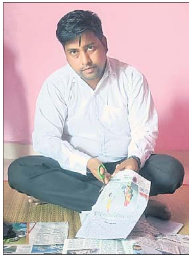
ସଞ୍ଚୟକ କୁମାର ସାହୁଙ୍କ ଦ୍ଵାରା ସଂଗ୍ରହୀତ କାର୍ତ୍ତବ୍ୟ

୯ ବର୍ଷ ହେଲା ସାଇତି ରଖିଛନ୍ତି ୨୫୭୫ କାର୍ତ୍ତବ୍ୟ ୱାଲୁ ରେଡ଼କ୍ରସରେ ରେକର୍ଡ ପାଇଁ ପ୍ରୟାସ