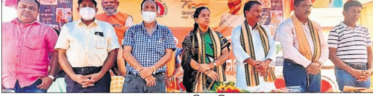
ସ୍ଵାସ୍ଥ୍ୟମେଳାରେ ଉପସ୍ଥିତ ଅଭିଯୋଗୀ।

ସୋର, ୪୫(ଡି.ଏନ୍.ଏ.) ସୋର ମଙ୍ଗଳପୁର ଶ୍ରୀନିବାସ ତ୍ରିତୀ କଲେଜ ପରିସରରେ ମଙ୍ଗଳବାର ରୁକ୍ଷପୁରାଣ ମେଳା ସ୍ଵାସ୍ଥ୍ୟମେଳା ଆୟୋଜିତ ହୋଇଥିଲା।