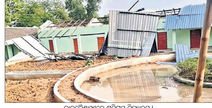
କାଳବୈଶାଖୀରେ ଶକ୍ତିଗ୍ରହ ବିଦ୍ୟାଳୟ ।

କେନ୍ଦ୍ରୀୟ ଜିଲ୍ଲା ଚଞ୍ଚୁଆ କୁଳ ଅର୍ଗତ ନନ୍ଦପୁର ଗ୍ରାମର ମଙ୍ଗଳବାର ଅପରାହ୍ନରେ କାଳବୈଶାଖୀ ଯୋଗୁଁ କଳେଶ୍ଵର ସରକାରୀ ଉଚ୍ଚ ବିଦ୍ୟାଳୟରେ ନିର୍ବାଣୀୟାତ ୫ଟି କାର୍ଯ୍ୟ ଉଦ୍ଦେଶ୍ୟ ରଖି ଲୋକସେବା କରାଯାଉଥିବା ସମ୍ବନ୍ଧରେ ଉପରୋକ୍ତ ପଦକ୍ଷେପ ଗ୍ରହଣ କରିବାକୁ ନିର୍ଦ୍ଦେଶ ଦିଆଯାଇଛି ।