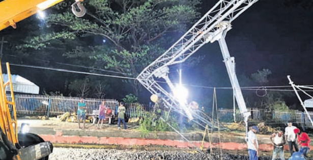
ଗୁମୁଡ଼ା ଷ୍ଟେଶନର ଗଛପତ୍ରି ନଷ୍ଟ ହୋଇଥିବା ଓଭରହେଡ୍ ଲାଇଂଗ୍‌ସ୍‌ରେ।