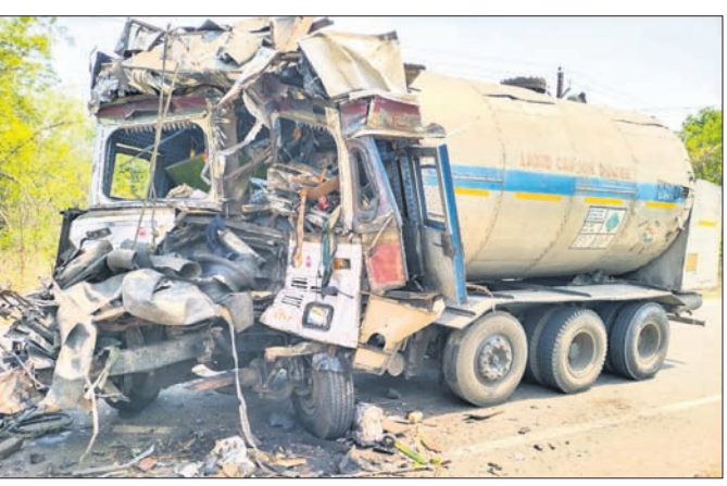
ବୋଲଗଡ଼, ୫୫୫ (ଡି.ଏନ୍.ଏ.)

ବଲାଙ୍ଗୀର-ଖୋର୍ଦ୍ଧା ୫୭ ନମ୍ବର ଜାତୀୟ ରାଜପଥର ବିନୋଦପଡ଼ା ଶୁଣାନ ନିକଟରେ ବୁଧବାର ରାତିରେ ଏକ ଗ୍ୟାସ୍ ବୋହେଇ ଟ୍ୟାଙ୍କର ଚୁକ୍ତିଗାତ୍ରପ୍ର ଘଟଣା ହୋଇଛି। ଏଥିରେ ଥିବା ହେଲ୍ମେଟ୍ ଗୁରୁତାର ଆହତ ହୋଇଛନ୍ତି। ଚିକିତ୍ସା ପାଇଁ ତାଙ୍କୁ ଭୁବନେଶ୍ୱର ଏସ୍‌ସିଏମ୍‌ସି ହସ୍ପିଟାଲରେ ଭର୍ତ୍ତି କରାଯାଇଛି। ଉକ୍ତ ଟ୍ୟାଙ୍କରର ସମ୍ପୂର୍ଣ୍ଣ ଭାଙ୍ଗି ଚୁରମାର ହୋଇଯାଇଛି। ସୂଚନା ମୁତାବକ, ଚୁକ୍ତି କାର୍ବନ ଡାଇଅକ୍ସାଇଡ୍ ଶିବ ଶଙ୍କର ସେଠାଙ୍କ ଭଉଣୀଙ୍କୁ ପ୍ରଦାପ ବିବାହ କରିଥିଲେ। ମାତ୍ର ସେ କିଛି କାମ ଧରା କରୁ ନ ଥିବାରୁ ପରିବାର ଚଳାଇ ପାରୁ ନ ଥିଲେ। ତେଣୁ ସମ୍ପୂର୍ଣ୍ଣ ମଧ୍ୟରେ ସ୍ତରତା ହେଉଥିଲା। ଗତ ମଙ୍ଗଳବାର ଖଞ୍ଜା(ସମ୍ପର୍କ) ବ୍ୟବସ୍ଥାର ଏକ ସ୍ୱତନ୍ତ୍ରତା ଠାକୁରଙ୍କ ଚାପ ଖେଳ ଅନୁଷ୍ଠିତ ହେଉଛି। ସମ୍ପର୍କରେ ପାଠ ପଢିବାରରେ ଶ୍ରଦ୍ଧାଳୁଙ୍କ ପାଳନ କରାଯାଇଛି। ଅକ୍ଷୟତୃତୀୟାରୁ ଆରମ୍ଭ ହୋଇଛି ଏହି ଯାତ୍ରା। ସାହିପାଳି, ଘରୁଆ ପାଳି ଓ ଆନାପାଳି ଭାବେ ଏହି ଯାତ୍ରାକୁ ୨୯ଦିନ ଧରି ପାଳନ କରାଯିବ। ହେଲେ ଆନା ପାଳି ଶ୍ରଦ୍ଧାଳୁଙ୍କ ମନମୋହିବ ବୋଲି ମନ୍ଦିର କମିଟି ପକ୍ଷରୁ କୁହାଯାଇଛି। ସୂଚନାଥାଉ ଛ, ବେଗୁନିଆ ଗ୍ରାମସ୍ଥିତ ଭଉଁରିସାହିରେ ପୂଜା ପାଉଛନ୍ତି ଦଧିବାମନଜୀଉ। ବାର ମାସରେ