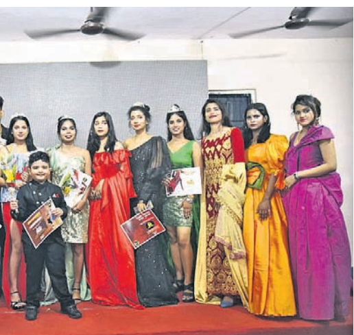
ଭୁବନେଶ୍ୱର ରୋଗାଦି କୁଠାରେ ଗୁରୁବାର ଓଡ଼ିଶା ଫ୍ୟାଶନ୍ ଆଇକନ୍ ଆଞ୍ଚଳିକ-୨୦୨୨ ପ୍ରଦାନ ଅବସରରେ ଅତିଥିଙ୍କ ଗହଣରେ ପୁରସ୍କୃତ ମଡେଲ, ଫ୍ୟାଶନ୍ ଡିଜାଇନର ଓ ଅନ୍ୟମାନେ।

କଟକ ବାଲିଆତ୍ରା ଉପର ପଡ଼ିଆରେ ଶୁକ୍ରବାରଠାରୁ ଆରମ୍ଭ ହେବାକୁ ଯାଉଛି ଏବଂ ଓଡ଼ିଶାର ପାରମ୍ପରିକ ଖାଦ୍ୟ ସପ୍ତବଣ କଟକ ବୈଶାଖୀ ବାଣିଜ୍ୟ ମେଳା। ଏଥିସହ ମାମା ବଜାର ଓ ବିଭିନ୍ନ ଦୋକାନ ସମେତ ମେଳାରେ ମାଝା ପିନ୍ଧିବା ପ୍ରଦେଶ, ହରିୟାଣା, ରାଜସ୍ଥାନ, ବିହାର, ଦେଖୁଥିଲେ। ମୁକ୍ତ ଜଗତ ମୁହଁମାଡ଼ି ତଳେ ପଡ଼ିଥିବାବେଳେ ତାଙ୍କ ଶୀର୍ଷ କିଛିଦୂରରେ ପଡ଼ିଥିଲା। ସମ୍ପୂର୍ଣ୍ଣ ମୁକ୍ତକଳ୍ପ କେହି କେବେ ଜଗତର ବ୍ୟବସାୟ ପରିସରରେ ପୂର୍ବରୁ ଦେଖି ନ ଥିବା ସ୍ଥାନୀୟ ଲୋକେ କହିଛନ୍ତି।