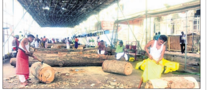
ପୁରୀ ଅଫିସ୍, ୫୫୫

ଶ୍ରୀମନ୍ଦିରର ଅଗ୍ରଭାଗରେ ମହାପ୍ରଭୁଙ୍କ ରଥ ନିର୍ମାଣ କାର୍ଯ୍ୟ ଜାରି ରହିଛି। ପ୍ରାଥମିକ ପର୍ଯ୍ୟାୟରେ ଚକ ପାଇଁ ତୁମ୍ଭ ତିଆରି କରାଯାଇଛି। ତିନିରଥ ପାଇଁ ମୋଟ ୪୨ଟି ତୁମ୍ଭ ନିର୍ମାଣ ହେବ। ବୁଧବାର ପ୍ରଥମ ଦିନରେ ତିନିରଥ ତୁମ୍ଭ ମହାରଣା, ଭୋଇସେବକ ଓ କରତି ସେବକଙ୍କ ଉପସ୍ଥିତିରେ ରଥ ଅମିତ ମହାରଣା ତୁମ୍ଭ ଲାଗି ଆବଶ୍ୟକ ଫାଟା କାଠରେ ତିନି ଦେବା ପରେ କରତି ସେବକମାନେ ଚୁକ୍ତି ଲେଖାଏ ତୁମ୍ଭ କାଠ କାଟି ଗଡ଼ କରିଥିଲେ। ଏହାକୁ ରଥ ମହାରଣାମାନେ ବାରିସିରେ ହାଣି ପ୍ରାଥମିକ ଗୋଲେଇ କାର୍ଯ୍ୟ ଜାରି ରଖିଥିଲେ। ଗୁରୁତାର ବିତ୍ତାୟ ଦିନରେ ତୁମ୍ଭ ଗୋଲେଇ କାର୍ଯ୍ୟ ସରିଛି। ଅପରାହ୍ନ ୨ଟା ସୁଦ୍ଧା କରତି ସେବକମାନେ ୫ଟି ତୁମ୍ଭ କାଟିଥିଲେ। ପରେ ଭୋଇ ସେବକମାନେ ନିରୋଧ୍ୟ ରଥଗାଡ଼ିକୁ ୨ଟି, ଦେବା ରଥଗାଡ଼ିକୁ ଗୋଟିଏ ଏବଂ ଚାଳଧିକ ରଥଗାଡ଼ିକୁ ୨ଟି ତୁମ୍ଭଗଡ଼ ଯୋଗାଇଥିଲେ। ନିରୋଧ୍ୟ ରଥ ମହାରଣା ସେବକମାନେ ୪ଟି ତୁମ୍ଭକୁ ୩ଟି ଏବଂ ଚାଳଧିକ ରଥ ମହାରଣାମାନେ ୩ଟି ତୁମ୍ଭକୁ ୨ଟି ପ୍ରାରମ୍ଭିକ ଗୋଲେଇ କାର୍ଯ୍ୟ ଶେଷ କରିଛନ୍ତି। ଦେବା ରଥ ମହାରଣା ସେବକଙ୍କ ଦ୍ୱାରା ୩ଟି ତୁମ୍ଭର ପ୍ରାରମ୍ଭିକ ଗୋଲେଇ କାର୍ଯ୍ୟ ଶେଷ ପର୍ଯ୍ୟାୟରେ ପହଞ୍ଚିଛି। ଦୋଳଦେବି ଅଗ୍ରଭାଗ କମାରଖଳରେ କମାର ସେବକମାନେ ରଥକଣ୍ଠ ପ୍ରସ୍ତୁତି ଲାଗି ଲୁହାରତ୍ କଟିକ କରୁଛନ୍ତି। ରଥ ନିର୍ମାଣ କାର୍ଯ୍ୟରେ ମୋଟ ୪୦ଜଣ ସେବାୟତ ଓ କାରିଗର ସାମିଲ ହୋଇଥିଲେ।