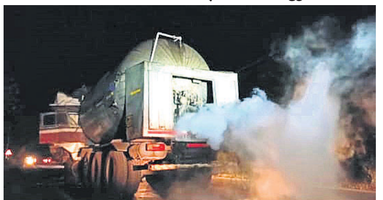
ଟ୍ୟାଙ୍କରରୁ ଅଙ୍ଗାରକାମ୍ଳ ଗ୍ୟାସ୍ ଲିକ୍ ହେଉଛି।

ନୟାଗଡ଼ ଅପିସ/ରଣପୁର, ୫୫ (ସି.ପ୍ର.) ବଲାଙ୍ଗୀର-ଖୋର୍ଦ୍ଧା ୫୭ନଂ ଜାତୀୟ ରାଜପଥର ନୟାଗଡ଼ ଜିଲ୍ଲା ରଣପୁର ଥାନା ଅନ୍ତର୍ଗତ ରାଜପୁରାଖଳା ନିକଟ ବିନୋଦପଡ଼ା ଛକରେ ଗୁରୁବାର ରାତି ପ୍ରାୟ ସାଢ଼େ ୧୦ଟାରେ ଏକ ଅଙ୍ଗାରକାମ୍ଳ ଗ୍ୟାସ୍ ବୋହେଇ ଟ୍ୟାଙ୍କର ଦୁର୍ଘଟଣାଗ୍ରସ୍ତ ହୋଇଥିଲା। ଫଳରେ ଟ୍ୟାଙ୍କରରୁ ବହୁ ପରିମାଣର ଅଙ୍ଗାରକାମ୍ଳ ଗ୍ୟାସ୍ ଲିକ୍ ହୋଇଥିଲା। ସେହି ଗ୍ୟାସ୍ ଯୋଗୁ ଜାତୀୟ ରାଜପଥରେ ଗାଡ଼ିମୋଟର ଯାତାୟାତରେ ବାଧା ସୃଷ୍ଟି ହୋଇଥିଲା। ଲୋକେ ଅଣନିଃଶ୍ୱାସୀ ହୋଇପଡ଼ିଥିଲେ। ଗ୍ୟାସ୍ ଲିକ୍ ଖବର ଜଣାପଡ଼ିବା ପରେ ଗ୍ଲାନାୟ ଲୋକଙ୍କ ମଧ୍ୟରେ ଆତଙ୍କ ଖେଳିଯାଇଥିଲା। ବୌଦ୍ଧ ଭୁବନେଶ୍ୱର ଅଭିମୁଖେ ଯାଉଥିବା ଏକ ହାଇଡ୍ରୋ ପକ୍ସିକାରୀ ଗ୍ୟାସ୍ ଟ୍ୟାଙ୍କର ଧକ୍କା ଦେବାରୁ ଦୁର୍ଘଟଣା ଘଟିଛି। ଦୁର୍ଘଟଣାଗ୍ରସ୍ତ ଟ୍ୟାଙ୍କରରେ ପ୍ରାୟ ୧୩ ହଜାର ଲିଟର ଗ୍ୟାସ୍ ରହିଛି ବୋଲି ସୂଚନା ମିଳିଛି। ଯଦି ଗ୍ୟାସ୍ ଟ୍ୟାଙ୍କର ଫାଟିଯିବ ପରିସ୍ଥିତି ଗୁରୁତର ହେବ ବୋଲି ପ୍ରତୀତିତ ହେବା ପରେ ଲୋକମାନେ ସେହି ଗ୍ଲାନାୟ ଛାଡ଼ି ପଳାଇଥିଲେ। ଦୁର୍ଘଟଣାର ପ୍ରାୟ ୧ ଘଣ୍ଟା ପରେ ରଣପୁର ଫାଟି ପୋଲିସ ଉପସ୍ଥାପନରେ ପହଞ୍ଚି ପରିସ୍ଥିତି ପ୍ରତି ନଜର ରଖିଛି। ଏହି ଖବର ଲେଖାହେବା ପର୍ଯ୍ୟନ୍ତ ଦମକକ ବାହିନୀ ଉପସ୍ଥାପନରେ ପହଞ୍ଚି ନ ଥିବା ସୂଚନା ମିଳିଛି।