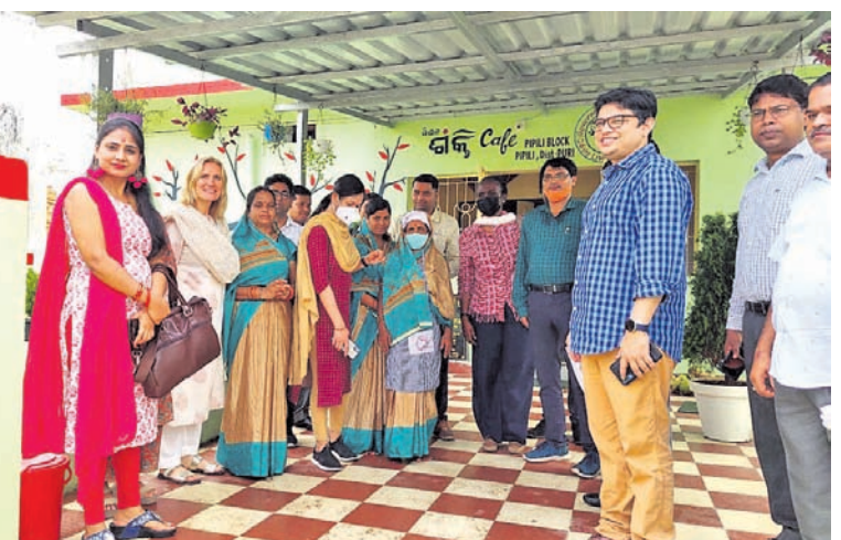
ପିପିଲି କୁଳ ଅଞ୍ଚଳ ପରିସରରେ ଆସିଥିବା ମଧ୍ୟପ୍ରଦେଶର ପଞ୍ଚାୟତରାଜ ଓ ଜଳଯୋଗାଣ ବିଭାଗର ପ୍ରତିନିଧି ଦଳ ସ୍ଥାନୀୟ ମିଶନ ଶକ୍ତିର କାଫେକୁ ଆସିଛନ୍ତି।