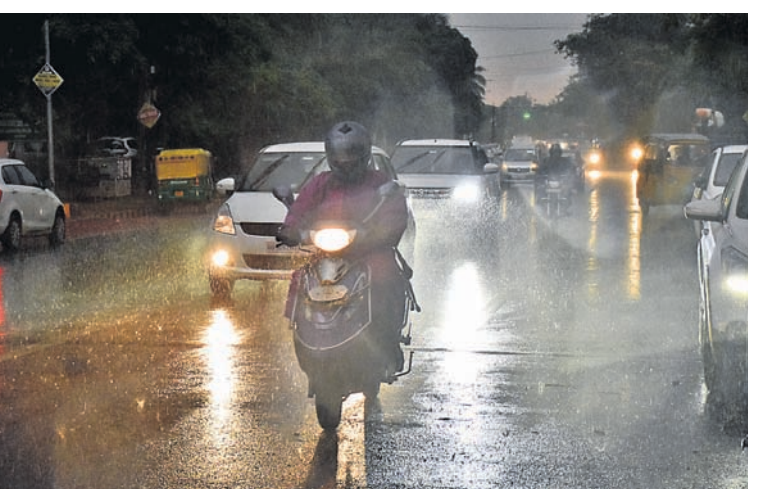
କାଳବୈଶାଖୀ ପ୍ରଭାତରେ ଗୁରୁବାର କଟକ ଓ ଭୁବନେଶ୍ୱର ସମେତ ରାଜ୍ୟର ବିଭିନ୍ନ ସ୍ଥାନରେ ବର୍ଷା ଓ ପବନ ହୋଇଥିଲା। ସନ୍ଧ୍ୟା ସମୟରେ ଭୁବନେଶ୍ୱର ରାସ୍ତାର ଦୃଶ୍ୟ।