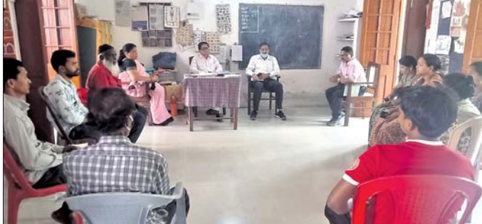
ବଲାଙ୍ଗୀର ଅଧିକାରୀଙ୍କ ସହିତ