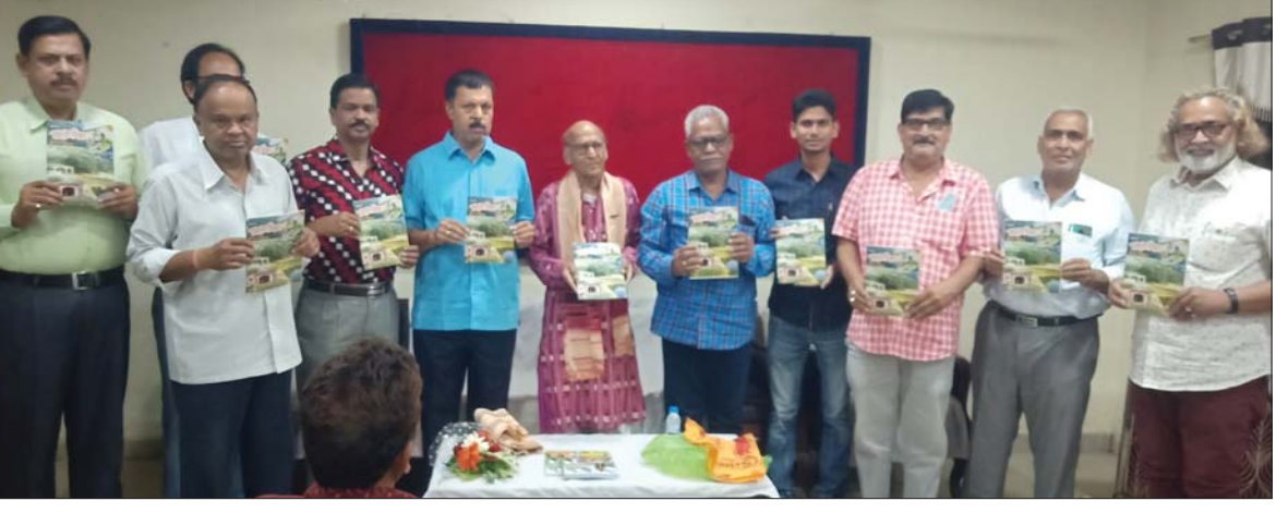
ଅତିଥିମାନେ ସୁଭାଷ ଚିନ୍ତନର ଦ୍ୱିତୀୟ ସଂସ୍କରଣକୁ ଉନ୍ମୋଚିତ କରୁଛନ୍ତି।

ବଲାଙ୍ଗୀର ନେତାଙ୍କୁ ସଂଗ୍ରାମୀ ପରିଷଦ ପକ୍ଷରୁ ପୁସ୍ତକପତ୍ର 'ସୁଭାଷ ଚିନ୍ତନ'ର ଦ୍ୱିତୀୟ ସଂସ୍କରଣକୁ ବର୍ଷାକାଳୀନ ସମୟରେ ପ୍ରକାଶ କରିବା ପାଇଁ ଯତ୍ନ ସାଧନ କରାଯାଇଛି।