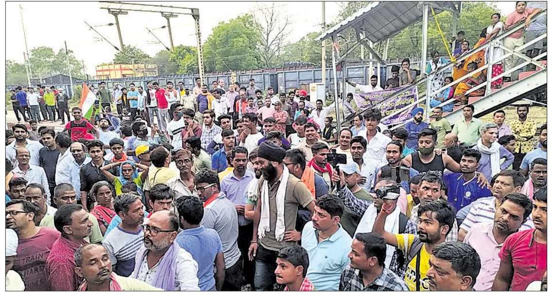
ବ୍ରଜରାଜନଗର ରେଳ ଷ୍ଟେଶନରେ ଉତ୍ତେଜନାମୂଳକ ପରିସ୍ଥିତି ।