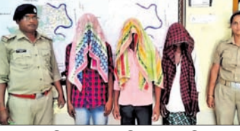
ବନବିଭାଗ ଦ୍ୱାରା ଗିରଫ ୩ ଅଭିଯୁକ୍ତ।