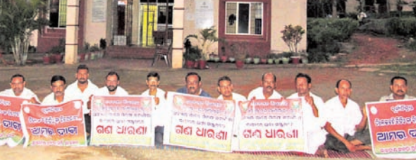
ରିଆମାଳ ଆନା ସମ୍ମୁଖରେ ଭାଜପା କର୍ମକର୍ତ୍ତା ଧାରଣା ଦେଇଛନ୍ତି।