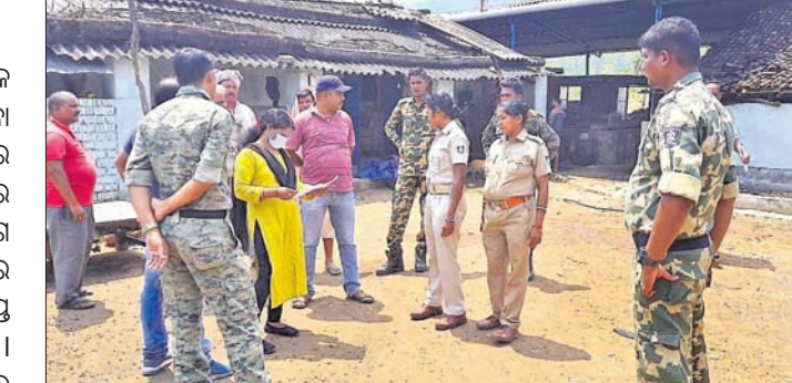
ପୋଲିସ୍ ମହିଳାମାନଙ୍କ ସହ ଆଲୋଚନା କରୁଛି।

ସୁନ୍ଦରଗଡ଼ ଜିଲ୍ଲା ତିଲେଇବଣି ବ୍ଲକ୍ ସଦର ମହକୁମାରେ ଅନତି ଦୂରରେ ଥିବା ଏକ ମଦଭାଗି ଗୁରୁବାର ପୂର୍ବାହ୍ନରେ ମହିଳାମାନେ ଭାଙ୍ଗିଦେଇଛନ୍ତି। ବାରମ୍ବାର ଅଭିଯୋଗ ପରେ ବି ଅବକାରୀ ବିଭାଗ ଓ ପ୍ରଶାସନ ଶୁଣିଲାନି। ଫଳରେ ବାଧ୍ୟହୋଇ ସରକାରୀ ଲାଇସେନ୍ସପତ୍ର ମଦଭାଗିକୁ ମହିଳାମାନେ ଭାଙ୍ଗିଥିଲେ। ତିଲେଇବଣି ଫାଶିର ଅନତି ଦୂରରେ ଜାତୀୟ ରାଜପଥ କଡ଼ରେ ରହିଛି ତିଲେଇବଣି-ବିନ୍ଦପୁର ସରକାରୀ ଦେଶୀ ମଦ ଭାଗି। ତେବେ ଏହି ମଦଭାଗି ଅଶୁରାଖୋଳ ଗ୍ରାମ ନିକଟରେ ରହିଥିବାରୁ ଗ୍ରାମର ପୁରୁଷମାନେ ମଦ୍ୟପାନ କରିବା ସହ ସ୍ତ୍ରୀ ଓ ପିଲାମାନଙ୍କୁ ଗାଳିଗୁଳିକ ମାଡ଼ପିଟ କରୁଛନ୍ତି। ମଦଭାଗି ଜାତୀୟ ରାଜପଥ କଡ଼ରେ ଥିବାରୁ ଲୋକେ ଅଧିକ ମଦପିଇ ନାନା ଦୁର୍ଘଟଣାର ଶିକାର ହେଉଛନ୍ତି। ଏଣୁ ଏହି ମଦଭାଗିକୁ ତୁରନ୍ତ ବନ୍ଦ କରିବାକୁ ଗ୍ରାମର ମହିଳାମାନେ କୁଳ ପ୍ରଶାସନଠାରୁ ଆରମ୍ଭ କରି ଜିଲ୍ଲା ପ୍ରଶାସନ, ପଞ୍ଚାୟତ ଅଧିକାରୀଙ୍କୁ ଆରମ୍ଭ କରି ଜିଲ୍ଲା ଆରକ୍ଷା ଅଧିକାରୀ ଏବଂ ଏପରିକି ଜିଲ୍ଲା ଅବକାରୀ ଅଧିକାରୀଙ୍କ ନିକଟରେ