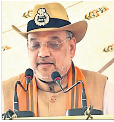
ତାହା ଚାହିଁଲେ ବି ସିଏଏ ନେଇ ଏହି ଦଳ ବିଚ୍ଛିନ୍ନ କରିପାରିବ ନାହିଁ। ସେପଟେ

ଶାହାଙ୍କ ଏହି ମନ୍ତବ୍ୟକୁ ନେଇ ବିପକ୍ଷରୁ ସୁପ୍ରିମୋ ମମତା କହିଛନ୍ତି, ସିଏଏ ହେଉଛି ସେମାନଙ୍କ କଷ୍ଟ। ସେମାନେ ପାଲିମେଣ୍ଟରେ ବିଲ ଆଣିବାକୁ ଚାହୁଁଛନ୍ତି। ଭାଜପା ସରକାର ୨୦୨୪ରେ ଆଉ କ୍ଷମତାକୁ ଆସିବ ନାହିଁ। କୌଣସି ନାଗରିକ ନିଜ ଅଧିକାରକୁ ବଞ୍ଚେଇ ରଖିବାକୁ ଚାହୁଁଛନ୍ତି। ଏହା ଆମର ଏକତା। ଶାହା ବର୍ଷେ ପରେ ଆସିଛନ୍ତି। ସେ ଯେତେବେଳେ ବି ଆସନ୍ତି ତାହାକୁ ସିଆଡୁ କଥା କହିଥାଆନ୍ତି ବୋଲି ମମତା ସମାଲୋଚନା କରିଛନ୍ତି।