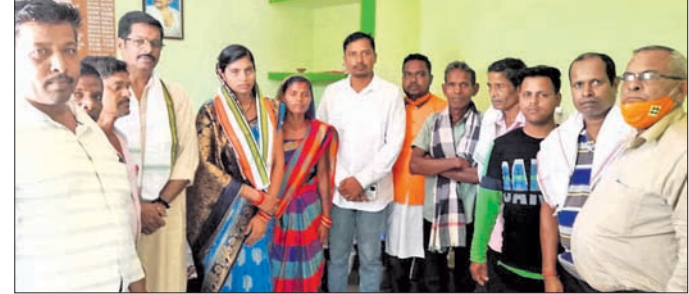
ବୈଠକରେ ଉପସ୍ଥିତ ସରକାରଙ୍କ ସମେତ ଅନ୍ୟମାନେ।

ପୁଷ୍ଟଗୁଣ୍ଡ ଦେଇ ସମର୍ଥନ କରାଯାଇଥିଲା। ପରେ ପଞ୍ଚାୟତର କିଛି ବିକାଶ ହେବ ସେ ସମ୍ପର୍କରେ ଏକ ବୈଠକ ଅନୁଷ୍ଠିତ ହୋଇଥିଲା। ସରକାରଙ୍କ ସହଯୋଗରେ ଅନୁଷ୍ଠିତ ବୈଠକରେ ରୂପାନ୍ତର କରାଯାଇଛି। ସେ ସମ୍ପର୍କରେ ସେଥିପାଇଁ ସମସ୍ତେ ଯତ୍ନବାନ ହେବା ଆବଶ୍ୟକ। ସମସ୍ତଙ୍କ ସହଯୋଗ ରହିଲେ ପଞ୍ଚାୟତ ରୂପାନ୍ତର ବିକାଶ ହୋଇପାରିବ ବୋଲି ରୁଧିରା କିଶୋରନଗର ବ୍ଲକ ହଞ୍ଚପା ପଞ୍ଚାୟତ କାର୍ଯ୍ୟାଳୟଠାରେ ଅନୁଷ୍ଠିତ ବୈଠକରେ ଯୋଗଦେଇଥିବା ଅଧିକାରୀମାନେ ମତପ୍ରକାଶ କରିଛନ୍ତି। ଭାବପା ବଇଣ୍ଡା ମଞ୍ଚଳ ପକ୍ଷରୁ ପ୍ରଥମେ ନୂତନ ସରକାର ରହିବା ପ୍ରଧାନଙ୍କୁ