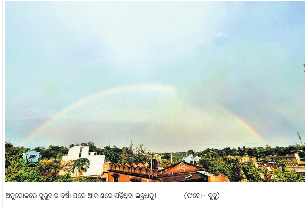
ଅନୁଗୋଳରେ ଗୁରୁବାର ବର୍ଷା ପରେ ଆକାଶରେ ପଡ଼ିଥିବା ଇନ୍ଦ୍ରଧନୁ।