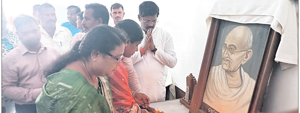
ସ୍ମୃତି ସଭାରେ ବିଧାୟକଙ୍କ ସମେତ ଅନ୍ୟମାନେ।

ଏକ ଠିକାସଂସ୍ଥାରେ କାର୍ଯ୍ୟ କରୁଥିଲେ। ମଙ୍ଗଳବାର ସନ୍ଧ୍ୟାରେ ଝଡ଼ପବନକୁ ନେଇ ବାଇକ ଯୋଗେ ଆସୁଥିବାବେଳେ ପ୍ରବଳମାତ୍ରାରେ ପାଇଁ ଉଡ଼ିବାରୁ ରାସ୍ତାକଡ଼ରେ ଥିବା ଡ୍ରେନକୁ ବାଜକ ସହିତ ଗଳି ପଡ଼ିଥିଲେ। ପରିବାରବର୍ଗ ଖୋଜାଖୋଜି କରିବାରୁ ରୁଧିରା ରାତିରେ ଡ୍ରେନରେ ମୃତଦେହ ପଡ଼ିଥିବା ଦେଖିବାକୁ ପାଇଥିଲେ। ଏହାପରେ କ୍ଷତିପୂରଣ ଦାବିରେ ପରିବାରବର୍ଗ ଆନ୍ଦୋଳନ କରିଥିଲେ। ଏ ନେଇ ନଂ. ୩/୨୨ରେ ଅପମୃତ୍ୟୁ ମାମଲା ରୁଜୁ ହୋଇଛି। ଚାଳକତର ଉପଖଣ୍ଡ ସ୍ୱାସ୍ଥ୍ୟକେନ୍ଦ୍ରରେ ମୃତଦେହ ଦ୍ୟବହେତ ପରେ ପରିବାରକୁ ହସ୍ତାନ୍ତର କରାଯାଇଛି।