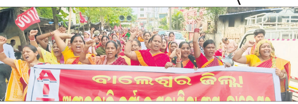
ଜିଲାପାଳଙ୍କ ଅଫିସ୍ ସମ୍ମୁଖରେ ବିରୋଧ ପ୍ରଦର୍ଶନ କରାଯାଇଛି।