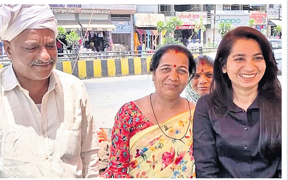
ପରିବା ବ୍ୟବସାୟିକ ଝିଅ ବିଚାରପତି

ପରିବା ବ୍ୟବସାୟିକ ଝିଅ ବିଚାରପତି ହୋଇଛନ୍ତି। ଏହା ଏକ ଇଲେକ୍ଟ୍ରିକ୍ ଗାଡ଼ି ଓ ଏହାର ମାଲିକାନା ସୁଧା ହେବ।