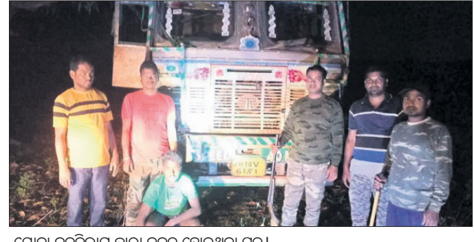
ଯୋଡ଼ା ବନବିଭାଗ ଦ୍ଵାରା ଜବତ ହୋଇଥିବା ଗ୍ରୁପ୍।

ଟିମ୍ କୁ ଦେଖି ଖଣିକ ବୋଲି ମାନେ ଛତ୍ରଭଞ୍ଜ ଦେଇଥିଲେ। ଏତଦ୍ବ୍ୟତୀତ ସେଠାରେ ଥିବା ପ୍ରାୟ ୩୦ ମେଟ୍ରିକ ଟନ୍ ଲୁହାପଥର ଜବତ ହୋଇଛି। ଖଣି ବିଭାଗ ପକ୍ଷରୁ ଲକ୍ଷଗ୍ରୋଡେଟ ମାଲନ୍ସ ମିନେରାଲ ମ୍ୟାନେଜମେଣ୍ଟ ସିଷ୍ଟମ ସର୍ଭିସ୍ରେ ଲଗାତ ପ୍ରତି ରୁଟିରେ ଚୋରା କାରବାରକୁ ପ୍ରତିହତ କରାଯାଇ ପାରିବ ବୋଲି ଲୁହାପଥର ବୋଲି ସନ୍ଦେହ ଉଠୁଛି। କାରଣ ସର୍ଭିସ୍ରେ ପରିଚାଳନା କରୁଥିବା କେତେକ ଅଧିକାରୀ ଓ ସରକାରୀ ଓଜନକଣ୍ଠରେ ଥିବା ବେଳେ ଜଣ ଅସାଧୁ କର୍ମଚାରୀ ମାନେ ଏହି ଚୋରା କାରବାରକୁ ପଚୋଷରେ ପ୍ରଶଞ୍ଜ ଦେଇଛନ୍ତି ବୋଲି ଖଣି ବିଷାଗଦ ମତ ଦେଇଛନ୍ତି। ଗତ କିଛି ମାସ ହେବ ଚାଲାଣ ପାଇଁ ବୋହେଇ ହେଉଥିଲା ଓ ମାଙ୍ଗାନିକ