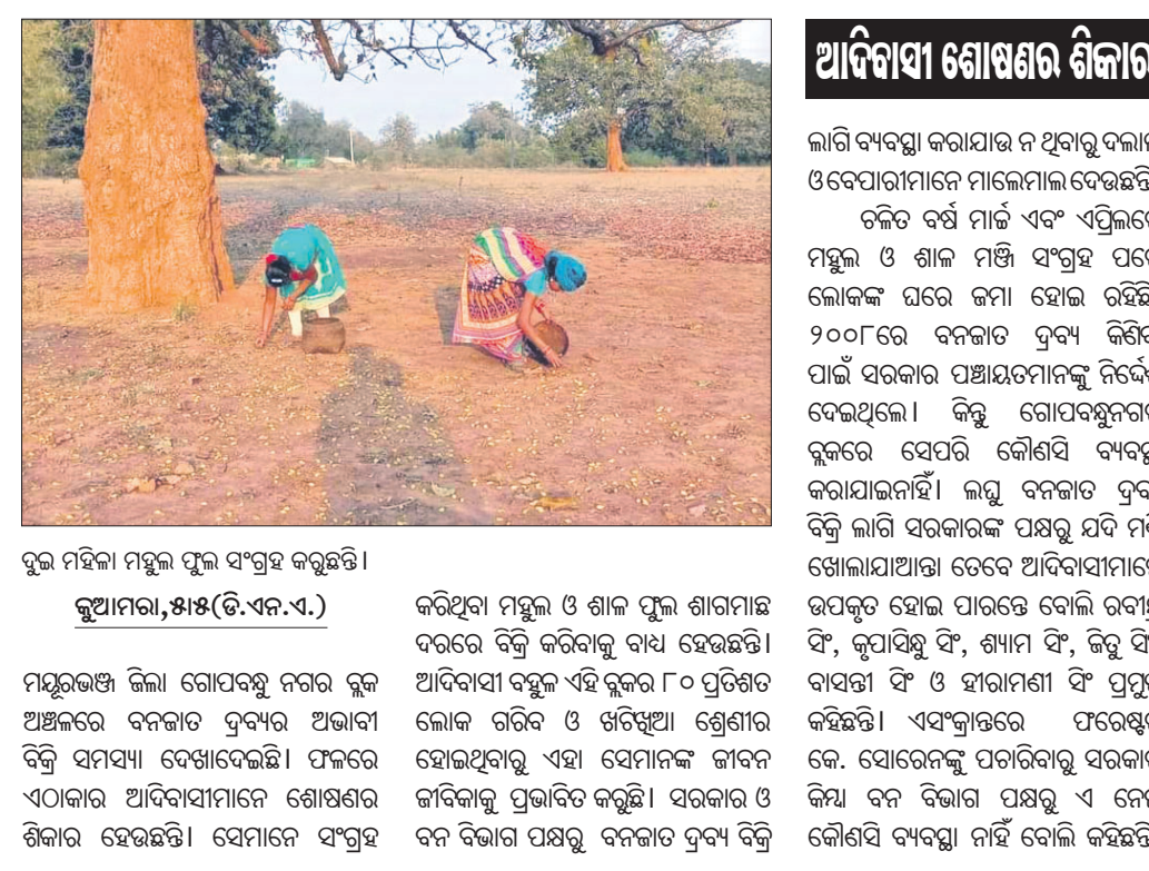
ଭୁଇଁ ମହିଳା ମହୁଳା ପୁଲ୍ ସଂଗ୍ରହ କରୁଛନ୍ତି।