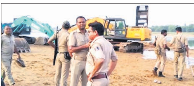
ବାଲି ସଜରାତରେ ପୋଲିସ ଜମି ରହିଛି।

ବାଲି ଉତ୍ତୋଳନ ଆଇନ ଉଲ୍ଲଙ୍ଘନ ୪ କେସିବି, ୧୬ ତମ୍ପର ଜବତ