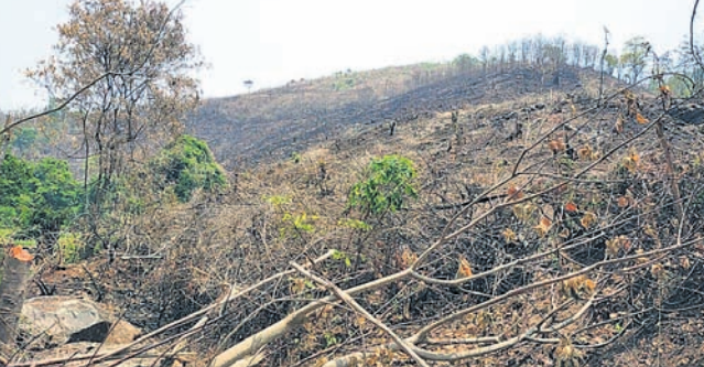
କଟା ଯାଇଥିବା ଗଛ ।