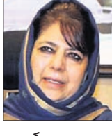
କଶ୍ମି-କଶ୍ମୀର ପୂର୍ବତନ ମୁଖ୍ୟମନ୍ତ୍ରୀ