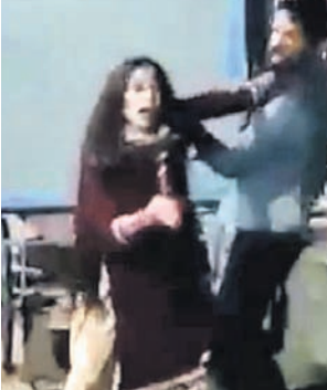
ହତ୍ୟାକାଣ୍ଡ ବେଳର ଭାଇଭାଇ ଭିଡିଓ। ଉତ୍କଳ ନେତା ଦେଶାଦେଇଛି। ସ୍ଥାନୀୟ ଭାଜପା କର୍ମୀମାନେ ଅଭିଯୁକ୍ତ ଗିରଫ ଦାବିରେ ଆନ୍ଦୋଳନକୁ ଉତ୍ସାହିତ।

ହାଇଦ୍ରାବାଦ, ଖାଖ: ଜଣେ ମୁସଲମାନ ଯୁବକଙ୍କୁ ବିବାହ କରିଥିବା ହାଇଦ୍ରାବାଦର ହିନ୍ଦୁ ଯୁବକଙ୍କୁ ଲୁହା କଣ୍ଠେନରେ ଭରି କରାଯାଇଥିଲା। ପ୍ରତି ବାକ୍ସରେ ଏକ ଟାକମର, ତିନୋଟି ଟାକମର, ବିଶ୍ୱାସୀୟତା ରହିଥିବାବେଳେ ସେଥିମଧ୍ୟରେ ବିଦ୍ୟୁତ୍ ସଂଯୋଗ କରାଯାଇଥିଲା। ସେଗୁଡ଼ିକୁ ଗୋଟି ଯୋଗେ ସାମାଜିକ ବାହାରୁ ପଠାଯାଇଛି। ଅଭିଯୁକ୍ତମାନେ ବିଶ୍ୱାସୀୟତା ପଦ୍ଧତିରେ ଏକ୍ସପ୍ଲୋସିଭ୍ ସଂଯୋଗ ଆକ୍ରମଣ ଆକ୍ରମଣ ମାମଲା ରୁକ୍ତ କରାଯାଇଛି। ୬ ମୋବାଇଲ୍ ଫୋନ୍ ଏବଂ ୧ ଲକ୍ଷ ୨୦ ହଜାର ଟଙ୍କା କବଚ କରାଯାଇଛି।