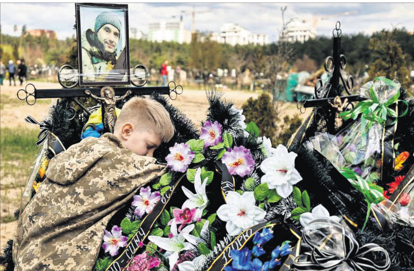
ରୁଷୀୟ ସୈନ୍ୟଙ୍କ ଆକ୍ରମଣରେ ନିହତ ଜଣେ ଯୁକ୍ତମୁଖ୍ୟ ସୈନ୍ୟଙ୍କ ସମାଧିରେ କାନ୍ଥର ଚାକ ପୁଅ।

ନୂଆଦିଲ୍ଲୀ, ଖାଖ: ପଦ୍ମ ପୁରସ୍କାର ୨୦୨୩ ନିମନ୍ତେ ଆସନ୍ତା ସେପ୍ଟେମ୍ବର ୧୫ ପର୍ଯ୍ୟନ୍ତ ଅନୁଲୋଚନାରେ ନୋମିନେଶନ ଦା ନାଁ ସୁପାରିସ୍ କରାଯାଇପାରିବ ବୋଲି ସ୍ୱରାଷ୍ଟ୍ର ମନ୍ତ୍ରାଳୟ ପକ୍ଷରୁ କୁହାଯାଇଛି। ଆସନ୍ତା ବର୍ଷ ସାଧାରଣତନ୍ତ୍ର ଦିବସ ଅବସରରେ ଘୋଷଣା ହେବାକୁ ଥିବା ପଦ୍ମ ଭୂଷଣ, ପଦ୍ମ ଭୂଷଣ ଏବଂ ପଦ୍ମଶ୍ରୀ ପୁରସ୍କାର ପାଇଁ ମେ ୧୧ ନୋମିନେଶନ ପ୍ରକ୍ରିୟା ଆରମ୍ଭ ହୋଇଛି। କଳା, ସାହିତ୍ୟ, ଶିକ୍ଷା, ଖେଳ, ଉନ୍ନତିଯତ୍ନ, ପରିବହନ ଆଦି ବିଭିନ୍ନ କ୍ଷେତ୍ରରେ ଉଲ୍ଲେଖନୀୟ ଯୋଗଦାନ କରିଥିବା ବ୍ୟକ୍ତି ବିଶେଷଙ୍କୁ ପଦ୍ମ ପୁରସ୍କାର ପ୍ରଦାନ କରାଯାଇଥାଏ।