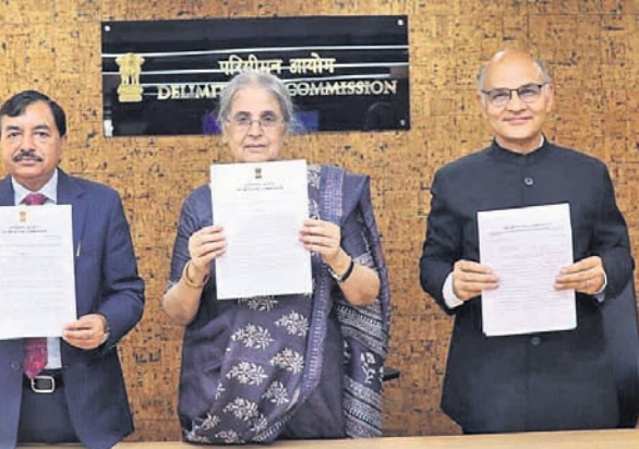
ସାମାଜିକ ପୁନଃ ନିର୍ଦ୍ଧାରଣ କମିଶନ ସଦସ୍ୟମାନେ ରୂପାନ୍ତର ଡିଲିମିଟେସନ୍ ଅର୍ଥର ଦେଖାଉଛନ୍ତି। ବୃଦ୍ଧି କରାଯାଇଛି। ସେହିପରି ସମସ୍ତ ନିର୍ବାଚନପତ୍ର ସମ୍ପୂର୍ଣ୍ଣ ଲିଭାଏ ସାମାଜିକ ପକ୍ଷରେ ହିଁ ରହିବ ବୋଲି ଡିଲିମିଟେସନ୍ ୩୭ ଆସନ ଥିବାବେଳେ ଏହାକୁ ୪୩କୁ

ପାଇଁ କମିଶନ ପରାମର୍ଶ ଦେଇଛନ୍ତି। କଶ୍ମିରୀ ପକ୍ଷିତ ନିର୍ବାଚନ ମାନଚିତ୍ରକୁ ପୁନଃ ଅଙ୍କନ କରିବା ପାଇଁ ଗଠିତ ସାମାଜିକ ପୁନଃ ନିର୍ଦ୍ଧାରଣ କମିଶନର ବାକ୍ସର ଉପରେ ପ୍ରତିନିଧିତ୍ୱ କରିବେ। ସେମାନଙ୍କୁ ମନୋନୀତ କରି ଗୃହକୁ ପଠାଯିବ। ସେମାନଙ୍କ ପାଇଁ ଅତିରିକ୍ତ ଆସନ ସୃଷ୍ଟି କରାଯିବ ବୋଲି ସାମାଜିକ ପୁନଃ ନିର୍ଦ୍ଧାରଣ କମିଶନ ନିଜ ରୂପାନ୍ତର ରିପୋର୍ଟରେ ସୁପାରିସ୍ କରିଛନ୍ତି। ସେହିପରି ତତ୍ତ୍ୱାବଳିତ୍ୱ ଜନଜାତି (ଏସ୍‌ଜି) ବର୍ଗଙ୍କ ପାଇଁ ପ୍ରଥମ ଥର ଲାଗି ବିଧାନସଭାରେ ୫ ଆସନ ସଂରକ୍ଷିତ ରଖାଯିବ। ଏହି କେନ୍ଦ୍ରୀୟତା ଅଞ୍ଚଳରେ ସମସ୍ତ ୫ ଲୋକ ସଭା ଆସନ ଅଧୀନରେ ସାମାଜିକ ସଂଖ୍ୟାକ ବିଧାନସଭା ନିର୍ବାଚନପତ୍ର ରହିବା