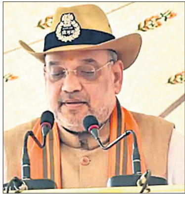
ଡାହା ଚାହିଁଲେ ବି ସିଏଏ ନେଇ ଏହି ଦଳ କିଛି କରିପାରିବ ନାହିଁ। ସେପଟେ

ଶାହାଙ୍କ ଏହି ମନ୍ତବ୍ୟକୁ ନେଇ ବିପକ୍ଷରୁ ପ୍ରତିକ୍ରିୟା ମାତ୍ରା କରାଯାଇଛି, ସିଏଏ ହେଉଛି ସେମାନଙ୍କ କଷ୍ଟ। ସେମାନେ ପାଲିମେଣ୍ଟରେ ବିଲ୍ ଆଣିବାକୁ ଚାହୁଁଛନ୍ତି। ଭାଜପା ସରକାର ୨୦୨୪ରେ ଆଉ କ୍ଷମତାକୁ ଆସିବ ନାହିଁ କୌଣସି ନାଗରିକ ନିଜ ଅଧିକାରକୁ ବଞ୍ଚେଇ ରଖିବାକୁ ଚାହୁଁଛନ୍ତି। ଏହା ଆମର ଏକତା। ଶାହା ବର୍ଷେ ପରେ ଆସିଛନ୍ତି। ସେ ଯେତେବେଳେ ବି ଆସନ୍ତି ତାହାକୁ ସିଏଆଡ଼ କଥା କହିଥାଆନ୍ତି ବୋଲି ମତା ସମାଲୋଚନା କରିଛନ୍ତି।