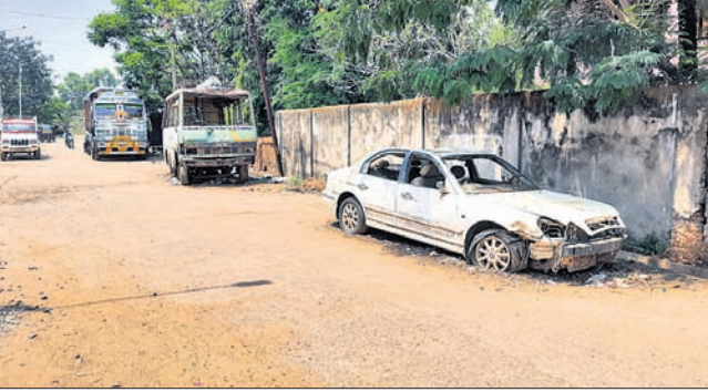
ନବରଙ୍ଗପୁର, ୫୫ (ବି.ପ୍ର.)

ଅପରୋଡ଼ ଓ ଅଚଳ ଗାଡ଼ିଗୁଡ଼ିକ ରାସ୍ତା କଡ଼ରେ ଦୀର୍ଘ ଦିନଧରି ପଡ଼ି ରହିଛନ୍ତି। ଏହା ଫଳରେ ଗ୍ରାଫିକ୍ ସମସ୍ୟା ଦେଖାଦେଇଛି। ଏ ଦିଗରେ ପୌରସଂସ୍ଥା ନବରଙ୍ଗପୁର କୃଷକ ବଜାରରୁ ପଠାଣ ବେଳକୁ କୋରାପୁଟ ସଦର ପୋଲିସ୍ ଦାତା ଗୁରୁତର ପହଞ୍ଚି ନ ଥିବା ଜଣାପଡ଼ିଛି।