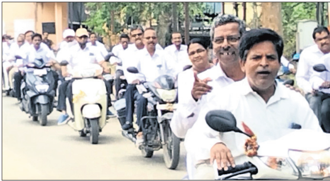
ଆଇନଜୀବୀମାନେ ବାଇକ୍ ଶୋଭାଯାତ୍ରାରେ ଯାଉଛନ୍ତି।

କରତ୍ୱିୟମ ଅଫିସ୍, ୫୫: ୨ ଦିନ ଦାବିରେ ଜଗତସିଂହପୁର ଜିଲ୍ଲା ଓକିଲ ସଂଘ ପକ୍ଷରୁ ଜିଲ୍ଲା କୋର୍ଟ ପୂର୍ଣ୍ଣ ପାଟକ ନିକଟରେ ରୁଧିରୀ କାର୍ଯ୍ୟକ୍ରମ ଆୟୋଜନ ଆରମ୍ଭ ହୋଇଛି।