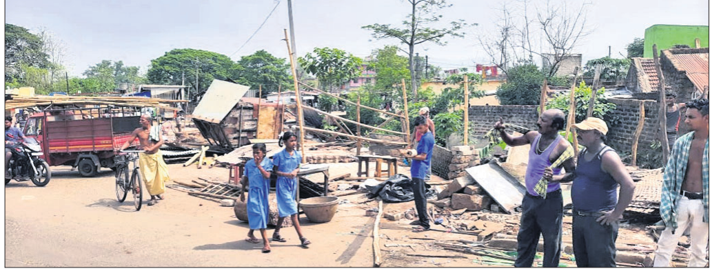
ଜବରଦଖଲ ଉଚ୍ଛେଦ ହୋଇଥିବା ଦୋକାନୀ ।

ଓଡ଼ିଶା ଏନ୍‌ଏସ୍‌ସିରେ ତାଲିକା ବୁଲିତୋକର । ଗୁରୁବାର ଏନ୍‌ଏସ୍‌ସି, ପୋଲିସ୍ ଓ ରାଜସ୍ୱ ବିଭାଗର ମିଳିତ ଉଦ୍ୟମରେ ସରକାରୀ ଜାଗାରେ ଜବରଦଖଲରେ ଥିବା ୪ ଘାଣ୍ଟା ଦୋକାନୀ ସହିତ ୪୦ରୁ ଊର୍ଦ୍ଧ୍ୱ ଅଘାଣ୍ଟା ଦୋକାନୀକୁ ଉଚ୍ଛେଦ କରାଯାଇଛି । ଏନ୍‌ଏସ୍‌ସି ଓ ପ୍ରଶାସନ ତରଫରୁ ଏହି ଦୋକାନୀମାନଙ୍କୁ ବାରମ୍ବାର ନୋଟିସ୍ ଦିଆଯାଇଥିଲା । ହେଲେ ସେଥିପ୍ରତି ଜବରଦଖଲକାରୀମାନେ କୌଣସି ପଦକ୍ଷେପ ଗ୍ରହଣ କରି ନ ଥିଲେ । ଫଳରେ ଜିଲା ପ୍ରଶାସନକୁ ଦୃଢ଼ ପଦକ୍ଷେପ ନେବାକୁ ପଡ଼ିଥିଲା । ବିଶେଷ କରି ୨୧୯୯ ନୋକାଲ୍ ପଡ଼ିଥିଲା । ବିଶେଷ କରି ୨୧୯୯ ନୋକାଲ୍ ରାଜ୍ୟ ରାଜପଥ ସଂଲଗ୍ନ ବସଷ୍ଟାଣ୍ଡ ପ୍ରଦେଶ ପଥ, ଖଜୁରିଆ-କୁଣ୍ଡାପଲୀ ରାସ୍ତା ତଥା ପ୍ରସ୍ତାବିତ ନୂତନ ବସଷ୍ଟାଣ୍ଡ ରାସ୍ତାରେ ଉଭୟ ପାର୍ଶ୍ୱ, ବାଲିକା ହାଇସ୍କୁଲ ପଛ ଦେଇ ଆସୁଥିବା ନାଳ ପାର୍ଶ୍ୱ, ୨ ନମ୍ବର ଖର୍ଚ୍ଚ