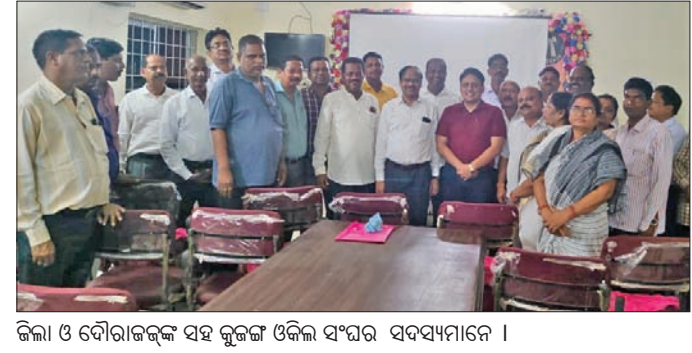
ଜିଲ୍ଲା ଓ ଦୌରାଜକ୍ଷ ସହ କୁଳଜ ଓକିଲ ସଂଘର ସଦସ୍ୟମାନେ ।

କୋର୍ଟ ଅନୁମତି ଖୋଜିବା ପ୍ରସ୍ତାବକୁ ବିରୋଧ କରାଯାଇଥିଲା। ପରିବାର ଅପାଳତ ପାଇଁ ଜିଲ୍ଲା କୋର୍ଟ ପରିସରରେ ପରାମ୍ପ ପ୍ରକାର ବ୍ୟବସ୍ଥା ଥାଇ ପୁଣି ଆବଶ୍ୟକ ଭିତ୍ତିଭୂମି ନ ଥିବା ସ୍ଥାନରେ ସର୍କିଟ କୋର୍ଟ ଖୋଜିବା ପାଇଁ ଚିନ୍ତା କରିବାକୁ ନେଇ ତୀବ୍ର ପ୍ରତିକ୍ରିୟା ପ୍ରକାଶ ପାଇଥିଲା।