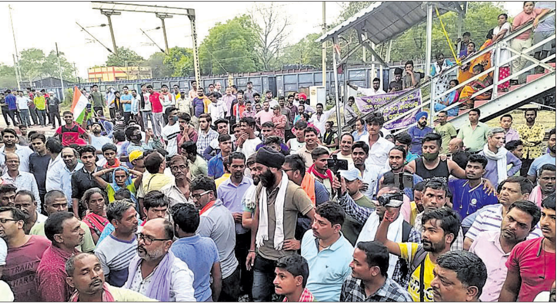
ବ୍ରଜରାଜନଗର ରେଳ ଷ୍ଟେଶନରେ ଉଭେଜନାମୂଳକ ପରିସ୍ଥିତି।

ସଦସ୍ୟମାନେ ଷ୍ଟେଶନ ବାହାରେ ନାରାବାଦି କରିଥିଲେ। ପୋଲିସ କମିଟିର ୨୦ରୁ ଉର୍ଦ୍ଧ୍ୱ ସଦସ୍ୟଙ୍କୁ ଗିରଫ କରିଥିଲା।