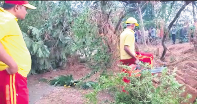
ରାସ୍ତା ଉପରେ ପଡ଼ିଥିବା ଗଛ ଅଗ୍ରଣ କର୍ମଚାରୀମାନେ ସଫା କରୁଛନ୍ତି ।