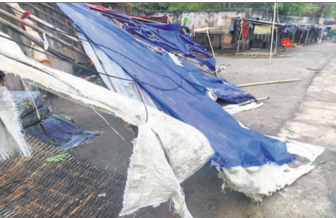
ଭାଙ୍ଗିପଡ଼ିଥିବା ଦୋକାନୀର ଆକାଶକୁଳ ଛପର ।