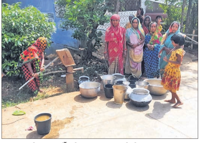
ନଳକୂପରୁ ପାଣି ବାହାରୁ ନାହିଁ, ମହିଳାମାନେ ଅପେକ୍ଷା କରିଛନ୍ତି ।