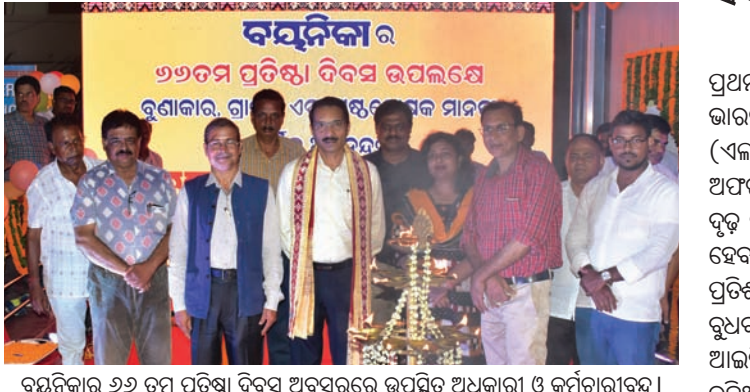
ବୟନିକାର ୬୬ତମ ପ୍ରତିଷ୍ଠା ଦିବସ ଅବସରରେ ଉପସ୍ଥିତ ଅଧିକାରୀ ଓ କର୍ମଚାରୀଙ୍କୁ। ୧୨୮.୮୫ କୋଟିର ବ୍ୟବସାୟ କରିବା ଉଦ୍ଦେଶ୍ୟ ହସ୍ତଚତ୍ର ଶିଳ୍ପ ପାଇଁ ନିଶ୍ଚିତ ରୂପ ଏକ ବଡ଼ ସଫଳତା ବୋଲି ବୟନିକା ପସ୍ତୁର କୁହାଯାଇଛି। ଆଗାମୀ ଦିନରେ ବୟନିକା ଏହାର ବ୍ୟବସାୟିକ ଅଭିବୃଦ୍ଧି ପାଇଁ ସବୁପକ୍ଷରେ ପ୍ରୟାସ ଜାରି ରହିଛି। ଏପରିକି ଚଳିତ ଆର୍ଥିକ ବର୍ଷ (୨୦୨୨-୨୩)ରେ ସମସ୍ତ ପ୍ରାୟ ୧୨୪ (୧୨୩.୯୦) କୋଟି ଟଙ୍କାର ବ୍ୟବସାୟ କରିବା ବୋଲି ଲକ୍ଷ୍ୟ ରଖାଯାଇଛି। ଏକ ହସ୍ତଚତ୍ର ସମ୍ମାନ ହିସାବରେ ଗତ ଆର୍ଥିକ ବର୍ଷରେ