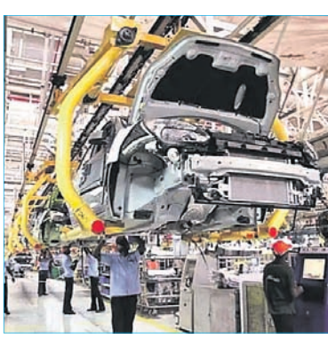
ପୂର୍ବ ବର୍ଷ ଏପ୍ରିଲ ଅପେକ୍ଷା ଚଳିତ ବର୍ଷ ସମାନ ଅବଧିରେ ଯାତ୍ରା ଯାନ ପଞ୍ଜୀକରଣରେ ୨୫% ବୃଦ୍ଧି ପାଇଛି। ୨୦୨୧ ଏପ୍ରିଲରେ ଏହା ୨,୧୦,୬୮୨ ଯାନ ଥିବାବେଳେ ଚଳିତ ବର୍ଷ ଏପ୍ରିଲରେ ଗାଡ଼ି ବିକ୍ରି ୧୧,୮୭,୭୭୧ ରହିଥିଲା।

ନୂଆଦିଲ୍ଲୀ, ୫।୫: ଯାନ ଚଳାଇ ଯିବା ପରେ ଦେଶରେ ଅଧିକ ଅପୋଗୋବାଲୁକ୍ତ ଚଳାଇ ଆସାଯିବାର (ଫାଡ଼ା) ପସ୍ତୁର ଦିଆଯାଇଥିବା ସୂଚନା ଅନୁସାରେ ଦେଶରେ ଗାଡ଼ିବିକ୍ରିର ଖୁବୁରା ବିକ୍ରି ପୂର୍ବ ବର୍ଷ ଏପ୍ରିଲ ଅପେକ୍ଷା ୩୭% ବୃଦ୍ଧିପାଇଛି। ଫାଡ଼ା ସୂଚନା ଅନୁସାରେ ଗତ ଏପ୍ରିଲରେ ଦେଶରେ ସମସ୍ତ ଶ୍ରେଣୀର ମୋଟ ୧୬,୨୭,୯୭୫ ଯାନ ଗାଡ଼ି ବିକ୍ରି ହୋଇଛି। ପୂର୍ବ ବର୍ଷ କୋଭିଡ୍ ୨୧ ଲକ୍ଷର କବଳିତ ଏପ୍ରିଲ ମାସରେ ଗାଡ଼ି ବିକ୍ରି ୧୧,୮୭,୭୭୧ ରହିଥିଲା।