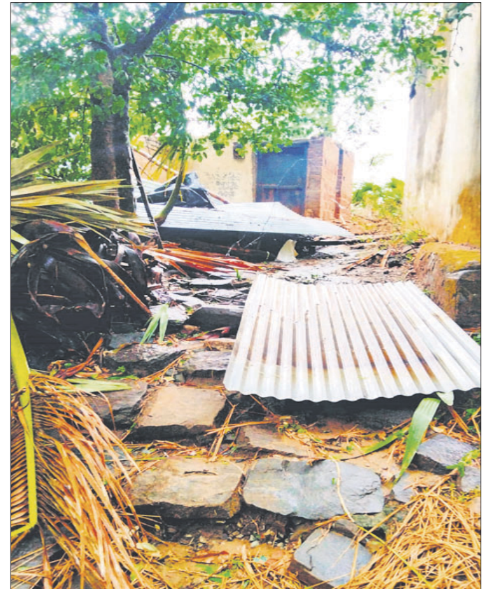
କ୍ଷତିଗ୍ରସ୍ତ ଘର ।