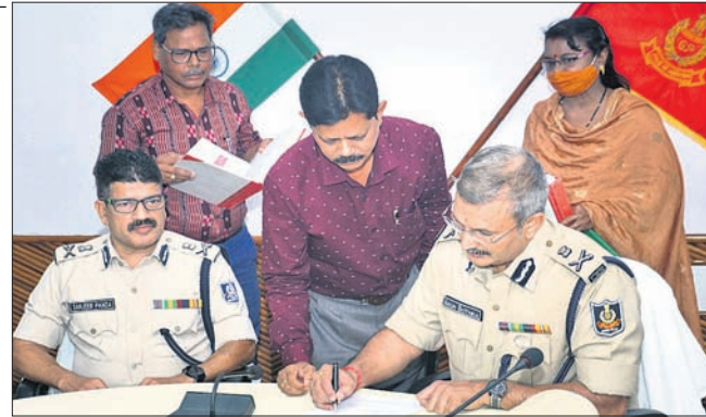
ଅଭିଭାବକ (ତାହାଣ୍ଡା) ଦାୟିତ୍ଵ ଗ୍ରହଣ କରୁଛନ୍ତି ।

କଟକ ଅଧିକାରୀ, ୬୫: କ୍ରୀଡ଼ାମନ୍ତ୍ରାଳୟ ଶ୍ରୀକ୍ଷ୍ମା ଦାୟିତ୍ଵ ନେଇ ଅଭିଭାବକ ଗ୍ରହଣ କରିଛନ୍ତି । ମୁଖ୍ୟ କାର୍ଯ୍ୟକାରୀଙ୍କ ଅଧିକାରୀଙ୍କୁ ତାଙ୍କୁ ଏହି ଦାୟିତ୍ଵ ହସ୍ତାନ୍ତର କରାଯାଇଛି । ଏହା ପୂର୍ବରୁ ଏହି ଅଧିକାର ନେଉଥିବା ଅଭିଭାବକ ନିକଟରେ ରାଜ୍ୟରେ ଅପରାଧର ସ୍ଥିତି ନିୟନ୍ତ୍ରଣରେ