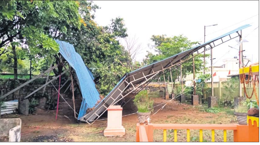
ବରଗଡ଼ ବ୍ରହ୍ମବିହାର ସ୍ଥିତ ଶ୍ରୀରାମ ମନ୍ଦିର କଲ୍ୟାଣ ମଣ୍ଡପ କ୍ଷତିଗ୍ରସ୍ତ ହୋଇଛି।