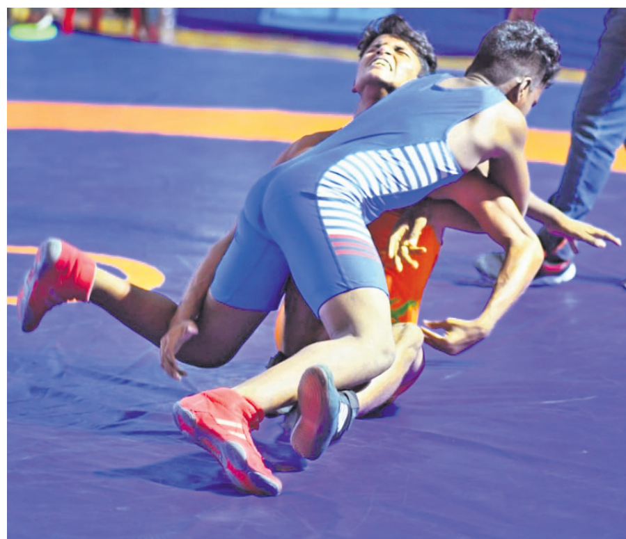
କଟକରେ ଶୁକ୍ରବାର ଅନୁଷ୍ଠିତ ରାଜ୍ୟ ଚେମ୍ପିୟନ୍ସ ଚାମ୍ପିୟନସ୍ଥିପରେ ଭୁଞ୍ଜି ପ୍ରତିଯୋଗୀଙ୍କ ମଧ୍ୟରେ ମୁକାବିଲା ।

ସୌରଭ ଘୋସାଲ ସେମିଫାଇନାଲରେ କ୍ଲ୍ୟୁଭର୍, ୬୫ (ପି.ଟି.): ଭାରତର ସ୍ଥାୟୀ ସ୍ପୋର ଖେଳାଳି ସୌରଭ ଘୋସାଲ ଚେମ୍ପିୟନ୍ସ ଚାମ୍ପିୟନସ୍ଥିପରେ ପ୍ରବେଶ କରିଛନ୍ତି ।