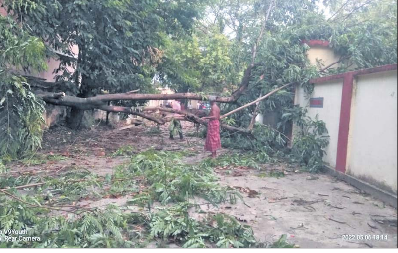
କାଳବୈଶାଖୀ ଯୋଗୁ ବରଗଡ଼ ଏସ୍ପି ଅଫିସ୍ ସମ୍ମୁଖ ଶକ୍ତି ନଗର ରାସ୍ତାରେ ଗଛ ଭାଙ୍ଗି ପଡ଼ିଛି।

ବୌଦ୍ଧ, ୬।୫ (ସ୍ୱ.ପ୍ର.): ବୌଦ୍ଧ ମୁଖ୍ୟତାଳ ଘରେ ନିଆଁ ଲାଗିଯାଇଥିବା ବେଳେ ଗୁରୁତ୍ୱପୂର୍ଣ୍ଣ କାରକପତ୍ର ଯୋଡ଼ି ନ ଥିବା ଜଣାପଡ଼ିଛି। ମୁଖ୍ୟତାଳଘର ଶୁକ୍ରବାର ପୂର୍ବାହ୍ନ ୧୧ଟାରେ କାରଖାନାରେ ଗ୍ରାହକଙ୍କ ଭିଡ଼ ଥିଲା। ଅନ୍ୟପଟେ ଜଣେ କର୍ମଚାରୀ ଝିଅ ବାହାଘର ପରେ କର୍ମଚାରୀମାନଙ୍କୁ ଭୋକି ଦେବାକୁ କାର୍ଯ୍ୟାଳୟର ଅନ୍ୟ ଏକ କୋଠାରେ ରୋଷେଇ ପ୍ରସ୍ତୁତ କରିଥିଲା। କର୍ମଚାରୀମାନେ ରୋଷେଇରେ ବ୍ୟସ୍ତଥିବାବେଳେ ହଠାତ ଅତିସ ଚିତରେ ଧୁଆଁ ଭରି ହୋଇଯାଇଥିଲା। ଗ୍ୟାସ ଲିକ୍ ହୋଇ ଚୁଲାରେ ହଠାତ ନିଆଁ ଲାଗିଯାଇଥିଲା। ମୁଖ୍ୟ ତାଳଘର ଭିତରୁ ନିଆଁ ଚିତ୍କାର ଶୁଣି ଗ୍ରାହକମାନେ କାମେ ବଞ୍ଚାଇବାକୁ ଯିବ ଯୁଆତେ ଧାର୍ଣ୍ଣ ବାହାରକୁ ପଳାଇଯାଇଥିଲେ। ଜଣେ ବ୍ୟକ୍ତି ସାହାଯ୍ୟ କରି ଭିତରକୁ ଯାଇ ଗ୍ୟାସ ବନ୍ଦ କରିଥିଲେ। ଘର ନିଆଁକୁ ଆୟତ୍ତ କରିବାରେ ସକ୍ଷମ ହେଲା। ତେବେ ଲାଗିଥିବା ନିଆଁରେ ଗୋଟିଏ ଆଇମାଗାର ବିଲ୍ଡିଂ ଏବଂ ଗୋଷ୍ଠରେ ହେଉଥିବା ବେଶ ପୋଡି ଯାଇଥିବା ଜଣାଯାଇଛି। ଜିଲାର ମୁଖ୍ୟ ତାଳଘର କର୍ମଚାରୀଙ୍କ ବେପୁରୁଆ ମନକୁ ଦିଯୋଗୁ ଏକ ବଡ଼ ଦୁର୍ଘଟଣା ଘଟିବାକୁ ଯାଇଥିଲା। ଏହାର ଉପଯୁକ୍ତ ତଦନ୍ତ କରାଯାଇ ତାଳଘର ଦାୟିତ୍ୱହୀନ ଅଧିକାରୀ ଓ କର୍ମଚାରୀଙ୍କ ବିରୋଧରେ ଦୃଷ୍ଟାନ୍ତମୂଳକ କାର୍ଯ୍ୟାନୁଷ୍ଠାନ ଗ୍ରହଣ କରିବାକୁ ବୁଦ୍ଧିଜୀବୀ ମହଲରେ ମତପ୍ରକାଶ ପାଉଛି।