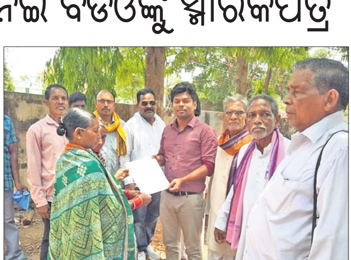
ଖପ୍ରାଖୋଲ ବିଡିଓଙ୍କୁ ମାଳପଡ଼ା ଖର୍ଡ଼ ସଭ୍ୟାସଭ୍ୟ ଦାବିପତ୍ର ପ୍ରଦାନ କରୁଛନ୍ତି। କରାଯିବା ତଥା ମାଳପଡ଼ାରେ ପଞ୍ଚାୟତ ଗୃହ ନିର୍ମାଣ ନ କରି ମଧ୍ୟ ଭାଗରେ ଗୃହ ନିର୍ମାଣ କରିବା ଲତ୍ୟାଦି ଉପରେ ଭଦ୍ର ବୈଠକରେ ଆଲୋଚନା କରି ଏକ ରିକ୍ୟୁଲେସନ ପାସ୍ କରାଯାଇଛି। ପଞ୍ଚାୟତ ଅଧିନ ଫୁଲ୍‌ଝର ଗ୍ରାମର ଗୋଷ୍ଠୀ କେନ୍ଦ୍ରରେ ଗତ ୫ତାରିଖ ଏକ ମାସିକ ବୈଠକ କରିଥିଲେ। ମାଳପଡ଼ା ସଦର ମହକୁମାଠାରେ ପିଡିଏସ୍ ଚାରୁକ ବନ୍ଧନ ପରିବର୍ତ୍ତେ ଫୁଲ୍‌ଝରରେ ବନ୍ଧନ