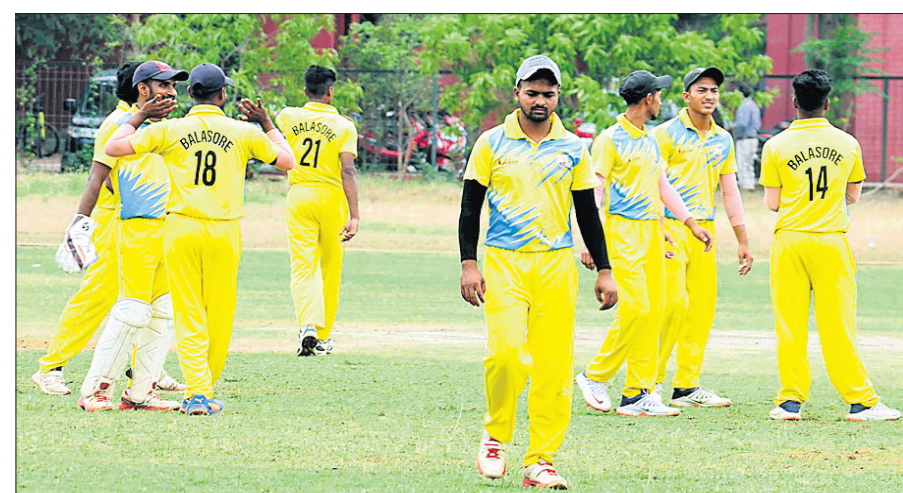
ମ୍ୟାଚ ଚିତ୍ରିତାପରେ ବାଲେଶ୍ଵର ଦଳର ଖେଳାଳି ।

ଘରୋଇ ଟ୍ରିକେଟର ମର୍ଯ୍ୟାଦାନୁସାରେ କଳାହାଣ୍ଡି କପ୍‌ରେ ଲିଗ୍ ପର୍ଯ୍ୟାୟ ଶେଷ ହୋଇଛି । କଟକ, ଭୁବନେଶ୍ଵର ଓ ଖୋର୍ଦ୍ଧାର ବିଜିତ ଭେଙ୍ଗୁରେ ମୋଟ ୯୯ଟି ଲିଗ୍ ମ୍ୟାଚ ସଫଳତାର ସହ ସମ୍ପନ୍ନ ହୋଇଛି ।