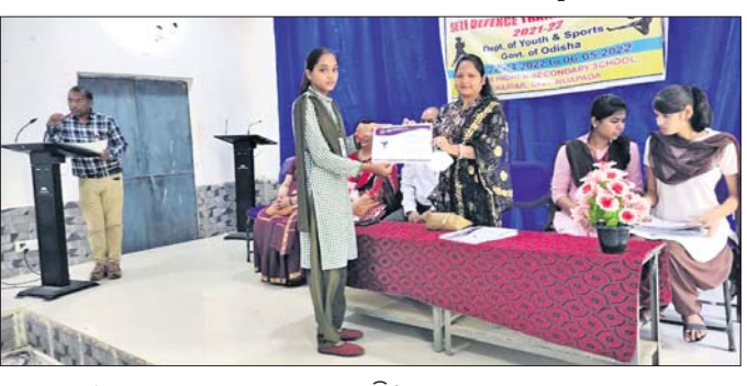
ଜଣେ ସାମାଜିକ ପ୍ରଶଂସାପତ୍ର ପ୍ରଦାନ କରାଯାଇଛି।