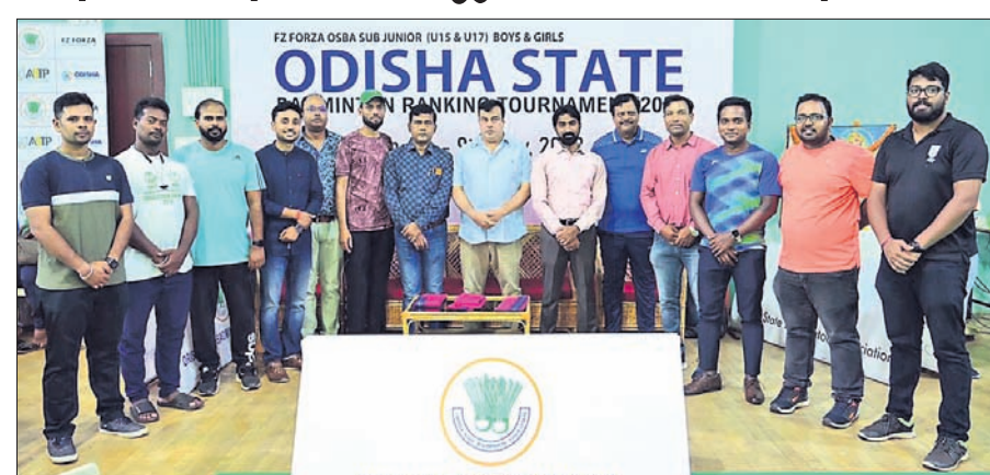
ଉଦ୍ଘାଟନା ଉତ୍ସବରେ ଉପସ୍ଥିତ ଅତିଥି ଓ କର୍ମକର୍ତ୍ତା ।