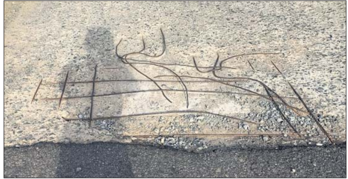
ଖବଦାକନା ଶୋଚନୀୟ ପୋଲ। କରୁନାହନ୍ତି। ଫଳରେ ଯାତ୍ରୀମାନଙ୍କ ବାଉଜ୍ ପୋଲର ଲୁହାରତରେ ବାଜି ପଶୁଟ କରା ହେବା ସହ ବୁର୍ଜାଛକାମାନ ଘଟୁଛି ନିକ୍ଷତି। ଆବୃତ୍ତାତ ସମ୍ମୁଖୀନ ହେଉଥିବା ସେ ଜଣାଇଛନ୍ତି। ଏଥିପ୍ରତି ବିଭାଗୀୟ କର୍ତ୍ତୃପକ୍ଷ ଥିବାରୁ ଯାତ୍ରୀମାନେ ବିଶେଷ ହଇରାଣ ହରକତ ହେଉଛନ୍ତି। ଶୁକ୍ରବାର ବୁର୍ଜାଛକରୁ

ବଲାଙ୍ଗୀର ଜିଲ୍ଲା ଲୋଇସିଂହା ଥାନା ଅନ୍ତର୍ଗତ ବୁର୍ଜାଛକରୁ ଅଳ୍ପନିପୁର ରାସ୍ତାର ଖବଦାକନା ପୋଲ ଶୋଚନୀୟ ହୋଇ ପଡିଛି। ପୋଲ ଶୋଚନୀୟ ଯୋଗୁ ବୁର୍ଜାଛକାରୁ ଯାତ୍ରୀ ଏହାକୁ ନେଇ ଯାତ୍ରୀ ମହଲରେ ଅସନ୍ତୋଷ ପ୍ରକାଶ ପାଇଛି। ବଲାଙ୍ଗୀର-ବରଗଡ଼ ୨୬୧ମ୍. ଜାତୀୟ ରାଜପଥ ବୁର୍ଜାଛକ ଭାୟା ଅଳ୍ପନିପୁର ଦେଇ ଯୋଗୁର ସହରକୁ ରାସ୍ତା ସଂଯୋଗକରଣ ରହିଛି। ପିଡିଏସ୍ ରାସ୍ତାର ବୁର୍ଜାଛକରୁ ପ୍ରାୟ ୧୫ କିମି ଗଲେ ପଡେ ଖବଦାକନା ପୋଲ। ଏଠାରେ ଜିଇ ବର୍ଷ ତଳେ ପୋଲ ନିର୍ମାଣ ହୋଇଥିଲା। ନିମ୍ନମାନର କାମ ଯୋଗୁ ପୋଲ ଛାତର କଞ୍ଚିତ ସବୁ ଉଠି ଲୁହାରତ ବେଶାଯାଇଛି। ବିଭାଗୀୟ କର୍ତ୍ତୃପକ୍ଷ ଏହାର ମରାମତି ଦିଗରେ ପଦକ୍ଷେପ ଗ୍ରହଣ