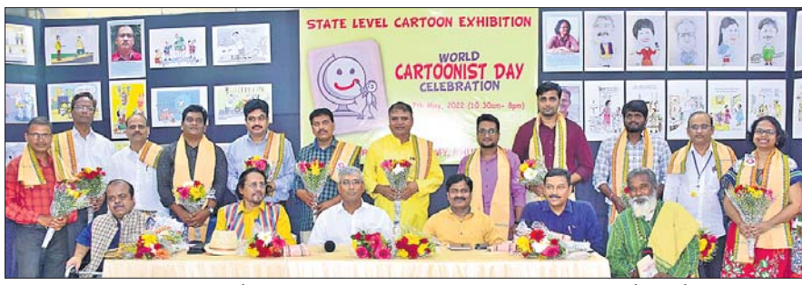
ପୁଣ୍ୟମନ୍ଦିର ପ୍ରମୁଖ ପରାମର୍ଶଦାତା ଅଧିକାରୀ ଉପାଧ୍ୟକ୍ଷ ଓ ଅନ୍ୟ ଅତିଥିଙ୍କ ସହ ସମ୍ବନ୍ଧିତ କାର୍ତ୍ତୁନିଷ୍ଠମାନେ।

ଓଡ଼ିଶା କାର୍ତ୍ତୁନିଷ୍ଠ ଏକାଡେମୀ ପକ୍ଷରୁ ୨ଦିନିଆ ପ୍ରଦର୍ଶନୀ