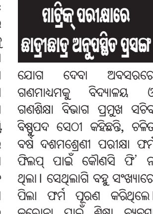
ମାଟ୍ରିକ ପରୀକ୍ଷାରେ ଛାତ୍ରଛାତ୍ରୀ ଅନୁପସ୍ଥିତ ସୂଚକ

ଭୁବନେଶ୍ୱର, ୬୫ (ବ୍ୟୁରୋ): ଚଳିତ ବର୍ଷ ମାଟ୍ରିକ ପରୀକ୍ଷାରେ ବଡ଼ ଧରଣର ତ୍ରୁଟି ଦେଖିବାକୁ ମିଳିଛି । ଫର୍ମ ଫିଲ୍‌ଅପ୍ କରିଥିବା ସବୁ ପରୀକ୍ଷାରେ ଅନେକ ପିଲା ଅନୁପସ୍ଥିତ ରହିଥିବା ଜଣାପଡ଼ିଛି । ଯାହାକୁ ନେଇ ରାଜ୍ୟ ଶିକ୍ଷା ବ୍ୟବସ୍ଥା ଉପରେ ପ୍ରଶ୍ନବାଦୀ ମୁଣ୍ଡ ହୋଇଥିବାବେଳେ ଶୁକ୍ରବାର ଏସମ୍ପର୍କରେ ବିଭାଗୀୟ ପ୍ରମୁଖ ସଚିବ ନିଜର ମତ ରଖିଛନ୍ତି । ଉକ୍ତ ବିଶ୍ୱବିଦ୍ୟାଳୟ ହାଇସ୍କୁଲର ବହୁମୁଖୀ ହଲର ଭୂମି ପୂଜନ ଉତ୍ସବରେ