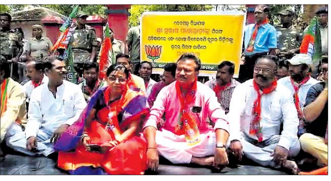
ଭାଜପା କର୍ମକର୍ତ୍ତା ଧାରଣାରେ ବସିଛନ୍ତି।

ସରକାର ପରୋକ୍ଷରେ ଏହାକୁ ପ୍ରୋତ୍ସାହିତ କରିଛନ୍ତି। ବିଧାୟକ ଏବଂ ବିଡ଼ିଓଙ୍କ ମଧ୍ୟରେ ସମନ୍ୱୟ ଆଭାବରୁ ଏଭଳି ପରିସ୍ଥିତି ସୃଷ୍ଟି ହୋଇଛି।