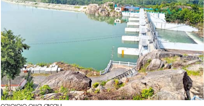
ଘୋଡ଼ାହାଡ଼ ତ୍ୟାଗ ପଟେ।