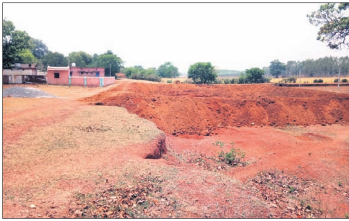
ସ୍କୁଲ ଓ ଅଙ୍ଗନୂପାତି କେନ୍ଦ୍ର ପାଖରେ ଖୋଳାଯାଇଥିବା ପୋଖରୀ।

ନବରଙ୍ଗପୁର ଜିଲ୍ଲା ରାଇଘର ବୁକ୍ ବୋର୍ଡ଼ଦ୍ୱାରା ପଞ୍ଚାୟତ ଚୋରବେଡ଼ା ଗ୍ରାମରେ ଥିବା ବିଦ୍ୟାଳୟର ଓ ଅଙ୍ଗନୂପାତି କେନ୍ଦ୍ର ପାଖରେ ଠାକୁ ମାତ୍ର ଦଶ ହାତ ଦୂରତା ମଧ୍ୟରେ ଏକ ବଡ଼ ପୋଖରୀ ଖୋଳାଯାଇଛି। ପିଲାମାନଙ୍କ ଯିବାଆସିବା ଏତେବଡ଼ ପୋଖରୀ ନିର୍ମାଣ କରିବା ଘଟଣାକୁ ନେଇ ସବୁ ମହଲରେ ଅସନ୍ତୋଷ ପ୍ରକାଶ ପାଇଛି। ଏତେ ବଡ଼ ପୋଖରୀ ଯେଉଁସି ଦ୍ୱାରା ଖନନ