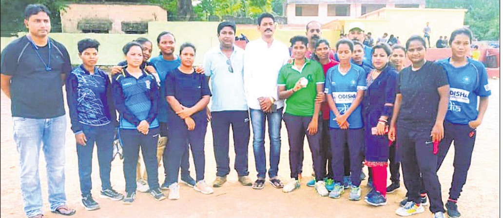
୧-୨୦ କୁ ମନୋନୀତ ହୋଇଥିବା ମହିଳା କ୍ରିକେଟ ଟିମ୍ ଖେଳାଳି।

ମାଲକାନଗିରି, ୬୫(ଡି.ଏନ୍.ଏ.)- କଟକରେ ଆୟୋଜିତ ହେବାକୁ ଥିବା ୧-୨୦ ଝିନିଆ କ୍ରିକେଟ ଟୁର୍ନାମେଣ୍ଟରେ ମାଲକାନଗିରି ଜିଲ୍ଲାର ମହିଳା କ୍ରିକେଟ ଟିମ୍ ଖେଳାଳି ସାମିଲହେବା ସୁଯୋଗ ପାଇଛି। ଏହି ଟୁର୍ନାମେଣ୍ଟରେ ବିଭିନ୍ନ ସ୍ଥାନରୁ ୨୪ଟି ଦଳ ଭାଗ ନେଇଛନ୍ତି। ଶୁକ୍ରବାର ଏହି ଖେଳାଳିମାନେ କଟକ ୧-୨୦ ଝିନିଆ କ୍ରିକେଟ ଟୁର୍ନାମେଣ୍ଟରେ ମାଲକାନଗିରି ଜିଲ୍ଲାର ମହିଳା କ୍ରିକେଟ ଟିମ୍ ଖେଳାଳି ସାମିଲହେବା ସୁଯୋଗ ପାଇଛନ୍ତି। ଏହି ଟୁର୍ନାମେଣ୍ଟରେ ବିଭିନ୍ନ ସ୍ଥାନରୁ ୨୪ଟି ଦଳ ଭାଗ ନେଇଛନ୍ତି। ଶୁକ୍ରବାର ଏହି ଖେଳାଳିମାନେ କଟକ ୧-୨୦ ଝିନିଆ କ୍ରିକେଟ ଟୁର୍ନାମେଣ୍ଟରେ ମାଲକାନଗିରି ଜିଲ୍ଲାର ମହିଳା କ୍ରିକେଟ ଟିମ୍ ଖେଳାଳି ସାମିଲହେବା ସୁଯୋଗ ପାଇଛନ୍ତି। ଏହି ଟୁର୍ନାମେଣ୍ଟରେ ବିଭିନ୍ନ ସ୍ଥାନରୁ ୨୪ଟି ଦଳ ଭାଗ ନେଇଛନ୍ତି। ଶୁକ୍ରବାର ଏହି ଖେଳାଳିମାନେ କଟକ ୧-୨୦ ଝିନିଆ କ୍ରିକେଟ ଟୁର୍ନାମେଣ୍ଟରେ ମାଲକାନଗିରି ଜିଲ୍ଲାର ମହିଳା କ୍ରିକେଟ ଟିମ୍ ଖେଳାଳି ସାମିଲହେବା ସୁଯୋଗ ପାଇଛନ୍ତି।