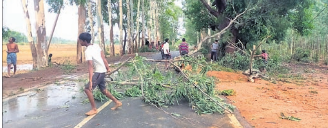
ଗ୍ରାମବାସୀ ରାସ୍ତାକୁ ଗଛ ହଟାଉଛନ୍ତି।

ନବରଙ୍ଗପୁର ଜିଲା ଝରିଗାଁ ବ୍ଲକ୍‌ରେ ଶୁକ୍ରବାର ଅପରାହ୍ନରେ କାଳ ବୈଶାଖୀ ପ୍ରଭାତରେ କୋରରେ ପବନ ବହିବା ସହ ବର୍ଷା ହୋଇଥିଲା। ଫଳରେ ଝରିଗାଁ ଉପରକୋଟ ମୁଖ୍ୟ ରାସ୍ତା କଡ଼ରେ ଶତାଧିକ ଗଛ ଭାଙ୍ଗିଥିଲା। ଧନପୁର ଗ୍ରାମ ନିକଟରେ ଏକ ବନ୍ଦ ଦୋକାନ ଘର ଛାଡ଼ି ଉପରେ ନୀଳଗିରି ଗଛ ଭାଙ୍ଗି ପଡ଼ିଥିଲା। ଏହାଦ୍ୱାରା ଯାତାୟତ ବନ୍ଦ ଥିଲା। ବର୍ଷା ପନ କମିବା ମାତ୍ରେ ସିନ୍ଧୁଗୁଡ଼ା, ଅଞ୍ଚଳ, ଏକାଧି, ଧନପୁର ଆଦି ଗ୍ରାମର ଲୋକେ ରାସ୍ତା ମଧ୍ୟରେ ପଡ଼ି ରହିଥିବା ଗଛ କାଟି ସଫା କରିଥିଲେ। ଏହା ପରେ ଯାତାୟତ ସ୍ୱାଭାବିକ ହୋଇଥିଲା।