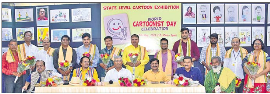
ପୁଣ୍ୟମନ୍ତ୍ରାଳୟ ପ୍ରମୁଖ ପରାମର୍ଶଦାତା ଅଧିକାରୀ ଉପାଧ୍ୟକ୍ଷ ଓ ଅନ୍ୟ ଅତିଥିଙ୍କ ସହ ସମ୍ବନ୍ଧିତ କାର୍ତ୍ତୁନିଷ୍ଠମାନେ।

ଓଡ଼ିଶା କାର୍ତ୍ତୁନିଷ୍ଠ ଏକାଡେମୀ ପକ୍ଷରୁ ୨ଦିନିଆ ପ୍ରଦର୍ଶନୀ