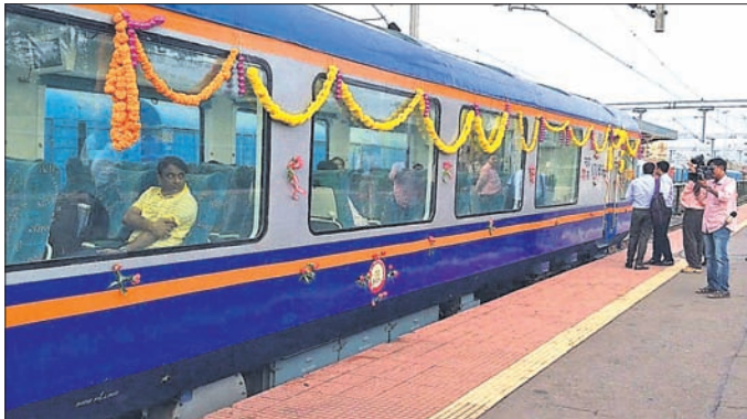
ବିଶାଖାପାଟଣା-କୋରାପୁଟ ପାସେଞ୍ଜର ଟ୍ରେନ୍‌ରେ ସଂଯୋଗ ହେବାକୁ ଥିବା ଭିକ୍ଷାତମ୍ କୋର୍।

ଏଣିକି ଅଭିଭକ୍ତ କୋରାପୁଟ ଜିଲାର ପ୍ରାକୃତିକ ସୌନ୍ଦର୍ଯ୍ୟକୁ ଟ୍ରେନ୍‌ରୁ ମନଭରି ଉପଭୋଗ କରିପାରିବେ ପର୍ଯ୍ୟଟକ। ଏଥିପାଇଁ ବିଶାଖାପାଟଣା-କୋରାପୁଟ ଏବଂ କୋରାପୁଟ-ବିଶାଖାପାଟଣା ପାସେଞ୍ଜର ଟ୍ରେନ୍‌ରେ ସଂଯୋଗ ହେବ ଆଇସିଏମ୍ ଭିକ୍ଷାତମ୍ (ଶୀତତାପ ନିୟନ୍ତ୍ରିତ)କୋର୍। ମେ ୯ରୁ ଅଗଷ୍ଟ ୮ ପର୍ଯ୍ୟନ୍ତ ସ୍ୱତନ୍ତ୍ର କୋର୍ ଚାଲିବ। ସହ ଏହି ଟ୍ରେନ୍ ବିଶାଖାପାଟଣାରୁ କୋରାପୁଟ ଚଳାଟଳ କରିବ। ସେହିପରି ମେ ୧୦ରୁ ଅଗଷ୍ଟ ୯ ପର୍ଯ୍ୟନ୍ତ ଏହା କୋରାପୁଟରୁ ବିଶାଖାପାଟଣା ଚଳାଟଳ କରିବ ବୋଲି ଭିକ୍ଷାତମ୍ କର୍ମସୂଚୀ ମଧ୍ୟାହ୍ନରେ ୧୫ କେ. ଟ୍ରିପ୍‌ଠା ସୂଚନା ଦେଇଛନ୍ତି। ଭିକ୍ଷାତମ୍ କୋର୍‌ରେ ସ୍ୱତନ୍ତ୍ର କାଚ ଝରକା ଲାଗିଥିବାବେଳେ ଆରୋମାୟକ ବ୍ୟବସ୍ଥା ରହିଛି। ବିଶେଷକରି