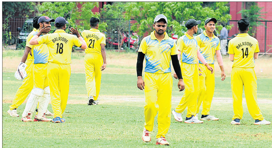
ମ୍ୟାଚ ଚିତ୍ରାପତରେ ବାଲେଶ୍ୱର ଦଳର ଖେଳାଳି ।

ଘରୋଇ କ୍ରିକେଟର ମର୍ଯ୍ୟାଦାଜନକ ଚୁର୍ନାମେଷ୍ଟ କଳାହାଣ୍ଡି କପ୍‌ର ଲିଗ୍ ପର୍ଯ୍ୟାୟ ଶେଷ ହୋଇଛି । କଟକ, ଭୁବନେଶ୍ୱର ଓ ଖୋର୍ଦ୍ଧାର ବିଭିନ୍ନ ଭେକ୍ଟରରେ ମୋଟ ୯୯ଟି ଲିଗ୍ ମ୍ୟାଚ ସଫଳତାର ସହ ସମ୍ପନ୍ନ ହୋଇଛି । ଓଡ଼ିଶା କ୍ରିକେଟ ଆସୋସିଏସନ (ଓସିଏ) ସହ ଅନୁବନ୍ଧିତ ୩୭ଟି ଅନୁବନ୍ଧିତ ଯୁନିଟର ଖେଳାଳିମାନେ ଲିଗ୍ ପର୍ଯ୍ୟାୟରେ ସେମାନଙ୍କ ପ୍ରତିଭା ପ୍ରଦର୍ଶନର ସୁଯୋଗ ପାଇଥିଲେ ।