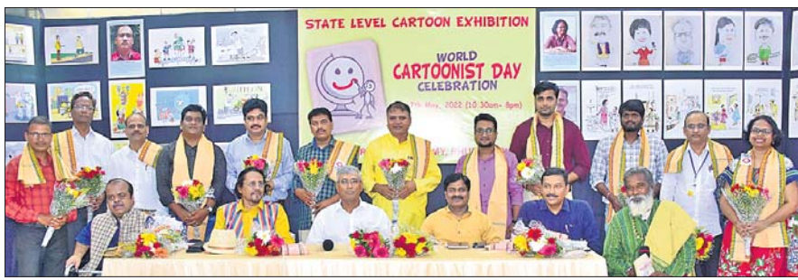
ପୁଣ୍ୟମନ୍ଦୀର ପ୍ରମୁଖ ପରାମର୍ଶଦାତା ଅଧିକାରୀ ଉପାଧ୍ୟକ୍ଷ ଓ ଅନ୍ୟ ଅତିଥିଙ୍କ ସହ ସମ୍ବନ୍ଧିତ କାର୍ତ୍ତୁନିଷ୍ଠମାନେ।

ଓଡ଼ିଶା କାର୍ତ୍ତୁନିଷ୍ଠ ଏକାଡେମୀ ପକ୍ଷରୁ ୨ଦିନିଆ ପ୍ରଦର୍ଶନୀ