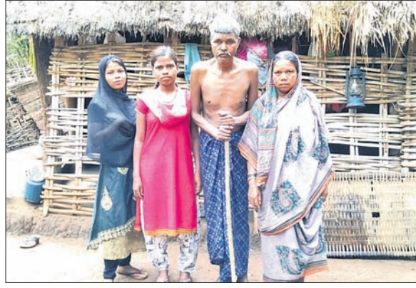
ପରିବାର ସହ କାର୍ଡ ଆଇ ବି ମିଲୁନି ସେବା ପ୍ରଦାନ କରାଯାଇଛି