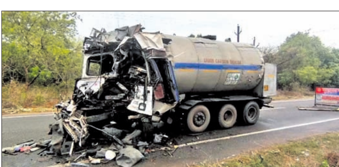
ଦୁର୍ଘଟଗ୍ରସ୍ତ ଗ୍ୟାସ୍ ଗାଡ଼ି। ଟ୍ରକ୍ ପଛପଟରୁ ଧକ୍କା ଦେଇଥିଲା। ଫଳରେ ଗ୍ୟାସ୍ ଲିକ୍ ହୋଇଥିଲା। ଅଜ୍ଞାନକାମୀ ଗ୍ୟାସ୍ ଲିକ୍ ଯୋଗୁଁ ଲୋକେ ଅଶାନ୍ତିଶାସ୍ତ୍ରୀ ହୋଇପଡ଼ିଥିଲେ। ଏ ନେଇ ଅଜ୍ଞାନକାମୀ ଗ୍ୟାସ୍ ଲିକ୍ ହୋଇଥିଲା।

ନୟାଗଡ଼ ଅଫିସ, ୬:୫୫ ନୟାଗଡ଼ ଜିଲ୍ଲା ରଣପୁର ଥାନା ରାଜ ପୁନାଖଳା ଫାଟି ପୋଲିସ ଗୁରୁବାର ବିଳମ୍ବିତ ରାତିରେ ଡେରିରେ ପହଞ୍ଚି କମ୍ପାନୀ କର୍ମଚାରୀଙ୍କୁ ଡକାଇ ଅଜ୍ଞାନକାମୀ ଗ୍ୟାସ୍ ଲିକ୍ ବନ୍ଦ କରାଯାଇଥିଲା। ପରେ ଶୁକ୍ରବାର ଭୋର ୫୭ ନଂ. ବଲାଙ୍ଗୀର-ଖୋର୍ଦ୍ଧା ଜାତୀୟ ରାଜପଥରେ ଯାନ ବାହାନ ଚଳାଚଳ ସ୍ୱାଭାବିକ ହୋଇଥିଲା।