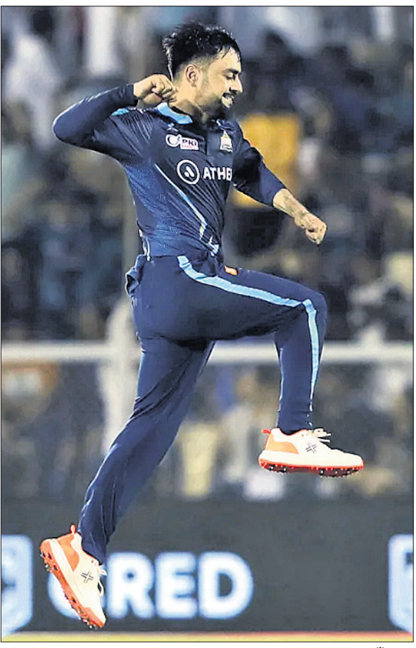
ଭାଇକେଟ ନେବାପରେ ଭାଇସିଟ ଗୁଜୁରାଟ ଟାଇଟାନ୍ସର ରଣିଦ ଖାଁ।

ପୂର୍ଣ୍ଣ, ୨୫ ଶେଷ ଓଭରରେ ୯ ରନ କରିପାରିଲାନି ଗୁଜୁରାଟ ଟାଇଟାନ୍ସ। ତେଣୁ ଓଭରରେ ତାହାକୁ ସାମ୍ରାଜ୍ୟ ଦେବାକୁ ପଡ଼ିଲା।