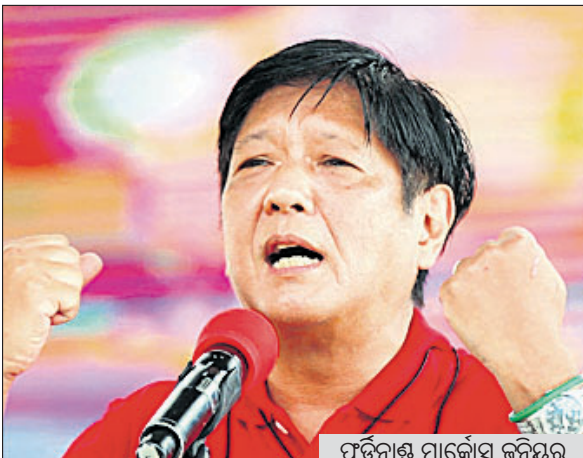
ଫର୍ଦିନାଣ୍ଡ ମାର୍କୋସ୍ ଜୁନିୟର

ଦକ୍ଷିଣପୂର୍ବ ଏସୀୟ ରାଷ୍ଟ୍ର ଫିଲିପାଇନ୍ସ ମେ' ୯ରେ ନୂଆ ରାଷ୍ଟ୍ରପତି ବାଛିବ। ୧୯୩୫ ମସିହାରୁ ଚାଲିଥିବା ସାଧାରଣ ନିର୍ବାଚନରେ ଏଥର ସପ୍ତଦଶ ରାଷ୍ଟ୍ରପତି ଓ ସୋଡ଼ଶ ଉପରାଷ୍ଟ୍ରପତି ନିର୍ବାଚିତ ହେବେ। ୧୯୮୭ରେ ପ୍ରଶାସିତ ଫିଲିପାଇନ୍ସ ସମ୍ବିଧାନ ଅନୁଯାୟୀ ବର୍ତ୍ତମାନର ରାଷ୍ଟ୍ରପତି ରୋଡ୍ରିଗୋ ଡୁଟେରଟେ ପୁନଃ ପ୍ରତିସ୍ପନ୍ଧିତା କରିବାକୁ ଅଯୋଗ୍ୟ। କିନ୍ତୁ ଉପରାଷ୍ଟ୍ରପତି ଲେନି ରୋବ୍ରେଡୋ ପ୍ରତିସ୍ପନ୍ଧିତା କରିପାରିବେ। ତେଣୁ ସେ ରାଷ୍ଟ୍ରପତି ନିର୍ବାଚନ ପାଇଁ ଭାଗ୍ୟ ପରୀକ୍ଷା କରୁଛନ୍ତି। ଏଥର ଦୁଇଟି ଭିନ୍ନ ରାଜନୈତିକ ଦଳକୁ ରାଷ୍ଟ୍ରପତି ଓ ଉପରାଷ୍ଟ୍ରପତି ନିର୍ବାଚିତ ହୋଇପାରନ୍ତି। ଦେଶରେ ପ୍ରଥମ ଥର ପାଇଁ ଏପରି ରାଷ୍ଟ୍ରପତି ନିର୍ବାଚନ ହେଉଛି, ଯେଉଁଠି ପ୍ରତିସ୍ପନ୍ଧିତା କରୁଥିବା ସମସ୍ତ ପ୍ରାର୍ଥୀ ଦ୍ୱିତୀୟ ବିଷ୍ଣୁକ୍ଷେତ୍ର ପରେ ଜିତିବେ। ଫିଲିପାଇନ୍ସ ପ୍ରେସିଡେନ୍ସି ପାଇଁ ଘୋଡ଼ାଦୌଡ଼ ଆରମ୍ଭ ହୋଇଛି। ସୋମବାର ହେବାକୁ ଥିବା ଏହି ଦୌଡ଼ରେ ଆଗରେ ରହିଛନ୍ତି ବର୍ତ୍ତମାନର ଉପରାଷ୍ଟ୍ରପତି ଲେନି ରୋବ୍ରେଡୋ ଏବଂ