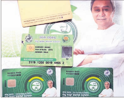
ସ୍ୱା ରମଣୀ ଭୋଇଙ୍କୁ ମିଳୁଥିବା ବିଜୁ ସ୍ୱାସ୍ଥ୍ୟ କାର୍ଡ