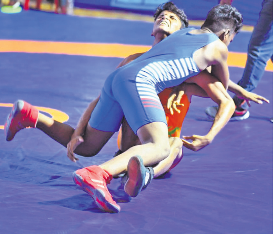
କଟକରେ ଶୁକ୍ରବାର ଅନୁଷ୍ଠିତ ରାଜ୍ୟ ଚେମ୍ପିୟନ୍ସ ଚାମ୍ପିୟନଶିପ୍ରେ ବୁଲ ପ୍ରତିଯୋଗୀଙ୍କ ମଧ୍ୟରେ ପୂଜାବିଳା ।

ସୌରଭ ଘୋସାଲ ସେମିଫାଇନାଲରେ କ୍ଷୁଦ୍ଧ, ୬୫ (ପି.ଟି.): ଭାରତର ସ୍ଥାନ ସ୍ଥାଣ ଖେଳାଳି ସୌରଭ ଘୋସାଲ ଚେମ୍ପିୟନ୍ସ ଚାମ୍ପିୟନଶିପ୍ରେ ସେମିଫାଇନାଲରେ ପ୍ରବେଶ କରିଛନ୍ତି । ଚିନି ବର୍ଷରେ ପ୍ରଫେସନାଲ ରୂପରେ ଘୋସାଲଙ୍କର ଏହା ହେଉଛି ବଡ଼ ସେମିଫାଇନାଲ । ଘୋସାଲ ଆଇକନିକ ଗ୍ରାଣ୍ଡ ସେଣ୍ଟ୍ରାଲ ଚମ୍ପିୟନଶିପ୍ରେ ଏକ କ୍ୱାର୍ଟରଫାଇନାଲ ମ୍ୟାଚରେ ସେ ଚାକ୍ରାଠୁ ଉଚ୍ଚ ର୍ୟାଙ୍କିଙ୍ଗ୍ ପ୍ରାପ୍ତ ଭାବେ ପ୍ରବେଶ କରିଛନ୍ତି । ୧୧-୮, ୭-୧୧, ୯-୧୧, ୧୧-୭, ୧୧-୯ରେ ପରାସ୍ତ କରିଛନ୍ତି । ବିଶ୍ୱର ୧୭ ନମ୍ବର ର୍ୟାଙ୍କିଙ୍ଗ୍ ପ୍ରାପ୍ତ ଭାରତୀୟ ଖେଳାଳି ଚାକ୍ରାଠୁ ବୟସରେ ବହୁ ସାନ ଇଣ୍ଡିଆନ୍ ଡିପାର୍ଟମେଣ୍ଟ ଚାକ୍ରର ସମସ୍ତ ଅଭିଜ୍ଞତା ଖଟାଇ ବିଜୟ ହାସଲ କରିଥିଲେ । ସେମିଫାଇନାଲରେ ସେ ପେଡ୍ରୋ ଡିଏସୋ ଏଲିଆସ୍କୁ ଭେଟିବେ ।