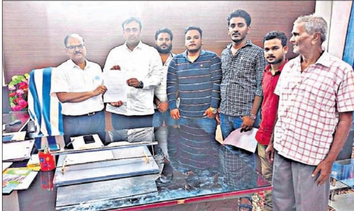
ଖଣ୍ଡପଡ଼ା ବିକାଶ ମଞ୍ଚ ପକ୍ଷରୁ ସୂଚନା ଦେଇ ଖଣ୍ଡପଡ଼ା ବିକାଶ ମଞ୍ଚର ସହଯୋଗ ମହିଳାମାନଙ୍କୁ ପ୍ରଦାନ କରାଯାଇଛି

କର୍ମିଣୀ ସରକାରୀ ସ୍ୱାସ୍ଥ୍ୟକେନ୍ଦ୍ରରେ ସ୍ତ୍ରୀମାନଙ୍କୁ ଡାକ୍ତର ନିୟୁକ୍ତି ପାଇଁ ଗୁରୁତ୍ୱ ଦେଇ ଖଣ୍ଡପଡ଼ା ବିକାଶ ମଞ୍ଚ ପକ୍ଷରୁ ନୟାଗଡ଼ ଜିଲ୍ଲା ମୁଖ୍ୟ ଚିକିତ୍ସାଧିକାରୀଙ୍କୁ ଏକ ଦାବିପତ୍ର ପ୍ରଦାନ କରାଯାଇଛି। ଏକେ ଖୁବ୍‌ଶୀଘ୍ର ଜଣେ ଡାକ୍ତର ପଦବୀ ପୂରଣ ଖାଇ ପଦକ୍ଷେପ ଗ୍ରହଣ କରାଯିବ ବୋଲି ସୂଚନା ଦେଇଥିବା ଜଣାଯାଇଛି। ପ୍ରକାଶ ଯେ, ଖଣ୍ଡପଡ଼ା ବ୍ଲକ୍ ଅନ୍ତର୍ଗତ କର୍ମିଣୀ ସରକାରୀ ପ୍ରାଥମିକ ସ୍ୱାସ୍ଥ୍ୟକେନ୍ଦ୍ର ଉପରେ ଖଣ୍ଡପଡ଼ା ଓ ଭାପୁର ବ୍ଲକ୍ ଅଧୀନ ଉଚ୍ଚି ପଞ୍ଚାୟତର ଜନସାଧାରଣ ସ୍ୱାସ୍ଥ୍ୟସେବା ପାଇଁ ନିର୍ଭର କରିଆସି ଆପରାଧକର ରୁକ୍ ଅଧୀନରେ ଥିବା ବିଭିନ୍ନ ଅଞ୍ଚଳରେ କାଦିନ ରୋଗରେ ଆକ୍ରାନ୍ତ ସଂଖ୍ୟା ବୃଦ୍ଧି ପାଇଥିବା ବେଳେ ସମ୍ପୂର୍ଣ୍ଣ ସ୍ୱାସ୍ଥ୍ୟକେନ୍ଦ୍ରର ଅପଗ୍ରୋଡେଶନର ଆବଶ୍ୟକତା ରହିଛି। ସେହିପରି ସରକାରୀ ନିୟମାନୁସାରେ ଏହି ସ୍ୱାସ୍ଥ୍ୟକେନ୍ଦ୍ରରେ ମାସିକ ୨୦ଜଣ ମହିଳାଙ୍କ ପ୍ରତି ଡାକ୍ତର ନିୟୁକ୍ତି ଘଟଣା ପ୍ରଦାନ ୨ଜଣ ଡାକ୍ତର ରହିବାର ଆବଶ୍ୟକତା ରହିଛି। ମାତ୍ର ଦୀର୍ଘ ବର୍ଷ ହେଲା ଏପରେ ସ୍ତ୍ରୀମାନଙ୍କୁ ଡାକ୍ତର ନିୟୁକ୍ତି ପାଇଁ ଖଣ୍ଡପଡ଼ା ବିକାଶ ମଞ୍ଚର ସହଯୋଗ ମହିଳାମାନଙ୍କୁ ପ୍ରଦାନ ପାଇଁ