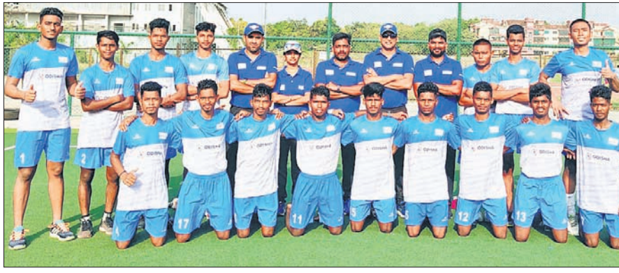
ଓଡ଼ିଶା ସବ୍‌କ୍ରୁନିୟମ ପୁରୁଷ ହକ୍ ଦଳ।

ଓଡ଼ିଶା ସବ୍‌କ୍ରୁନିୟମ ପୁରୁଷ ହକ୍ ଦଳ। ଗୋଆରେ ଚାଲିଥିବା ୧୨ତମ ଜାତୀୟ ସବ୍‌କ୍ରୁନିୟମ ପୁରୁଷ ହକ୍ ଚାମ୍ପିୟନସିପ୍‌ରେ ଓଡ଼ିଶା ୧୮-୦ ଗୋଲରେ ଆନ୍ତ୍ର ପ୍ରଦେଶକୁ ହରାଇ ବିତାଣ ଦୁହର ବିଜୟ ହାସଲ କରିଛି।