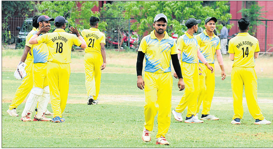
ମ୍ୟାଚ ଚିତ୍ରାପତରେ ବାଲେଶ୍ୱର ଦଳର ଖେଳାଳି ।

ଘରୋଇ କ୍ରିକେଟର ମର୍ଯ୍ୟାଦାଜନକ ଚୁର୍ନାମେଷ୍ଟ କଳାହାଣ୍ଡି କପ୍ରେ ଲିଗ୍ ପର୍ଯ୍ୟାୟ ଶେଷ ହୋଇଛି । କଟକ, ଭୁବନେଶ୍ୱର ଓ ଖୋର୍ଦ୍ଧାର ବିଭିନ୍ନ ଭେକ୍ଟରରେ ମୋଟ ୯୯ଟି ଲିଗ୍ ମ୍ୟାଚ ସଫଳତାର ସହ ସମ୍ପନ୍ନ ହୋଇଛି । ଓଡ଼ିଶା କ୍ରିକେଟ ଆସୋସିଏସନ୍ (ଓସିଏ) ସହ ଅନୁବନ୍ଧିତ ୩୭ଟି ଅନୁବନ୍ଧିତ ଯୁନିଟର ଖେଳାଳିମାନେ ଲିଗ୍ ପର୍ଯ୍ୟାୟରେ ସେମାନଙ୍କ ପ୍ରତିଭା ପ୍ରଦର୍ଶନର ସୁଯୋଗ ପାଇଥିଲେ । ଶେଷ ଦଳଭାବେ ବାଲେଶ୍ୱର ସୁପରଲିଗ୍ରେ ପ୍ରବେଶ କରିଛି । ପୂର୍ବରୁ ଭୁବନେଶ୍ୱର-ଏ, ଲକ୍ଷ୍ମଣୋଷ୍ଟ ରେଲଫେ, କଟକ-ଏ, ଝାରସୁଗୁଡ଼ା ଓ ଭଦ୍ରକ ଏହି ପର୍ଯ୍ୟାୟରେ ପ୍ରବେଶ କରିଥିଲେ । ମୋଟ ୬୮ଟି ଦଳକୁ ନେଇ ସୁପରଲିଗ୍ ଏକାଧିକ ଫର୍ମାଟରେ ଅନୁଷ୍ଠିତ ହେବ ।