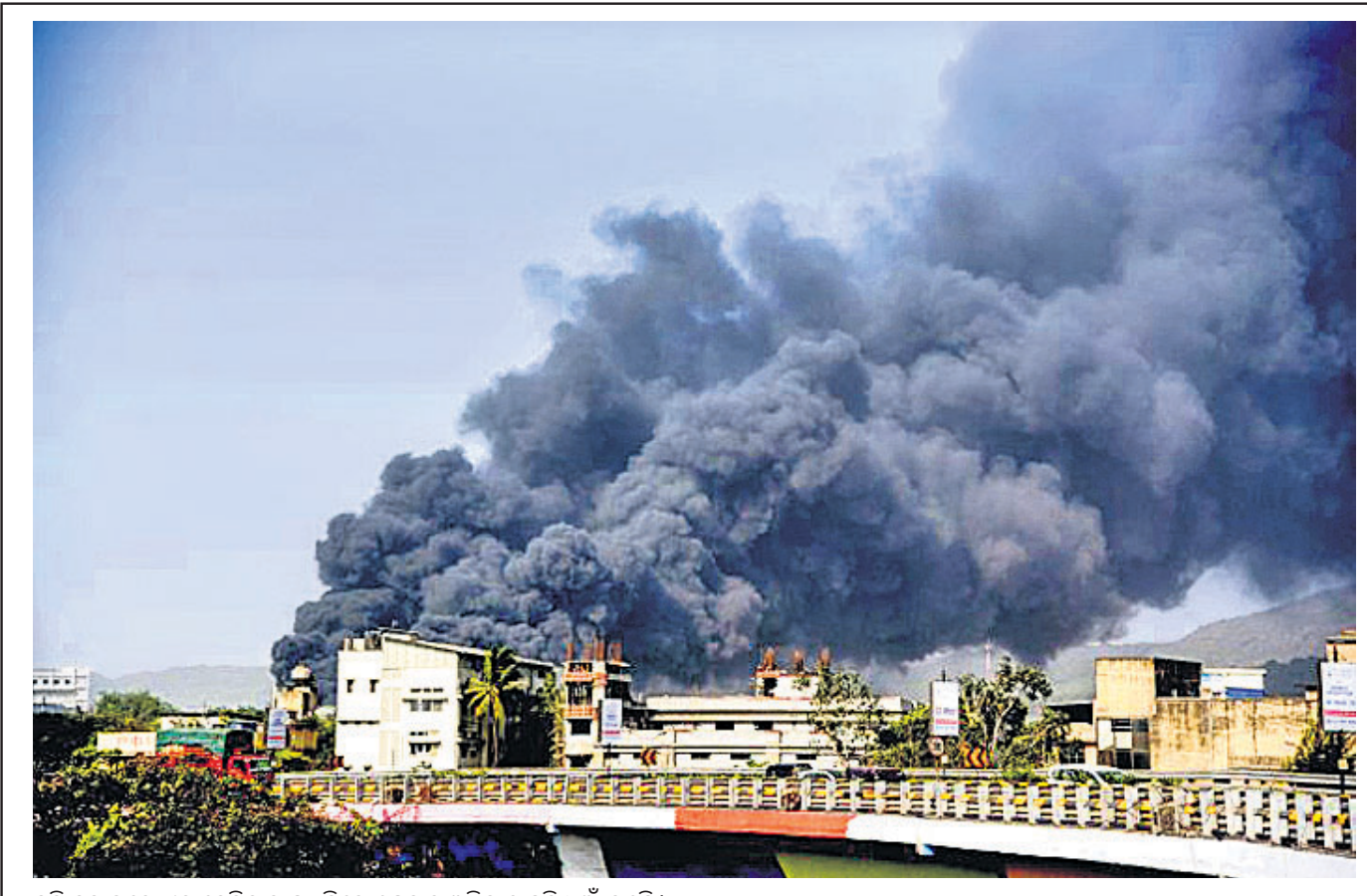
ନଭି ପୂର୍ଣ୍ଣାଳରେ ଏକ କେମିକାଲ ଫ୍ୟାକ୍ଟର ଶୁକ୍ରବାର ଅଗ୍ନିକାଣ୍ଡ ଘଟି ଧୂଆଁ ଉଠୁଛି।

ଲିକରାତ ସମାପନତା ଭଳି ପ୍ରସଙ୍ଗ ଉପରେ ଗୁରୁତ୍ୱ ଦେବେ ବୋଲି ଆଶା କରାଯାଉଛି। ସେ ସାମାଜିକ କଲ୍ୟାଣକୁ ଦରାଦିତ କରି ଦେକାରି ସମସ୍ୟା ଦୂର କରିବେ ବୋଲି ଏକ ସଭାରେ ପ୍ରତିଶ୍ରୁତି ଦେଇଛନ୍ତି। ତେବେ ରୋବ୍ରେଡୋଙ୍କ ରାଷ୍ଟ୍ରପତିତ୍ୱ ସେତେବେଳେ ସହଜ ହୋଇ ନ ପାରେ। ଉପରାଷ୍ଟ୍ରପତି ଭାବେ ରୋବ୍ରେଡୋ ଗୁଣା ଓ ଅପପ୍ରଚାର ବିରୋଧୀ ଅଭିଯାନର ନେତୃତ୍ୱ ନେଇ ରାଷ୍ଟ୍ରପତି ତୁଟେରଟେଙ୍କ ପାଇଁ ଅତୁଆର କାରଣ ସାଜିଥିଲେ। ତେବେ କୋଭିଡ୍ ମହାମାରୀ ପରେ ଆର୍ଥିକ ସଙ୍କଟ ଦେଇ ଗତି କରୁଥିବା ଫିଲିପାଇନ୍ସର ଅର୍ଥନୀତି ସକାଢ଼ିବା ପାଇଁ କୌଣସି ପ୍ରାର୍ଥୀ ନିର୍ବାଚନୀ ପ୍ରତିଶ୍ରୁତି ଦେଇନାହାନ୍ତି, ଯଦିଓ ଏଥିରେ ସଂସ୍କାର ଆଣିବା କଥା ସମସ୍ତେ କହୁଛନ୍ତି। ଦେଶର ଆର୍ଥିକବରାଣ ନିରାପତ୍ତା ଓ ସାମରିକ ପରିଚାଳନାକୁ ମଜବୁତ କରିବା ପାଇଁ ଆମେରିକାର ପ୍ରତିରକ୍ଷା ସହଯୋଗ କରୁଛି। ତେଣୁ ଦୁଇଙ୍କ ମଧ୍ୟରୁ ଯିଏ ଜିତିଲେ ବି ଆମେରିକା ସହ ଫିଲିପାଇନ୍ସର ଦୀର୍ଘ ସମ୍ପର୍କ ପୂର୍ବଭଳି ରହିବ। ତାହା ସହିତ ମାର୍କୋସଙ୍କ ସୁସମ୍ପର୍କ ଥିବାରୁ ସେ ରାଷ୍ଟ୍ରପତି ହୋଇଲେ ବେଶ୍ ସହ ବିପାକ୍ଷିକ ସହଯୋଗିତା ଦେଖାଯାଏ।