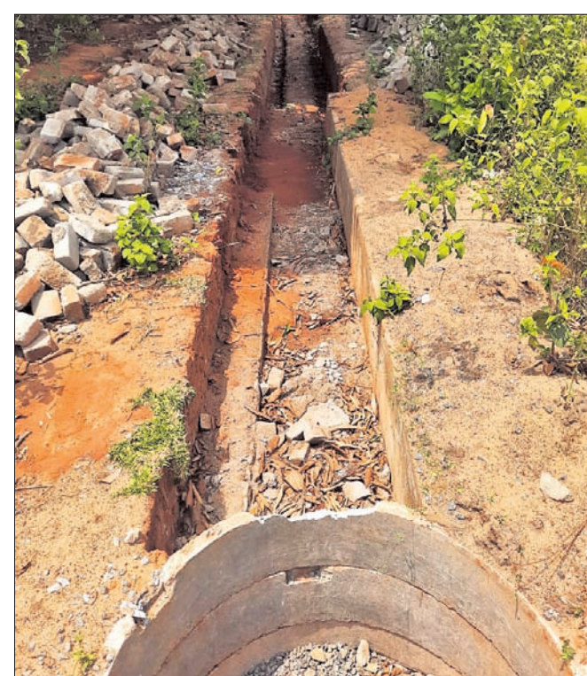
ଜଳ ଅମଳ ପ୍ରକଳ୍ପକୁ ଦୁର୍ଭୁତ ଭାଙ୍ଗି ଦେଇଛନ୍ତି।