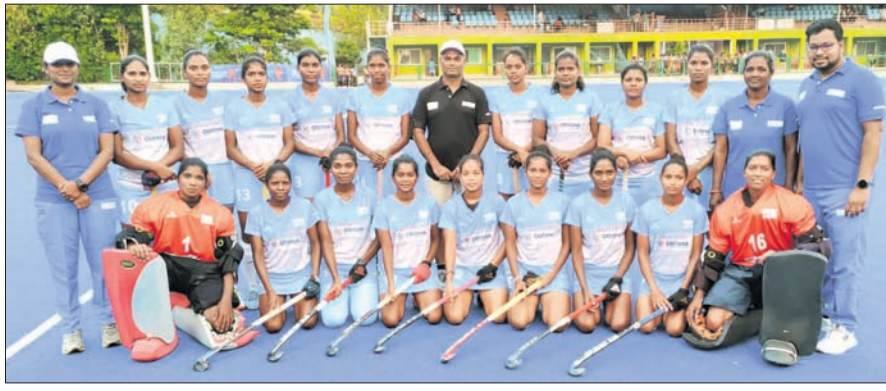
ସପୋର୍ଟ ଷ୍ଟାଫ୍ ସହ ଓଡ଼ିଶା ବିନିୟମ ମହିଳା ହକ୍ ଦଳର ଖେଳାଳି।

ଭୋପାଳ, ୬୫: ଜାତୀୟ ବିନିୟମ ମହିଳା ହକ୍ ଚାମ୍ପିୟନସିପ୍ ୧୨ତମ ସଂସ୍କରଣ ଶୁକ୍ରବାର ଏଠାରେ ଆରମ୍ଭ ହୋଇଛି। ପ୍ରଥମ ଦିବସରେ ଓଡ଼ିଶା ଗୋଲ ବର୍ଷା କରି ୧୪-୦ ଗୋଲରେ ଚେଲେଙ୍ଗିନୀକୁ ପରାସ୍ତ କରିଛି।