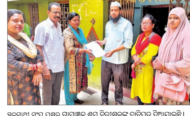
ସ୍ୱଚ୍ଛସାଥୀ ସଂଘ ପକ୍ଷରୁ ଗ୍ରାମାଞ୍ଚଳ ଶ୍ରମ ନିରାକ୍ଷରଙ୍କୁ ଦାବିପତ୍ର ଦିଆଯାଇଛି