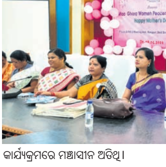
କାର୍ଯ୍ୟକ୍ରମରେ ମହାସୀନ ଅତିଥି।