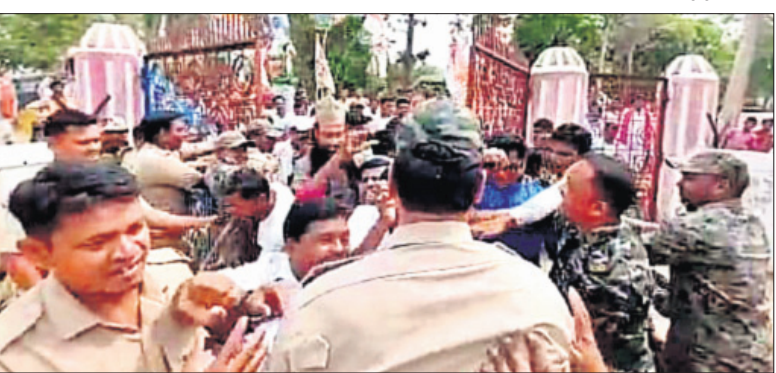
ପାଣ୍ଡି ପରିସରକୁ ଧସାଇ ପଶିଥିବା କଂଗ୍ରେସ କର୍ମୀଙ୍କୁ ପୋଲିସ୍ ଅଟକାଇଛି ।