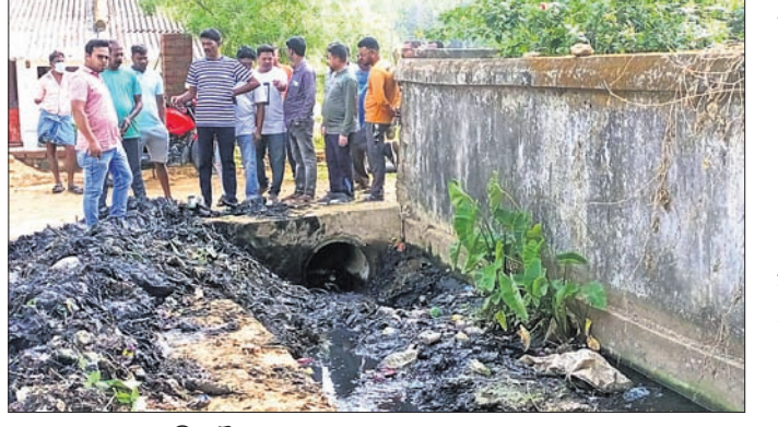
ନାକ ସଫା କରାଉଛନ୍ତି ପୌରାଧ୍ୟକ୍ଷ।