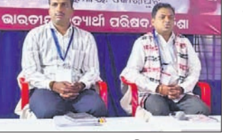
ମହାସୀନ ୨ ଅତିଥି।