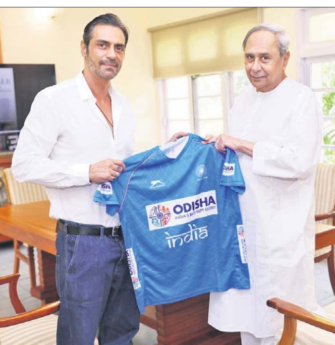
ଭୁବନେଶ୍ୱରଠାରେ ଆୟୋଜିତ ମହିଳା ଉଦ୍ୟୋଗୀ ମେଳା-୨୦୨୨ରେ ଯୋଗଦେବାକୁ ଆସିଥିବା ବଳିଭଦ୍ର ଅଭିନେତା ଅର୍ଜୁନ ରାମପାଲ ରବିବାର ନବାନ ନିବାସରେ ମୁଖ୍ୟମନ୍ତ୍ରୀ ନବାନ ପଟ୍ଟନାୟକଙ୍କୁ ଭେଟିଛନ୍ତି। ଏହି ଅବସରରେ ମୁଖ୍ୟମନ୍ତ୍ରୀ ତାଙ୍କୁ ଓଡ଼ିଶାର ପ୍ରାକୃତିକ ସୌନ୍ଦର୍ଯ୍ୟ ଓ ଆଦିବାସୀଙ୍କ ସୁନ୍ଦର ପ୍ରାସାଦ କରିବା ଲାଗି ଉତ୍ସାହିତ କରିବା ସହ ହଜିର ଏକ ଜର୍ଦ୍ଦି ପ୍ରଦାନ କରୁଛନ୍ତି।

ଆଦିବାସୀମାନେ ପୋଡୁଚାଷ ଉପରେ ଅଧିକ ଚିନ୍ତା ଦେଉଛନ୍ତି। ତେଣୁ ବିଭିନ୍ନ ସମୟରେ ଜଙ୍ଗଲ ବିଭାଗ ପକ୍ଷରୁ ଚଢ଼ାଇ କରି ସମ୍ପୂର୍ଣ୍ଣ ପୋଡୁଚାଷୀଙ୍କ ଉପରେ ଆକଳନତା କାର୍ଯ୍ୟାନୁଷ୍ଠାନ ଗ୍ରହଣ କରାଯାଇଛି। ଖାଦ୍ୟ ଭାବେ ସେମାନେ ଭାତ ଏବଂ ଜଙ୍ଗଲରୁ ମିଳୁଥିବା ବିଭିନ୍ନ କନ୍ଦା ଉପରେ ନିର୍ଭର କରୁଛନ୍ତି। ପରିପରିଚାଳନା ଖାଦ୍ୟ ଖାଉ ନ ଥିବାରୁ ମା ଓ ଶିଶୁ ଅପପୁଷ୍ଟିର ଶିକାର ହେଉଛନ୍ତି। କହିବାବାସ୍ତୁଲ୍ୟ ଯେ, ନଗଡ଼ାରେ ସରକାରଙ୍କ ପକ୍ଷରୁ ଖାଦ୍ୟ ସୁରକ୍ଷା, ଆଶ୍ରମ ସ୍ଥଳରେ ଆବାସିକ ଶିକ୍ଷା, ଅଙ୍ଗନୱାଡ଼ିକେନ୍ଦ୍ର, ବିକ୍ରମପଦା ଘର, ମାଗଣା ବିହନ, ମଞ୍ଜି ଓ କୃଷି ସାମଗ୍ରୀ ବ୍ୟବହାର, ମୋ ଉପକାରୀ ବସିବା, ସହକ ବ୍ୟାଙ୍କ ରଖି ଆଦି ଯୋଜନା ଘରକୁ ଘର ପହଞ୍ଚିଛି। ତଥାପି ସଚେତନତା ଅଭାବ କୁଟାଙ୍ଗ ଆଦିବାସୀଙ୍କ ଚଳଣିରେ ପରିବର୍ତ୍ତନ ହେଉ ନଥିବାରୁ ତାହା ପ୍ରଶଂସନ ପାଇଁ ଚିନ୍ତା କାରଣ ହୋଇଛି।