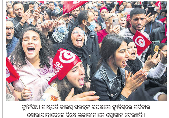
ରୁମିନିଆ ରାଷ୍ଟ୍ରପତି କାଲ୍‌ସ୍ ସଭାରେ ସମ୍ବଳନରେ ରବିବାର ଶୋଭାଯାତ୍ରାରେ ବିଶୋଭକାରୀମାନେ ସ୍ଲୋଗାନ ଦେଉଛନ୍ତି।

ନୂଆଦିଲ୍ଲୀ, ୮।୫: ଦେଶଦ୍ରୋହ ଆଇନ ଉଚ୍ଚେକ୍ଷୁକ୍ତ କେନ୍ଦ୍ର ସରକାର ବିରୋଧ କରିଛନ୍ତି। ଉକ୍ତ ଆଇନ ଆଧାରରେ ଦିଆଯାଇଥିବା ରାୟର ପୁନଃ ସମୀକ୍ଷା ଆବଶ୍ୟକ ନାହିଁ। ସର୍ବୋଚ୍ଚ ଅଦାଲତଙ୍କ ୬ ଦଶନ୍ଧି ଟକର ରାୟରେ ଧାରା ୧୨୪ଏର ବୈଧତାକୁ କାଏମ ରଖାଯାଇଥିଲା। ଏହା ଏକ ଭଲ ଆଇନ ଏବଂ ସମ୍ବିଧାନର ଅଧିକାର ଓ ରାଷ୍ଟ୍ରର ଆବଶ୍ୟକତା ମଧ୍ୟରେ ସମ୍ବଳନ ରକ୍ଷା କରୁଛି ବୋଲି କେନ୍ଦ୍ର ସରକାର ସୁପ୍ରିମକୋର୍ଟକୁ ଜଣାଇଛନ୍ତି। ଦେଶଦ୍ରୋହ ଆଇନର ବୈଧତାକୁ ବ୍ୟାଲେଞ୍ଜ କରି ଏକାଧିକ ପିଟିଶନ ଦାଏର ହୋଇଥିଲା। ଏହାକୁ ସାମ୍ବିଧାନିକ ଦୃଷ୍ଟିରୁ ପଠାଯିବ କି ନାହିଁ ପ୍ରସଙ୍ଗ ଉପରେ ସର୍ବୋଚ୍ଚ ଅଦାଲତ କୁଣ୍ଡଳୀର ମେହେଟ୍ଟା ମୁକ୍ତି ବାଢ଼ିଛନ୍ତି, ୧୯୬୨ର ରାୟ ଗୁରୁତ୍ୱପୂର୍ଣ୍ଣ ଓ ଏହାର ପୁନର୍ବିଚାର ରାୟ ଗୁରୁତ୍ୱପୂର୍ଣ୍ଣ ଓ ଏହାର ପୁନର୍ବିଚାର ଏକ ଭଲ ଆଇନ ଏବଂ ସମ୍ବିଧାନର ଅଧିକାର ଓ ରାଷ୍ଟ୍ରର ଆବଶ୍ୟକତା ମଧ୍ୟରେ ସମ୍ବଳନ ରକ୍ଷା କରୁଛି ବୋଲି କେନ୍ଦ୍ର ସରକାର ସୁପ୍ରିମକୋର୍ଟକୁ ଜଣାଇଛନ୍ତି।