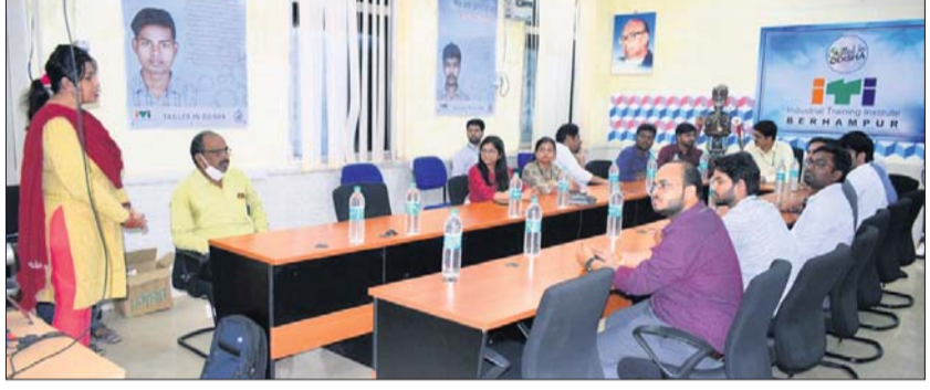
ଅଧିକାରୀମାନେ ବିଭିନ୍ନ ସାମଗ୍ରୀ ଦେଖୁଛନ୍ତି ।