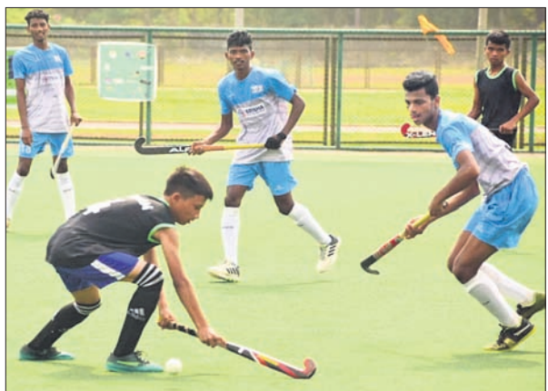
ଓଡ଼ିଶା ଓ ମିଜୋରାମ ମଧ୍ୟରେ ଅନୁଷ୍ଠିତ ମ୍ୟାଚ।