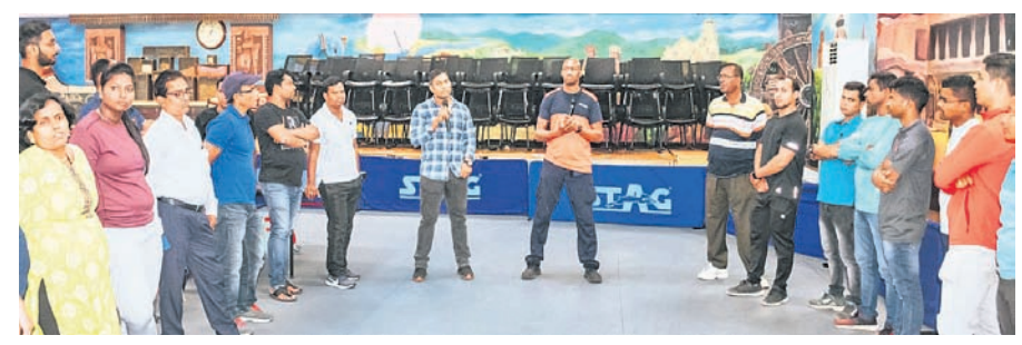
ଭୁବନେଶ୍ୱରରେ ଯୋଗଦାନ ଭାରତୀୟ ବ୍ୟାଟ୍ମିନ୍ସନ ଟ୍ରେନିଂ ପ୍ରୋଗ୍ରାମ ଆରମ୍ଭ ହୋଇଛି। ୧୨ ତାରିଖ ପର୍ଯ୍ୟନ୍ତ ଚାଲିଯାଉଥିବା ଏହି କାର୍ଯ୍ୟକ୍ରମରେ ୧୬ ଜିଲ୍ଲାକୁ ୪୧ କୋର୍ ଅଂଶଗ୍ରହଣ କରିଛନ୍ତି।

ତଦ୍ୱଳ୍ପ ବର୍ଷରେ ସାହିତ୍ୟ ସାଲୋନ ରାଜିବଗଣ୍ଡା ଓ ଚିତାଗ ଶେକ୍ସପିୟାର ପ୍ରତିଯୋଗିତାରେ ଭାରତୀୟ ଦଳ ପ୍ରଥମ ପଦକ ସମ୍ପାନରେ ଅଛି। ଏପର୍ଯ୍ୟନ୍ତ କୌଣସି ଭାରତୀୟ ଦଳ ଥୋମାସ କପ୍ ସେମିଫାଇନାଲରେ ପହଞ୍ଚି ପାରିନାହିଁ। ଭାରତୀୟ ଦଳ ତା'ର ଅତିମ ଗ୍ରୁପ୍ ସିଂ ମୁକାବିଲାରେ ରୁଧିବାର ତାଳନିକ ଚାଲିଯିବାର ଭେଦରେ ଅନୁପସ୍ଥରେ ଭାରତୀୟ ମହିଳା ଦଳ ମଧ୍ୟ ବିଜୟ ସହ ଉବର କପ୍ ଅଭିଯାନ ଆରମ୍ଭ କରିଛି। ରବିବାର ଖେଳାଯାଇଥିବା ପ୍ରଥମ ମୁକାବିଲାରେ ଭାରତୀୟ ଦଳ କାନାଡ଼ାକୁ ୪-୧ରେ ହରାଇ ଦେଇଥିଲା। ତେବେ ମଙ୍ଗଳବାର ଓ ବୁଧବାର ଦିନ ଦଳ ଆମେରିକା ଓ କୋରିଆକୁ ଭେଦିବ।