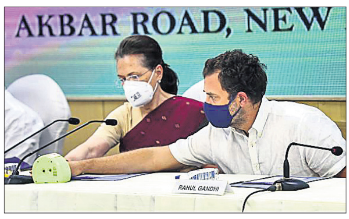
ସିଦ୍ଧାନ୍ତ ସିଦ୍ଧାନ୍ତରେ ସୋନିଆ ଗାନ୍ଧୀ ଓ ରାହୁଲ ଗାନ୍ଧୀ।

ରାଜସ୍ଥାନର ଉପରାଜ୍ୟରେ ମେ' ୧୩ରୁ ୧୫ କଂଗ୍ରେସର ଚିନ୍ତନ ଶିବିର ଅନୁଷ୍ଠିତ ହେବାକୁ ଯାଉଥିବାବେଳେ ଏହା ପୂର୍ବରୁ ଦଳ ଅଧ୍ୟକ୍ଷା ସୋନିଆ ଗାନ୍ଧୀ ସମସ୍ତ ନେତାଙ୍କ ସହଯୋଗ ଲୋଡ଼ିଛନ୍ତି।