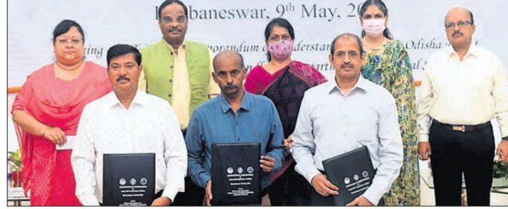
ଜଙ୍ଗଲ, ପରିବେଶ ଓ ଜଳବାୟୁ ପରିଚରଣ ବିଭାଗ, ଓଡ଼ିଶା ହସ୍ତଚକ୍ର, ବୟନ ଓ ହସ୍ତଶିଳ୍ପ ବିଭାଗ ଏବଂ କେନ୍ଦ୍ରୀୟ ସିଲ୍‌କ୍ ବୋର୍ଡ ମଧ୍ୟରେ ଅନୁଷ୍ଠିତ ତ୍ରିପାକ୍ଷିକ ବୃତ୍ତାନ୍ତରାଳ ପତ୍ର।

ଓଡ଼ିଶାରେ ଆରମ୍ଭ ହେବ ବନ୍ୟ ରେଶମ ଉତ୍ପାଦନ ପ୍ରକଳ୍ପ। ଏଥିପାଇଁ ସୋମବାର ରାଜ୍ୟ ଅତିଥି ଭବନରେ ଜଙ୍ଗଲ, ପଶୁପାଳନ ଓ ଜଳବାୟୁ ପରିଚରଣ ବିଭାଗ, ଓଡ଼ିଶା ହସ୍ତଚକ୍ର, ବୟନ ଓ ହସ୍ତଶିଳ୍ପ ବିଭାଗ ଏବଂ ବାଙ୍ଗାଲୋରସ୍ଥିତ କେନ୍ଦ୍ରୀୟ ସିଲ୍‌କ୍ ବୋର୍ଡ ମଧ୍ୟରେ ଏକ ତ୍ରିପାକ୍ଷିକ ବୃତ୍ତାନ୍ତରାଳ ପତ୍ର ସ୍ୱାକ୍ଷରିତ ହୋଇଛି।