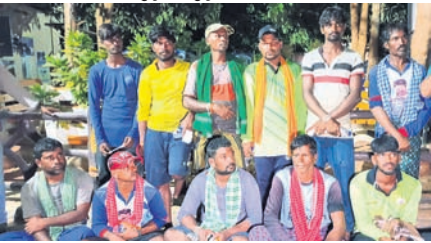
ଉଦ୍ଧାର ହୋଇଥିବା ମତ୍ସ୍ୟଜୀବୀମାନେ।

କୋଷ୍ଟଗାର୍ତ୍ତର ଯବାନମାନେ ଚୁରୁ ଯାଏଁ ଅପରାଧିନୀ ଧରଣ କରିଥିଲେ। ହେଲିକପ୍ଟର ଦ୍ୱାରା ଗଠି ପର୍ଯ୍ୟାୟରେ ସମସ୍ତ ୧୧ ମତ୍ସ୍ୟଜୀବୀଙ୍କୁ ସୁରକ୍ଷିତ ଭାବେ ଉଦ୍ଧାର କରାଯାଇ କୁଳକୁ ଅଣାଯାଇଥିଲା।