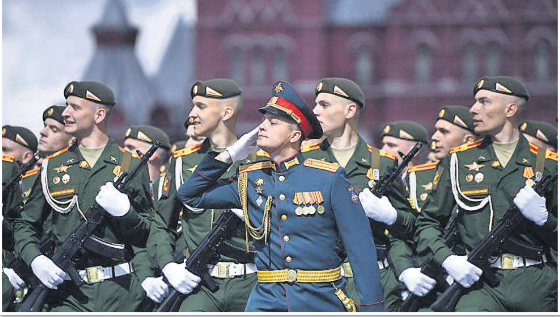
୭୭ତମ ବିଜୟ ଦିବସ ପାଳନ ଅବସରରେ ମସ୍କୋରେ ଅନୁଷ୍ଠିତ ସେନା ପରେଡ଼ରେ ଯୋଗ ଦେଇଥିବା ରୁଷିଆ ମୁକ୍ତ ଟ୍ୟାଙ୍କ ଓ ସୈନ୍ୟମାନେ ।