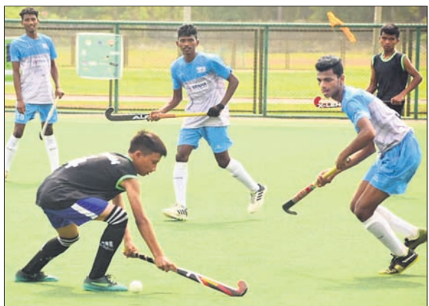
ଓଡ଼ିଶା ଓ ମିଜୋରାମ ମଧ୍ୟରେ ଅନୁଷ୍ଠିତ ମ୍ୟାଚ୍