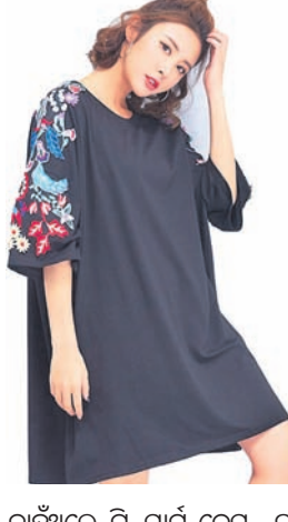
ଚାହୁଁଥିଲେ ଟି-ସାର୍ଟ ଡ୍ରେସ୍ ଗ୍ରାହ୍ୟ କରିପାରିବେ। କୌଣସି ପାର୍ଟି କିମ୍ବା ବାହାରକୁ ବୁଲିବାକୁ ଯିବା ସମୟରେ ଆପଣ ଏହି ଡ୍ରେସ୍ ପିନ୍ଧି ଯାଇପାରିବେ। ଟି-ସାର୍ଟ ଡ୍ରେସ୍ ସହିତ ଧଳା ଷ୍ଟାଇଲିଶ୍ କୋଡା ବେଶ୍ ସୁନ୍ଦର ଲାଗିବ।

- ସମଗ୍ର ଫ୍ୟାଶନରେ ଏବେ ପୁଣି ଅଧିକ କାଫିଆନ ଲୋକପ୍ରିୟତା ବଢ଼ିବାରେ ଲାଗିଛି। ମାର୍କେଟରେ ସିଫଟ୍, କର୍ନର୍ ଆଦି ବିଭିନ୍ନ ପ୍ରକାର କାଫିଆନ ମିଳୁଛି। ଏହି ପୋଷାକ ଲମ୍ବା ଏବଂ ଖୋଲା ଖୋଲା ରହିଥାଏ। ତେଣୁ ଖରାଦିନେ ପିନ୍ଧିବାକୁ ଆରାମ ଲାଗେ ଓ ଫ୍ୟାଶନେବୁଲ ମଧ୍ୟ ଦେଖାଯାଏ। - ଓଜର ସାଇଜ୍ ସର୍ତ୍ତ ମଧ୍ୟ ସମଗ୍ର ଲୁକ୍ ପାଇଁ ପୂରା ଚାପରେ ଲାଗିବ। କିନ୍ତୁ ସହିତ ଡିଲ୍ଲୀ ଓ ଲମ୍ବା ସର୍ତ୍ତ ମଧ୍ୟ ଆପଣ ଖରାଦିନେ ପିନ୍ଧିପାରିବେ। ଏହା ଆରାମଦାୟକ ହେବା ସହ ଷ୍ଟାଇଲିଶ୍ ଲାଗିବ। - ଖରାଦିନେ କୁଲ୍ ଏବଂ ଷ୍ଟାଇଲିଶ୍ ଦେଖାଯିବାକୁ ବେଶ୍ ସୁନ୍ଦର ଲାଗିବ।