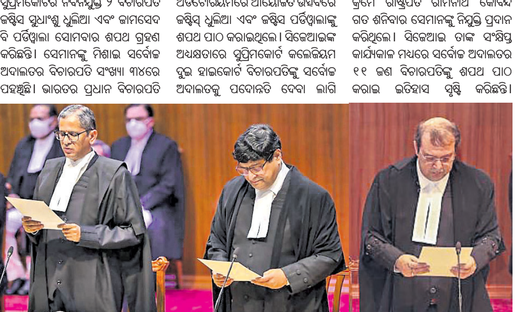
ସିଦ୍ଧିଆ ଇଣ୍ଡିଗୋ ମାମଲାରେ ୨ ବିଚାରପତି ସୁପ୍ରିମକୋର୍ଟର ୨ ବିଚାରପତି ଶପଥ ନେଲେ ।

ସୁପ୍ରିମକୋର୍ଟର ୨ ବିଚାରପତି ଶପଥ ନେଲେ ସୁପ୍ରିମକୋର୍ଟର ୨ ବିଚାରପତି ଶପଥ ନେଲେ ସୁପ୍ରିମକୋର୍ଟର ୨ ବିଚାରପତି ଶପଥ ନେଲେ