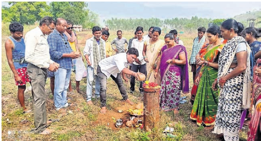
ସରପଞ୍ଚ ପାନୀୟ ଜଳ ପ୍ରକଳ୍ପର ଶିଳାନିଧାସ କରୁଛନ୍ତି।

ରାୟଗଡ଼ା ଜିଲ୍ଲା କୋଲକତା ବ୍ଲକ୍ ଗାଡ଼ି ଶେଷଭାଗ ପଞ୍ଚାୟତର ବିଭକ୍ତକୋଣ୍ଡା ଗ୍ରାମରେ ପାନୀୟ ଜଳ ଯୋଗାଣ ପ୍ରକଳ୍ପର ଶିଳାନିଧାସ କରାଯାଇଛି।