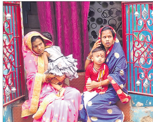
ଧାରଣାର ଦୁଇ ଯାଆ।