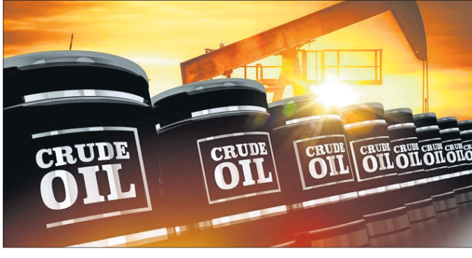
ଶେଷ ଥର ପାଇଁ ଏପ୍ରିଲ ୬ରେ ଉଚ୍ଚତମ ତୈଳ ଦର ବ୍ୟାରେଲ ପିଛା ୧୧୩.୪୬ ଡଲ୍ଲାରରେ ରହିଛି। ଫଳରେ କ୍ରମାଗତ ପିଛା ୮୦ ପଇସା ବୃଦ୍ଧି ପାଇଥିଲା। ଭାବେ ବୃଦ୍ଧି ପାଇଥିବା ଅଶୋଧିତ ତୈଳ ମୂଲ୍ୟର ପ୍ରଭାବ ଭାରତୀୟ ବଜାର ଉପରେ ମଧ୍ୟ ପଡ଼ିପାରେ ବୋଲି ବଜାର ବିଶେଷଜ୍ଞମାନେ ଆକଳନ କରୁଛନ୍ତି।

ଗତ କିଛି ଦିନର ବିଭିନ୍ନ ପରେ ବୃଦ୍ଧି ପାଇଛି ଅଶୋଧିତ ତୈଳ ଦର ଉଚ୍ଚ ପରିମାଣରେ ବୃଦ୍ଧି ପାଇଛି। ଏପରିକି ଅନ୍ତରାଷ୍ଟ୍ରୀୟ ବଜାରରେ ହୁ ହୁ ହୋଇ ତୈଳ ଦର ବଦଳିବା ଜଣାପଡ଼ିଛି। କ୍ରମାଗତ ୩ୟ ଦିନ ଲାଗି ଅଶୋଧିତ ତୈଳ ଦର ବୃଦ୍ଧି ପାଇଛି। ସୋମବାର ଅଶୋଧିତ ତୈଳ ମୂଲ୍ୟ ୧୦% ବୃଦ୍ଧି ପାଇଥିବା ସୂଚନା ମିଳିଛି। ଏହି ଦରବୃଦ୍ଧି କାରଣରୁ ଅନ୍ତରାଷ୍ଟ୍ରୀୟ ବଜାରରେ ଅଶୋଧିତ ତୈଳ ଦର ବ୍ୟାରେଲ ପିଛା ୧୧୩.୪୬ ଡଲ୍ଲାରରେ ରହିଛି। ଫଳରେ କ୍ରମାଗତ ପିଛା ୮୦ ପଇସା ବୃଦ୍ଧି ପାଇଥିଲା। ଭାବେ ବୃଦ୍ଧି ପାଇଥିବା ଅଶୋଧିତ ତୈଳ ମୂଲ୍ୟର ପ୍ରଭାବ ଭାରତୀୟ ବଜାର ଉପରେ ମଧ୍ୟ ପଡ଼ିପାରେ ବୋଲି ବଜାର ବିଶେଷଜ୍ଞମାନେ ଆକଳନ କରୁଛନ୍ତି।