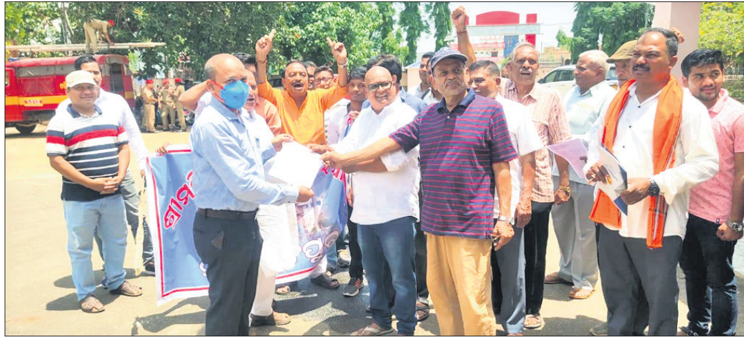
ନବରଙ୍ଗପୁରରେ ଅତିରିକ୍ତ ଜିଲ୍ଲାପାଳ ଦାବିପତ୍ର ଗ୍ରହଣ କରୁଛନ୍ତି।