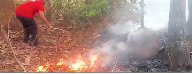
ଜଙ୍ଗଲରେ ନିଆଁ ଲିଭାଇଛନ୍ତି ବନ କର୍ମଚାରୀ।