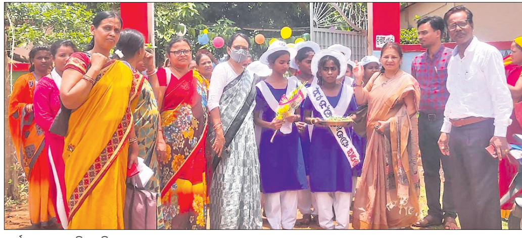
କାର୍ଯ୍ୟକ୍ରମରେ ଉପସ୍ଥିତ ଅତିଥି ।