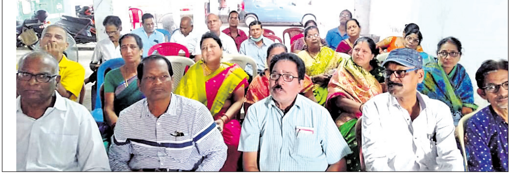
ବନ୍ଧୁମିଳନ ପର୍ବରେ ମଞ୍ଚାସୀନ ଅତିଥି।

ବ୍ରହ୍ମପୁର ମହାନଗର ନିଗମ (ବିଏମ୍ବି) ପକ୍ଷରୁ ଜାଗା ସମ୍ପର୍କ କାର୍ଯ୍ୟକ୍ରମ ଆରମ୍ଭ ହୋଇଛି। ଏ ନେଇ ମଞ୍ଜଳବାର ବିଏମ୍ବି ଅନ୍ତର୍ଗତ ୨୩ ନଂ. ଝାଡ଼ ସ୍ଥିତ ନିହାତି ଆବଶ୍ୟକ ବୋଲି ଛାତ୍ରାଛାତ୍ରୀମାନେ ବନ୍ଧୁମିଳନ କରିଥିଲେ।