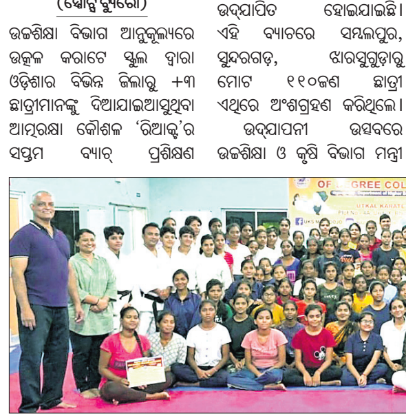
ଉତ୍ତମ କରାଚେ ସ୍କୁଲରେ ଅନୁଷ୍ଠିତ ଆତ୍ମରକ୍ଷା ପ୍ରଶିକ୍ଷଣ ଶିବିରରେ ଅଂଗ୍ରହଣ କରିଥିବା ଛାତ୍ରୀମାନେ ଟ୍ରେନିଂରେ ସହ।

ଆତ୍ମରକ୍ଷା ପ୍ରଶିକ୍ଷଣ ଅଧିକାରୀଙ୍କ ଦ୍ୱାରା ଆତ୍ମରକ୍ଷା ପ୍ରଶିକ୍ଷଣ ଶିବିରରେ ଅଂଗ୍ରହଣ କରିଥିବା ଛାତ୍ରୀମାନେ ଟ୍ରେନିଂରେ ସହ। ଆତ୍ମରକ୍ଷା ପ୍ରଶିକ୍ଷଣ ଶିବିରରେ ଅଂଗ୍ରହଣ କରିଥିବା ଛାତ୍ରୀମାନେ ଟ୍ରେନିଂରେ ସହ। ଆତ୍ମରକ୍ଷା ପ୍ରଶିକ୍ଷଣ ଶିବିରରେ ଅଂଗ୍ରହଣ କରିଥିବା ଛାତ୍ରୀମାନେ ଟ୍ରେନିଂରେ ସହ।