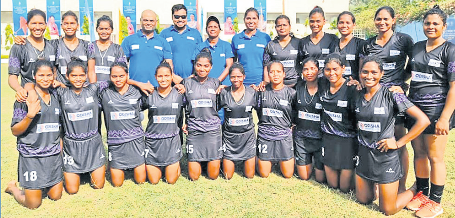
ଓଡ଼ିଶା ଦଳର ମହିଳା ହକି ଦଳ।

ଭୁବନେଶ୍ୱର, ୧୦୫ (ପ୍ରାଣ ପ୍ରତିନିଧି): ଭୋପାଳରେ ଚାଲିଥିବା ଜାତୀୟ ଦଳରେ ଚାଲିଥିବା ମହିଳା ହକି ଦଳ ଓଡ଼ିଶା ମନୋରମା ୧୧-୦ ଗୋଲରେ କେରଳକୁ ପରାସ୍ତ କରିଛି। ପ୍ରତିଯୋଗିତାରେ ଏହା ହେଉଛି ଓଡ଼ିଶାର କ୍ରମାଗତ ଦ୍ୱିତୀୟ ବିଜୟ। ନିଜର ପ୍ରଥମ ମ୍ୟାଚରେ ଦଳ ୧୪-୦ ଗୋଲରେ ଚେଲମ୍ପାକୁ ପରାସ୍ତ କରିଥିଲା। ୨ ବିଜୟ ସହ ଓଡ଼ିଶା ପୁଲ୍ 'ଏର୍'ରେ ୬ ପଏଣ୍ଟ୍ ସହିତ ନିଜ ଶୀର୍ଷସ୍ଥାନକୁ ସୁଦୃଢ଼ କରିଛି। ଦଳ ୨୫ଟି ଗୋଲ ଦେଇ ସାରିଥିଲେ ହେଁ ଏପର୍ଯ୍ୟନ୍ତ ଗୋଟିଏ ହେଲେ ଗୋଲ ବରଣ କରିନାହିଁ। ଏହି ପ୍ରସ୍ତର ଅନ୍ୟତମ ଦଳ ହିମାଚଳ ପ୍ରଦେଶ ମଧ୍ୟ ୨ ମ୍ୟାଚରୁ ୬ ପଏଣ୍ଟ୍ ପାଇଛି। ତେବେ ଗୋଲ ବ୍ୟବଧାନରେ ଏହି ଦଳ ବହୁ ପଛରେ ରହିଛି। ଓଡ଼ିଶା ୭