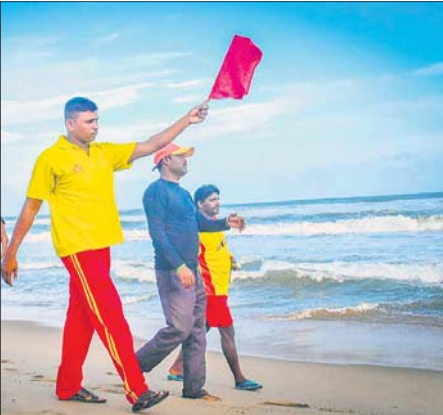
ପୁରୀରେ ପର୍ଯ୍ୟଟକ ଓ ମହାଜାବାଙ୍କୁ ସତର୍କ କରାଇ ଦିଆଯାଉଛି (ବାମ)। ପାଣିପାଗ ବିଭାଗ ପକ୍ଷରୁ ଜାରି ବାତ୍ୟାଗ ଗତି ଚିତ୍ର।

ବାତ୍ୟା 'ଅସାନି' ରୁଧିରୀ ପୂର୍ବାହ୍ନ ୧୧ ସୁଦ୍ଧା ଆନ୍ଧ୍ରପ୍ରଦେଶର କାକିନାଡ଼ା-ବିଶାଖାପାଟଣା ମଧ୍ୟଦେଇ ସ୍ଥଳଭାଗ ଛୁଇଁପାରେ ବୋଲି ଭାରତୀୟ ପାଣିପାଗ ବିଭାଗ (ଆଇଏମଡି) ଆକଳନ କରିଛି। ମଙ୍ଗଳବାର 'ଅସାନି' ଭୀଷଣ ବାତ୍ୟାରେ ପରିଣତ ହୋଇଯାଉଛି। ଏହା ପଶ୍ଚିମ-କେନ୍ଦ୍ରୀୟ ଓ ଦକ୍ଷିଣ ପଶ୍ଚିମ ବଙ୍ଗୋପସାଗରରେ ଘଣ୍ଟା ପ୍ରତି ୨୩ କିଲୋମିଟର ବେଗରେ ପଶ୍ଚିମ-ଉତ୍ତର-ପଶ୍ଚିମ ଦିଗରେ ଗତି କରୁଛି। ବାତ୍ୟା ଗୋପାଳପୁରଠାରୁ ଦକ୍ଷିଣ-ଦକ୍ଷିଣ ପଶ୍ଚିମରେ ଚଳୁଛି।