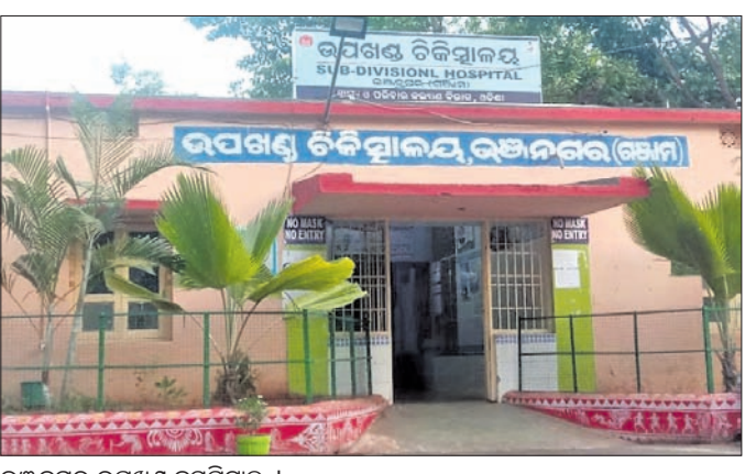
ଭଞ୍ଜନଗର ଉପଖଣ୍ଡ ହସ୍ପିଟାଲ ।

ନେତା ଉପରେ ପୂର୍ବେ ମେଡିସିନ ଏବଂ ଅପ୍ରିଶିୟା ଦୁଇଜଣ ନୂତନ ଡାକ୍ତର କାର୍ଯ୍ୟରେ ଯୋଗ ଦେଇଛନ୍ତି। ଭଞ୍ଜନଗର ମେଡିକାଲ ପାଇଁ ୨୪ ଡାକ୍ତର ପଦବୀ ଅନୁମୋଦନ ହୋଇଛି। ବର୍ତ୍ତମାନ ୧୭ଜଣ ଅଛନ୍ତି। ସେଥିମଧ୍ୟରୁ ୩ଜଣ ଡେପୁଟିମେନ୍ତରେ ଅଛନ୍ତି। ଭଞ୍ଜନଗର ବୁକ ଗାଲେରି ସାମ୍ବନ୍ଧରେ ଏଠାରୁ ୨ଜଣଙ୍କୁ ଡେପୁଟିମେନ୍ତରେ ପଠାଯାଇଛି। ପ୍ରା ଓ ପ୍ରସ୍ତୁତି ବିଭାଗର ଜଣେ ଡାକ୍ତର ୨ ବର୍ଷ ହେବ ବ୍ରହ୍ମପୁର ଡେପୁଟିମେନ୍ତରେ ଯାଇଛନ୍ତି। ଭଞ୍ଜନଗର ମେଡିକାଲରେ ଡାକ୍ତର ଅଭାବ ଲାଗି ରହିଥିବା ବେଳେ ଏଠାରୁ ବ୍ରହ୍ମପୁର ପଠାଇବାକୁ ନେଇ ଅସନ୍ତୋଷ ପ୍ରକାଶ କରୁଛି। ଅନ୍ୟପକ୍ଷେ ନିଶ୍ଚିତ ଡାକ୍ତର ତଥା ମନ୍ତ୍ରୀ ବିକ୍ରମ କେଶରୀ ଆରୁଖ ଏହି ସମସ୍ୟାର ସମାଧାନ ପାଇଁ ପଦକ୍ଷେପ ନେଇ ପାଇଁ କହିଛନ୍ତି। ତେଣୁ ମେଡିକାଲରେ କୌଣସି