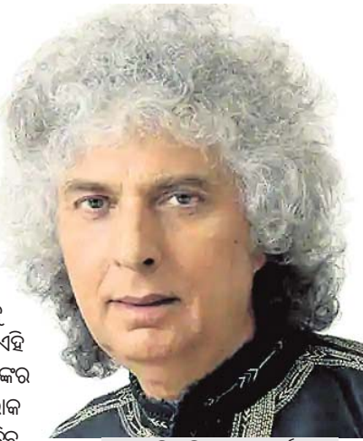
ପଞ୍ଚିତ ଶିବକୁମାର ଶର୍ମା