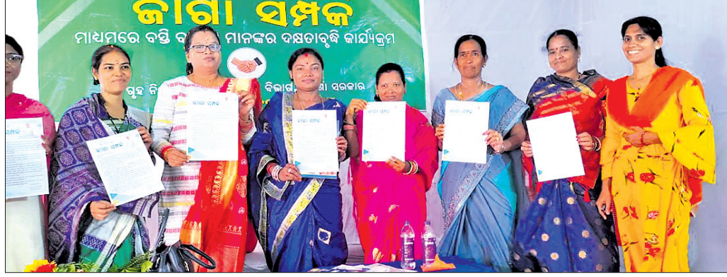
ଜାଗା ସମ୍ପର୍କ କାର୍ଯ୍ୟକ୍ରମରେ ଅତିଥି ଓ ଅନ୍ୟମାନେ।

ବ୍ରହ୍ମପୁର ମହାନଗର ନିଗମ (ବିଏମ୍ବି) ପକ୍ଷରୁ ଜାଗା ସମ୍ପର୍କ କାର୍ଯ୍ୟକ୍ରମ ଆରମ୍ଭ ହୋଇଛି। ଏ ନେଇ ମଞ୍ଜଳବାର ବିଏମ୍ବି ଅନ୍ତର୍ଗତ ୨୩ ନଂ. ଝାଡ଼ ସ୍ଥିତ ନିହାତି ଆବଶ୍ୟକ ବୋଲି ଛାତ୍ରାଛାତ୍ରୀମାନେ ବନ୍ଧୁମିଳନ କରିଥିଲେ।