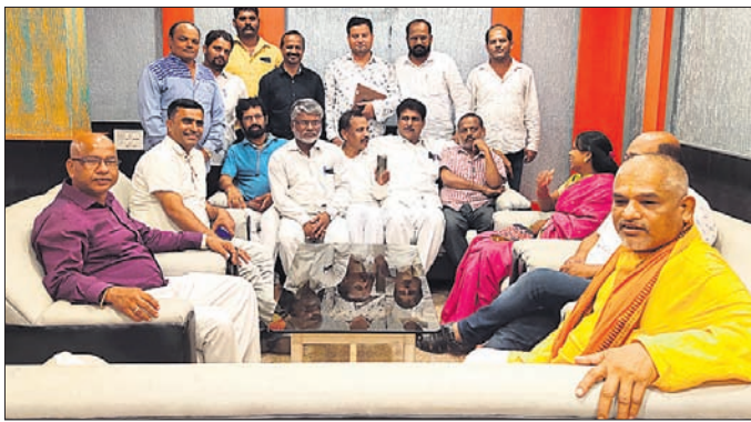
ଗଞ୍ଜାମ ଭାଜପାର ଜରୁରୀ ବୈଠକରେ ଉପସ୍ଥିତ ନେତା।