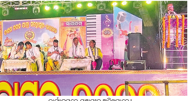
କାର୍ଯ୍ୟକ୍ରମରେ ମହାସାଧନ ଅତିଥିମାନେ।

ଖମାର, ୧୦୧୫(ଡି.ଏନ.ଏ.): ଖମାର ପାଳିଲହଡ଼ା ଉପଖଣ୍ଡ ଖମାରଠାରେ ଖମାର ଗ୍ରାମ୍ୟ କମିଟି ଓ ଯୁବକ ସଂଘ ଫେରିଥିଲେ।