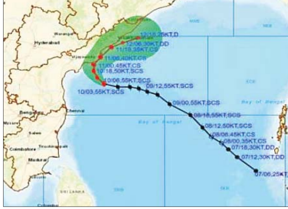
ପୁରୀରେ ପର୍ଯ୍ୟଟକ ଓ ମହାଜାବାଙ୍କୁ ସତର୍କ କରାଇ ଦିଆଯାଇଛି (ବାମ)। ପାଣିପାଗ ବିଭାଗ ପକ୍ଷରୁ ଜାରି ବାତ୍ୟାର ଗତି ଚିତ୍ର।