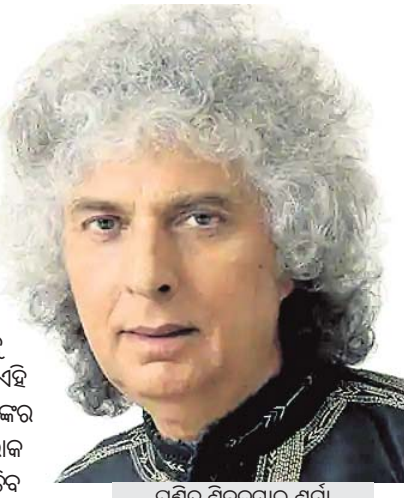
ପଞ୍ଚିତ ଶିବକୁମାର ଶର୍ମା