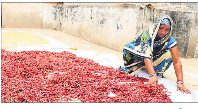
"ଅମଳ ହେଉଥିବା ପ୍ରତ୍ୟେକ ଫସଲକୁ ଖାଇବା ସ୍ତରକୁ ପହଞ୍ଚାଇବା ପାଇଁ କିଛି ପ୍ରକ୍ରିୟାକରଣ କରାଯାଇଥାଏ । ଏହି ଖାଦ୍ୟପଦାର୍ଥର ବାମ୍ ଫୁଲ ଫସଲର ବାମ୍ ଅପେକ୍ଷା ଅଧିକ ହୋଇଥାଏ । ତେଣୁ ଗ୍ରାମାଞ୍ଚଳରେ ଅମଳ ହେଉଥିବା ନିର୍ଦ୍ଦିଷ୍ଟ ଫସଲକୁ ଅଳ୍ପ ସୂତ୍ରି ବିନିଯୋଗିକରଣ ସହଜ ଓ ସରଳ ଜ୍ଞାନକୌଶଳ ଦ୍ଵାରା ଲାଭଜନକ ବ୍ୟବସାୟ କରାଯାଇପାରିବ ଯାହା କୃଷିଜୀବୀ ମହିଳାମାନଙ୍କର ଆୟବୃଦ୍ଧି ଓ ନିୟୁତ୍ରି ସୁଯୋଗ ସୃଷ୍ଟିରେ ସହାୟକ ହୋଇପାରିବ ।"

ଓ ଗୁଣ୍ଡ ତାଲି ଇତ୍ୟାଦିର ଉପଯୋଗରେ ଆଧୁନିକ ଯୁଗର ଚାହିଦା ପୂରାଇବା ବିଭିନ୍ନ ପ୍ରକାର ଜଳଖିଆ, ସ୍ନାକ୍ସ, ଡ୍ରଷ୍ଟା, ପାୟା ଇତ୍ୟାଦି ପ୍ରସ୍ତୁତ କରାଯାଇପାରିବ ।