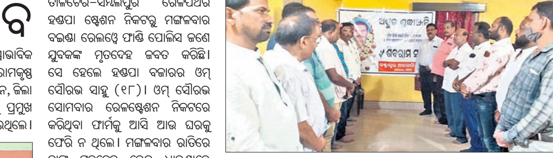
ଶୋକସଭାରେ ଉପସ୍ଥିତ ସିପିପି ଠିକାଦାର ସଂଘ ସଦସ୍ୟମାନେ।

ଡାକ୍ତର-ସମ୍ବଲପୁର ରେଳପଥର ହସ୍ତପା ଷ୍ଟେସନ ନିକଟରୁ ମଙ୍ଗଳବାର ବଲଶା ରେଳଠେ ପାଣ୍ଡି ପୋଲିସ୍ ଜଣେ ଯୁବକଙ୍କ ମୃତଦେହ ଜବତ କରିଛି।