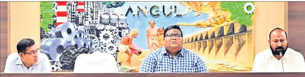
ବୈଠକରେ ଜିଲାପାଳ ଓ ଡାକ୍ତର ବିଧାୟକ ଉପସ୍ଥିତ ଅଛନ୍ତି।

ଅନୁଗୋଳ ଜିଲ୍ଲା ଡାକ୍ତରଠାରେ ମିମ୍ବାର ହୋଇଥିବା ୧୦୦ ଶଯ୍ୟା ବିଶିଷ୍ଟ ମହାନଦୀ ଇନ୍‌ସ୍ଟିଚ୍ୟୁଟ ଅଫ୍ ମେଡିକାଲ ସାଇନ୍ସ ଆଣ୍ଡ ଡିସିଏଲ୍ ସେଣ୍ଟର (ମିମ୍ବାର) ଶୀଘ୍ର କାର୍ଯ୍ୟକ୍ଷମ ହେବାର ଆଶା ଉଜ୍ଜୀବିତ ହୋଇଛି।