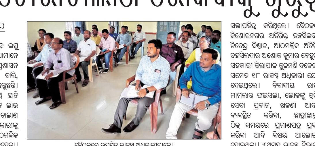
ବୈଠକରେ ଉପସ୍ଥିତ ରାଜ୍ୟ ଅଧିକାରୀମାନେ।