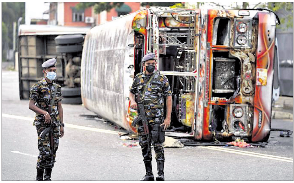
କଲମ୍ବୋରେ ସରକାର ବିରୋଧୀ ଓ ସମର୍ଥକଙ୍କ ମଧ୍ୟରେ ସଂଘର୍ଷରୁ ଭାଙ୍ଗିଯାଇଥିବା ଏକ ଗାଡ଼ି ନିକଟରେ ଯବାନ ଛିଡ଼ା ହୋଇଛନ୍ତି।

ବିକ୍ଷୋଭକାରୀଙ୍କୁ ଗୁଳିକରି ମାରିବା ପରେ ଆନ୍ଦୋଳନକାରୀ ଚାଲି ଘେରିଯିବାରୁ ସେ ନିଜକୁ ଗୁଳିକରି ଆତ୍ମହତ୍ୟା କରିଥିଲେ। ଘଟଣାସ୍ଥଳକୁ ଏମ୍‌ପିଙ୍କ ଅଙ୍ଗରକ୍ଷାକ ପୁତ୍ରଦେହ ମଧ୍ୟ ମିଳିଥିଲା। ସେଠାରେ ହିନ୍ଦୀକାଣ୍ଡନିତ ମୃତ୍ୟୁସଂଖ୍ୟା ୮ରେ ପହଞ୍ଚିଲାଣି। କଲମ୍ବୋ ଏବଂ ଅନ୍ୟ ସହରରେ ଘଟିଥିବା ହିନ୍ଦୀରେ ୨୨୫ରୁ ଊର୍ଦ୍ଧ୍ୱ ଆହତ ହେଲେଣି। ବିକ୍ଷୋଭକାରୀମାନେ ମହିଦାଙ୍କ ପୈତୃକ ଘରକୁ ଗତ ରାତିରେ ଗୁଳିକରି ଦେଖିଥିଲେ। ହିନ୍ଦୀ ରୋକିବା ପାଇଁ ଦେଶବ୍ୟାପୀ କର୍ମୀଙ୍କୁ ଜାରି ହେବା ସହ ହଜାର ନିର୍ଦ୍ଦେଶ ଦିଆଯାଇଛି। ମହିଦାଙ୍କ ଇସ୍ରାଏଲ ସହ ବେସ୍‌କୁ ଚାଲିଯାଇଥିବାବେଳେ ଏହା ବାହାରେ ବିକ୍ଷୋଭ ଜୋରଦାର ହୋଇଛି। ସୋମବାର ପୂର୍ବତନ ପ୍ରଧାନମନ୍ତ୍ରୀଙ୍କ ସମର୍ଥକ ଓ ସରକାର ବିରୋଧୀ ବିକ୍ଷୋଭକାରୀଙ୍କ ମଧ୍ୟରେ ସଂଘର୍ଷ ଘଟିଥିଲା। ବିକ୍ଷୋଭକାରୀମାନେ ଶାନ୍ତିପୂର୍ଣ୍ଣ ଭାବେ ପ୍ରଧାନମନ୍ତ୍ରୀଙ୍କ ଇସ୍ରାଏଲ ଦାବିରେ ଆନ୍ଦୋଳନ ଚଳାଇଥିବାବେଳେ ମହିଦାଙ୍କ ସମର୍ଥକମାନେ ସେମାନଙ୍କ ଉପରେ ଆକ୍ରମଣ କରିଥିଲେ। ଶାସକ ଦଳ ଏମ୍‌ପି ଅନୁକାଳି ଅଧିକାରୀଙ୍କୁ ୨ ଜଣ