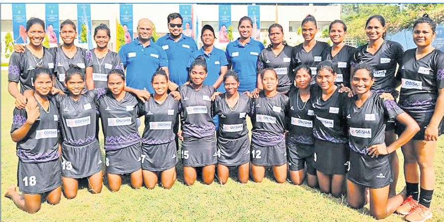
ଓଡ଼ିଶା ସିନିୟର ମହିଳା ହକି ଦଳ।

ଭୋପାଳରେ ଚାଲିଥିବା ଜାତୀୟ ସିନିୟର ମହିଳା ହକିରେ ଓଡ଼ିଶା ମଜଲୁମ୍ ୧୧-୦ ଗୋଲରେ କେରଳକୁ ପରାସ୍ତ କରିଛି। ପ୍ରତିଯୋଗିତାରେ ଏହା ହେଉଛି ଓଡ଼ିଶାର କ୍ରମାଗତ ତୃତୀୟ ବିଜୟ। ନିଜର ପ୍ରଥମ ମ୍ୟାଚରେ ଦଳ ୧୪-୦ ଗୋଲରେ ଚେଲମ୍ପାକୁ ପରାସ୍ତ କରିଥିଲା। ୨ ବିଜୟ ସହ ଓଡ଼ିଶା ପୁଲ୍ 'ଏର୍'ରେ ୬ ପଏଣ୍ଟ ସହିତ ନିଜ ଶୀର୍ଷସ୍ଥାନକୁ ସୁଦୃଢ଼ କରିଛି। ଦଳ ୨୫ଟି ଗୋଲ ଦେଇ ସାରିଥିଲେ ହେଁ ଏପର୍ଯ୍ୟନ୍ତ ଗୋଟିଏ ହେଲେ ଗୋଲ ବରଣ କରିନାହିଁ। ଏହି ପ୍ରସ୍ତର ଅନ୍ୟତମ ଦଳ ହିମାଚଳ ପ୍ରଦେଶ ମଧ୍ୟ ୨ ମ୍ୟାଚରୁ ୬ ପଏଣ୍ଟ ପାଇଛି। ତେବେ ଗୋଲ ବ୍ୟବଧାନରେ ଏହି ଦଳ ବହୁ ପଛରେ ରହିଛି। ଓଡ଼ିଶା ଓ