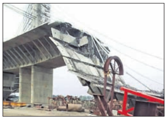
ଗାନ୍ଧୀ ପୁଷ୍ପାପତ୍ତନାହିଁ ଏଥିରେ କିଛି ନା କିଛି ତ୍ରୁଟି ନିଶ୍ଚୟ ରହିଛି। ବ୍ରିଜ୍ ଭୁଣ୍ଡିବା ଘଟଣାର ତଦନ୍ତ ପାଇଁ ମୁଖ୍ୟମନ୍ତ୍ରୀ ନୀତିନ କୁମାର ନିର୍ଦ୍ଦେଶ ଦେଇଥିବା ସୁଲତାନଗଞ୍ଜ ବିଧାନସଭା ସରକାର ନିଯୁକ୍ତ କରିପାରନ୍ତି କିମ୍ବା ଇସ୍ରାଏଲ ଦେଇପାରନ୍ତି ଅଥବା ଆନ୍ଦୋଳନ ଦମନ ଲାଗି ଅଧିକ ସୈନ୍ୟ ଓ ପୋଲିସ୍ ପୁତ୍ରଘନ କରିପାରନ୍ତି ବୋଲି କୁହାଯାଇଛି।

ବିହାରର ସୁଲତାନଗଞ୍ଜରେ ଏକ ନିର୍ମାଣାଧୀନ ବ୍ରିଜ୍ ଭାଙ୍ଗିବାର କାରଣକୁ ନେଇ ଚର୍ଚ୍ଚା ଜୋର ଧରିଛି। ସ୍ୱାସ୍ଥ୍ୟକରଣରେ ଜଣେ ଆଇଏସ୍‌ସ୍ ଅଧିକାରୀ ପୋଲି ଭାଙ୍ଗିବାରେ ପବନକୁ ଦାୟୀ କରିବା ଆଶ୍ୱର୍ଯ୍ୟକର ବୋଲି କହି କେନ୍ଦ୍ର ସଡ଼କ ପରିବହନ ମନ୍ତ୍ରୀ ନୀତିନ ଗଡ଼କରୀ ବିହାରରେ ନୀତିନ କୁମାରଙ୍କ ସରକାରକୁ ପରୋକ୍ଷରେ ସମାଲୋଚନା କରିଛନ୍ତି। ସୁଲତାନଗଞ୍ଜରେ ଗଙ୍ଗା ନଦୀ ଉପରେ ନିର୍ମାଣାଧୀନ ଏକ ପୋଲ ଗତ ଏପ୍ରିଲ ୨୯ରେ ଭୁଣ୍ଡି ଯାଇଥିଲା। ଏଥିରେ କେହି ମୃତ୍ୟୁ ହତ ହୋଇ ନ ଥିଲେ। ଏଠାରେ ଏକ କାର୍ଯ୍ୟକ୍ରମରେ ଯୋଗ ଦେଇ ଗଡ଼କରୀ କହିଛନ୍ତି, ବ୍ରିଜ୍ ଭାଙ୍ଗିବାର କାରଣ ସମ୍ପର୍କରେ ସେ ତାଙ୍କ ସଚିବଙ୍କୁ ସ୍ୱାସ୍ଥ୍ୟକରଣ ମାଗିଥିଲେ। ହେଲେ ଆଇଏସ୍‌ସ୍ ଅଧିକାରୀଙ୍କ କଥାରେ ସେ ଆଶ୍ୱର୍ଯ୍ୟ ହୋଇଥିଲେ। ଗଡ଼କରୀ କହିଥିଲେ, ପବନରେ କିପରି ଏକ ପୋଲ ଭାଙ୍ଗିପାରିବ