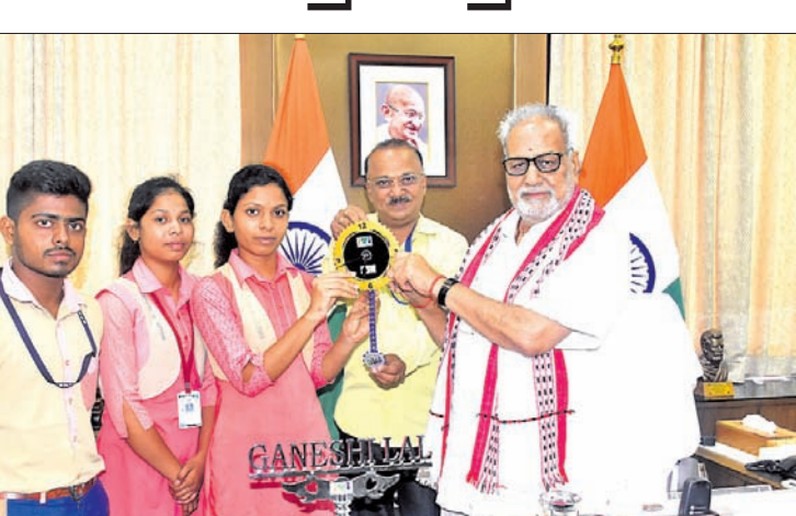
ଆଇଟିଆଇ ଅଧ୍ୟକ୍ଷ ଓ ଛାତ୍ରୀଛାତ୍ରଙ୍କ ସହ ରାଜ୍ୟପାଳ ପ୍ରଫେସର ଗଣେଶୀ ଲାଲ ।

ବ୍ରହ୍ମପୁର ଅଫିସ, ୧୦।୫ ରାଜ୍ୟପାଳଙ୍କ ନାମଫଳକକୁ ପ୍ରଦାନ କରିଥିଲେ। ଯାହାକୁ ରାଜ୍ୟପାଳ ପ୍ରଶଂସା କରିବା ସହ ଛାତ୍ରୀଛାତ୍ର ଓ ଅଧ୍ୟକ୍ଷଙ୍କୁ ପୁରସ୍କାର ରାଶି ପ୍ରଦାନ କରିଛନ୍ତି। ଏହି ସାକ୍ଷାତକାର ସମୟରେ ରାଜ୍ୟପାଳ କହିଥିଲେ, ଆଇଟିଆଇ ଛାତ୍ରୀଛାତ୍ର ରାଜ୍ୟର ଭବିଷ୍ୟତ। ଏହି ଶିକ୍ଷାନୁଷ୍ଠାନର ଛାତ୍ରୀଛାତ୍ରଙ୍କୁ ଦକ୍ଷତା ବିକାଶ କ୍ଷେତ୍ରରେ ସମସ୍ତ ପ୍ରକାର ସହଯୋଗ ପ୍ରଦାନ କରାଯିବ ବୋଲି ରାଜ୍ୟପାଳ କହିଥିବା ଶିକ୍ଷାନୁଷ୍ଠାନ ଅଧ୍ୟକ୍ଷ ସୂଚନା ଦେଇଛନ୍ତି।