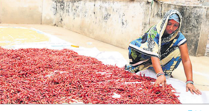
“ଅମଳ ହେଉଥିବା ପ୍ରତ୍ୟେକ ଫସଲକୁ ଖାଇବା ସ୍ତରକୁ ପହଞ୍ଚାଇବା ପାଇଁ କିଛି ପ୍ରକ୍ରିୟାକରଣ କରାଯାଇଥାଏ । ଏହି ଖାଦ୍ୟପଦାର୍ଥର ଦାମ୍ ମୂଲ୍ୟ ଫସଲର ଦାମ୍ ଅପେକ୍ଷା ଅଧିକ ହୋଇଥାଏ । ତେଣୁ ଗ୍ରାମାଞ୍ଚଳରେ ଅମଳ ହେଉଥିବା ନିର୍ଦ୍ଦିଷ୍ଟ ଫସଲକୁ ଅଳ୍ପ ପୁଞ୍ଜି ବିନିଯୋଗିକରି ସହଜ ଓ ସରଳ ଜ୍ଞାନକୌଶଳ ଦ୍ୱାରା ଲାଭଜନକ ବ୍ୟବସାୟ କରାଯାଇପାରିବ ଯାହା କୃଷିଜୀବୀ ମହିଳାମାନଙ୍କର ଆୟବୃଦ୍ଧି ଓ ନିମ୍ନସ୍ତରୀୟ ସୁଯୋଗ ସୃଷ୍ଟିରେ ସହାୟକ ହୋଇପାରିବ ।”

ଓ ରୁଣ୍ଡ ତାଲି ଇତ୍ୟାଦିର ଉପଯୋଗରେ ଆଧୁନିକ ଯୁଗର ଚାହିଦା ମୁତାବକ ବିଭିନ୍ନ ପ୍ରକାର ଜଳଖିଆ, ସ୍ନାକ୍ସ, ଫୁଡ୍ସ, ପାତ୍ରା ଇତ୍ୟାଦି ପ୍ରସ୍ତୁତ କରାଯାଇପାରିବ । ଏହା ଏକ ଲାଭଜନକ ପଦ୍ଧତି କାରଣ ଏହି କଞ୍ଚାମାଲଗୁଡ଼ିକ ରୋଗାଣୁ ଭାବରେ ବ୍ୟବହୃତ ହୁଏ ଏବଂ ଶସ୍ତ୍ରୀୟ ଦରରେ ମିଳିଥାଏ । ଧାନ ଓ ତାଲି କାଟାୟ ଫସଲ ଛଡ଼ା ଆମ ରାଜ୍ୟରେ ଚାଷ ହେଉଥିବା ଅନ୍ୟାନ୍ୟ କ୍ଷୁଦ୍ର ଶସ୍ୟ ଯଥା ମାଉଁଶିଆ ଚାଷ ଆଦି ଖର୍ଚ୍ଚ ସାପେକ୍ଷ ନୁହେଁ । ଏଥିରେ ଥିବା ପୋଷକ ତତ୍ତ୍ୱ ଉଚ୍ଚକୋଷ୍ଠୀର ହେଲେ ମଧ୍ୟ ଏହି କ୍ଷୁଦ୍ର ଶସ୍ୟର ପ୍ରକ୍ରିୟାକରଣ ଅପେକ୍ଷାକୃତ କଷ୍ଟକର ହୋଇଥିବାରୁ ଏହାର ଚାଷ ପାଇଁ ଅନାଗ୍ରହ ପରିଲକ୍ଷିତ ହେଉଛି । କିନ୍ତୁ ଖୁସିର କଥା, ଆଜିର ଦିନରେ କମ୍ କ୍ଷମତା ବିଶିଷ୍ଟ କିଛି ଯନ୍ତ୍ର ଉପଲବ୍ଧ ହେଉଛି, ଯେଉଁଥିରେ କେଣ୍ଡାକୁ ଶସ୍ୟ ଓ