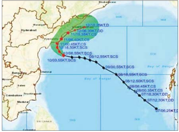
ପୁରୀରେ ପର୍ଯ୍ୟଟକ ଓ ମହାଜାବାଙ୍କୁ ସତର୍କ କରାଇ ଦିଆଯାଇଛି (ବାମ)। ପାଣିପାଗ ବିଭାଗ ପକ୍ଷରୁ ଜାରି ବାତ୍ୟାର ଗତି ଚିତ୍ର।