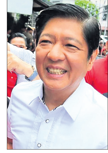
ଫର୍ଡିନାଣ୍ଡ ମାର୍କୋସ୍ ଜୁନିୟର

୧୯୮୯ରେ ମାର୍କୋସ୍ ଜୁନିୟରଙ୍କ ବାପାଙ୍କ ମୃତ୍ୟୁ ଘଟିଥିଲା। ଏହା ପରେ ମାର୍କୋସ୍ ଜୁନିୟରଙ୍କ ମା’ ଲମେଲବା ମାର୍କୋସ୍ କ୍ଷମତା ହାସଲ ପାଇଁ ୨ ଥର ଉଦ୍ୟମ କରି ବିଫଳ ହୋଇଥିଲେ। ବାପାଙ୍କ କର୍ତ୍ତୃତ୍ୱ ପାଇଁ ମାର୍କୋସ୍ ଜୁନିୟର କ୍ଷମା ମାଗିବାକୁ ପୂର୍ବରୁ ମନା କରିଥିଲେ। ତେବେ ମାର୍କୋସ୍ ଜୁନିୟରଙ୍କ ବିଜୟ ଆମେରିକା ପାଇଁ ସମସ୍ୟା ସୃଷ୍ଟି କରିପାରେ। ଏହି ଦେଶରେ ଗାଜନୀର ପ୍ରଭାବ ହ୍ରାସ ପାଇଁ ଆମେରିକା ଉଦ୍ୟମ କରିଆସୁଥିବାବେଳେ ବେଙ୍ଗ୍ ପ୍ରତି ମାର୍କୋସ୍ ଅଧିକ ଢଳିବା ଖୁଶିବନ୍ଦ ପାଇଁ ବିଚାର କାରଣ ହୋଇପାରେ। ମାର୍କୋସ୍ ଜୁନିୟର ବିଦେଶ ନୀତି ସମ୍ପର୍କରେ ବିଶେଷ କରି କହି ନ ଥିଲେ ହେଁ ତାଜନା ସହ ସେ ଭଲ ସମ୍ପର୍କ ଗଢ଼ୁଥିବା ଏକ ସାକ୍ଷାତ୍‌କାରରେ ପ୍ରକାଶ କରିଥିଲେ।