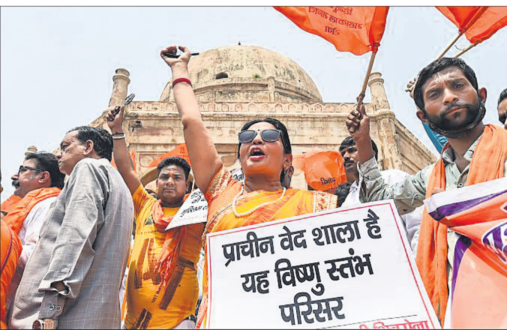
କୁତବ୍‌ମିନାର ନାଁ ବଦଳାଇ ବିଷ୍ଣୁ ସ୍ତମ୍ଭ ରଖିବା ଦାବିରେ ମଙ୍ଗଳବାର ହିନ୍ଦୁ ସଂଗଠନ କର୍ମୀମାନେ ଆନ୍ଦୋଳନ କରୁଛନ୍ତି।

କଲରାତୋ ସାଂଖ୍ୟୋଡୋମିନୋ ତଥା କ୍ୱେଲିଭିଷ୍ଟା ଜେଲ ଦଙ୍ଗାରେ ୪୩ ବନ୍ଦୀଙ୍କ ପ୍ରାଣହାନି ହୋଇଥିବାବେଳେ ୧୦୮ ଜଣ ଫେରାର ଅଛନ୍ତି। ଅନ୍ୟ ୧୦୦ ବନ୍ଦୀ କେଲକୁ ଛୁଟି ପଳାଇବାକୁ ଉଦ୍ୟମ କଲାବେଳେ ଧରାପଡ଼ିଛନ୍ତି। କେଲରେ ଥିବା ଦୁଇ ଗୋଷ୍ଠୀ ଚିତାଇ ଲୋସ୍ ଲୋସ୍ ଏବଂ ଆର୍ ୬ ମଧ୍ୟରେ ସଂଘର୍ଷ ହୋଇଥିଲା। ଏଥିରେ ୧୩ ବନ୍ଦୀ ଆହତ ହୋଇଛନ୍ତି। ଜେଲ ଭିତରେ ନିଶା କାରବାର ସାଙ୍ଗକୁ ଆବଶ୍ୟକ ରହିବା ସ୍ଥାନର ଅଭାବ କାରଣରୁ ଜେଲ ଭିତରେ ଦଙ୍ଗା ହୋଇଥାଏ।