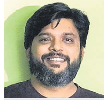
ଅନ୍ୟ ୩ ଭାରତୀୟ ଫଟୋଜର୍ନାଲିଷ୍ଟ ପୁରସ୍କୃତ ବ୍ୟକ୍ତି, ୧୦୧୫