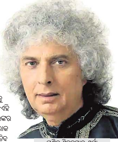
ପଞ୍ଚିତ ଶିବକୁମାର ଶର୍ମା