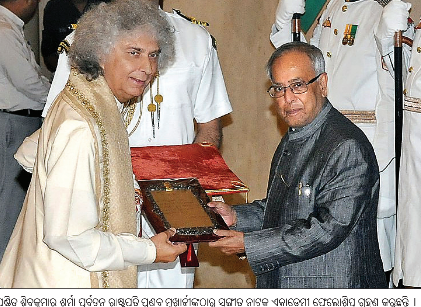
ପଣ୍ଡିତ ଶିବକୁମାର ଶର୍ମା ପୂର୍ବତନ ରାଷ୍ଟ୍ରପତି ପ୍ରଣବ ମୁଖାର୍ଜୀଙ୍କଠାରୁ ସଙ୍ଗୀତ ନାଟକ ଏକାଡେମୀ ଫେଲୋଶିପ୍ ପ୍ରଦାନ କରୁଛନ୍ତି।