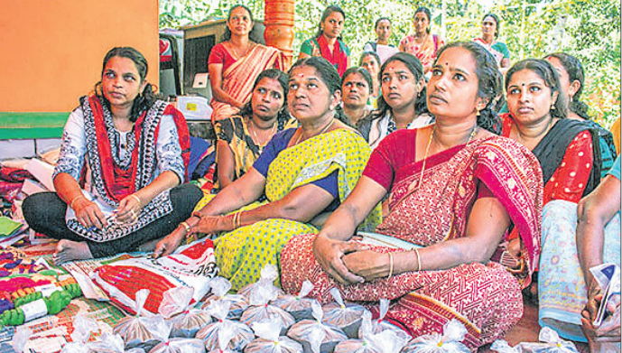
ଖାଦ୍ୟପ୍ରକ୍ରିୟାକରଣର ସୁଯୋଗ : ଆମ ରାଜ୍ୟରେ ପ୍ରଚୁର ପରିମାଣରେ ଶସ୍ୟକାତାୟ, ପନିପରିବା, ଫଳ ଓ ମସଲା ଆଦି କୃଷିକାତ ବ୍ରଷ୍ୟ ଅମଳ ହୋଇଥାଏ । କିନ୍ତୁ ଉପଯୁକ୍ତ ପ୍ରକ୍ରିୟାକରଣ ଓ ପରିଚାଳନା ଅଭାବରୁ ଶତକଡ଼ା ୧୦ ରୁ ୪୦ ଭାଗ ପର୍ଯ୍ୟନ୍ତ ଫସଲ ନଷ୍ଟ ହୋଇଥାଏ । ତେଣୁ ଅମଳ ସମୟରେ ଶସ୍ତାରେ ମିଳୁଥିବା ଫସଲକୁ ଖାଦ୍ୟ ପ୍ରକ୍ରିୟାକରଣ ଦ୍ୱାରା ବିଭିନ୍ନ ଉତ୍ପାଦ ପ୍ରସ୍ତୁତ କରାଯାଇପାରିବ, ଯାହା ଅନେକଦିନ ପର୍ଯ୍ୟନ୍ତ ସୁରକ୍ଷିତ ହୋଇ ରହିପାରିବ ।

ଶସ୍ୟ କାତାୟ ଫସଲ : ଆମ ରାଜ୍ୟରେ ଧାନକୁ ଚାଳ ପ୍ରସ୍ତୁତ କରିବା ଏକ ମୁଖ୍ୟ ପ୍ରକ୍ରିୟା । ଏଥିପାଇଁ ଆଜିକାଲି ବିଭିନ୍ନ କ୍ଷମତା ବିଶିଷ୍ଟ ଆଧୁନିକ ଯାନକଳ ମିଳୁଛି ଯାହାକୁ ବ୍ୟବସାୟିକ ଭିତ୍ତିରେ ବ୍ୟବହାର କରାଯାଇପାରିବ । ସେହିପରି ଆମର ବିଭିନ୍ନ ଡାଲିକାତାୟ ଫସଲ ଯଥା: ମୁଗ, ବିରି, ହରଡ଼, ମଟର, କୋଳଥ ଆଦିର ଚୋପା ଛଡ଼େଇ ସେଥିରୁ ଫଳ ପ୍ରସ୍ତୁତ ପାଇଁ ବିଭିନ୍ନ ଡାଲିକଳ ମିଳୁଛି ଯାହାକି କୃଷିଜୀବୀ ମହିଳା ବ୍ୟବସାୟିକ ସ୍ତରରେ ବ୍ୟବହାର କରିପାରିବେ । ଏସବୁ ଛଡ଼ା ଧାନକଳ ଓ ଡାଲିକଳରୁ ବାହାରିଥିବା ଭଙ୍ଗା ଚାଉଳ