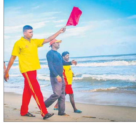
ସୁନ୍ଦର ପର୍ଯ୍ୟଟକ ଓ ମହାଜାବାଙ୍କୁ ସତର୍କ କରାଇ ଦିଆଯାଇଛି (ବାମ)। ପାଣିପାଗ ବିଭାଗ ପକ୍ଷରୁ ଜାରି ବାତ୍ୟାଗ ଗତି ଚିତ୍ର।

ବାତ୍ୟା 'ଅସାନି' ରୁପବାର ପୂର୍ବାହ୍ନ ୧୧ ସୁଦ୍ଧା ଆନ୍ଧ୍ରପ୍ରଦେଶର କାକିନାଡ଼ା-ବିଶାଖାପାଟଣା ମଧ୍ୟଦେଇ ସ୍ଥଳଭାଗ ଜଗତର ଅପୂରଣୀୟ କ୍ଷତି ହେଲା ବୋଲି ପ୍ରଧାନମନ୍ତ୍ରୀ କହିବା ସହ ତାଙ୍କ ପରିବାର ଓ ଆତ୍ମୀୟ ସ୍ୱଜନଙ୍କୁ ସମ୍ବେଦନା ଜଣାଇଛନ୍ତି। ଶିବକୁମାରଙ୍କ ପରଲୋକରେ ଏକ ସୁନ୍ଦର ଅବସାନ ହେଲା। ସଙ୍ଗୀତ କ୍ଷେତ୍ରକୁ ତାଙ୍କ ଅବଦାନ ଅନୁଲମ୍ବୀୟ ବୋଲି ସରୋଦ ବ୍ୟକ୍ତି ଶୋକବ୍ୟକ୍ତ କରିଛନ୍ତି। ପଞ୍ଚମ ଶିବକୁମାରଙ୍କ ସନ୍ତୁର ନୀରବ ହୋଇଯିବା