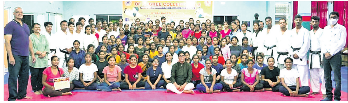
ଉତ୍କଳ କରାଟେ ସ୍କୁଲରେ ଅନୁଷ୍ଠିତ ଆତ୍ମରକ୍ଷା ପ୍ରଶିକ୍ଷଣ ଶିବିରରେ ଅଂଶଗ୍ରହଣ କରିଥିବା ଛାତ୍ରୀମାନେ ଟ୍ରେନରଙ୍କ ସହ ।

ଭୁବନେଶ୍ୱର, ୧୦୫ (ସୋର୍ସ୍ ନ୍ୟୁସ୍): ଉତ୍କଳୀୟ ବିଭାଗ ଆନୁକୂଲ୍ୟରେ ଉତ୍କଳ କରାଟେ ସ୍କୁଲ ଦ୍ୱାରା ଓଡ଼ିଶାର ବିଭିନ୍ନ ଜିଲାରୁ ୩୩ ଛାତ୍ରୀମାନଙ୍କୁ ଦିଆଯାଇଥିବା ଆତ୍ମରକ୍ଷା କୌଶଳ 'ରିଆକ୍ଟ'ର ସପ୍ତମ ବ୍ୟାଚ୍ ପ୍ରଶିକ୍ଷଣ ମଙ୍ଗଳବାର ହୋଇଯାଇଛି। ଏହି ବ୍ୟାଚରେ ସମଲପୁର, ସୁନ୍ଦରଗଡ଼, ଝାରସୁନ୍ଦରୀରୁ ମୋଟ ୧୧୦ଜଣ ଛାତ୍ରୀ ଏଥିରେ ଅଂଶଗ୍ରହଣ କରିଥିଲେ। ଉଦ୍‌ଯାପନା ଉତ୍ସବରେ ଉତ୍କଳୀୟ ଓ କୃଷି ବିଭାଗ ମନ୍ତ୍ରୀ ମଙ୍ଗଳବାର ହୋଇଯାଇଛି। ଏହି ବ୍ୟାଚରେ ସମଲପୁର, ସୁନ୍ଦରଗଡ଼, ଝାରସୁନ୍ଦରୀରୁ ମୋଟ ୧୧୦ଜଣ ଛାତ୍ରୀ ଏଥିରେ ଅଂଶଗ୍ରହଣ କରିଥିଲେ। ଉଦ୍‌ଯାପନା ଉତ୍ସବରେ ଉତ୍କଳୀୟ ଓ କୃଷି ବିଭାଗ ମନ୍ତ୍ରୀ