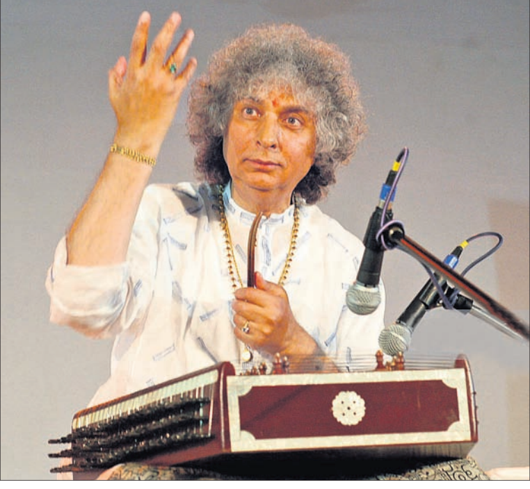
ମାତ୍ର ୫ ବର୍ଷ ବୟସରୁ ଜଣେ ତବଲା ବାଦକ ଭାବେ ସଙ୍ଗୀତ ଜଗତରେ ପାଦ ଥାପିଥିବା ଶିବକୁମାର ଶର୍ମା ଜଣେ ଲୋକ ବାଦ୍ୟଯନ୍ତ୍ର ସବୁରକୁ ବିଶ୍ୱ ଦରବାରରେ ପରିଚିତ କରାଇଥିଲେ। ତାଙ୍କର ସବୁର ବାଦନ ଶୈଳୀ ଅତ୍ୟନ୍ତ ଶୁଭ୍ର ଭାବେ ସଙ୍ଗୀତ ଜଗତରେ ପାଦ ଥାପିଥିବା ଶିବକୁମାର ଶର୍ମା ଜଣେ ଲୋକ ବାଦ୍ୟଯନ୍ତ୍ର ସବୁରକୁ ବିଶ୍ୱ ଦରବାରରେ ପରିଚିତ କରାଇଥିଲେ। ତାଙ୍କର