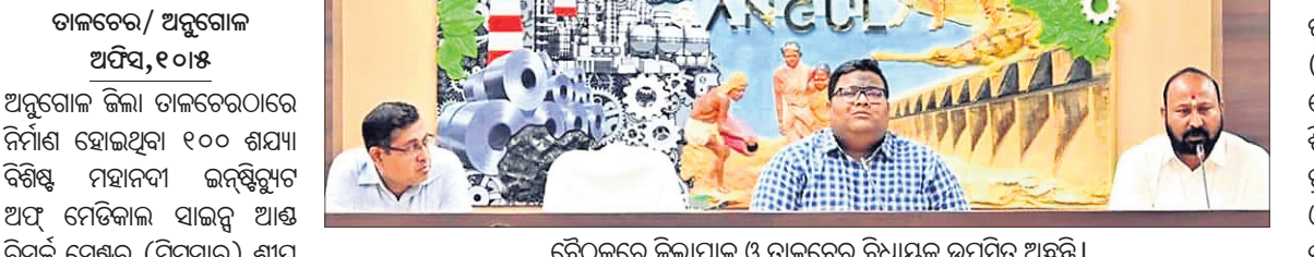
ବୈଠକରେ ଜିଲ୍ଲାପାଳ ଓ ତାଳଚେର ବିଧାୟକ ଉପସ୍ଥିତ ଅଛନ୍ତି।