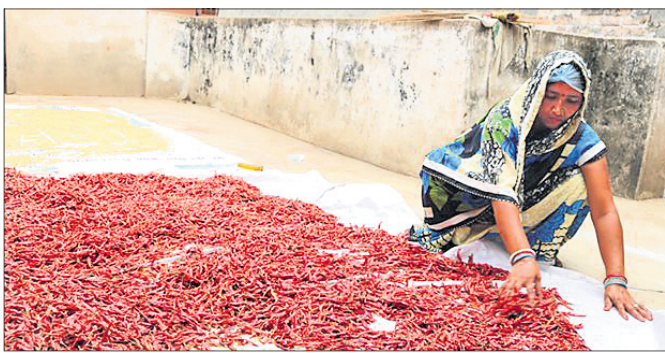
“ଅମଳ ହେଉଥିବା ପ୍ରତ୍ୟେକ ଫସଲକୁ ଖାଇବା ସ୍ତରକୁ ପହଞ୍ଚାଇବା ପାଇଁ କିଛି ପ୍ରକ୍ରିୟାକରଣ କରାଯାଇଥାଏ । ଏହି ଖାଦ୍ୟପଦାର୍ଥର ଦାମ୍ ମୂଲ୍ୟ ଫସଲର ଦାମ୍ ଅପେକ୍ଷା ଅଧିକ ହୋଇଥାଏ । ତେଣୁ ଗ୍ରାମାଞ୍ଚଳରେ ଅମଳ ହେଉଥିବା ନିର୍ଦ୍ଦିଷ୍ଟ ଫସଲକୁ ଅଳ୍ପ ପୁଞ୍ଜି ବିନିଯୋଗିକରି ସହଜ ଓ ସରଳ ଜ୍ୱାଳନକୌଶଳ ଦ୍ୱାରା ଲାଭଜନକ ବ୍ୟବସାୟ କରାଯାଇପାରିବ ଯାହା କୃଷିଜୀବୀ ମହିଳାମାନଙ୍କର ଆୟବୃଦ୍ଧି ଓ ନିମ୍ନସ୍ତର ସୁଯୋଗ ସୃଷ୍ଟିରେ ସହାୟକ ହୋଇପାରିବ ।”

ଓ ରୁଷ୍ଟ ତାଲି ଇତ୍ୟାଦିର ଉପଯୋଗରେ ଆଧୁନିକ ଯୁଗର ଚାହିଦା ମୁତାବକ ବିଭିନ୍ନ ପ୍ରକାର ଜଳଖିଆ, ସ୍ନାକ୍ସ, ଫୁଡ୍ସ, ପାୟା ଇତ୍ୟାଦି ପ୍ରସ୍ତୁତ କରାଯାଇପାରିବ । ଏହା ଏକ ଲାଭଜନକ ପଦ୍ଧତି କାରଣ ଏହି କଞ୍ଚାମାଲଗୁଡ଼ିକ ରୋଗାଣୁ ଭାବରେ ବ୍ୟବହୃତ ହୁଏ ଏବଂ ଶସ୍ତା ଦରରେ ମିଳିଥାଏ । ଧାନ ଓ ତାଲି କାତାୟ ଫସଲ ଛଡ଼ା ଆମ ରାଜ୍ୟରେ ଚାଷ ହେଉଥିବା ଅନ୍ୟାନ୍ୟ କ୍ଷୁଦ୍ର ଶସ୍ୟ ଯଥା ମାଞ୍ଜିଆ ଚାଷ ଆଦି ଖର୍ଚ୍ଚ ସାପେକ୍ଷ ନୁହେଁ । ଏଥିରେ ଥିବା ପୋଷକ ତତ୍ତ୍ୱ ଉଚ୍ଚକୋଷ୍ଠୀର ହେଲେ ମଧ୍ୟ ଏହି କ୍ଷୁଦ୍ର ଶସ୍ୟର ପ୍ରକ୍ରିୟାକରଣ ଅପେକ୍ଷାକୃତ କଷ୍ଟକର ହୋଇଥିବାରୁ ଏହାର ଚାଷ ପାଇଁ ଅନାଗ୍ରହ ପରିଲକ୍ଷିତ ହେଉଛି । କିନ୍ତୁ ଖୁସିର କଥା, ଆଜିର ଦିନରେ କମ୍ କ୍ଷମତା ବିଶିଷ୍ଟ କିଛି ଯନ୍ତ୍ର ଉପଲବ୍ଧ ହେଉଛି, ଯେଉଁଥିରେ କେଣ୍ଡା ଶସ୍ୟ ଓ