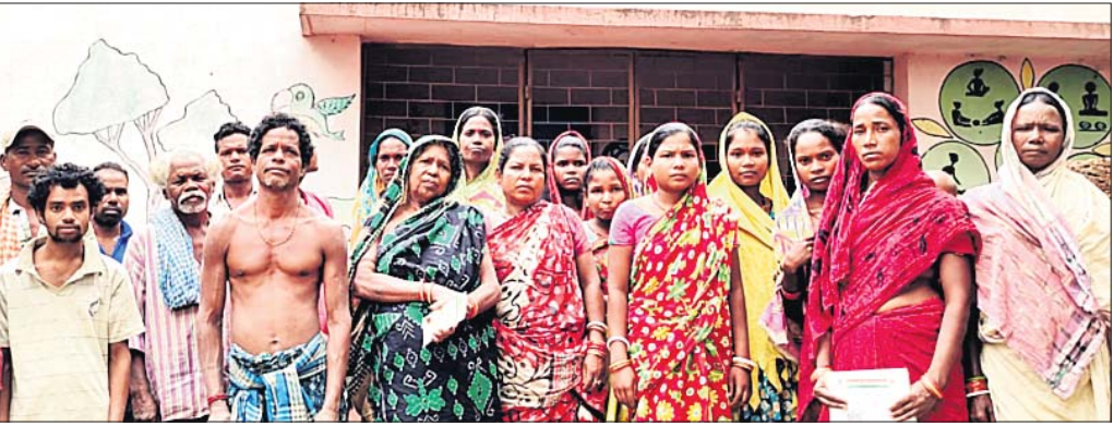
ମୌଳିକ ସୁବିଧାରୁ ବଞ୍ଚିତ ହୋଇଥିବା ବସ୍ତିବାସିନ୍ଦା।

ରାଜ୍ୟ ସରକାର ଗରିବ ବସ୍ତିବାସିନ୍ଦାଙ୍କ ପାଇଁ ଅନେକ ଯୋଜନା କରୁଛନ୍ତି। ଏହାର ସଫଳ ରୂପାୟନ ପାଇଁ ବହୁ କୋର୍ଟ ଟଙ୍କା ଖର୍ଚ୍ଚ ମଧ୍ୟ କରୁଛନ୍ତି। ହେଲେ କେତେକ ସ୍ଥାନରେ ଏହି ଯୋଜନାର ପୂର୍ବକ ବସ୍ତିବାସିନ୍ଦାମାନେ ପାଇପାରୁନାହାନ୍ତି। ଏହାକୁ ନେଇ ଅସନ୍ତୋଷ ପ୍ରକାଶ ପାଇଥିବାବେଳେ ଯୋଜନା ଦିନକୁଦିନ ହେଉଥିବା ଅଭିଯୋଗ ହେଉଛି। ଏଭଳି ଅବ୍ୟବସ୍ଥା ଦେଖିବାକୁ ମିଳିଛି ଜଗତପୁର ନୂତନ ଶିଳ୍ପାଞ୍ଚଳ ସଂଲଗ୍ନ ଚମ୍ପତି ପଞ୍ଚାୟତର ସୁନାରିବଣ ବସ୍ତିରେ। ମିଳିଥିବା ସୂଚନା ଅନୁଯାୟୀ, ପ୍ରାୟ ୩୦ ବର୍ଷ ହେବ ଉକ୍ତ ବସ୍ତିରେ ୧୦୦ରୁ ଊର୍ଦ୍ଧ୍ୱ ପରିବାର ବାସ କରୁଛନ୍ତି। ସେମାନଙ୍କ ମଧ୍ୟରୁ ୩୫ରୁ ଊର୍ଦ୍ଧ୍ୱ ପରିବାର ସରକାରୀ ଯୋଜନାରୁ ବଞ୍ଚିତ ହୋଇଛନ୍ତି। ଏପରି କି ସେମାନଙ୍କୁ ମୌଳିକ ସୁବିଧା ମଧ୍ୟ ମିଳୁନାହିଁ। ସେମାନଙ୍କ ପାଖରେ ଆଧାରକାର୍ଡ ନାହିଁ। ସେହିପରି ରାଶନ କାର୍ଡ ନ ଥିବାରୁ ବିଦ୍ୟୁତ୍ ସ୍ୱାମ୍ୟ କଲ୍ୟାଣ ଯୋଜନାରେ ଅନ୍ତର୍ଭୁକ୍ତ ହୋଇପାରୁନାହାନ୍ତି। ଫଳରେ