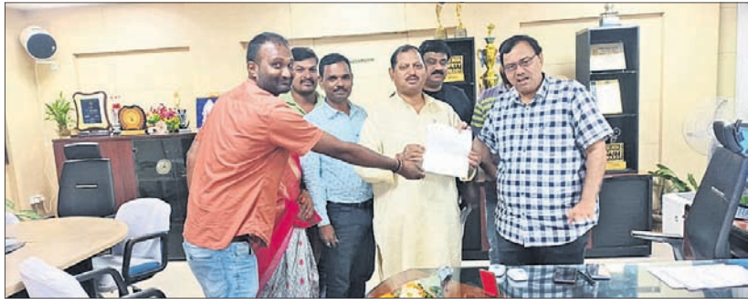
ଭାଜପା ଚରଫରୁ ଏନ୍ଟିପିସି ଇଡିକୁ ଦାବିପତ୍ର ପ୍ରଦାନ କରାଯାଇଛି ।