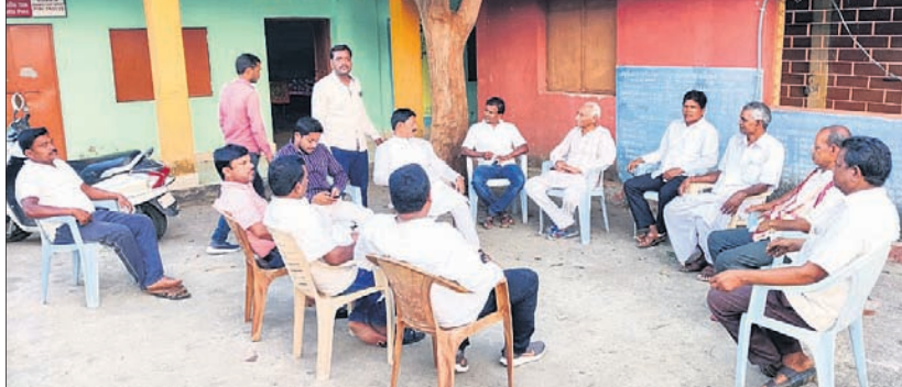
ସମ୍ମିଳନୀରେ ଉପସ୍ଥିତ ବିଧାୟକଙ୍କ ସମେତ ଅନ୍ୟମାନେ ।

ଛେଡ଼ିପଦା, ୧୨।୫(ସ.ପ୍ର.): ଛେଡ଼ିପଦା ବନାଞ୍ଚଳ ନୂଆଗାଁ ଗ୍ରାମ ତେଲିସାହିର କଷ୍ଟ ମାଝି ଗୁରୁତର ଭାଲୁ ଆକ୍ରମଣରେ ଗୁରୁତର ହୋଇଛନ୍ତି । କଷ୍ଟ ମାଝିରେ ଘର ନିକଟରେ ଥିବା ଚୁକ୍ଚାଗାଁ ନାଳକୁ ଗାଧୋଇବା ପାଇଁ ଯାଉଥିବାବେଳେ ଏକ ଭାଲୁ ତାଙ୍କୁ ଆକ୍ରମଣ କରିଥିଲା । ପରିବାର ଲୋକେ ତାଙ୍କୁ ଉଦ୍ଧାର କରି ପ୍ରଥମେ ଛେଡ଼ିପଦା ଗୋଷ୍ଠୀ ସ୍ୱାସ୍ଥ୍ୟକେନ୍ଦ୍ରରେ ଭର୍ତ୍ତି କରିଥିଲେ । ପରେ ତାଙ୍କୁ ଅନୁଗୋଳ ଡିଆଁ ମୁଖ୍ୟ ଚିକିତ୍ସାଳୟକୁ ସ୍ଥାନାନ୍ତର କରାଯାଇଛି । ତାଙ୍କୁ ସରକାରୀ ସହାୟତା ଯୋଗାଇ ଦେବାକୁ ଗ୍ରାମବାସୀ ଦାବି କରିଛନ୍ତି ।