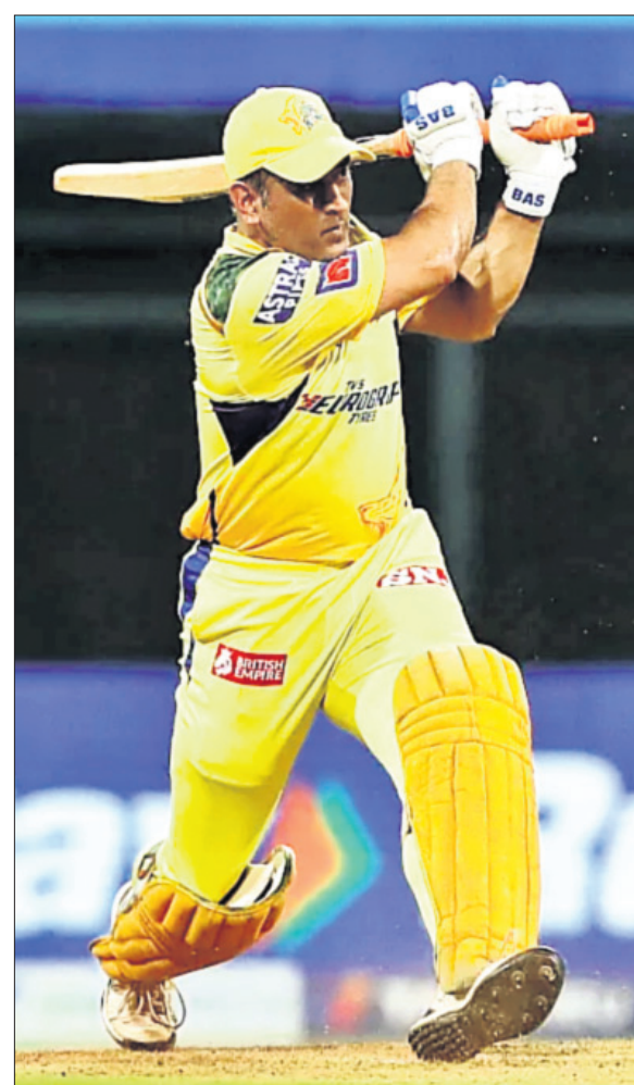
ମହେନ୍ଦ୍ର ସିଂ ଧୋନୀ