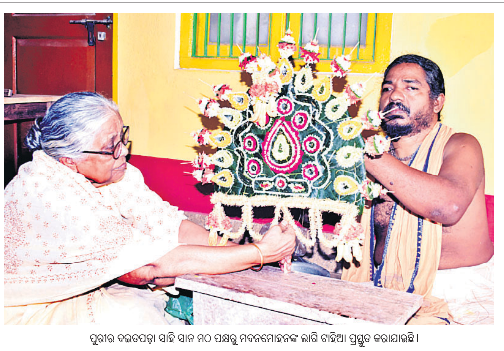
ପୁରୀର ଦଇତପଡ଼ା ସାହି ସାନ ମଠ ପକ୍ଷରୁ ମଦନମୋହନଙ୍କ ଲାଗି ଗାହିଆ ପ୍ରସ୍ତୁତ କରାଯାଇଛି ।