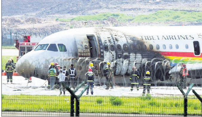
ନିଆଁ ଲାଗିବା ସହ ୪୦ରୁ ଅଧିକ ଆହତ ହୋଇଥିଲା। ବିମାନ ପୁଲ୍ କଲେଜରେ

ବେଳ୍, ୧୨/୫(ପି.ଟି.) ଚାଲିବା ବିମାନ ଦୁର୍ଘଟଣାରେ ୪୦ ଆହତ ହୋଇଥିଲା। ବିମାନଟି ଚାକିରିକରୁ ନିକଟି ଯିବାର ସମୟରେ ବିମାନ ଉଡ଼ାଣ ବେଳେ ରକ୍ତଓଷ୍ଣ ହେବା ପାଇଁ ବିମାନଟିରେ ନିଆଁ ଲାଗିଯାଇଥିଲା। ଗୁରୁବାର ଚାକିରିକରୁ ସହରେ ଏହି ଦୁର୍ଘଟଣା ଘଟିଛି। ୧୧୩ ଜଣ ଯାତ୍ରୀ ଓ ୯ କର୍ମଚାରୀଙ୍କ ସହ ତିନିଟି ବିମାନଟି ଚାକିରିକରୁ ନିକଟି ଯିବାର ସମୟରେ ବିମାନ ଉଡ଼ାଣ ବେଳେ ରକ୍ତଓଷ୍ଣ ହେବା ପାଇଁ ବିମାନଟିରେ ନିଆଁ ଲାଗିଯାଇଥିଲା। ଗୁରୁବାର ଚାକିରିକରୁ ସହରେ ଏହି ଦୁର୍ଘଟଣା ଘଟିଛି। ୧୧୩ ଜଣ ଯାତ୍ରୀ ଓ ୯ କର୍ମଚାରୀଙ୍କ ସହ ତିନିଟି ବିମାନଟି ଚାକିରିକରୁ ନିକଟି ଯିବାର ସମୟରେ ବିମାନ ଉଡ଼ାଣ ବେଳେ ରକ୍ତଓଷ୍ଣ ହେବା ପାଇଁ ବିମାନଟିରେ ନିଆଁ ଲାଗିଯାଇଥିଲା। ଗୁରୁବାର ଚାକିରିକରୁ ସହରେ ଏହି ଦୁର୍ଘଟଣା ଘଟିଛି।