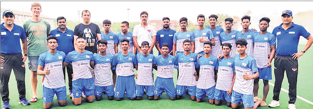
ଓଡ଼ିଶା ସେମିଫାଇନାଲରେ ପୁରୁଷ ହକି ଦଳ।

ଭୁବନେଶ୍ୱର, ୧୨।୫ (କ୍ରୀଡା ପ୍ରତିନିଧି) ଗୋଆରେ ଚାଲିଥିବା ୧୨ଶ ଜାତୀୟ ସର୍ବଜୁନିୟର ପୁରୁଷ ହକି ଚାମ୍ପିୟନଶିପ୍ରେ ସେମିଫାଇନାଲରେ ଓଡ଼ିଶା ପ୍ରଦେଶ କଳହୀ ଗୁରୁବାର ଅନୁଷ୍ଠିତ ୪ର୍ଥ କ୍ୱାର୍ଟର ଫାଇନାଲରେ