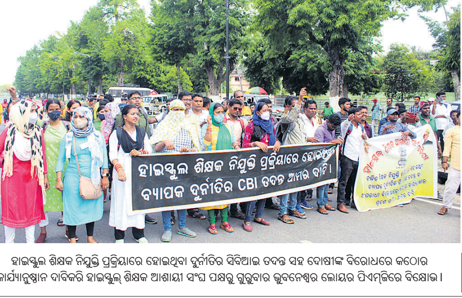
ହାଇଲୁଲ ଶିକ୍ଷକ ନିୟୁତ ପ୍ରକ୍ରିୟାରେ ହୋଇଥିବା ଦୁର୍ଗତିର ବିଦିଆଇ ତଦନ୍ତ ସହ ଦୋଷୀଙ୍କ ବିରୋଧରେ କଠୋର କାର୍ଯ୍ୟାନୁଷ୍ଠାନ ଦାବିକରି ହାଇଲୁଲ ଶିକ୍ଷକ ଆଶାୟୀ ସଂଘ ପକ୍ଷରୁ ଗୁରୁବାର ଭୁବନେଶ୍ୱର ଲୋକସଭା ପିଏମଜିରେ ବିରୋଧ ।