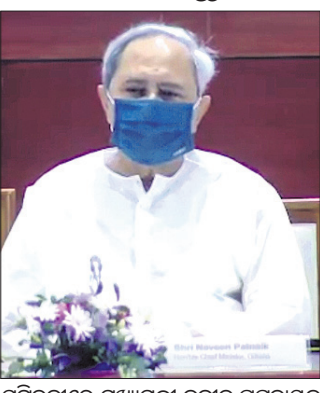
ସମ୍ମିଳନୀରେ ମୁଖ୍ୟମନ୍ତ୍ରୀ ନରୀନ ପଟ୍ଟନାୟକ

ଏହା ସମ୍ପଦ ହୋଇପାରିଛି। ବନାକରଣ ଯୋଗୁଁ ସୃଷ୍ଟି ହେଉଥିବା ଜଙ୍ଗଲ ସ୍ତରଣ ଲୋକଙ୍କ ପାଇଁ ନିରୁଦ୍ଧି ସୁଯୋଗ ସୃଷ୍ଟି କରିପାରିଛି। ରାଜ୍ୟ ସରକାରଙ୍କ ମୁକ୍ତ ଜଙ୍ଗଲ ପରିଚାଳନା ଏବଂ ଓଡ଼ିଶା ଜଙ୍ଗଲ କ୍ଷେତ୍ର ବିକାଶ ପ୍ରକଳ୍ପ ଯୋଜନା ଲୋକଙ୍କୁ ଜୀବିକା ଯୋଗାଇବା ସହ ସମଗ୍ର ଜିଲ୍ଲାରେ ସହାୟତା କରିଛି। ବିଧି ଜଙ୍ଗଲ ଯୋଜନାରେ ୨୦ଲକ୍ଷରୁ ଅଧିକ ଲୋକ ଉପକୃତ ହୋଇଛନ୍ତି। ୫-ଟି କାର୍ଯ୍ୟକ୍ରମରେ ଚାରୋଟିପାଖକୁ ସାମିଲ କରିବା, ବନାକରଣ କାର୍ଯ୍ୟରେ ଏସ୍‌ଏସ୍‌ଏସ୍ ସାମିଲ କରିବା ଲାଗି ମୁଖ୍ୟମନ୍ତ୍ରୀ ପରାମର୍ଶ ଦେଇଛନ୍ତି। ଏହାଦ୍ୱାରା ଜଙ୍ଗଲ କାର୍ଯ୍ୟରେ ନିୟୋଜିତ ସଂସ୍ଥା, ବ୍ୟକ୍ତିଗତ ଶିଳ୍ପୀମାନଙ୍କ ମଧ୍ୟରେ ସ୍ୱଚ୍ଛତା, ସମାଜସୁବର୍ତ୍ତତା ଏବଂ ଲୋକନାୟକ ସହଯୋଗ ଯୋଗୁଁ ହେବବୋଲି