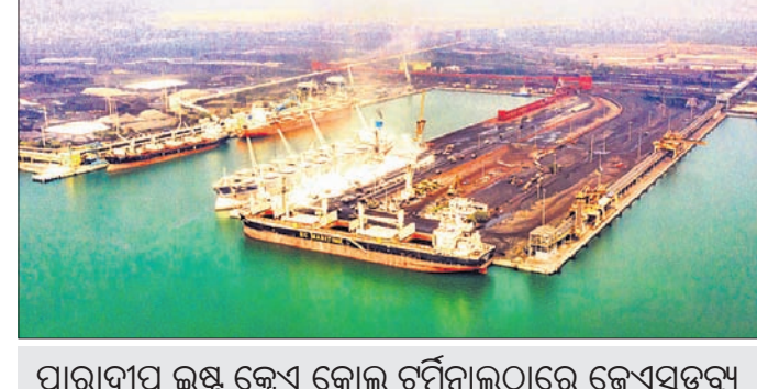
ପାରାଦୀପ ଲକ୍ଷ୍ୟ କ୍ଷେତ୍ର କୋଲ୍ ଚର୍ଚ୍ଚନାଠାରେ ଜେଏସଡିକୁ ଇନ୍‌ଫ୍ରାଷ୍ଟ୍ରକ୍ଚର ଡା'ର ବାଣିଜ୍ୟିକ କାରବାର ଆରମ୍ଭ କରିଛି

ଦେଶର ପ୍ରସ୍ତୁତ ବନ୍ଦର ତଥା ପାରାଦୀପ ଲକ୍ଷ୍ୟ କ୍ଷେତ୍ର କୋଲ୍ ଚର୍ଚ୍ଚନାଠାରେ ଜେଏସଡି କୋଲ୍ ଚର୍ଚ୍ଚନାଠାରେ ଜେଏସଡିକୁ ଇନ୍‌ଫ୍ରାଷ୍ଟ୍ରକ୍ଚର ଡା'ର ବାଣିଜ୍ୟିକ କାରବାର ନିକଟରେ ଆରମ୍ଭ କରିଛି।