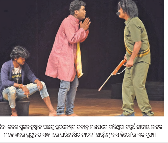
ବିଦ୍ୟାଳୟର ସୁଜନାମୁଖ୍ୟ ପକ୍ଷରୁ ଭୁବନେଶ୍ୱର ରବାନ୍ତ ମଣ୍ଡପରେ ଚାଲିଥିବା ଚତୁର୍ଥ ଜାତୀୟ ନାଟକ ମହୋତ୍ସବର ଗୁରୁବାର ସନ୍ଧ୍ୟାରେ ପରିବେଷିତ ନାଟକ 'ହାରିକିନ୍ଦ ଦାସ ହିରୋ'ର ଏକ ଦୃଶ୍ୟ ।