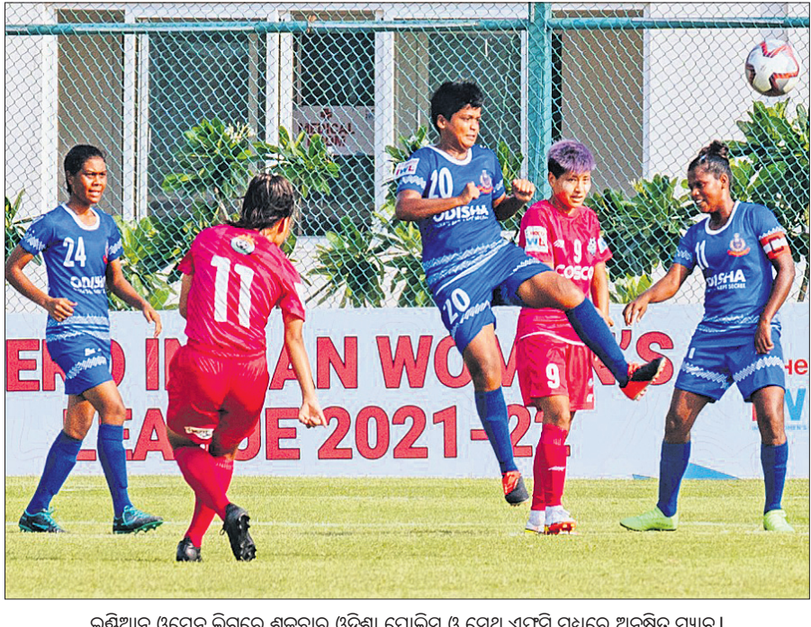
ଭଣ୍ଡିଆନ ଓମେନ୍ସ ଲିଗ୍ରେ ଶୁକ୍ରବାର ଓଡ଼ିଶା ପୋଲିସ ଓ ସେଥୁ ଏମ୍ପାଏ ମଧ୍ୟରେ ଅନୁଷ୍ଠିତ ମ୍ୟାଚ ।