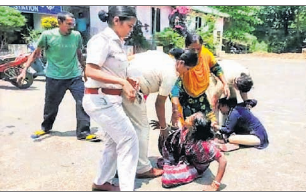
ଧାରଣାଗତ ଲୋକଙ୍କୁ ପୋଲିସ ଉଠାଇବାକୁ ଚେଷ୍ଟା କରୁଛି।