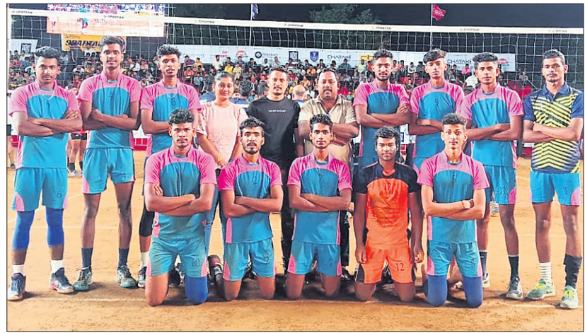
ମହାରାଷ୍ଟ୍ରର ସାଙ୍ଗଲିସ୍ଥିତ ଚାଲିଥିବା ଜାତୀୟ ଯୁବ ଭଲିବଲ ଚାମ୍ପିୟନଶିପ୍ରେ ଶୁକ୍ରବାର ଅନୁଷ୍ଠିତ ମ୍ୟାଚରେ ବିଜୟୀ ହୋଇଥିବା ଓଡ଼ିଶା ମହିଳା ଓ ପୁରୁଷ ଭଲିବଲ ଦଳ ।