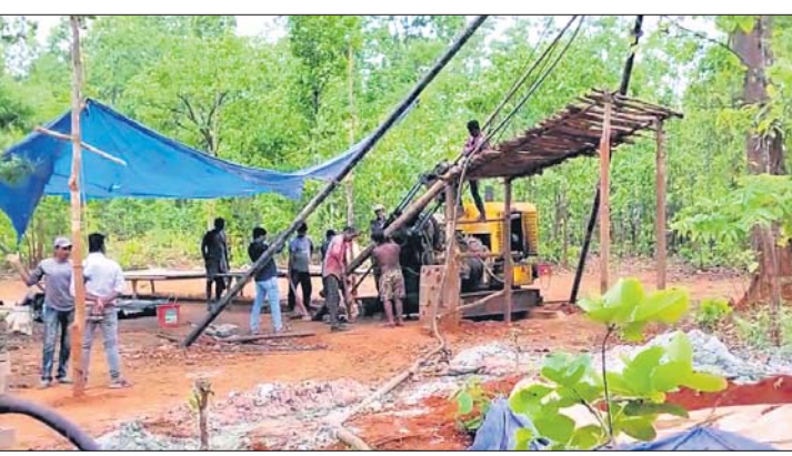
ସୁନା ଖଣି ପାଇଁ ସର୍ବେ କରାଯାଇଛି

କେନ୍ଦ୍ରରେ ଜିଲା ବାଂଶପାଳ ରୁକ୍ ଅଞ୍ଚଳରେ ସୁନା ଖଣି ସମାନ ପାଇଁ ସର୍ବେ କାର୍ଯ୍ୟ ଜାରି ରହିଛି। ଏହି ରୁକ୍ ଚା' ବରଗା ପାଇଁ ପ୍ରସିଦ୍ଧ ଚରମାକାନ୍ତ ନିକଟ ଜଳନ୍ଦି ଗ୍ରାମ ଓ ଆଖପାଖ ଅଞ୍ଚଳରେ କିଛିମାସ ତଳେ ଖନନ କରାଯାଇ ନପୁନା ସଂଗ୍ରହ କରାଯାଇଥିଲା। ଏବେ ପୁଣି ନପୁନା ସଂଗ୍ରହ କରାଯାଇଥିବା ସୁନା ଖଣିନେଇ ଆଶା ଉଦ୍ଘାଟିତ ହୋଇଛି। ବିଭିନ୍ନ ଜାଗାରେ ପ୍ରାୟ ୧୫ଟି ଗ୍ଲାନରେ ମେଶିନ ଦ୍ଵାରା ପାଖାପାଖି ୧୦୦ ମିଟର ଡ୍ରୁଲ୍ କରି ନପୁନା ସଂଗ୍ରହ କରାଯାଇଛି। ଏଥିପାଇଁ କ୍ୟାମ୍ପ ବସାଇ ଅଭିଜ୍ଞ ଶ୍ରମିକଙ୍କୁ ନିୟୋଜିତ କରାଯାଇଛି। ସାଚେଲାକଟ ମାଫିଆ କରିଆରେ ଗ୍ଲାନ ସମାନ କରି ଏହି ନପୁନା ସଂଗ୍ରହ କରାଯାଇଥିବା କୁହାଯାଇଛି। ଅନ୍ୟପକ୍ଷରେ ଦକ୍ଷିଣ ଭାରତୀୟ ଫିଲ୍ଡ 'କେଜିଏସ୍' ସହ କେନ୍ଦ୍ରରେ ସୁନା ଖଣି ଲାଗି ସର୍ବେକ୍ଷଣ ସାମଗ୍ରୀୟ ଥିବା ଆଲୋଚନା ହେଉଛି। କେଜିଏସ୍ ପୁରା ନାମ 'କେନ୍ଦ୍ରରେ ଗୋଲ୍ଡ ଫିଲ୍ଡ' ବୋଲି ଚର୍ଚ୍ଚା ହେଉଛି। ବହୁ ବର୍ଷ ପୂର୍ବେ କେନ୍ଦ୍ରରେ ଜିଲା ଡେଲକୋଲ୍ ରୁକ୍ ଅଞ୍ଚଳରୁ ସୁନା ଖଣି ଖନନ ନେଇ ସର୍ବେ ହୋଇଥିଲା। ତେବେ ଏଠାରେ ସୁନା ଖନନ ହେଲେ ଲାଭଜନକ ହେବ ନାହିଁ ବୋଲି ଆଶଙ୍କା କରି ସର୍ବେ ଓ ତଦନ୍ତ କାର୍ଯ୍ୟ ବନ୍ଦ ରହିଥିଲା। ଏହି ନପୁନା ଜିଓଲୋଜି ସର୍ବେ ଅଧିକାରୀ ଦ୍ଵାରା ଯାଞ୍ଚ ପରେ କେତେକ୍ସର ସଫଳ ହେବ ତାହା ଜଣାପଡ଼ିବ ବୋଲି