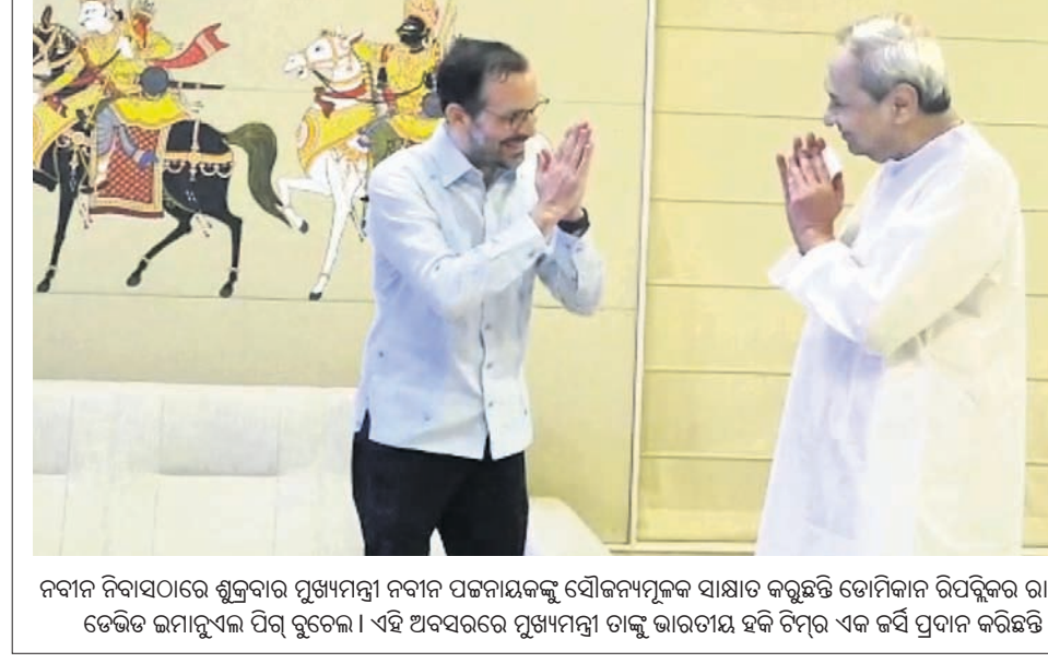
ନବୀନ ନିବାସଠାରେ ଶୁକ୍ରବାର ମୁଖ୍ୟମନ୍ତ୍ରୀ ନବୀନ ପଟ୍ଟନାୟକଙ୍କୁ ସୌଜନ୍ୟମୂଳକ ସାକ୍ଷାତ କରୁଛନ୍ତି ତୋମିକାନ ରିପବ୍ଲିକନ୍ ରାଷ୍ଟ୍ରପତି ତେଜିତ ଲମ୍ବାନୁ-ପିଲ ବୁଟେଲ। ଏହି ଅବସରରେ ମୁଖ୍ୟମନ୍ତ୍ରୀ ତାଙ୍କୁ ଭାରତୀୟ ହକି ଟିମ୍‌ର ଏକ ଜର୍ସି ପ୍ରଦାନ କରିଛନ୍ତି।

ଏ ଦିଗରେ ଆବଶ୍ୟକ ପଦକ୍ଷେପ ଗ୍ରହଣ କରିବା ପାଇଁ ସମବାୟ ସମିତି ନିରକ୍ଷକଙ୍କୁ କୁହାଯାଇଛି। ଯେଉଁସବୁ ମଞ୍ଚିରେ ଭିତ୍ତିଭୂମି ବିକାଶର ଆବଶ୍ୟକତା ରହିଛି, ସେଠାରେ ନିର୍ମାଣ କାର୍ଯ୍ୟ ଆରମ୍ଭ ନିମନ୍ତେ ଭୁକ୍ତ ଖର୍ଚ୍ଚ ଅଟକଳ ପ୍ରସ୍ତୁତ କରି ବିଭାଗକୁ ଅବଗତ କରିବା ପାଇଁ ନିର୍ଦ୍ଦେଶ ଦିଆଯାଇଛି। ଅଧିକିଆ ବର୍ଷ ଏବଂ ପ୍ରାକୃତିକ ବିପର୍ଯ୍ୟୟ ସମୟରେ ଗଣ୍ୟ ଧାନ ସୁରକ୍ଷିତ ରଖିବା ଦିଗରେ ପ୍ରତ୍ୟେକ ଧାନ ସଂଗ୍ରହ କେନ୍ଦ୍ରର ପିଣ୍ଡଗୁଡ଼ିକ ଉଚ୍ଚା କରିବା, ଉପର ଛାତ ଏବଂ ଗୋଦାମ ଗୁଡ଼ି ଆଦିର ନିର୍ମାଣ ଉପରେ ଗୁରୁତ୍ଵ ପ୍ରଦାନ କରାଯାଇଛି। ଯେଉଁ ମଞ୍ଚିରେ ଏହିସବୁ ସୁବିଧା ନାହିଁ, ସେଠାରେ ଉପଯୁକ୍ତ ସରକାରୀ ଜମି ହସ୍ତାନ୍ତର କରିବା ପାଇଁ ସମ୍ପୂର୍ଣ୍ଣ ତହସିଲଦାରଙ୍କ ନିକଟରେ ଆବେଦନ କରିବାକୁ ସମବାୟ ସମିତିର ତେଜସ୍ଵୀ ରେକର୍ଡ୍ସମାନଙ୍କୁ ବିଭାଗ ପକ୍ଷରୁ ଅଧିକରୁ ଅଧିକା ଭାବେ ନିଯୋଜିତ କରାଯାଇଛି। ସମ୍ପୂର୍ଣ୍ଣ ଜିଲ୍ଲାର ଜିଲ୍ଲାପାଳମାନେ ମଞ୍ଚି ଭିତ୍ତିଭୂମି ନିର୍ମାଣ କାର୍ଯ୍ୟର ଯୋଜନା ଓ ବ୍ୟୟ ଅଟକଳକୁ ଅନୁମୋଦନ କରିବେ ବୋଲି ଜଣାପଡ଼ିଛି।