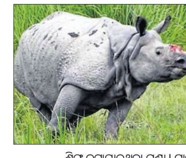
ଶିକା କରାଯାଇଥିବା ଗଣ୍ଡା । ଟ୍ରାଙ୍କୁଲାଇଜ ପାଇଁ ବ୍ୟବହୃତ ବସ୍ତୁ ।

ଭୁବନେଶ୍ଵର, ୧୩/୫ (ସ୍ଵାସ୍ଥ୍ୟ): ଆସାମର ଓରାଙ୍ଗ ଜାତୀୟ ଉଦ୍ୟାନରେ ବନ୍ୟପ୍ରାଣୀ ମାଫିଆମାନେ ଅଭିନବ ଉପାୟରେ ଗଣ୍ଡାର ଶିକାର କରି ନେଇଛନ୍ତି । ନିକଟରେ ଉଦ୍ୟାନ କର୍ମଚାରୀମାନେ ପୁଞ୍ଜାମାନି ଅଞ୍ଚଳରେ ଦୈନିକ ପାଚେନ୍ଡା ସମୟରେ ପ୍ରାୟ ୮-୧୦ ବର୍ଷ ବୟସର ଏକ ଅପ୍ରାପ୍ତବୟସ୍କ ଅଖିରା ଗଣ୍ଡାରୁ ଶିକା କରା ଅବସ୍ଥାରେ ଚିହ୍ନିତ ହୋଇଥିଲେ । ଭେଟେରିନାରି ଟିମ୍ ଅନୁଧ୍ୟାନ କରିବା ପରେ ଗଣ୍ଡାଟିକୁ ଟ୍ରାଙ୍କୁଲାଇଜ କଲ୍ୟାଣରେ ଶିକାଟିକୁ ଧାର୍ଯ୍ୟ ଥିବାରୁ କଟାଯାଇଥିବା ସ୍ଵଳ୍ପ କିଛି ରହିଛି । ଏହି ଘଟଣାକୁ ଆସାମ ସରକାର ଅତ୍ୟନ୍ତ ଗୁରୁତ୍ଵ ଦେଇ ନେଇଛନ୍ତି । କାରଣ ଏହାପୂର୍ବରୁ ଆସାମର କାଜିରଙ୍ଗା ଜାତୀୟ ଉଦ୍ୟାନରେ ଶିକାରୀମାନେ ଅନୁପ୍ରାୟ ଭାବେ ଚିହ୍ନିତ ଗଣ୍ଡାର ଶିକା କାଟି ନେଇଥିବା ନବରଚ୍ଚ ଆସିଥିଲା । ଶିକାକୁ ଏଭଳି ଭାବେ କଟାଯାଇଛି ଯେ, ଏଥିରେ କାଜିରଙ୍ଗା ପରିବର୍ତ୍ତନ ନାହିଁ ଏବଂ ସ୍ତନ୍ନ ଭାବରେ ଜୀବନ ଯାପନ କରିପାରିବ । ଏହି ଘଟଣା ଓଡ଼ିଶା ପାଇଁ ମଧ୍ୟ ସତର୍କ ସୂଚନା ଦେଇଛି । ବର୍ତ୍ତମାନ ରାଜ୍ୟରେ ବନ୍ୟପ୍ରାଣୀ ଶିକାର ଓ ଚୋରା ଚାଲାଣ ବର୍ଦ୍ଧି ଚାଲିଥିବାବେଳେ ଏଠାକାର ଶିକାର ଓ ମାଫିଆମାନେ ବନ୍ୟପ୍ରାଣୀକୁ ପ୍ରତି ଏପରି ନୂଆ ବିପଦକୁ ଆପଣାଇପାରନ୍ତି ବୋଲି ବନ୍ୟପ୍ରାଣୀ ବିଶେଷଜ୍ଞମାନେ ଆଶଙ୍କା କରୁଛନ୍ତି । ଓଡ଼ିଶାରେ ହାତୀ ଶିକାର ଦିନକୁଦିନ