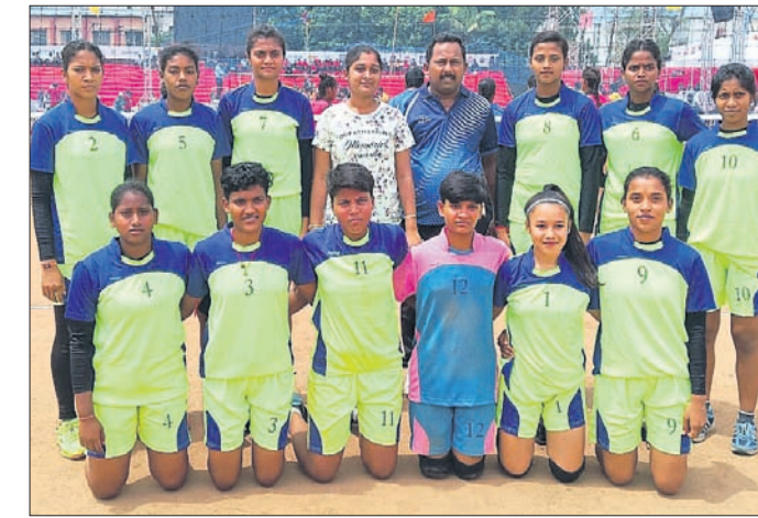
ମହାରାଷ୍ଟ୍ରର ସାଙ୍ଗଲିସ୍ଥିତ ଚାଲିଥିବା ଜାତୀୟ ଯୁବ ଭଲିବଲ ଚାମ୍ପିୟନଶିପ୍ରେ ଶୁକ୍ରବାର ଅନୁଷ୍ଠିତ ମ୍ୟାଚରେ ବିଜୟୀ ହୋଇଥିବା ଓଡ଼ିଶା ମହିଳା ଓ ପୁରୁଷ ଭଲିବଲ ଦଳ ।