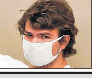
■ ଗୁଳିବର୍ଷାର ଲାଭକୁ ଛିଣ୍ଡି କରି ଅଭିହିତ

ଆମେରିକାରେ ଘୃଣା ଅପରାଧର ଚାଲିଲା ଲମ୍ବି ଚାଲିଥିବାବେଳେ ଏଥରେ ମୃତକ ଓ ପାଡ଼ିତ ସଂଖ୍ୟା ବୃଦ୍ଧିରେ ଲାଗିଛି। ଶନିବାର ନ୍ୟୁୟାର୍କର ବ୍ୟାଟଲୋ ସହରରେ ଥିବା ଏକ ପୁଅରମାକେଟରେ ଜଣେ ୧୮ ବର୍ଷୀୟ ନିଗୋରଙ୍କ ଆଖିକୁ ଗୁଳିରେ ୧୦ ଜଣଙ୍କ ଜୀବନ ଯାଇଛି। ଆଉ ୩ ଜଣ ଗୁରୁତର ହୋଇଛନ୍ତି। ପୋଲିସ ଏହାକୁ ଘୃଣା ଅପରାଧ ଅଭିହିତ କରିଛି। ବନ୍ଧୁକଧାରୀ ପେଟୋର୍ ଗେନେରାନ୍ ସେନା ପୋଷାକ ପିନ୍ଧି ବିଶେଷ କରି ମାକେଟରେ ଦୋକାନ ଦେଇଥିବା କୃଷ୍ଣକାୟ ଲୋକଙ୍କୁ ଚାରେଟ କରିଥିଲେ। ଆତ୍ମହତ୍ୟାକର କଥା ହେଲା ସେ ୨ ମିନିଟ୍ ଧରି ଘଟଣାର ଲାଭକୁ ଛିଣ୍ଡି କରିବା ସହ ତାହାକୁ ସୋସିଆଲ ମିଡିଆରେ ପୋଷ୍ଟ କରିଥିଲେ। ପୋଲିସ ଦୋକାନଗୁଡ଼ିକ ଭିତରେ ପଶି କାଣ୍ଡ ଘଟାଇଲେ ତାହା ଜଣାପଡ଼ି ନାହିଁ। ପେଟୋର୍ ଦୋକାନ ବାହାରେ ଥିବା ୪ ଜଣଙ୍କୁ ପ୍ରଥମେ ଗୁଳି