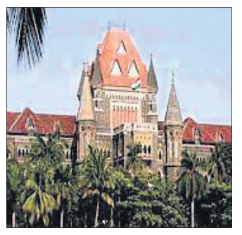
ନାବାଳକଙ୍କ କହିବା ଅନୁଯାୟୀ ସେ ଅର୍ଦ୍ଧଲାଭ ଗେମ୍ (ଓଲା

୦୦ରେ ରୁମ୍ଭନ ଦେବା ଏବଂ ସ୍ୱର୍ଣ୍ଣ କରିବା ଆଇପିସିର ଧାରା ୩୭୭ ଅନୁଯାୟୀ ଅପ୍ରାକୃତ ଅପରାଧ ନୁହେଁ ବୋଲି ବସ୍ତୁ ହାଇକୋର୍ଟ ଟିପ୍ପଣୀ ଦେବା ସହ ଜଣେ ନାବାଳକଙ୍କ ପ୍ରତି ଯୌନ ଅପରାଧ ମାମଲାରେ ଅଭିଯୋଗକୁ କାମିନୀ ପ୍ରଦାନ କରିଛନ୍ତି। ୧୪ ବର୍ଷୀୟ ବାଳକଙ୍କ ବାପାଙ୍କ ଅଭିଯୋଗକୁ ମେ ଅଭିଯୋଗକୁ ଗତବର୍ଷ ପୋଲିସ ଗିରଫ କରିଥିଲା।