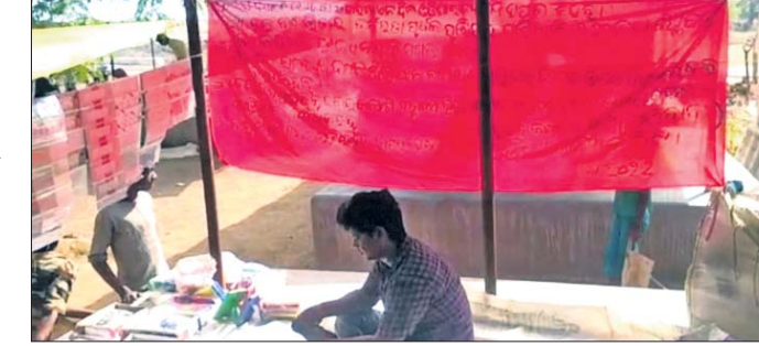
ପୁରକେଳୁଆ ଗ୍ରାମ ମଝି ବଜାର ପାଖାପାଖି ମାରାଯାଇଥିବା ବ୍ୟାନର।