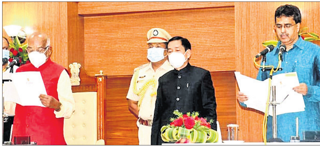
ରାଜ୍ୟପାଳ ସତ୍ୟଦେଓ ନାରାୟଣ ଆର୍ଯ୍ୟ ତ୍ରିପୁରାରୁ ନୂଆ ପୁଞ୍ଜାମନ୍ତ୍ରୀ ମାନିକ୍ ଶାହାଙ୍କୁ ଶପଥ ପାଠ କରାଉଛନ୍ତି।

ସୋନିଆ ଗାନ୍ଧୀ କହିଥିଲେ, ସାଂଗଠନିକ ସଂସ୍କାର କାର୍ଯ୍ୟକୁ ଆଗେଇ ନେବା ଲାଗି ଏକ ଚାଲ୍‌ଫୋର୍ସ ଗଠନ କରାଯିବ। ଅଲୋକ ୨ ମହାତ୍ମା ଗାନ୍ଧୀଙ୍କ ଜୟନ୍ତୀକୁ କନ୍ୟାଦୁମାରୀକୁ କଣ୍ଠାର ପର୍ଯ୍ୟନ୍ତ ଦଳ ପକ୍ଷରୁ 'ଭାରତ ଯୋଡ଼ ଯାତ୍ରା' ଆରମ୍ଭ ହେବ। ସେହିପରି ଜୁନ ୧୫ରୁ ଜିଲ୍ଲା ସ୍ତରରେ ଜନକାଗରଣ ଯାତ୍ରାର ଦ୍ୱିତୀୟ ପର୍ଯ୍ୟାୟ ଆରମ୍ଭ ହେବ ବୋଲି ସୋନିଆ କହିଛନ୍ତି। କଂଗ୍ରେସ ନେତା ରାହୁଲ ଗାନ୍ଧୀ ଜନସମ୍ପର୍କ ଉପରେ ଅଧିକ ଗୁରୁତ୍ୱ ଦେଇଥିଲେ। କୌଣସି ସଂକ୍ଷିପ୍ତ ଉପାୟରେ ଏହା ସମ୍ଭବ ନୁହେଁ। ଲୋକଙ୍କ ସହ କଂଗ୍ରେସର ସମ୍ପର୍କ ତୁଟିଯାଇଛି ବୋଲି ଗ୍ରହଣ କରିବାକୁ ହେବ ଏବଂ ପୁଣିଥରେ ସମ୍ପର୍କ ପୁନରୁଜ୍ଜୀବିତ କରିବା ଲାଗି କଠିନ ପରିଶ୍ରମ କରିବାକୁ ପଡ଼ିବ ବୋଲି ଚିକେଟ ଶିବିର ଶେଷ ଦିନରେ ଉଦ୍‌ବୋଧନ ଦେଇ ରାହୁଲ କହିଥିଲେ।