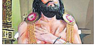
ଉପାଧି ପାଇବାରେ ପ୍ରଥମ ଭାରତୀୟ

ଅଷ୍ଟାଦଶ ଶତାବ୍ଦୀରେ ହିନ୍ଦୁ ଖ୍ରୀଷ୍ଟଧର୍ମ ଆପଣାଇଥିବା ଦେବସହାୟ ପିଲାଙ୍କୁ କ୍ୟାଥୋଲିକ୍ ଚର୍ଚ୍ଚର ମୁଖ୍ୟ ପୋପ୍ ଫ୍ରାନ୍ସିସ୍ ରବିବାର ସକ୍ଷ ଘୋଷଣା କରିଛନ୍ତି। ଲାଜାରସ୍ ଭାବେ ମଧ୍ୟ ଜଣା ଦେବସହାୟଙ୍କ ଜନ୍ମ ୩୦ ବର୍ଷ ପରେ ଏହି ଉପାଧି ପାଇଛନ୍ତି। ଭାଟିକାନ ସିଟିରେ ଆୟୋଜିତ ଏକ ଉତ୍ସବରେ ପୋପ୍ଙ୍କ ଦ୍ୱାରା ସକ୍ଷ ଘୋଷିତ ହେବାରେ ଦେବସହାୟ ହେଉଛନ୍ତି ପ୍ରଥମ ଭାରତୀୟ। ବର୍ତ୍ତମାନ କ୍ୟାଥୋଲିକ୍ ଚର୍ଚ୍ଚର ନିକାୟନ ପିଲାଙ୍କ ଏକ ହିନ୍ଦୁ ପରିବାରରେ