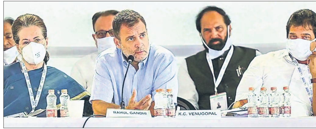
ଚିକେଟ ଶିବିରର ଶେଷ ଦିନରେ ମଞ୍ଚାଧୀନ କଂଗ୍ରେସ ଅଧ୍ୟକ୍ଷା ସୋନିଆ ଗାନ୍ଧୀ, ରାହୁଲ ଗାନ୍ଧୀ ଓ ଅନ୍ୟ ନେତୃବୃନ୍ଦ।