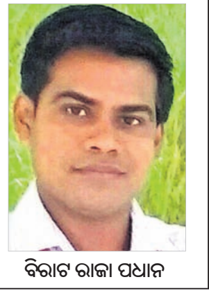
ବିଚାର ରାଜା ପଥାନ