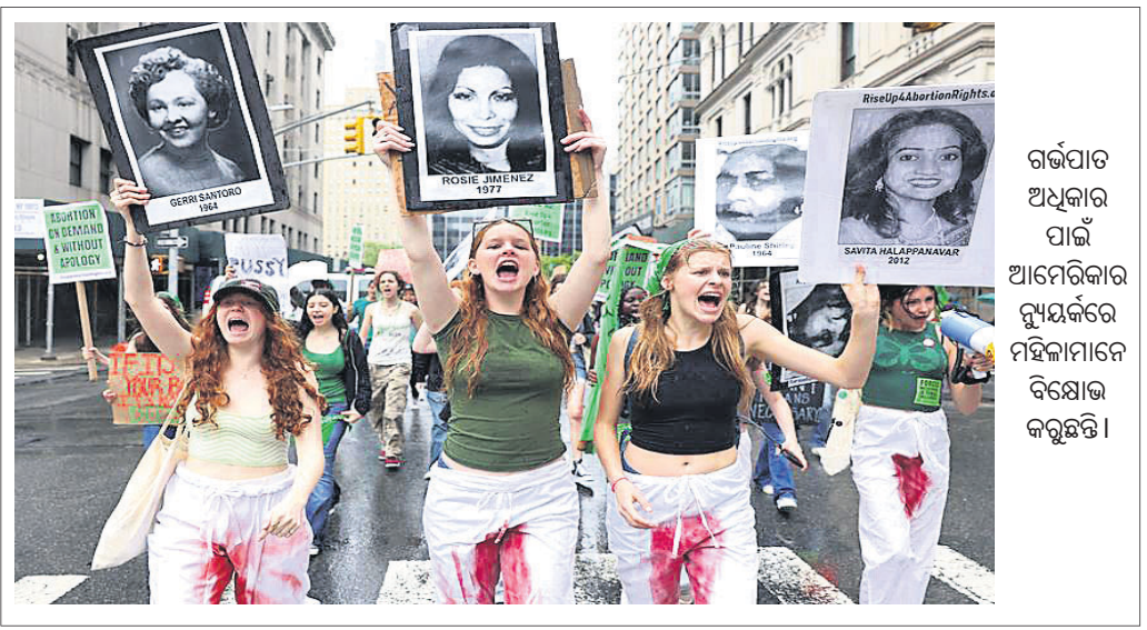
ଗର୍ଭପାତ ଅଧିକାର ପାଇଁ ଆମେରିକାର ନ୍ୟୁୟର୍କରେ ବିକ୍ଷୋଭ କରୁଛନ୍ତି।

ବହିଷ୍କାର କରାଯିବା ପରେ ଭାରତୀୟ କିଷାନ ଯୁନିୟନ ପୁରଭାଗରେ ବିଭକ୍ତ ହୋଇଯାଇଛି। ନରେଶ୍ୱର ଗ୍ଲାନରେ କୃଷକ ନେତା ରାଜେଶ୍ୱର ଟିକାଏଡ଼୍ଙ୍କୁ ବିକେନ୍ଦ୍ର (ଅଶରାଜନୈତିକ)ର ନୂଆ ମୁଖ୍ୟ କରାଯାଇଛି। ଚାଷୀଙ୍କ ସ୍ୱାର୍ଥର ପୁରସ୍କା ଲାଭି ଗଠିତ ହୋଇଥିବା ବିକେନ୍ଦ୍ରକୁ ଏକାଠି ରଖିବା ଲାଗି ଗଠିତ ପରିଶ୍ରମ କରାଯାଇଛି। ତେବେ ଟିକାଏଡ଼୍ଙ୍କ ନେତୃତ୍ୱରେ ସଂଗଠନ ଏକ ରାଜନୈତିକ କୋର୍ଡରେ ପରିଣତ ହୋଇଥିଲା ବୋଲି ଚୌଧାନ କହିଛନ୍ତି। ଗଠିତ ହୋଇଥିବା ନୂଆ ସଂଗଠନ କୌଣସି ରାଜନୈତିକ ଦଳ ପାଇଁ କାର୍ଯ୍ୟ କରିବ ନାହିଁ ବୋଲି ସେ କହିଛନ୍ତି।