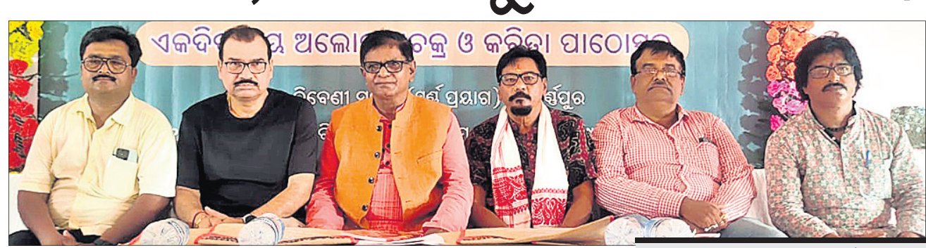
ଉଦ୍ଘାଟନା କାର୍ଯ୍ୟକ୍ରମରେ ମହାସାଧନ ଅତିଥିତ୍ଵ ।

ସୋନପୁର, ୧୫୫ (ପି.ପି.): ଓଡ଼ିଶା ସାହିତ୍ୟ ଏକାଡେମୀ ପକ୍ଷରୁ ପୁରୁଷପୁରରେ କିଲୋଗ୍ରାମୀୟ ସାମ୍ବଲପୁରୀ ଭାଷାର ସ୍ଵତନ୍ତ୍ରତା ଉପରେ ଉଦ୍ଘାଟନା କାର୍ଯ୍ୟକ୍ରମ ଉଦ୍ଘାଟନା କରାଯାଇଥିଲା । ଉଦ୍ଘାଟନା କାର୍ଯ୍ୟକ୍ରମରେ ମହାସାଧନ ଅତିଥିତ୍ଵ ।