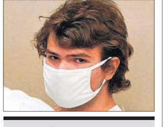
■ ଗୁଳିବର୍ଷାର ଲାଭକୁ ଛିଣ୍ଡି କରି ଅଭିଯୁକ୍ତ ■ କୃଷ୍ଣକାୟ ଲୋକଙ୍କୁ ଚାଗେଟ୍