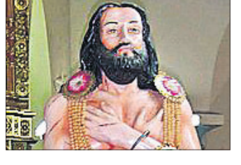
ଉପାଧି ପାଇବାରେ ପ୍ରଥମ ଭାରତୀୟ

ଜନ୍ମ ଗ୍ରହଣ କରିଥିଲେ। ୧୭୪୫ରେ ସେ ଖ୍ରୀଷ୍ଟ ଧର୍ମ ଅବଲମ୍ବନ କରିବା ସହ ତାଙ୍କ ନାମ ଦେବସହାୟ ଏବଂ ଲାଜାରସ୍ ରଖିଥିଲେ। ଜାତିଗତ ଭେଦଭାବ ବିରୋଧରେ ଲଢ଼େଇବେଳେ ୧୭୫୨ରେ ତାଙ୍କୁ ହତ୍ୟା କରାଯାଇଥିଲା। ଭାଟିକାନ ୨୦୧୨ରେ ତାଙ୍କୁ ବଳିକାନ୍ତ ଚିହ୍ନ