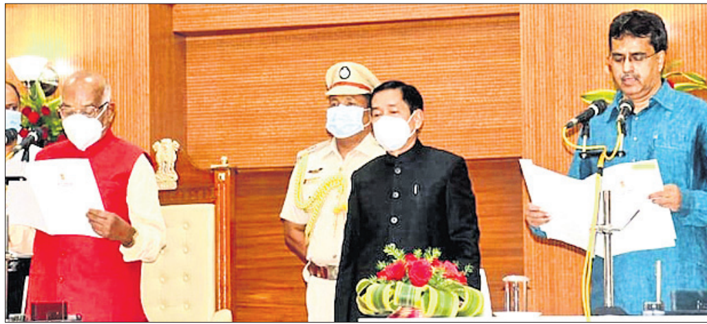
ରାଜ୍ୟପାଳ ସତ୍ୟଦେଓ ନାରାୟଣ ଆର୍ଯ୍ୟ ତ୍ରିପୁରାର ନୂଆ ପୁଖ୍ୟମନ୍ତ୍ରୀ ମାନିକ୍ ଶାହାଙ୍କୁ ଶପଥ ପାଠ କରାଉଛନ୍ତି ।

ସୋନିଆ ଗାନ୍ଧୀ କହିଥିଲେ, ସାଂଗଠନିକ ସଂସ୍କାର କାର୍ଯ୍ୟକୁ ଆଗେଇ ନେବା ଲାଗି ଏକ ଚାଲୁଯୋଗ୍ୟ ଗଠନ କରାଯିବ । ଅଲୋଚନା ୨ ମହାତ୍ମା ଗାନ୍ଧୀଙ୍କ ଜୟନ୍ତୀକୁ କନ୍ୟାକୁମାରୀଙ୍କୁ କଣ୍ଠାର ପର୍ଯ୍ୟନ୍ତ ଦଳ ପକ୍ଷରୁ 'ଭାରତ ଯୋଡ଼ା ଯାତ୍ରା' ଆରମ୍ଭ ହେବ । ସେହିପରି ଜୁନ ୧୫ରୁ ଜିଲ୍ଲା ସ୍ତରରେ ଜନଜାଗରଣ ଯାତ୍ରାର ଦ୍ୱିତୀୟ ପର୍ଯ୍ୟାୟ ଆରମ୍ଭ ହେବ ବୋଲି ସୋନିଆ କହିଛନ୍ତି । କଂଗ୍ରେସ ନେତା ରାହୁଲ ଗାନ୍ଧୀ ଜନସମ୍ପର୍କ ଉପରେ ଅଧିକ ଗୁରୁତ୍ୱ ଦେଇଥିଲେ । କୌଣସି ସଂକ୍ଷିପ୍ତ ଉପାୟରେ ଏହା ସମ୍ଭବ ନୁହେଁ । ଲୋକଙ୍କ ସହ କଂଗ୍ରେସର ସମ୍ପର୍କ ତୁଟିଯାଇଛି ବୋଲି ଗ୍ରହଣ କରିବାକୁ ହେବ ଏବଂ ପୁଣିଥରେ ସମ୍ପର୍କ ପୁନରୁଦ୍ଧ କରିବା ଲାଗି କଠିନ ପରିଶ୍ରମ କରିବାକୁ ପଡ଼ିବ ବୋଲି ଚିକିତ୍ସା ଶିବିର ଶେଷ ଦିନରେ ଉଦ୍‌ଦେଶ୍ୟରେ ଦେଇ ରାହୁଲ କହିଥିଲେ ।