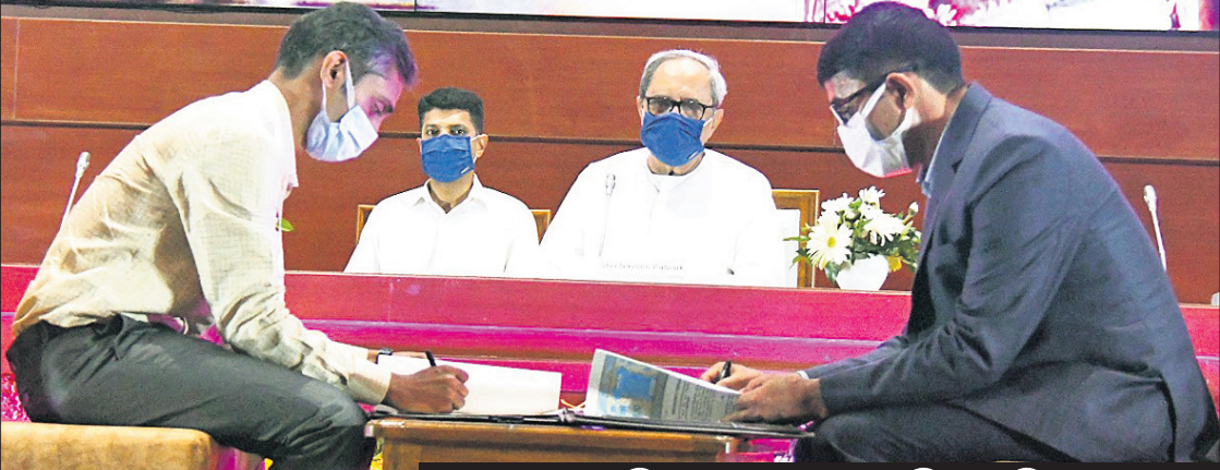
ଓଏମ୍‌ସିର ୬୭ତମ ପ୍ରତିଷ୍ଠା ଦିବସ

ଓଏମ୍‌ସି ହେଉଛି ଦେଶର ବୃହତ୍ ଏବଂ ଦ୍ରୁତ ଅଭିବୃଦ୍ଧି କମ୍ପାନୀ। ଗତ ଆର୍ଥିକ ବର୍ଷରେ ଏହି କମ୍ପାନୀ ୩୦ ନିୟୁତ ଟଙ୍କା ଲୁହାପଥର ଉତ୍ପାଦନ କରିବା ସହ ଏହାର ବାର୍ଷିକ ଚଳଣିରେ ୧୭ ହଜାର କୋଟିରେ ପହଞ୍ଚିଛି। ଚଳିତ ଆର୍ଥିକ ବର୍ଷରେ ଏଥିରେ ଆହୁରି ବୃଦ୍ଧି ହେବା ସହ ଅନ୍ୟ ସରକାରୀ ଉଦ୍ୟୋଗକୁ ପାଇଁ ଓଡ଼ିଶା ଖଣି ନିଗମ(ଓଏମ୍‌ସି) ଉଦ୍ୟୋଗର ସୃଷ୍ଟି କରିବ ବୋଲି ପୂର୍ଣ୍ଣମାତ୍ରା ନବୀନ ପଞ୍ଚମାୟକ କହିଛନ୍ତି। ସୋମବାର ଲୋକ ସଭା ଭବନରେ ଓଏମ୍‌ସିର ୬୭ତମ ପ୍ରତିଷ୍ଠା ଦିବସରେ ଯୋଗଦେଇ ପୂର୍ଣ୍ଣମାତ୍ରା କର୍ମଚାରୀଙ୍କୁ ଅଭିନନ୍ଦନ ଜଣାଇବା ସହ ଓଏମ୍‌ସିର ସାମାଜିକ କ୍ଷେତ୍ର ବିକାଶ ସର୍ବୋଚ୍ଚ ବୋଲି କହିଛନ୍ତି। ଓଏମ୍‌ସି ଲୋକଙ୍କ ଜୀବନଶୈଳୀରେ ବ୍ୟାପକ ପରିବର୍ତ୍ତନ ଆଣିବାରେ ବିଭିନ୍ନ ବିକାଶମୂଳକ ପଦକ୍ଷେପ ଗ୍ରହଣ କରିଛି। ଆଗାମୀ ଦିନରେ ଏହା ନୂତନ ଶିଖରରେ ପହଞ୍ଚିବା ସହ ଏକ ବିଶ୍ୱସ୍ତରୀୟ ସଂସ୍ଥାରେ ପରିଣତ ହେବ। କରୋନା ମହାମାରୀ ବେଳେ ଓଏମ୍‌ସିର ସହଯୋଗକୁ ପୂର୍ଣ୍ଣମାତ୍ରା ଉଚ୍ଚ ପ୍ରଶଂସା କରିଛନ୍ତି। ଜ୍ୱାଡ଼ା, ସ୍ୱାସ୍ଥ୍ୟ, ଶିକ୍ଷା ଏବଂ ଆଖପାଖ ଅଞ୍ଚଳ ବିକାଶ