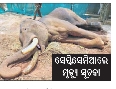
ସେଥିସେମିଆରେ ମୃତ୍ୟୁ ସୂଚନା