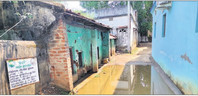
ସାମାନ୍ୟ ବର୍ଷାରେ ରାସ୍ତାରେ ଜମି ରହିଥିବା ପାଣି।