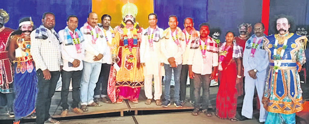
କଂସ ମହାରାଜାଙ୍କ ଦରବାରରେ ଉପସ୍ଥିତ ସମିତି ସଭ୍ୟ ଓ ସରପଞ୍ଚ।

ନବରଙ୍ଗପୁର ଜିଲା ଚନ୍ଦ୍ରାହାଣ୍ଡି ବ୍ଲକ ସଦର ମହକୁମାରେ ଚାଲିଥିବା ବାଲିଯାତ୍ରାରେ ଅନୁଷ୍ଠିତ ଧନୁଯାତ୍ରାର ନବମ ରଜନୀରେ କାଳୀୟ ଦଳନ ମଞ୍ଚକୁ ହତ୍ୟା କରିବାକୁ ପରାମର୍ଶ ଦିଆଯାଇଥିବାବେଳେ, କୃଷ୍ଣ କିନ୍ତୁ କାଳୀୟ ଦଳନ କରିଛନ୍ତି । ମହାରାଜ କଂସଙ୍କୁ ଚନ୍ଦ୍ରାହାଣ୍ଡି ମାଷ୍ଟପଡ଼ାସ୍ଥିତ ଅଶ୍ୱିନୀ ମହାତିକ୍ତ ଘରେ ଖଜୁରିପଡ଼ା ବ୍ଲକ ପରିକ୍ରମିତ ପଞ୍ଚାୟତ କାମ କରୁଥିଲେ । ସେଠାରେ ହଠାତ୍ ପଡ଼ି ଯାଇଥିଲେ । ଘର ମାଲିକ ଏବଂ ସେଠାରେ କାମ କରୁଥିବା ଶ୍ରମିକମାନେ ତାଙ୍କୁ ତୁରନ୍ତ ଫୁଲବାଣୀ ଜିଲା ମୁଖ୍ୟ ଚିକିତ୍ସାଳୟରେ ଭର୍ତ୍ତି କରିଥିଲେ ମଧ୍ୟ ତାହାର ତାଙ୍କୁ ମୃତ ଘୋଷଣା କରିଥିଲେ । ଶ୍ରୀବତ୍ସଙ୍କ ୭ ବର୍ଷର ପୁଅ, ୩ ବର୍ଷର ଝିଅ ଅଛନ୍ତି । ତୁରନ୍ତ ତାଙ୍କୁ ସରକାରୀ ସହାୟତା ଯୋଗାଇ ଦେବାକୁ ସାଧାରଣରେ ଦାବି ହୋଇଛି।