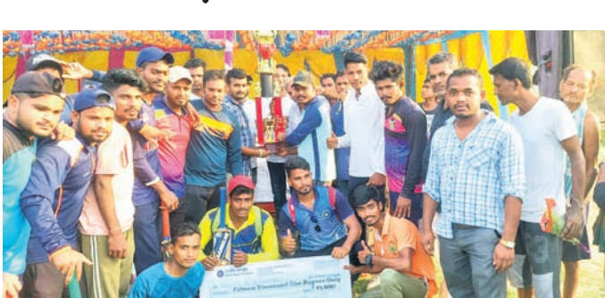
ଚାମ୍ପିୟନ ଟିମକୁ ଅତିଥିମାନଙ୍କ ଦ୍ୱାରା ତ୍ରୁପି ଓ ପୁରସ୍କାର ପ୍ରଦାନ।