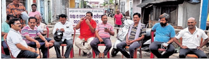
ଆନ୍ଦୋଳନକାରୀମାନେ ରାସ୍ତା ଉପରେ ବସି ରହିଛନ୍ତି ।

ବୌଦ୍ଧ ଜିଲ୍ଲା ହରଭଙ୍ଗା ବ୍ଲକ୍ ପୁରୁଣାକଟକ ସାହି ରାସ୍ତା ଅତି ଶୋଚନୀୟ ହୋଇପଡ଼ିଛି। ଏହି ରାସ୍ତା ସହ ଡ୍ରେନ୍ ନିର୍ମାଣ ଦାବିରେ ଯୋଗାଣ ପୁରୁଣାକଟକ ଆଞ୍ଚଳିକ ବିକାଶ ପରିଷଦ ପକ୍ଷରୁ ପୁରୁଣାକଟକ ଧଳପୁର ରାସ୍ତା ସଂରୋଧ କରାଯାଇଥିଲା।