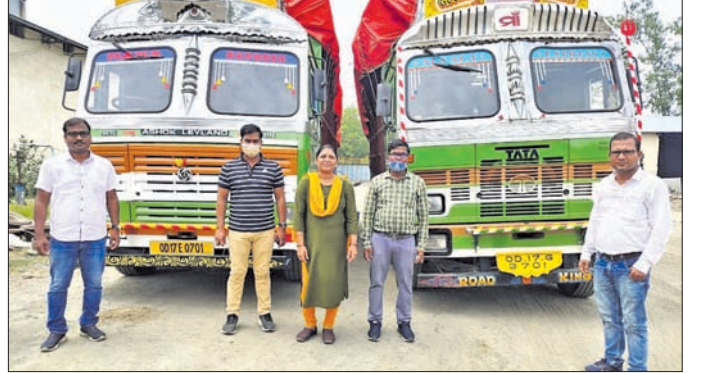
କବଚ ହୋଇଥିବା ୨ ଧାନ ବୋଝେଇ ଟ୍ରକ୍ ।