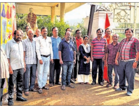
ସାର୍ ସୁଦେବଙ୍କ ପ୍ରତିମୂର୍ତ୍ତିରେ ମାଲ୍ୟାପର୍ଚ୍ଚା କରି ଶ୍ରଦ୍ଧା ସୁମନ ଅର୍ପଣ। ସଭାରେ ମହାସଭା ଅତିଥି।