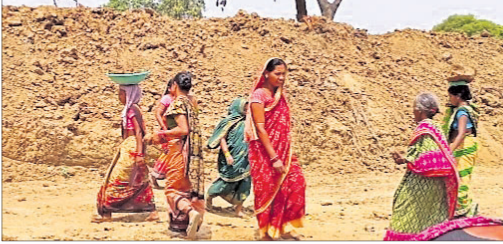
ମହିଳାମାନେ ପୋଖରୀର ଉନ୍ନତୀକରଣ ଲାଗି ଶ୍ରମଦାନ କରୁଛନ୍ତି।

ସରକାରଙ୍କ ପକ୍ଷରୁ ସହାୟତା ମିଳିଲା ନାହିଁ, କନପ୍ରତିନିଧି ଓ ଦଳୀୟ ନେତାମାନେ ମଧ୍ୟ ଦୃଷ୍ଟି ଦେଲେନି। ଶେଷରେ ଗାଧୋଇବା ସମସ୍ୟାର ଦୂରୀକରଣ ପାଇଁ ଅଣ୍ଟା ଭିଡିଲେ ମହିଳା ଗୋଷ୍ଠୀ। ପୋଖରୀର ଉନ୍ନତୀକରଣ କରି ଦେଖାଇଦେଲେ। ଏଭଳି ଏକ ପ୍ରୋତ୍ସାହନୀୟ କାର୍ଯ୍ୟକ୍ରମ ଦେଖାଇଛନ୍ତି, ସୁନ୍ଦରଗଡ଼ ଜିଲ୍ଲା ବଡ଼ଗାଁ ବ୍ଲକ ଅନ୍ତର୍ଗତ ଫୁଲବାରୀ ପଞ୍ଚାୟତର ସାଲେପାଲି ଓ ବିଶ୍ୱ ଗ୍ରାମର ମହିଳାମାନେ। ପ୍ରାୟ ୬୦୦ରୁ ଘଟଣା ଉପରେ ଗ୍ରାମର ଲୋକେ ପୋଖରୀ ଖନନ କରିଥିଲେ। ଦୀର୍ଘ ବର୍ଷ ହେଲା ପୋଖରୀର ଉନ୍ନତୀକରଣ, ପଙ୍କୋଦ୍ଧାର, ଖନନ କରା ନ ଯିବାରୁ ଅନୁପଯୋଗୀ ହୋଇ ପଡ଼ିରହିଥିଲା। ଗ୍ରାମବାସୀ ସରକାରୀ ଅଧିକାରୀ, କନପ୍ରତିନିଧିଙ୍କୁ ଜଣାଇଥିଲେ ମଧ୍ୟ ସମସ୍ୟା ଦୂରୀକରଣ ପାଇଁ ପଦକ୍ଷେପ ନେଲେ ନାହିଁ। ଗତବର୍ଷ ମହିଳାମାନେ ବୈଠକ କରି କିପରି ପୋଖରୀର ଉନ୍ନତୀକରଣ କରିହେବ ଆଲୋଚନା କରିଥିଲେ। ଆଲୋଚନାର