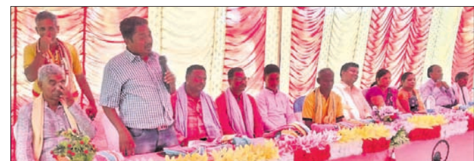
ରାଧାକୃଷ୍ଣ ସାଂସ୍କୃତିକ କଳା ପରିଷଦ ବାର୍ଷିକ ଉତ୍ସବରେ ମହାସଭା ଅତିଥି।

ସାହୁଙ୍କ ସହିତ ପ୍ରାୟ ୩୦ଜଣ ମହିଳା ପୋଖରୀରେ ଶ୍ରମଦାନ କରୁଥିଲେ। ଆମ ପ୍ରତିନିଧି କାର୍ଯ୍ୟସ୍ଥଳକୁ ଯାଇଥିଲେ। ସେମାନଙ୍କୁ ପଚାରିବୁଡ଼ିବାକୁ ସବୁକଥା ଜଣାପଡ଼ିଥିଲା। କିପରି ଦୀର୍ଘ ବର୍ଷ ହେଲା ସେମାନେ ଗାଧୋଇବା ପାଇଁ ସମସ୍ୟାରେ ପ୍ରକାଶ କରିଥିଲେ।