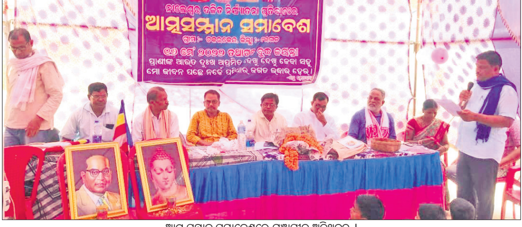
ଆତ୍ମ ସମ୍ମାନ ସମାବେଶରେ ମଞ୍ଚାଧୀନ ଅତିଥିବୃନ୍ଦ ।

ହିନ୍ଦୁ ଧର୍ମରେ ଗାଈକୁ ମାତା ବୋଲି କୁହାଯାଏ। ହେଲେ ଗାଈଗୋରୁକୁ ମୃତଦେହ ଉଠାଇବା ଭଳି କାମ ସମ୍ପୂର୍ଣ୍ଣ ମାଲିକମାନେ କରୁନାହାନ୍ତି। ଅନ୍ୟପକ୍ଷେ ଯେଉଁଦଳିତ କାଠି (ଚମାର) ଲୋକମାନଙ୍କୁ ବିନା ପାରିଶ୍ରମିକରେ ଏଥିରେ ନିୟୋଜିତ କରାଯାଇଥାଏ, ସେମାନଙ୍କୁ ନୀତି, ଦୁର୍ଦ୍ଦେବୀ ବୋଲି ଗଣନା କରାଯାଉଛି।