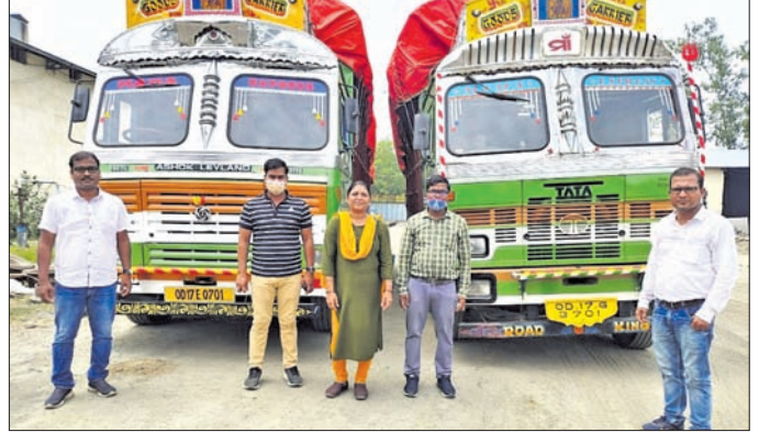
ଜବତ ହୋଇଥିବା ୨ ଧାନ ବୋଝେଇ ଟ୍ରକ୍ ।

ବରପାଲି, ୧୬୫୫ (ଡି.ଏନ.ଏ.): ଛତିଶଗଡ଼ରୁ ବରଗଡ଼ ଜିଲ୍ଲା ବରପାଲି ଅଞ୍ଚଳକୁ ଆସୁଥିବା ୨ଟି ଧାନ ବୋଝେଇ ଟ୍ରକ୍ ଜବତ କରାଯାଇଛି। ଧାନ ଟ୍ରକ୍ ଜବତ କରାଯାଇଛି। ଧାନ ଟ୍ରକ୍ ଜବତ କରାଯାଇଛି।