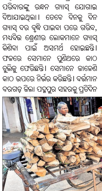
ପଦ୍ମପୁର ସହରରେ ବିତା ବିତା କାଠ ବିକ୍ରି କରାଯାଉଛି ।

ପରିବେଶ ପୁରୁଷା ସହିତ ଜଙ୍ଗଲ କ୍ଷୟ ରୋକିବା ପାଇଁ କେନ୍ଦ୍ର ସରକାରଙ୍କ ଉଦ୍ଦେଶ୍ୟ ଯୋଜନାରେ ପ୍ରତି ଗରିବ ପରିବାରଙ୍କୁ ଉନ୍ନତ ଗ୍ୟାସ୍ ଯୋଗାଇ ଦିଆଯାଇଥିଲା । ତେବେ ଦିନକୁ ଦିନ ଗ୍ୟାସ୍ ଦର ବୃଦ୍ଧି ପାଇବା ପରେ ଗରିବ ମଧ୍ୟବିତ୍ତ ଶ୍ରେଣୀର ଲୋକମାନେ ଗ୍ୟାସ୍ କିଣିବା ପାଇଁ ଅସମର୍ଥ ହୋଇଛନ୍ତି । ଫଳରେ ସେମାନେ ପୂଣିଥରେ କାଠ ବୁଲିକୁ ଫେରିଛନ୍ତି । ସେମାନେ ଜାଲେଣି କାଠ ଉପରେ ନିର୍ଭର କରିଛନ୍ତି । ବର୍ତ୍ତମାନ ଗରମଦିନିଆ ପଦ୍ମପୁର ସହରକୁ ପ୍ରତିଦିନ ବିଭିନ୍ନ ଯାନବାହନରେ ବିତା ବିତା କାଠ ବିକ୍ରି ପାଇଁ ଆସୁଛି । କେତେକ ଅସାଧୁ ବ୍ୟବସାୟୀ ଏହାର ସୁଯୋଗ ନେଇ ଜଙ୍ଗଲ କାଟୁଥିବା ଅଭିଯୋଗ ହେଉଛି । ଜାଲେଣି ଗ୍ୟାସ୍ ବୃଦ୍ଧି ସମ୍ପର୍କରେ ଜଣେ ଡିଲରଙ୍କୁ ପଚାରିବାରୁ ସେ କହିଛନ୍ତି, ଦର ବୃଦ୍ଧି ପରେ ଉଦ୍ଦେଶ୍ୟ ଯୋଜନାରେ ସୀମିତ ଥିବା ପ୍ରାୟ ୪୦ ପ୍ରତିଶତ ଉପଭୋକ୍ତା ଗ୍ୟାସ୍ ନେଉନାହାନ୍ତି । ସେହିପରି ସହରର ଅନେକ କଳଖୁଆ ଦୋକାନୀ ମଧ୍ୟ ଗ୍ୟାସ୍ ଉପରେ ନିର୍ଭର ନ କରି କାଠ ବ୍ୟବହାର କରୁଛନ୍ତି । ଏହାଦ୍ଵାରା କମର୍ସିଆଲ ଗ୍ୟାସ୍ ସିଲିଣ୍ଡର ବିକ୍ରି ମଧ୍ୟ କମିଯାଇଛି ।