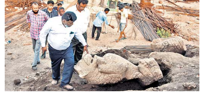
ଏଏସ୍‌ଆଇ ଚିତ୍ ସିଂହମୂର୍ତ୍ତିକୁ ଯାଞ୍ଚ କରୁଛି।

ଅତିକମ୍ରେ ୮୦୦ରୁ ୧୧ଶହ ବର୍ଷ ପୁରୁଣା ହେବ ବୋଲି ଜଣାପଡ଼ିଛି। ସୋମବାର ଭଗ୍ନ ମୂର୍ତ୍ତି ମିଳିବା ଘଟଣାକୁ ନେଇ ସାଧାରଣରେ ଉଦ୍‌ଯାତନ ପ୍ରକଳ୍ପ ପାଇବା ପରେ ଏଏସ୍‌ଆଇର ତତ୍ତ୍ୱାବଳୀ ପକ୍ଷରୁ ମଜଲିସ୍‌ଦ୍ୱାରା ଏହି ଖନନ ସ୍ଥଳୀରେ ଏଏସ୍‌ଆଇ ଚିତ୍ ସହଜ ସ୍ଥିତି ଅନୁଧ୍ୟାନ କରିବା ସହ ସେଠାରେ ପରିତ୍ୟକ୍ତ ଅବସ୍ଥାରେ ପଡ଼ିରହିଥିବା ସିଂହମୂର୍ତ୍ତିର ମାପପୃଷ୍ଠ