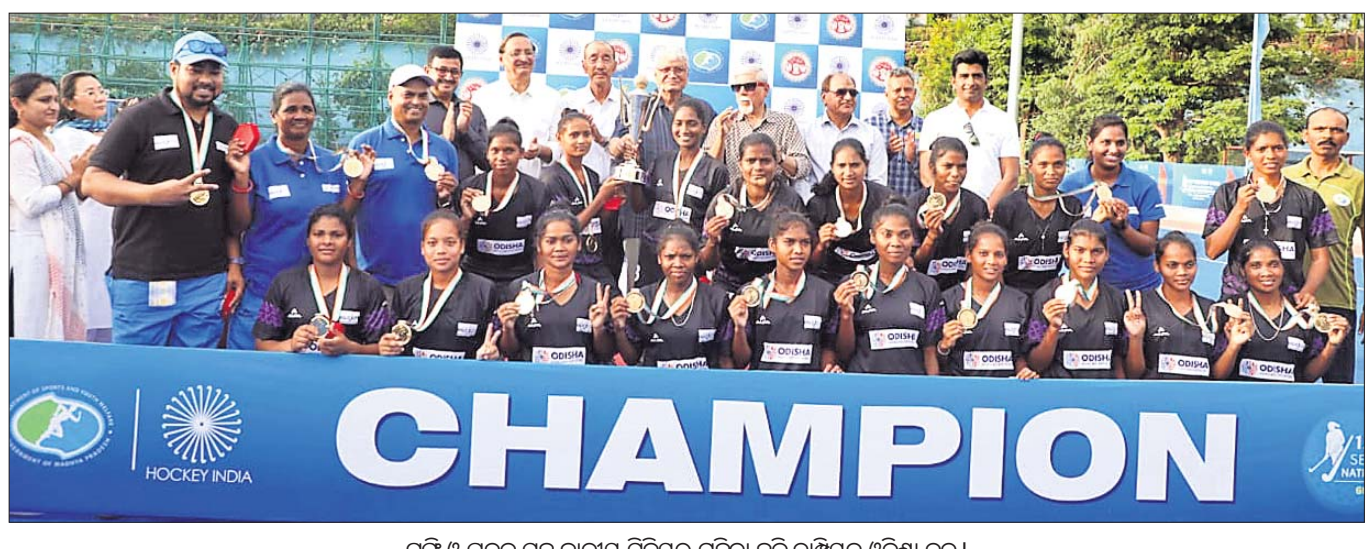
ପୁରୀ ଓ ପଦକ ସହ ଜାତୀୟ ସିନିୟର ମହିଳା ହକି ଚାମ୍ପିୟନ ଓଡ଼ିଶା ଦଳ।