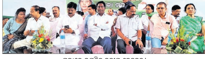
ସଭାରେ ଉପସ୍ଥିତ ଦଳୀୟ ନେତୃବୃନ୍ଦ।