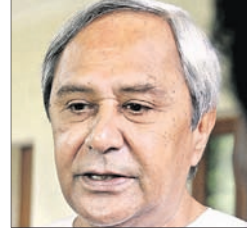
ମୁଖ୍ୟମନ୍ତ୍ରୀ ନବୀନ ପଟ୍ଟନାୟକ

କୁବେରଶ୍ୱର, ୧୭।୫ (ଭୁବନେଶ୍ୱର) ତାଲିକାରେ ଗ୍ଲାନ ପାଇଛନ୍ତି। ସେମାନଙ୍କ ଲାଗି ସବୁ ଦଳ ତରଫରୁ ଗୋଟିଏ ପ୍ରକ୍ରିୟା ଆରମ୍ଭ ହୋଇଯାଇଛି। ଶାସକ ଦଳର ନେତା ଏବେ ଯାଇ ଖାରସୁରୁଡ଼ାରେ ତେରା ପକାଇ ସାରିଲେଣି। ପଞ୍ଚାୟତ ତଥା ଖୁଣ୍ଟପୁରରେ ଶାସକ ଦଳ ନେତାଙ୍କୁ ଦାୟିତ୍ୱ ଦାୟିତ୍ୱ ବେଳେ ମଙ୍ଗଳବାର ଦଳର ୪୦ ଜଣିଆ ଷ୍ଟାର କ୍ୟାମ୍ପେନର ତାଲିକା ପ୍ରକାଶ ପାଇଛି। ଏଥିରେ ମୁଖ୍ୟମନ୍ତ୍ରୀଙ୍କ ସମେତ ୮ ଜଣ ମନ୍ତ୍ରୀଙ୍କୁ ଗ୍ଲାନ ମିଳିଛି। କଂଗ୍ରେସ ଓ ଭାଜପା ନିଜର ଷ୍ଟାର କ୍ୟାମ୍ପେନର ତାଲିକା ପ୍ରକାଶ କରିସାରିଥିବା ବେଳେ ଶେଷରେ ବିଜେଡି ପ୍ରକାଶ କରିଛି। ବିଜେଡି ତାଲିକାର ଏକ ନମ୍ବରରେ ମୁଖ୍ୟମନ୍ତ୍ରୀ ନବୀନ ପଟ୍ଟନାୟକଙ୍କ ନାଁ ରହିଛି। ପୂର୍ବରୁ ପିପିଲି ସହ ଆଉ କେତେକ ଉପନିର୍ବାଚନ ପ୍ରଚାରରେ ମୁଖ୍ୟମନ୍ତ୍ରୀ ଯୋଗଦେଇ ନ ଥିଲେ। କେଭିଏ ଯୋଗୁ ବହୁ ନିର୍ବାଚନ ଏବଂ ଅନ୍ୟାନ୍ୟ କାର୍ଯ୍ୟକ୍ରମରେ ମୁଖ୍ୟମନ୍ତ୍ରୀ ଯୋଗ ଦେଇନାହାନ୍ତି। ତେଣୁ ଏଥର ନିର୍ବାଚନରେ ପ୍ରଚାର ଲାଗି ମୁଖ୍ୟମନ୍ତ୍ରୀ ବ୍ରଜରାଜନଗର ଯିବେ ବୋଲି ଚଳି ଚଳେ ବିଭାଗ ମଧ୍ୟ ସହାୟତା କରିଥିବା ସେ କହିଛନ୍ତି।