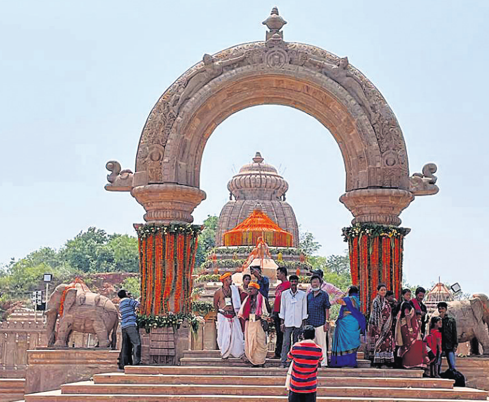
ତାରାତାରଣୀ ମନ୍ଦିର ପ୍ରବେଶ ପଥ ।