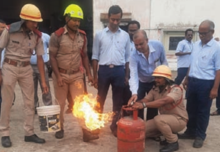
ଅଗ୍ନିଶମ କର୍ମଚାରୀମାନେ ମକଡ୍ରୁଲ୍ କରୁଛନ୍ତି।

କଣିଆଁ ବ୍ଲକ ରୋଜାଲିପୁର ଓଡ଼ିଶା ଜଳ ବିଦ୍ୟୁତ୍ ପ୍ରକଳ୍ପ ସଭାଗୃହଠାରେ କଣିଆଁ ଅଗ୍ନିଶମ ବିଭାଗ ତରଫରୁ ଏକ ପ୍ରଶିକ୍ଷଣ ଶିବିର ଅନୁଷ୍ଠିତ ହୋଇଯାଇଛି।