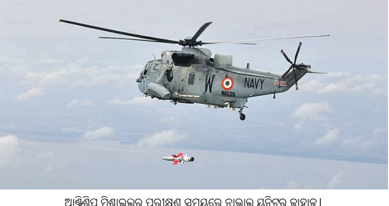
ଆଣ୍ଟିଶିପ୍ ମିଶନର ପରୀକ୍ଷଣ ସମୟରେ ନାଭାଳ ସ୍ଥିରତା କାହାଳି

ବାଲେଶ୍ୱର ରାଜ୍ୟପୁରସ୍ଥିତ ପ୍ରତିରକ୍ଷା ଗବେଷଣା ଏବଂ ବିକାଶ ସଙ୍ଗଠନ(ଡିଆରଡିଓ) ଏବଂ ଭାରତୀୟ ନୌସେନା ପକ୍ଷରୁ ବୁଧବାର ପ୍ରଥମଥର ଲାଗି ନାଭାଳ ଆଣ୍ଟିଶିପ୍ ମିଶନ(କ୍ଷେପଣାସ୍ତ୍ର)ର ପରୀକ୍ଷଣ ହୋଇଛି।