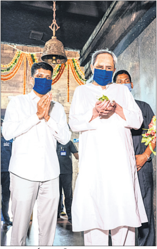
ମା'ଙ୍କ ପୂଜାର୍ଚ୍ଚନା କରୁଛନ୍ତି ପୁଷ୍ୟମନ୍ତ୍ରୀ ନବୀନ ପଟ୍ଟନାୟକ ଓ ୫-ଟି ସଚିବ ଭି.କେ. ପାଣିଆନ ।