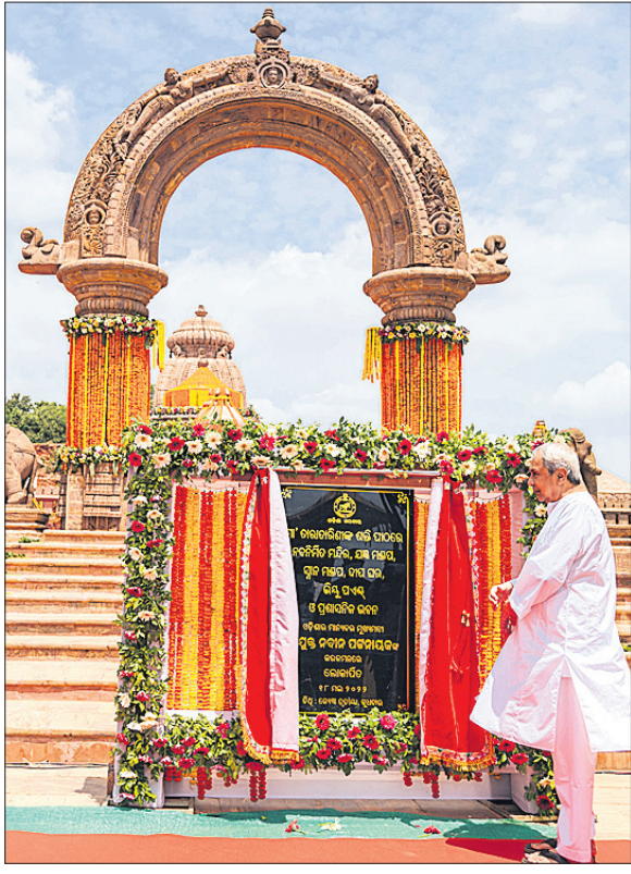
ମନ୍ଦିରର ରୂପାନ୍ତରଣ କାର୍ଯ୍ୟଗୁଡ଼ିକୁ ଲୋକାର୍ପଣ କରୁଛନ୍ତି ପୁଷ୍ୟମନ୍ତ୍ରୀ ।