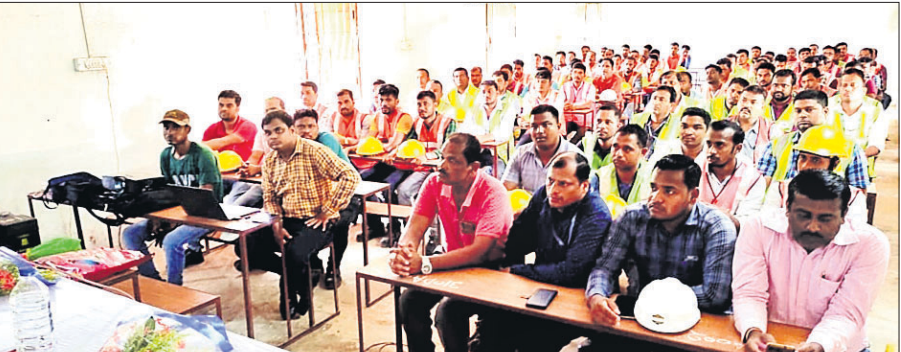
କର୍ମଶାଳାରେ ଯୋଗଦେଇଥିବା ବିଦ୍ୟୁତ୍ କର୍ମଚାରୀମାନେ।

ଅସାଧାରଣତା ଯୋଗୁଁ ବିଦ୍ୟୁତ୍ ବ୍ୟବସ୍ଥାରେ କାର୍ଯ୍ୟ କରୁଥିବା ବହୁକର୍ମଚାରୀଙ୍କ ଜୀବନ ଚାଲିଯାଉଛି। ତେଣୁ ଏହି ବିପଦପୂର୍ଣ୍ଣ କାମ କରିବା ପୂର୍ବରୁ ନିଜକୁ ସୁରକ୍ଷିତ ରଖିବା ପାଇଁ ସୁରକ୍ଷା ସାମଗ୍ରୀ ବ୍ୟବହାର କରିବା ଆବଶ୍ୟକ। ଏଥିସହିତ ନିଜ ସୁରକ୍ଷା ଉପରେ ଅଧିକ ଗୁରୁତ୍ୱ ଦେବାକୁ ବୁଧବାର କିଶୋରନଗର ବ୍ଲକ ବଲଙ୍ଗା ଜନତା ମହାବିଦ୍ୟାଳୟ ପରିସରରେ ଡିପ୍ଟିଭିଡିଏଲ୍ ବଲଙ୍ଗା ପକ୍ଷରୁ ଅନୁଷ୍ଠିତ ସୁରକ୍ଷା କର୍ମଶାଳାରେ ଯୋଗଦେଇଥିବା ଅତିଥିମାନେ ପରାମର୍ଶ ଦେଇଛନ୍ତି।