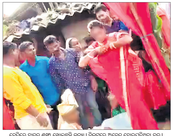
ବେଦିରେ ହାତରୁ ଶଙ୍ଖା ଖୋଲୁଛନ୍ତି ଜନମା। ନିକଟରେ ଅଚେତ ହୋଇପଡ଼ିଥିବା ବର।

ବାଲିଆପାଳ, ୧୮ (ବୁଧବାର) ବେଦୀ ସଜା ହୋଇଥିଲା। ବହୁବାନ୍ଧବ, ଆତ୍ମୀୟସ୍ୱଜନଙ୍କ ଉପସ୍ଥିତିରେ ବେଦିକ ରୀତିନୀତିରେ ଚାଲିଥିଲା ବିବାହ କାର୍ଯ୍ୟ। ବର କନ୍ୟାଙ୍କ ହାତଗଣ୍ଠି ବି ପଡ଼ିଯାଉଥିଲା। ହେଲେ କନ୍ୟାଙ୍କୁ ବର ସିନ୍ଦୂର ପିନ୍ଧାଇବା ବେଳେ ସବୁ କିଛି ଓଲଟପାଲଟ ହୋଇଗଲା। ହଠାତ୍ କନ୍ୟା ବେଦୀ ଉପରୁ ଉଠି ତାଙ୍କର ସ୍ୱାମୀ ଅଛନ୍ତି, ପୂର୍ବରୁ ସେ ବାହା ହୋଇ ସାରିଛନ୍ତି ବୋଲି କହି ହାତରୁ ଶଙ୍ଖା ଖୋଲି ପିନ୍ଧିବା ଆରମ୍ଭ କରିଦେଇଥିଲେ। ତାଙ୍କ ପରିବାର ଲୋକେ ଅଚଳାଇବାକୁ ଚେଷ୍ଟା କରି ମଧ୍ୟ ବିଫଳ ହୋଇଥିଲେ। ସେ ବେଦୀ ଛାଡ଼ି ପଳାଇବାକୁ ଉଦ୍ୟମ କରୁଥିବା ବେଳେ ତାଙ୍କ ପରିବାର ଲୋକେ ଅଚଳାଇ ମାରପିଟ୍ କରିଥିଲେ। କନ୍ୟାଙ୍କର ଏପରି କାଣ୍ଡ ଦେଖି ବେଦୀ ଉପରେ ନିର୍ବାକ ହୋଇ ବସିଥିବା ବର ଚେତାଶୂନ୍ୟ ହୋଇପଡ଼ିଥିଲେ। ବରଘର ପକ୍ଷରୁ କାନ୍ଦବୋବାଳି ଆରମ୍ଭ ହୋଇଥିଲା। ବାଲେଶ୍ୱର ଜିଲା ବାଲିଆପାଳ ଅଞ୍ଚଳରେ ବୁଧବାର ଘଟିଥିବା ଏଭଳି ଅଭାବନୀୟ ଘଟଣାର ଭିତ୍ତି ଓ ଭାଇରାଲ ହେବା ପରେ ସ୍ଥାନୀୟ ଅଞ୍ଚଳରେ