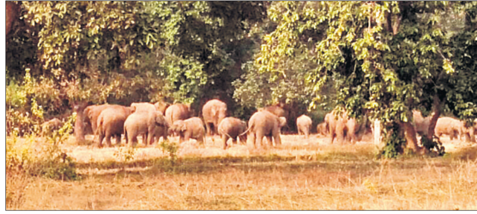
ଦେଉଳି ରେଞ୍ଜରେ ଝାଡ଼ୁଖଣ୍ଡା ହାତୀପଲ।