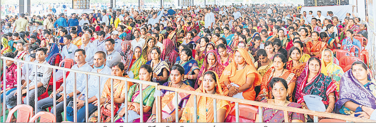
ତାରାତାରିଣୀ ଶକ୍ତିପୀଠରେ ନବନିର୍ମିତ ମନ୍ଦିର ପ୍ରତିଷ୍ଠା ଉତ୍ସବ କାର୍ଯ୍ୟକ୍ରମରେ ବୁଧବାର ଉପସ୍ଥିତ ଶ୍ରଦ୍ଧାଳୁ ।