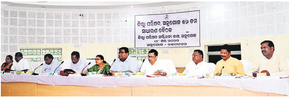
ବୈଠକରେ ଉପସ୍ଥିତ ଲୋକ ପ୍ରତିନିଧି ଓ ପ୍ରଶାସନିକ ଅଧିକାରୀମାନେ।