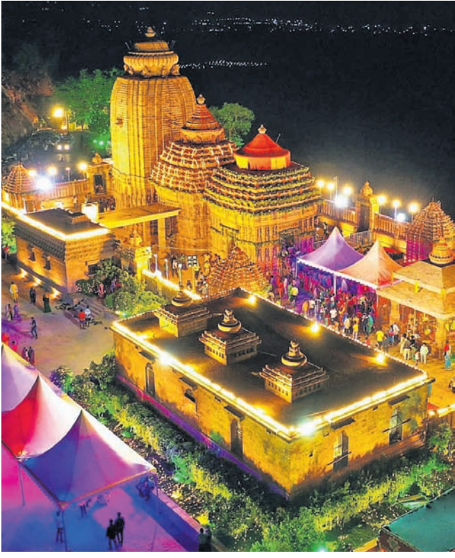
ଆଲୋକମାଳାରେ ଝଲୁଥିବା ମା'ଙ୍କ ନବନିର୍ମିତ ଭବ୍ୟମନ୍ଦିର ।