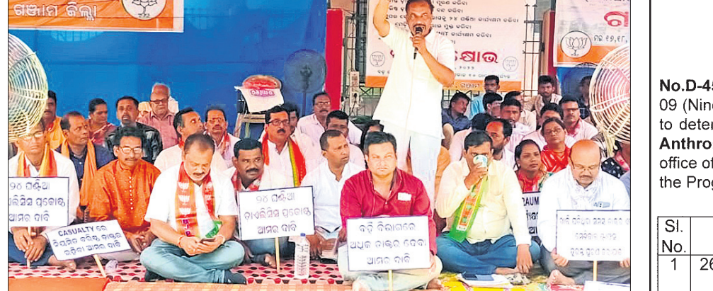
ଭାଜପା କାର୍ଯ୍ୟକର୍ତ୍ତାଙ୍କ ଧାରଣା ।

ସମ୍ପର୍କରେ ଯେଉଁଭଳି ବେଆଇନ ନିର୍ମାଣ କାର୍ଯ୍ୟ ଚାଲୁଛି ତାହା ଆଦୌ ଗ୍ରହଣୀୟ ନୁହେଁ । ପ୍ରକଳ୍ପ ଆରମ୍ଭ ବେଳେ ଯେଉଁ ଆଶଙ୍କା ହେଉଥିଲା ଏହାର ବାସ୍ତବ ପ୍ରତିଫଳନ ହୋଇଛି । ଶ୍ରୀମନ୍ଦିର ପରିଧି ମଧ୍ୟରୁ ଏମାନ ମଠ ଖନନ ଗୁମାସ୍ତାଙ୍କ ସହଯୋଗରେ ଭଗ୍ନାବଶେଷ ମିଳିବା ଚିତ୍କାରକ ପ୍ରକଳ୍ପ ବୋଲି ଭାଜପା ରାଷ୍ଟ୍ରୀୟ ପ୍ରମୁଖପାତ୍ର ସମିତି ପାତ୍ର କହିଛନ୍ତି । ସେ ଆହୁରି କହିଛନ୍ତି