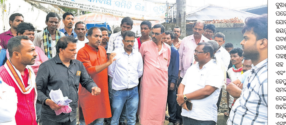
ଚାଷୀଙ୍କ ସହ ପ୍ରଶ୍ନାସନିକ ଅଧିକାରୀମାନେ ଆଲୋଚନା କରୁଛନ୍ତି ।