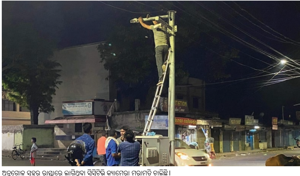
ଅନୁଗୋଳ ସହର ରାସ୍ତାରେ ଲାଗିଥିବା ସିବିଟିକି କ୍ୟାମେରା ମରାମତି ଚାଲିଛି।