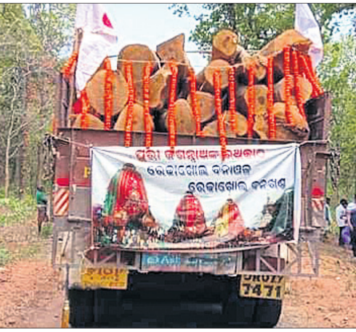
ପୁରୀ ଅଭିଯୁକ୍ତ ବାହାରିଥିବା ରଥକାଠ ବୋର୍ଡିଙ୍ଗ ପ୍ରକ୍।

ପୁରୀର ବିଶ୍ୱପ୍ରସିଦ୍ଧ ରଥଯାତ୍ରା ପାଇଁ ପ୍ରଭୁ ଜଗନ୍ନାଥ, ଦେବୀ ସୁଭଦ୍ରା ଓ ବଳଭଦ୍ରଙ୍କ ରଥ ନିର୍ମାଣ ଲାଗି ସମ୍ବଲପୁର ଜିଲ୍ଲା ରେଡ଼ାଖୋଲ ବନଖଣ୍ଡର ଲକ୍ଷ୍ମୀକୋଟ ସଂରକ୍ଷିତ ଜଙ୍ଗଲକୁ ରୁଧିବାର ୬୧ ଖଣ୍ଡ କାଠ ପଠାଯାଇଛି।