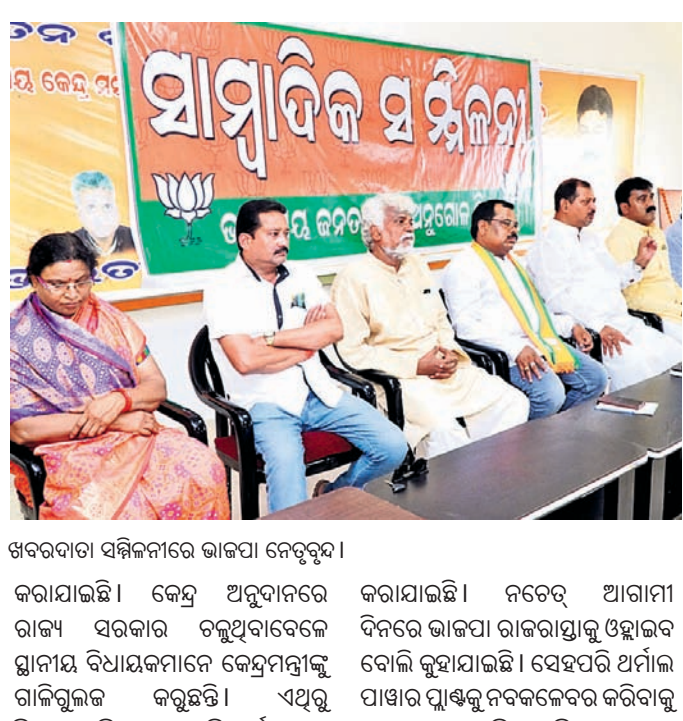
ଖବରଦାତା ସମ୍ମିଳନୀରେ ଭାଜପା ନେତୃବୃନ୍ଦ କରାଯାଇଛି।

ଅନୁଗୋଳ ଜିଲାର ଉନ୍ନତିରେ ରାଜ୍ୟ ସରକାର ବାଧକ ସାଜୁଛନ୍ତି। ଜିଲାବାସୀଙ୍କ ହିତ ପାଇଁ ସରକାର କାର୍ଯ୍ୟ କରୁନାହାନ୍ତି। ଏପରି କି ଜଳ, ସ୍ତଳ ଓ ରେଳପଥ କାର୍ଯ୍ୟରେ ହସ୍ତକ୍ଷେପ କରି ସମସ୍ୟାର ସମାଧାନ କରୁନାହାନ୍ତି ବୋଲି ବୁଧବାର ଭାବପୀର ରାଣୀଗୁଡ଼ା କାର୍ଯ୍ୟକ୍ଷେତ୍ରରେ ଏକ ସମ୍ବନ୍ଧୀୟ ଖବରଦାତା ସମ୍ମିଳନୀରେ ଅଭିଯୋଗ କରାଯାଇଛି।