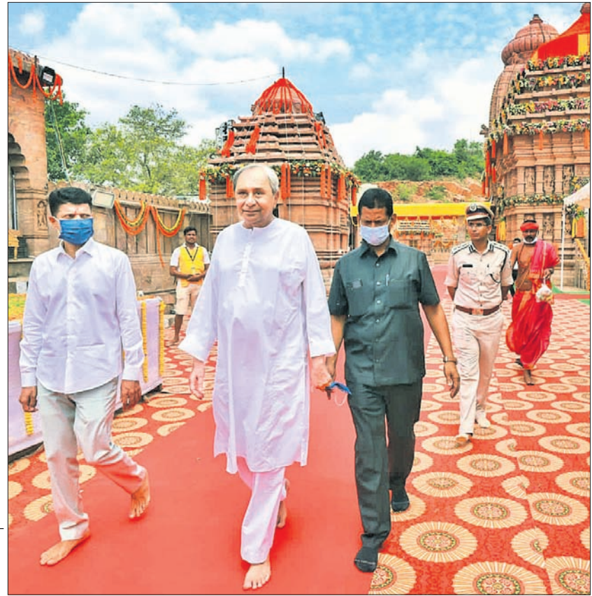
ତାରାତାରିଣୀ ଶକ୍ତିପୀଠର ରୂପାନ୍ତରଣ କାର୍ଯ୍ୟକ୍ରମରେ ବୁଧବାର ମୁଖ୍ୟ ପୁରୋଧା ଭାବେ ଯୋଗଦେଇଛନ୍ତି ମୁଖ୍ୟମନ୍ତ୍ରୀ ନବୀନ ପଟ୍ଟନାୟକ। ନିକଟରେ ଅଛନ୍ତି ୫-ଟି ସଚିବ ଭି.କେ.ପାଣ୍ଡିଆନ।