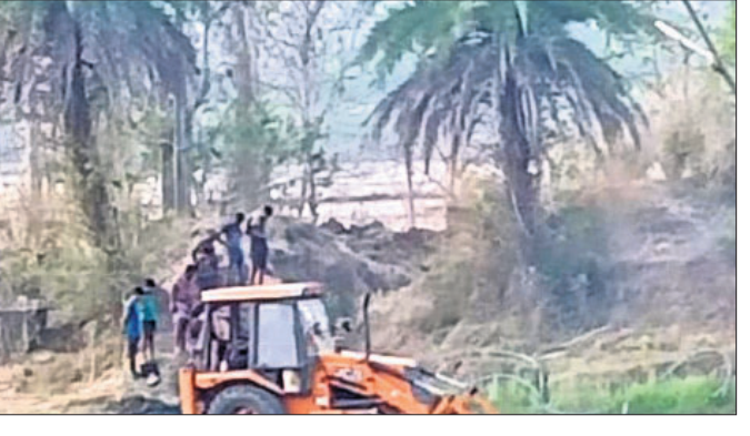
କର୍ମଶାଳାରେ ଯୋଗ ଦେଇଥିବା ପ୍ରଶାସନିକ ଅଧିକାରୀ ଓ ଅନ୍ୟମାନେ।

ନୟାଗଡ଼ ଜିଲ୍ଲାପାଳଙ୍କ ସଦ୍‌ଭାବନା ସଭାରେ କୃଷି ଓ କୃଷକ ସଶକ୍ତୀକରଣ ବିଭାଗ ଆନୁକୂଲ୍ୟରେ ଭୂମିହୀନ, ନାମମାତ୍ର ଏବଂ କ୍ଷୁଦ୍ର ଚାଷୀମାନଙ୍କ ନିକଟ ଚାଷ ନିମନ୍ତେ ଉଦ୍ଦିଷ୍ଟ ବକରାମ ଯୋଜନାର କାର୍ଯ୍ୟକାରୀତା ଉପରେ ବୁଧବାର କର୍ମଶାଳା ଆନୁଷ୍ଠିତ ହୋଇଯାଇଛି। ଏଥିରେ ଜିଲ୍ଲାପାଳ ଯୋଗାଣ ଉପସଭାରେ ଅଧିକାରୀ ଉପସଭାରେ ବକରାମ ଯୋଜନାରେ ସର୍ବନିମ୍ନ ଟଙ୍କାରେ ସର୍ବାଧିକ ୧୦ଜଣ ଭୂମିହୀନ ଭାଗଚାଷୀ ମିଳିତ ଭାବେ ବ୍ୟାଙ୍କରୁ ୫୦ ହଜାରରୁ ୧ଲକ୍ଷ ୬୦ ହଜାର ଟଙ୍କା ପର୍ଯ୍ୟନ୍ତ (ଚାଷଜମି ଅନୁପାତରେ) ବର୍ଷିକାୟା ଫସଲ ପାଇଁ କୃଷିରଣ ନେଇପାରିବେ ବୋଲି କୁହାଯାଇଛି। ରଣ ଠିକ୍ ସମୟରେ ପରିଶୋଧ କଲେ ୫୦ ହଜାରରୁ ଅଧିକ ରଣ ଉପରେ ୩ ପ୍ରତିଶତ ହାରରେ ପୁଅ ଲାଭିବ। ୫୦ ହଜାର ପର୍ଯ୍ୟନ୍ତ ରଣ ଉପରେ କୌଣସି ସୁଧ ପଡ଼ିବ ନାହିଁ। ଏଥିରେ ଚାଷୀ ଗୋଷ୍ଠୀ ଗଠନରୁ ଆରମ୍ଭ କରି ରଣ ପରିଶୋଧ ପର୍ଯ୍ୟନ୍ତ ସମସ୍ତ କାର୍ଯ୍ୟ କୃଷକ ସାଥୀମାନଙ୍କ ସହଯୋଗରେ କରାଯିବ। ଏହି ଆଲୋଚନାର ଚିକିତ୍ସା ତଥ୍ୟ ନିର୍ଦ୍ଦେଶ କରିବା ନିମନ୍ତେ ଜିଲ୍ଲାପାଳ ସମସ୍ତ ଚାଷୀ ଉନ୍ନୟନ ଅଧିକାରୀ ଓ ତତ୍‌ସହିଦାରମାନଙ୍କୁ ନିର୍ଦ୍ଦେଶ ଦେଇଥିଲେ।