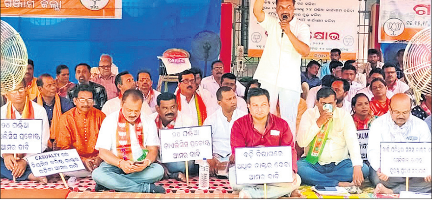
ଭାଜପା କାର୍ଯ୍ୟକର୍ତ୍ତା ଧାରଣା

ଏମ୍ପାକ୍ସନ ମେଡିକାଲ ବଞ୍ଚାଏ ଦାଦି ନେଇ ଗଞ୍ଜାମ ସାଙ୍ଗଠିକ ଜିଲା ଭାଜପାର ଗଣଧାରଣା, ବିକ୍ଷେପ କୁସଂସ୍କୃତ ଦିପଦା ବିଦିଆ ଏଥିରେ ଉଲ୍ଲାଖକର ସ୍ୱପ୍ନସର, କନ୍ୟାମାଳ, ଗଜପତି ଜିଲାର ନେତା ଓ କର୍ମୀ ସାମିଲ ହୋଇଥିବାରୁ ଆନ୍ଦୋଳନ ତେଜସବରେ ଲାଗିଛି।