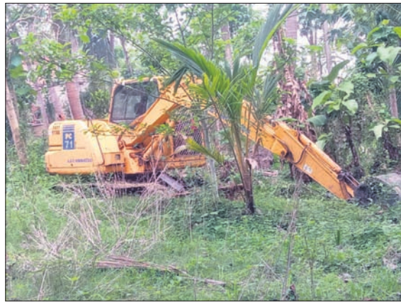
ହେବି ସାହାଯ୍ୟରେ ଏମ୍ବ୍ଲିଏନ୍ଆରୁଇଜିଏସ୍ କାର୍ଯ୍ୟ ବିଭିନ୍ନ ସ୍ଥାନରେ କରାଯାଉଥିବା ଦୃଶ୍ୟ।

ନୟାଗଡ଼ ଜିଲ୍ଲାରେ ମହାତ୍ମା ଗାନ୍ଧୀ ଜାତୀୟ ଗ୍ରାମୀଣ ନିରୀକ୍ଷିତ କର୍ମନିୟୁକ୍ତ ଯୋଜନା (ଏମ୍ବ୍ଲିଏନ୍ଆରୁଇଜିଏସ୍) ବାଟ ସୁଢ଼ିଛି। ବାବୁ ଜାଣି ଯନ୍ତ୍ର କାମ କରୁଥିବାବେଳେ ଫଲ୍‌ସ୍ ବଲ୍ ବି ହେଉଥିବା ପ୍ରମାଣ ମିଳିଛି, ଯାହାର ନିକଟତର ଭାବରେ ଖଜୁରିଗାଡ଼ିଆ ପୋଖରୀ ଓ ରାସ୍ତା, ଶାସନ ପଞ୍ଚାୟତରେ ଖଜୁରିଗାଡ଼ିଆ ଭିତରେ ପୋଖରୀ, ଗୋଟିଏ ରାସ୍ତାକୁ ୨୨୫୦ ଟଙ୍କା, ବାଉଁଶବାଟି ଗାଁରେ ସୁରକ୍ଷା ପ୍ରାଚୀର ଓ ରାସ୍ତା କରାଯାଇ ଭଳି ଅନେକ ଦୁର୍ଗତି। ତେବେ କାର୍ଯ୍ୟାଳୟରେ ଭଲ ନ ଥିବାରୁ ଏମ୍ବ୍ଲିଏନ୍ଆରୁଇଜିଏସ୍ରେ କାମ ଏବେ ଅବାଧିତ ଚାଲିଛି। ଜିଲ୍ଲାର ଖଣ୍ଡପଡ଼ା ବ୍ଲକ୍ କିଆଡ଼ର, ଓଡ଼ିଶାର ଗୋଟିଏହି ନୟାଗଡ଼ର ଷଠିଆପଲ୍ଲୀ ପରି ବିଭିନ୍ନ ବ୍ଲକ୍ରେ ଏମ୍ବ୍ଲିଏନ୍ଆରୁଇଜିଏସ୍ରେ ଯନ୍ତ୍ର କାମ କରୁଛି ବୋଲି ଅଭିଯୋଗ ହୋଇଆସୁଛି। ଏମ୍ବ୍ଲିଏନ୍ଆରୁଇଜିଏସ୍