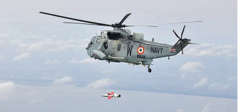
ଆଣ୍ଟିଶିପ୍ ମିଶନର ପରୀକ୍ଷଣ ସମୟରେ ନାଭାଲ ଯୁନିଟର କାହାଳି।

ବାଲେଶ୍ୱର ଅପିସ, ୧୮।୫ ବାଲେଶ୍ୱର ରାଜିପୁରସ୍ଥିତ ପ୍ରତିରକ୍ଷା ଗବେଷଣା ଏବଂ ବିକାଶ ସଙ୍ଘଟନ(ଡିଆରଡିଓ) ଏବଂ ଭାରତୀୟ ନୌସେନା ପକ୍ଷରୁ ବୁଧବାର ପ୍ରଥମଥର ଲାଗି ନାଭାଲ ଆଣ୍ଟିଶିପ୍ ମିଶନ(କ୍ଷେପଣାସ୍ତ୍ର)ର ପରୀକ୍ଷଣ ହୋଇଛି। ଏଥିରେ ଆକାଶ ମାର୍ଗରୁ