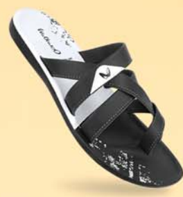
WG5416 | ₹ 329.00*