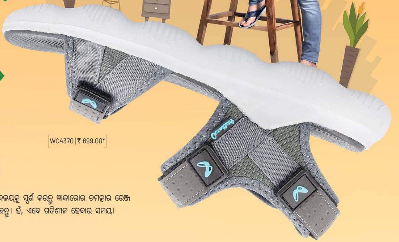
WC4370 | ₹ 699.00*

ପୁରୁଷମାନଙ୍କୁ ବାହାର ଜଗତରେ ରଖନ୍ତୁ ଏବଂ ନୂତନ ଦିଗ୍‌ବଳୟକୁ ଜିତନ୍ତୁ।