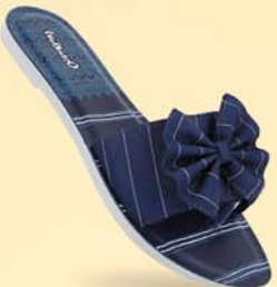
WL7410 | ₹ 289.00*