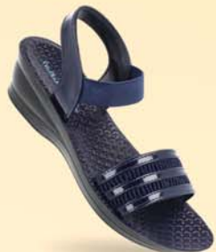
WL7781 | ₹ 389.00*