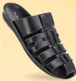
WG5407 | ₹ 449.00*