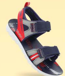
WK788 | ₹ 279.00* | ₹ 299.00*