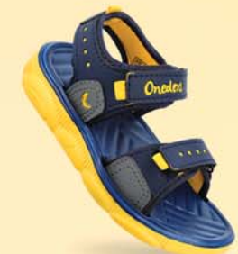
WK453 | ₹ 254.00*