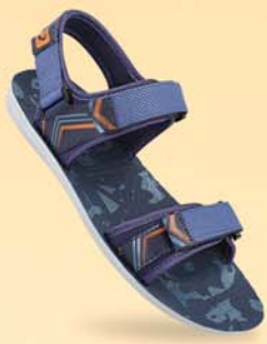
WG5747 | ₹ 399.00*