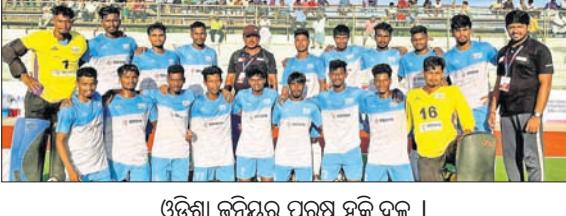
ଓଡ଼ିଶା କ୍ରିକେଟ ପୁରୁଷ ହକି ଦଳ ।

ଭୁବନେଶ୍ୱର, ୧୯୫୫ (ବ୍ରାହ୍ମା ପ୍ରତିଦିନ): ଚାମ୍ପିୟନ ଲାଜୁ ତରଫର ରୋହିଦାସଙ୍କୁ ଓଡ଼ିଶା ଦଳର ସହ ଅଭିଯାନ ଆରମ୍ଭ କରିଛି। ଗୁରୁବାର ନିଜର ପ୍ରଥମ ମ୍ୟାଚରେ ଓଡ଼ିଶା ୫-୦ ରୋଲରେ ରାଜସ୍ଥାନକୁ ହରାଇ ଦେଇଛି। ଓଡ଼ିଶା ପକ୍ଷରୁ ଦୀପକ ମିଶ୍ର ୨୪ ଓ ୪୫ ଏବଂ