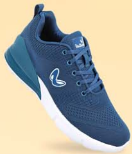
XS9751 | ₹ 1049.00*