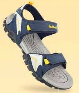
WC4362 | ₹ 649.00*