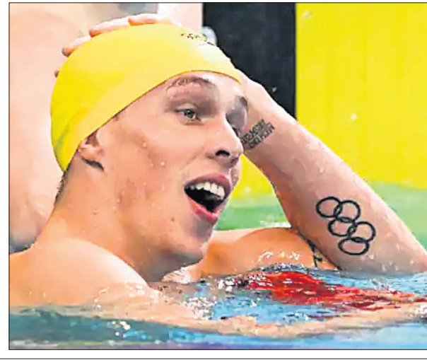
ସ୍ପୋର୍ଟସ୍ ଲାଇଫ ଟାମ୍ପରା ବିଶ୍ୱ ରେକର୍ଡ

ଶତ ପ୍ରତିଶତ ଦର୍ଶକଙ୍କୁ ଅନୁମତି ଦେଇସାରିଥିଲା। ଦେଶରେ କରୋନା ମହାମାରୀ ସ୍ଥିତିରେ ସୁଧାର ଆସିଛି। ତେଣୁ କୋଭିଡ୍ ପ୍ରୋଟୋକଲକୁ କୋହଳ କରାଯାଇଛି। ବିସିଆଇ ଶତପ୍ରତିଶତ ଦର୍ଶକଙ୍କୁ ଅନୁମତି ଦେବା ଦ୍ୱାରା ଲୋକେ ଷ୍ଟାଡିୟମକୁ ଆସି ମ୍ୟାଚକୁ ପୂର୍ବଭଳି ଉପଭୋଗ କରିପାରିବେ। ଦକ୍ଷିଣ ଆଫ୍ରିକା ଇତିମଧ୍ୟରେ ଭାରତ ବିପକ୍ଷ ଟି୨୦ ସିରିଜ ପାଇଁ ଏହାର ଦଳ ଘୋଷଣା କରିସାରିଛି।