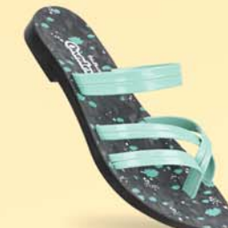
WK783 | ₹ 194.00* | ₹ 214.00*