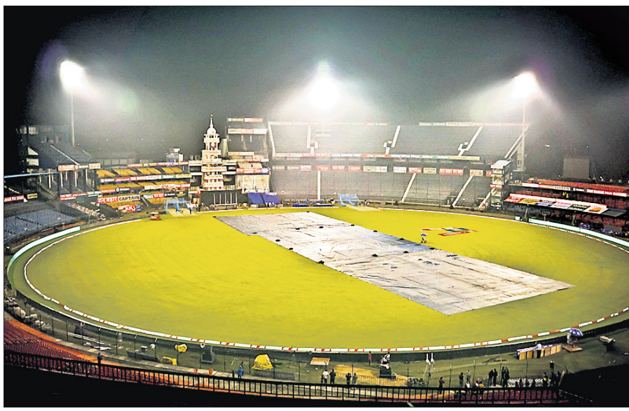
ବାରବାଟୀ ଷ୍ଟାଡିୟମ ।