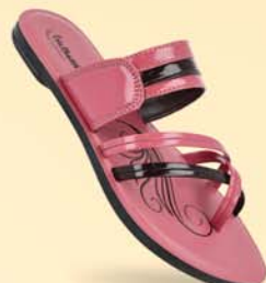
WL7394 | ₹ 309.00*