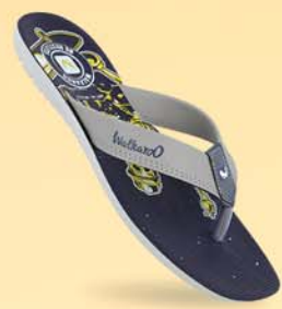
WG5054 | ₹ 299.00*