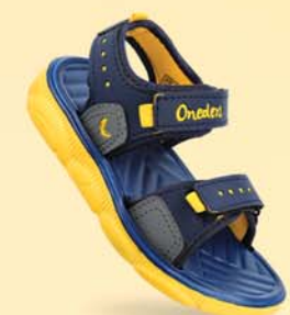
WK453 | ₹ 254.00*