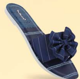
WL7410 | ₹ 289.00*