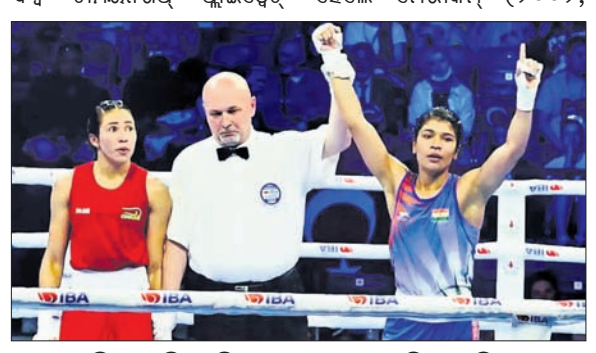
ନିଖତ କରିବାକୁ ବିଜୟୀ ଘୋଷଣା କରୁଛନ୍ତି ରେପ୍‌ରି।