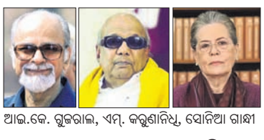
ଆଇ.ଜେ. ଗୁଜରାଜୀ, ଏମ୍. କରୁଣାକର, ସୋନିଆ ଗାନ୍ଧୀ

ନୂଆଦିଲ୍ଲୀ, ୧୯୫୫: ପୂର୍ବତନ ପ୍ରଧାନମନ୍ତ୍ରୀ ରାଜୀବ ଗାନ୍ଧୀଙ୍କ ହତ୍ୟାକାଣ୍ଡର ତଦନ୍ତ କରୁଥିବା ଜିନ କମିଶନ ୧୯୯୭ ଅଗଷ୍ଟ ୨୮ରେ ତତ୍କାଳୀନ ପ୍ରଧାନମନ୍ତ୍ରୀ ଇନ୍ଦ୍ର କୁମାର ମୁଖରଜୀଙ୍କ ସରକାରଙ୍କ ନିକଟରେ ଅଭିଯୋଗ ରିପୋର୍ଟ ଦାଖଲ କରିଥିଲେ।