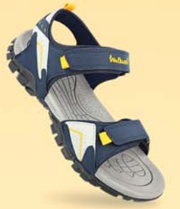
WC4362 | ₹ 649.00*