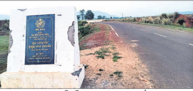
ଗଛ ନ ଥାଇ ଖାଲି ପଡ଼ିଥିବା ଅଶୋକବନ ଉଭୟ ପାର୍ଶ୍ଵ ରାସ୍ତା।

ଖଣିଖାଦାନ ଭରା ଅଞ୍ଚଳର ଲୋକଙ୍କ ମନରେ ସୃଷ୍ଟି ହୋଇଥିବା ବିଦ୍ରୋହକୁ ପ୍ରଶମିତ କରିବା ପାଇଁ କେନ୍ଦ୍ର ଓ ରାଜ୍ୟ ସରକାର ଏକ ରଣକୌଶଳ ପ୍ରସ୍ତୁତ କରିଛନ୍ତି। ଖଣି ଓ ଖଣିକ ପଦାର୍ଥ ପ୍ରଶାସନିକ ପରିଚାଳନା ପାଇଁ ମାଲଟୁ ଓ ମିନେରାଲ ଡେଭେଲପମେଣ୍ଟ ଆଣ୍ଡ ରେଗୁଲେଶନ ଆକ୍ଟ-୧୯୫୭କୁ ୨୦୧୫ରେ ସଂଶୋଧନ କରାଯାଇଛି। ଏହି ଆଇନର ସର୍ବସମ୍ମତ ୧ ଧାରା ୯(ବି)ରେ ଜିଲ୍ଲାସ୍ତରରେ ଜିଲା ଖଣିକ ପଦାର୍ଥ ପ୍ରତିଷ୍ଠାନ(ଡିଏମ୍‌ଏଫ୍) ଗଠିତ ହୋଇଛି। ଏହି ଡିଏମ୍‌ଏଫ୍ ପାଣ୍ଠି ବିନିଯୋଗ କରି ଖଣି ପ୍ରଭାବିତ ଅଞ୍ଚଳର ସ୍ଵାସ୍ଥ୍ୟ, ଶିକ୍ଷା ଓ ପାନୀୟଜଳ ବ୍ୟବସ୍ଥାକୁ ଆଗ୍ରାଧିକାର ଭିତ୍ତିରେ ସୁବ୍ୟବସ୍ଥା କରାଯିବ ବୋଲି ସରକାରୀସ୍ତରରେ ନିଷ୍ପତ୍ତି ହୋଇଛି। ହେଲେ ଯାଜପୁର ଜିଲ୍ଲାରେ ଓଏପଡିସି(ଓଡ଼ିଶା ଫରୋଷ୍ଟ ଡେଭେଲପମେଣ୍ଟ କର୍ପୋରେଶନ) ଦ୍ଵାରା ବନୀକରଣ ନାମରେ ଏହି ପାଣ୍ଠିର ସିଂହଭାଗ ମିଳିନିଶି କୁନ୍ଦ କରାଯାଉଥିବା ଅଭିଯୋଗ ହୋଇଛି। ସବୁଜିମା ସୃଷ୍ଟି ଓ ସୁରକ୍ଷା ନିମନ୍ତେ