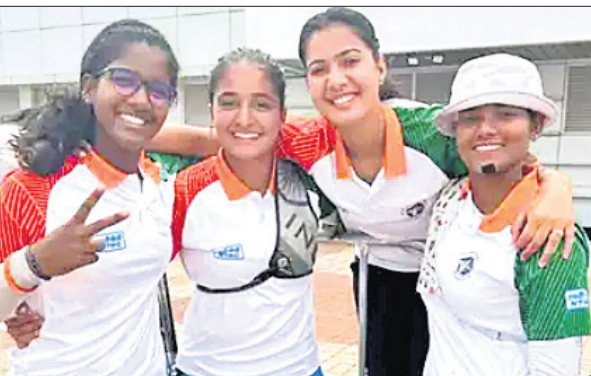
ବ୍ରୋଞ୍ଜ ବିଜୟୀ ଭାରତୀୟ ମହିଳା ଚାରାୟାଜୀ ଦଳ ।

ଗୁଆଲୁ, ୧୯୮୫: ଭାରତୀୟ ମହିଳା ଚାରାୟାଜୀ ଦଳ ଗୁଆଲୁର ଚଳିତ ବିଶ୍ୱକପ୍ ଷ୍ଟେଜ୍-୨ ପ୍ରତିଯୋଗିତାର ରେକର୍ଡ ଇଭେଣ୍ଟରେ ବ୍ରୋଞ୍ଜ ପଦକ ଜିତିଛି । ଏଥିଯୋଗୁ ପ୍ରତିଯୋଗିତାରେ ଭାରତର ପଦକ ସଂଖ୍ୟା ୩ରେ ପହଞ୍ଚିଛି ।