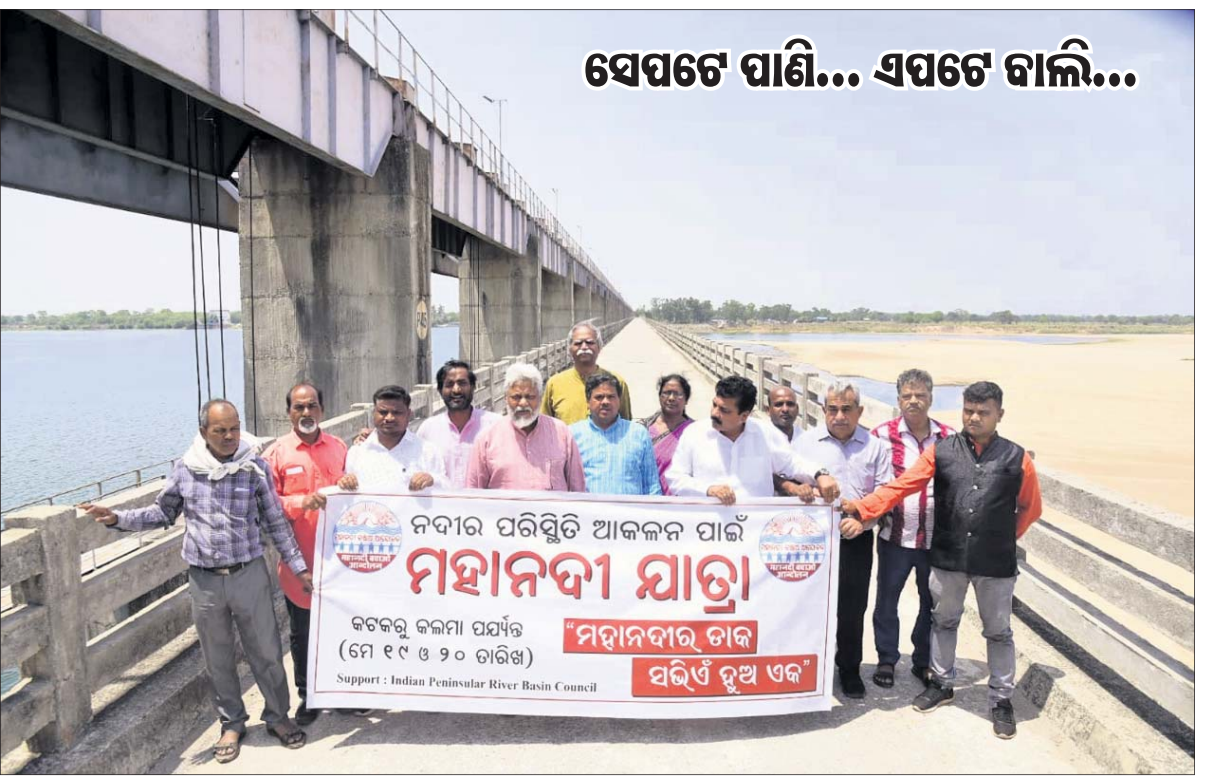
ଛତିଶଗଡ଼ର କଲମ୍ବା ବ୍ୟାରେଜ ଉପରେ ମହାନଦୀ ବଞ୍ଚାଣ ଆନ୍ଦୋଳନର କର୍ମକର୍ତ୍ତାମାନେ ବ୍ୟାନର ଧରି ବିକ୍ଷୋଭ ପ୍ରଦର୍ଶନ କରୁଛନ୍ତି। (ପୃଷ୍ଠା: ୧୨)