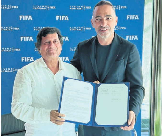
ବୁଝାମଣାପତ୍ର ସ୍ଵାକ୍ଷର ଅବସରରେ ଫିଫା ଫାଉଣ୍ଡେଶନର ସିଇଓ ଯୁରି କୋରେକ୍‌ଟ ଏବଂ କିସ୍ ପ୍ରତିଷ୍ଠାତା ଅତ୍ୟୁତ ସାମଗ୍ର।

ପ୍ରଭାବ ପକାଇବ। ମୁଖ୍ୟମନ୍ତ୍ରୀ ନବୀନ ପଟ୍ଟନାୟକ କ୍ରୀଡ଼ାର ବିକାଶ ପାଇଁ ବ୍ୟାପକ କାର୍ଯ୍ୟକ୍ରମ ହାତକୁ ନେଇଥିବାରୁ ଫୁଟବଲ୍‌ରୁ ଅଧିକ ପ୍ରୋତ୍ସାହନ ଦେବା ଲାଗି କିସ୍ କୁ ନୋଡାଲ ଏକ୍ସକ୍ସିଭ୍ ଭାବେ ଚୟନ କରାଯାଇଛି ବୋଲି ଯୁରି କୋରେକ୍‌ଟ କହିଛନ୍ତି। ସେହିପରି ନିଜ ପ୍ରତିକ୍ରିୟାରେ ଅତ୍ୟୁତ କହିଛନ୍ତି, ବିଶ୍ଵରେ ଅଧିକ ଲୋକପ୍ରିୟ କ୍ରୀଡ଼ା ହେଉଛି ଫୁଟବଲ୍। ଫିଫା ସହ ସହଯୋଗ ହେବା ଫଳରେ ଓଡ଼ିଶା, ଭାରତ ତଥା ଦକ୍ଷିଣ ଏସିଆରେ