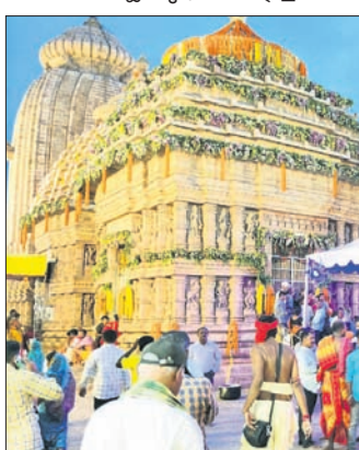
ମା'ଙ୍କ ଦର୍ଶନ ଲାଗି ଭକ୍ତଙ୍କ ଭିଡ଼।

ପୁରୁଷୋତ୍ତମପୁର, ୧୯।୫(ଡି.ଏନ୍.ଏ.): ଗଞ୍ଜାମ ଜିଲ୍ଲା ତଥା ଦକ୍ଷିଣ ଓଡ଼ିଶାର ପ୍ରସିଦ୍ଧ ଇଷ୍ଟଦେବୀ ମା' ଚାରାଚାରିଶାଙ୍କ ନୂତନ ମନ୍ଦିର ପ୍ରତିଷ୍ଠା ତଥା ଜାଣ୍ଟୋକାର ଓ ପ୍ରାସାଦ ସଂସ୍କାର କାର୍ଯ୍ୟକ୍ରମ ଗୁରୁବାର ପଞ୍ଚମ ଦିନରେ ପହଞ୍ଚିଛି। ଏଥିଲାଗି ମା'ଙ୍କ ଦିନକୁ ସୁନ୍ଦର ରଙ୍ଗିନ ଆଲୋକମାଳାରେ ସଜ୍ଜିତ କରାଯାଇଛି। ମା'ଙ୍କ ଆଶୀର୍ବାଦ ଭିକ୍ଷା ଲାଗି ହଜାର ହଜାର ଜନସାଧାରଣଙ୍କ ସୁଅ କୁଟିବାରେ ଲାଗିଛି। ନୂତନ ରୂପରେ ଗଢ଼ିଉଠିଥିବା ମନ୍ଦିର ପ୍ରତିଷ୍ଠା କାର୍ଯ୍ୟ ଗତ ୧୫ ତାରିଖଠାରୁ ଆରମ୍ଭ ହୋଇ ଶୁକ୍ରବାର ପୂର୍ଣ୍ଣାହୁତି ହେବ। ଏହି ପୂର୍ଣ୍ଣାହୁତିରେ ପ୍ରବଳ ଜନସମାଗମକୁ ଦୃଷ୍ଟିରେ ରଖି ପ୍ରଶାସନ