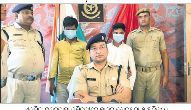
ଏସ୍‌ପିଙ୍କ ଖବରଦାତା ସମ୍ମିଳନୀରେ ହାଜର ହୋଇଥିବା ୨ ଅଭିଯୁକ୍ତ।