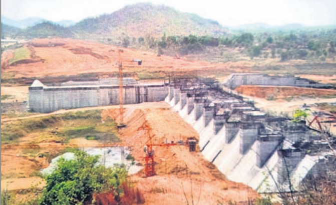
ବଲାଙ୍ଗୀର ଲୋୟର ସୁକ୍‌ଡେଲ ଜଳସେଚନ ପ୍ରକଳ୍ପର ନିର୍ମାଣାଧୀନ ତ୍ୟାମ।

ହେବା ଲକ୍ଷ୍ୟ ରଖାଯାଇଛି। ଏହାସହିତ ଏହି ପ୍ରକଳ୍ପରୁ ବଲାଙ୍ଗୀର ସହରକୁ ପାନୀୟ ଜଳଯୋଗାଣ ବ୍ୟବସ୍ଥା କରାଯିବ। ପ୍ରକଳ୍ପ ଦ୍ଵାରା ବଲାଙ୍ଗୀର, ଲୋଇସିଂହା ଏବଂ ୯୦ ପ୍ରତିଶତ ଏବଂ ୧୧୫୫ ମିଟର ମାଟିବନ୍ଧ କାମ ପ୍ରାୟ ୭୦ ପ୍ରତିଶତ ଶେଷ ହୋଇଛି। ଏହି ପ୍ରକଳ୍ପରୁ ଖୋଲା କେନାଲ ବନ୍ଦକରେ ଚାପଯୁକ୍ତ ବିଦ୍ୟୁତ୍ ସଞ୍ଚାଳିତ ଭୂତଳ ନଳ ପକ୍ଷିତରେ ଜଳସେଚନ ବ୍ୟବସ୍ଥା କରାଯିବ। ଏହି ଭୂତଳ ନଳ ପ୍ରକଳ୍ପର ଚେଷ୍ଟର ଆହ୍ଲାନ୍ ସରିଯାଇଛି। ଏଥିସହାଗେ ପ୍ରାୟ ୨ ହଜାର କୋଟି ଟଙ୍କା ଖର୍ଚ୍ଚ ହେବ। ଏହାଦ୍ଵାରା ବଲାଙ୍ଗୀର ଓ ସୁବର୍ଣ୍ଣପୁର ଜିଲ୍ଲାର ୨୬୫ଟି ଗ୍ରାମର ପ୍ରାୟ ୪୦ ହଜାର ହେକ୍ଟର ଜମି ଜଳସେଚିତ