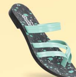
WK783 | ₹ 194.00* | ₹ 214.00*