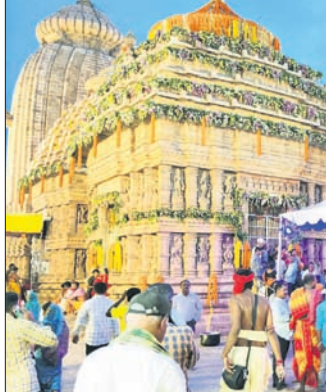
ମା'ଙ୍କ ଦର୍ଶନ ଲାଗି ଭକ୍ତଙ୍କ ଭିଡ଼।

ପୁରୁଷୋତ୍ତମପୁର, ୧୯।୫(ଡି.ଏନ୍.ଏ.): ଗଞ୍ଜାମ ଜିଲ୍ଲା ତଥା ଦକ୍ଷିଣ ଓଡ଼ିଶାର ପ୍ରସିଦ୍ଧ ଲକ୍ଷ୍ମୀଦେବୀ ମା' ଚାରାଚାରିଶାଙ୍କ ନୂତନ ମନ୍ଦିର ପ୍ରତିଷ୍ଠା ତଥା ଜାଣ୍ଟୋବାର ଓ ପ୍ରାସାଦ ସଂସ୍କାର କାର୍ଯ୍ୟକ୍ରମ ଗୁରୁବାର ପଞ୍ଚମ ଦିନରେ ପହଞ୍ଚିଛି। ଏଥିଲାଗି ମା'ଙ୍କ ଦିନକୁ ସୁନ୍ଦର ରଙ୍ଗିନ ଆଲୋକମାଳାରେ ସଜ୍ଜିତ କରାଯାଇଛି। ମା'ଙ୍କ ଆଶୀର୍ବାଦ ଭିକ୍ଷା ଲାଗି ହଜାର ହଜାର ଜନସାଧାରଣଙ୍କ ସୁଅ କୁଟିବାରେ ଲାଗିଛି। ନୂତନ ରୂପରେ ଗଢ଼ିଉଠିଥିବା ମନ୍ଦିର ପ୍ରତିଷ୍ଠା କାର୍ଯ୍ୟ ଗତ ୧୫ ତାରିଖଠାରୁ ଆରମ୍ଭ ହୋଇ ଶୁକ୍ରବାର ପୂର୍ଣ୍ଣାହୁତି ହେବ। ଏହି ପୂର୍ଣ୍ଣାହୁତିରେ ପ୍ରବଳ ଜନସମାଗମକୁ ଦୃଷ୍ଟିରେ ରଖି ପ୍ରଶାସନ