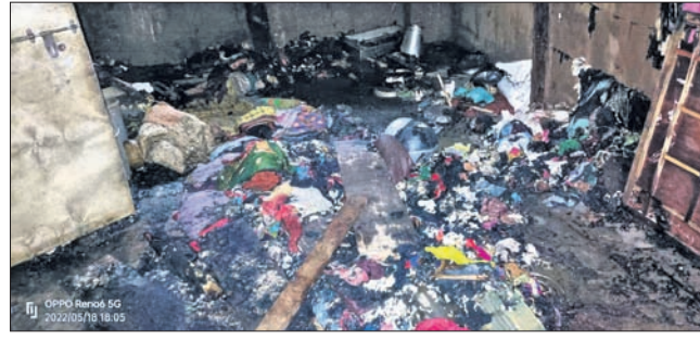
ଅଗ୍ନିକାଣ୍ଡରେ ନଷ୍ଟ ହୋଇଥିବା ଘରର ଆସବାବପତ୍ର।