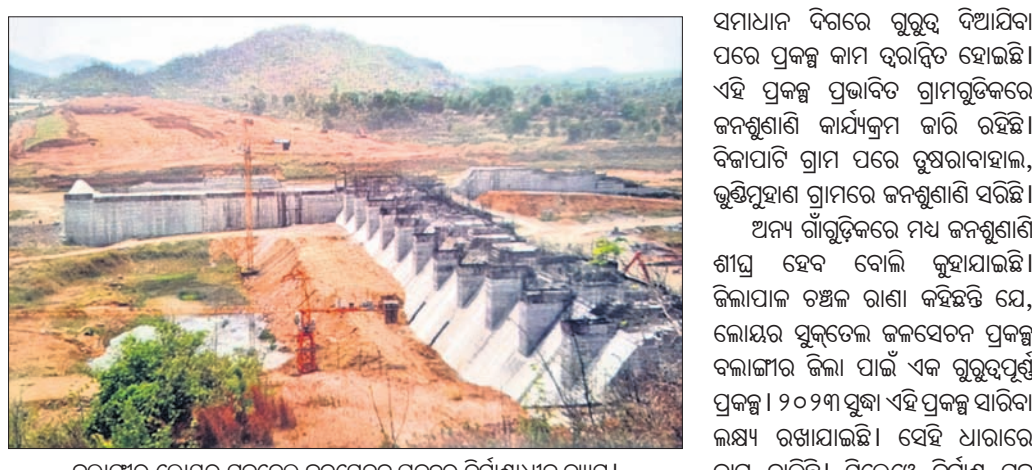
ବଲାଙ୍ଗୀର ଲୋୟର ସୁକ୍‌ଡେଲ ଜଳସେଚନ ପ୍ରକଳ୍ପର ନିର୍ମାଣାଧୀନ ତଥ୍ୟ।

ହେବା ଲକ୍ଷ୍ୟ ରଖାଯାଇଛି। ଏହାସହିତ ଏହି ପ୍ରକଳ୍ପରୁ ବଲାଙ୍ଗୀର ସହରକୁ ପାନୀୟ ଜଳଯୋଗାଣ ବ୍ୟବସ୍ଥା କରାଯିବ। ପ୍ରକଳ୍ପ ଦ୍ଵାରା ବଲାଙ୍ଗୀର, ଲୋଇସିଂହା ଏବଂ ୯୦ ପ୍ରତିଶତ ଏବଂ ୧୧୫୫ ମିଟର ମାଟିବନ୍ଧ କାମ ପ୍ରାୟ ୭୦ ପ୍ରତିଶତ ଶେଷ ହୋଇଛି। ଏହି ପ୍ରକଳ୍ପରୁ ଖୋଲା କେନାଲ ବନ୍ଦକରେ ଚାପସ୍ତୁଳ ବିଦ୍ୟୁତ୍ ସଞ୍ଚାଳିତ ଭୂତଳ ନଳ ପକ୍ଷିରେ ଜଳସେଚନ ବ୍ୟବସ୍ଥା କରାଯିବ। ଏହି ଭୂତଳ ନଳ ପ୍ରକଳ୍ପର ଚେଣ୍ଡର ଆହ୍ଲାନ୍ ସରିଯାଇଛି। ଏଥିସହାଗେ ପ୍ରାୟ ୨ ହଜାର କୋଟି ଟଙ୍କା ଖର୍ଚ୍ଚ ହେବ। ଏହାଦ୍ଵାରା ବଲାଙ୍ଗୀର ଓ ସୁବର୍ଣ୍ଣପୁର ଜିଲ୍ଲାର ୨୨୫ଟି ଗ୍ରାମର ପ୍ରାୟ ୪୦ ହଜାର ହେକ୍ଟର ଜମି ଜଳସେଚିତ