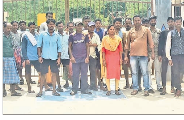
ସରପଞ୍ଚ ଓ ଗ୍ରାମବାସୀ ବିଧିରେ ସର୍ବସ୍ୱେଚ୍ଛା କାର୍ଯ୍ୟକ୍ରମ ଘୋଷଣା କରିଛନ୍ତି।

ଉଦ୍‌ଘାଟନ ହୋଇଥିଲା। ହେଲେ ଲୋକଙ୍କ ଅସୁବିଧା ଦୂର ହେବା ବ୍ୟତୀତ ସମସ୍ୟା ବଢ଼ିଯାଇଛି। ଅଯୋଗିତ ବିଧିରେ କାଟି ଯୋଗୁ ପିଲାଇ ପାଠପଢ଼ାରେ ସମସ୍ୟା ଉପୁଜିଛି। ବିଭାଗୀୟ ଅଧିକାରୀଙ୍କ ନିକଟରେ ବାରମ୍ବାର ଅଭିଯୋଗ କଲେ ମଧ୍ୟ କୌଣସି ପ୍ରତିକ୍ରିୟା ମିଳୁ ନ ଥିବା ଗ୍ରାମବାସୀ କହିଛନ୍ତି। ଏ ନେଇ ପିପିଲିଗୁଡ଼ା ସରପଞ୍ଚ କହିଛନ୍ତି, ଲୋକେ ଅସହ୍ୟ ଗରମ ସମ୍ବଳି ନ ପାରି ଗଛମୂଳକ ପଞ୍ଚାୟତର ଲୋକଙ୍କୁ ନିରବିଚ୍ଛିନ୍ନ ବିଧିରେ ସେବା ଯୋଗାଇବାକୁ ୨୦୨୧ ସେପ୍ଟେମ୍ବରରେ ରାଜ୍ୟ ସରକାରଙ୍କ ଦ୍ୱାରା ପିପିଲିଗୁଡ଼ା ୩୩/ ୧୧ କେଭି ସର୍ବସ୍ୱେଚ୍ଛା