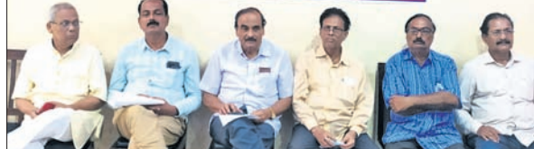
ଖବରଦାତା ସମ୍ମିଳନୀରେ ଉପସ୍ଥିତ ସିପିଆଇ ନେତୃତ୍ୱ।

ବ୍ରଜରାଜନଗର, ୧୯୫୫(ଡି.ଏନ୍.ଏ.): ବ୍ରଜରାଜନଗର ଉପନିର୍ବାଚନରେ ବ୍ରଜରାଜନଗର, ୧୯୫୫(ଡି.ଏନ୍.ଏ.): ବ୍ରଜରାଜନଗର ଉପନିର୍ବାଚନରେ ବ୍ରଜରାଜନଗର, ୧୯୫୫(ଡି.ଏନ୍.ଏ.): ବ୍ରଜରାଜନଗର ଉପନିର୍ବାଚନରେ