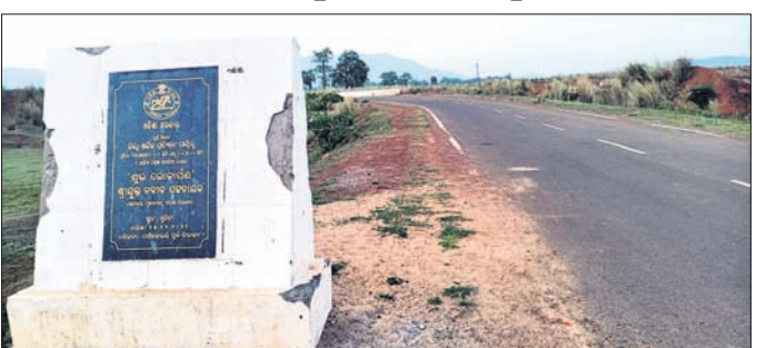
ଗଛ ନ ଥାଇ ଖାଲି ପଡ଼ିଥିବା ଅଞ୍ଚଳରେ ଉଭୟ ପାର୍ଶ୍ଵ ରାସ୍ତା।

ସରକାରୀସ୍ତରରୁ ଆରମ୍ଭ କରି ବେସରକାରୀସ୍ତର ପର୍ଯ୍ୟନ୍ତ ଅନେକ କାର୍ଯ୍ୟକ୍ରମ ହାତକୁ ନିଆଯାଇଛି। ମାତ୍ର ବାସ୍ତବରେ ବେଖୁବାରୁ ଗଲେ ଯେତିକି ଜଙ୍ଗଲ ଅଛି ତା'ର ସୁରକ୍ଷା ଦିଗରେ ବନ ବିଭାଗ ସମ୍ପୂର୍ଣ୍ଣ ବିଫଳ ହୋଇଛି। ପ୍ରତିବର୍ଷ ବନୀକରଣ ନାଁରେ ଅନେକ କୋଟି ଟଙ୍କା ଅନୁଦାନ ଆସୁଛି। ହେଲେ ଉପଯୁକ୍ତ ବନୀକରଣ ହେଉ ନ ଥିବାରୁ ତା'ର ସଫଳତା ମିଳୁନାହିଁ। ସୂଚନା ଅଧିକାର ଆଇନ(ଆରଟିଆଇ) ବଳରେ ମିଳିଥିବା ତଥ୍ୟ ଅନୁସାରେ, ଡିଏମ୍‌ଏଫ୍ ପାଣ୍ଠିକୁ ଓଏପଡିସି ଜରିଆରେ ୪ଟି ବନୀକରଣ ପ୍ରକଳ୍ପରେ ୭.୬୭୧୩ କୋଟି ଟଙ୍କା ଦ୍ଵାରା ବନୀକରଣ ନାମରେ ଏହି ପାଣ୍ଠିର ସିଂହଭାଗ ମିଳିନିଶି ଲୁଚି କରାଯାଉଥିବା ଅଭିଯୋଗ ହୋଇଛି। ସବୁଜିମା ସୃଷ୍ଟି ଓ ସୁରକ୍ଷା ନିମନ୍ତେ