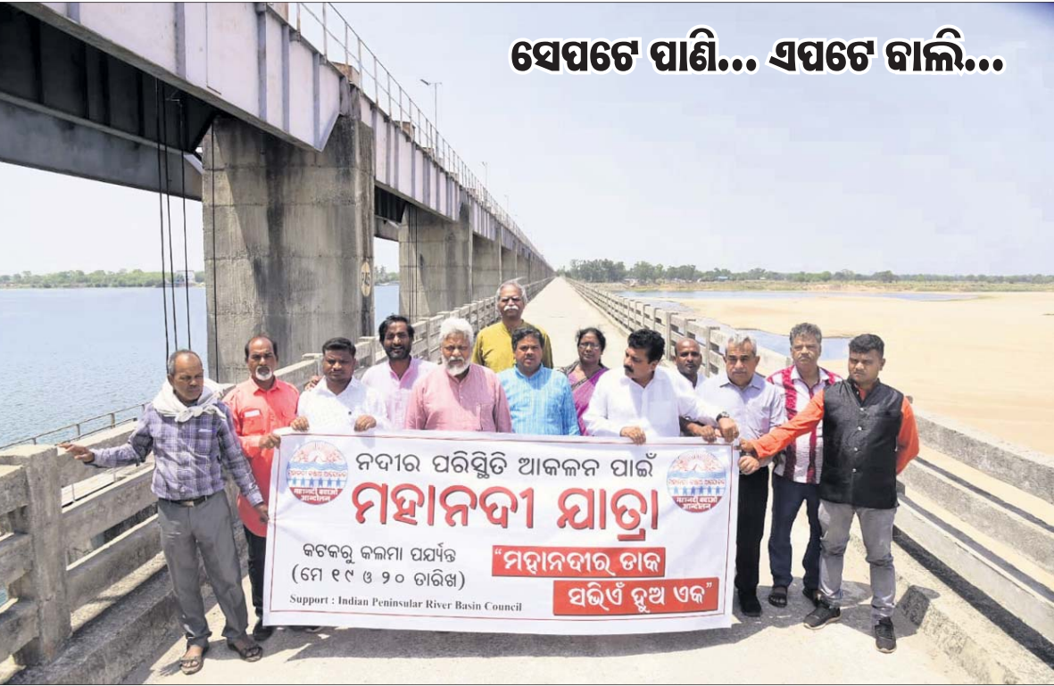
ଛତିଶଗଡ଼ର କଲମ୍ବା ବ୍ୟାରେଜ ଉପରେ ମହାନଦୀ ବନ୍ଧାଅ ଆନ୍ଦୋଳନର କର୍ମକର୍ତ୍ତାମାନେ ବ୍ୟାନର ଧରି ବିକ୍ଷୋଭ ପ୍ରଦର୍ଶନ କରୁଛନ୍ତି। (ପୃଷ୍ଠା: ୧୨)