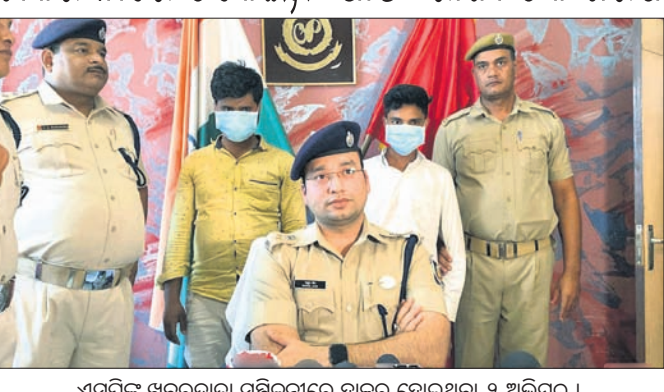
ଏସ୍‌ପିଙ୍କ ଖବରଦାତା ସମ୍ମିଳନୀରେ ହାଜର ହୋଇଥିବା ୨ ଅଭିଯୁକ୍ତ।