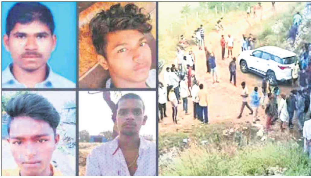
ପୋଲିସ ଏନ୍‌କାଉଣ୍ଟରରେ ନିହତ ୪ ଅଭିଯୁକ୍ତ । ଘଟଣାସ୍ଥଳରେ ଦେଖାଯାଇଥିବା ଉଦ୍‌ଘାଟିତ ଗାଡ଼ି । (ଫାଇଲ ଫଟୋ)

ନ୍ୟାସିକା/ହାଇଦ୍ରାବାଦ, ୨୦୧୫ ୨୦୧୯ ଡିସେମ୍ବର ୬ ସକାଳେ ଲୋକଙ୍କ ନିଦ ଭାଙ୍ଗି ନିୟମିତ ହାଇଦ୍ରାବାଦ ପୋଲିସ ଟୁଲିରେ ମିଶାଯିଥିଲା ୪ ଅଭିଯୁକ୍ତ । ଜଣେ ମିଛ ପ୍ରାଣୀ ଚିକିତ୍ସକ କିପରି ଅପହରଣ, ଗଣାବଳାକାର ପରେ ହତ୍ୟା କରି ଜାଳି ଦେଇଥିଲେ ତାହାର ରହସ୍ୟ ପାଇଁ ପୋଲିସ ଅଭିଯୁକ୍ତମାନଙ୍କୁ ଅପରାଧପତ୍ରକୁ ନେଇ ଏନ୍‌କାଉଣ୍ଟର କରିଥିଲା । ପୋଲିସ ଅଧିକାରୀଙ୍କ ରୁଲିମାଡ଼ରେ ୪ ଅଭିଯୁକ୍ତଙ୍କ ମୃତ୍ୟୁ ଘଟିଥିଲା । ଏହି ବହୁତଳିତ ତଥା ବିବାଦୀୟ ଏନ୍‌କାଉଣ୍ଟର ଫେରା ଥିଲା । ପୋଲିସ ନିଜେ ମନଗଢ଼ା ତଥା ଅବିଶ୍ୱାସନୀୟ କାହାଣୀ ଲେଖି ଆତ୍ମରକ୍ଷା ପାଇଁ କାର୍ଯ୍ୟାନୁଷ୍ଠାନ ନେଇଥିବା ଦର୍ଶାଇଥିଲା ବୋଲି ପୁସ୍ତକାଳୋଚନା ଦ୍ୱାରା ଗଠିତ ଚନ୍ଦ୍ର କମିଶନ ରିପୋର୍ଟ ଦାଖଲ କରିଛନ୍ତି । ଏଥିସହ ଫେରା ଏନ୍‌କାଉଣ୍ଟରରେ ସାମିଲ ଥିବା ସମସ୍ତ ୧୦ ପୋଲିସ ଅଧିକାରୀଙ୍କ ବିରୋଧରେ ହତ୍ୟା ମାମଲା ରୁଜୁ ପାଇଁ ସୁପାରିସ