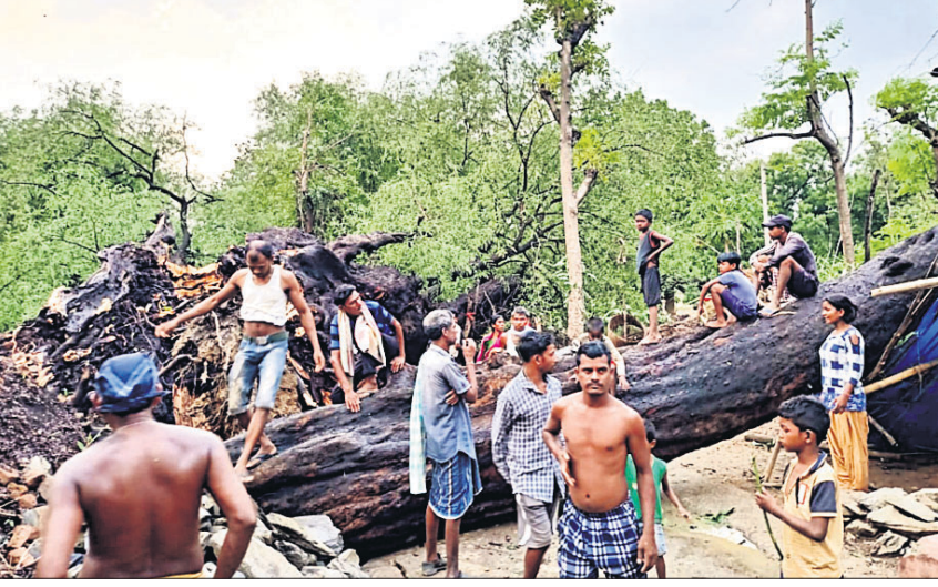
କାଲୋସିହିରିଆ: ବଜ୍ରପାତରେ ସୁବକ ମୃତ