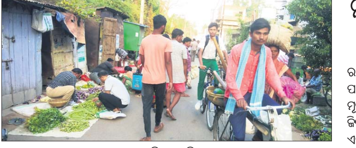
ବରଗଡ଼ ସବ୍ଡିଭିଜନ ପଛପଟ ରାସ୍ତାରେ ବସିଥିବା ପରିବା ବଜାର ।

ବରଗଡ଼ ସବ୍ଡିଭିଜନ ପଛପଟ ରାସ୍ତା ଗତ କିଛିଦିନ ହେଲା ପରିବା ବଜାର ପାଲଟିଛି । ପରିବା ବ୍ୟବସାୟୀ ଏବଂ ଗରାଖଳ ଭିତରେ ସକାଳୁ ଭକ୍ତ ରାସ୍ତା ଗହଳି ରହୁଛି । ଫଳରେ ରାସ୍ତାରେ ଗ୍ରାହକ ସମସ୍ୟା ଉଠୁଛି । ୨୦ଟଙ୍କା, ୪୦ଟଙ୍କା ଯାନ ଯାତାୟତ କରିବା ପୁସ୍ତିକ ହୋଇ ପଡୁଥିବାବେଳେ ଦୁର୍ଘଟଣା ଆଶଙ୍କା ରହିଛି । ଏହି ସ୍ଥାନଟି ସ୍ଥାନୀୟ ଚାନ୍ଦ ଥାନା ଏବଂ ପୁନିସିପାଲିଟି କାର୍ଯ୍ୟାଳୟର ଅନତିଦୂରରେ ଥିବାବେଳେ ଭଉଣ୍ଡ ପୋଲିସ ଏବଂ ପୌର କର୍ତ୍ତୃପକ୍ଷ ନିରବସ୍ଥା ସାଧିବା ଚର୍ଚ୍ଚା ବିଷୟ ହୋଇଛି । ପ୍ରକାଶ ଯେ, କେଳ ପଛପଟ ରାସ୍ତା ଗୋଟିଏ ପଟେ ସହର ପୁଞ୍ଜାପତ୍ୟ ଏବଂ ଅନ୍ୟପଟେ ଭରଳି ଛକ ରାସ୍ତାକୁ ସଂଯୋଗ କରିଛି । ଏହି ରାସ୍ତା ଥାନା ଛକ, ମଝିଳା କଲେଜ ଛକ, ଖଜୁରଚିତ୍ରା ଛକ, ପୁରୁଣା ସହିତାଳ ଛକ ଆଦି ନିର୍ଭରଶୀଳ ସ୍ଥାନକୁ ସଂଯୋଗ ହୋଇଛି । ଏହାସହିତ ଭକ୍ତ ରାସ୍ତା ଦେଇ ଜର୍ଜ ହାଲସ୍ତୁଲ, ସରସ୍ଵତୀ ଶିଳ୍ପ ମନ୍ଦିର ସମେତ ବିଭିନ୍ନ ଶିକ୍ଷାନୁଷ୍ଠାନକୁ ଛାତ୍ରାଛାତ୍ରୀ, ଶିକ୍ଷୟିତ୍ରୀ ଶିକ୍ଷକ ଯିବା ଆସିବା କରନ୍ତି । ସ୍କୁଲବସ୍ ରୁଟିକ ମଧ୍ୟ ଯାତାୟତ କରୁଛି । ସକାଳୁଥା ପାଠପଢ଼ା ହେଉଛି । ସକାଳୁ ରାସ୍ତା ଉପରେ ପରିବା ବଜାର ବସୁଥିବା ପରିବା ବଜାରକୁ ଅନ୍ୟତ୍ର ସ୍ଥାନାନ୍ତର କରିବା ଜରୁରି ହୋଇପଡିଛି । ଭଲଖନାୟ ବରଗଡ଼ ହାଟପଦାରେ ପରିବା ବଜାର ରହିଥିବାବେଳେ ରେଳ ଷ୍ଟେଶନ ରାସ୍ତା ପାର୍ଶ୍ଵରେ କୃଷକ ବଜାର ମଧ୍ୟ ରହିଛି । କୋଭିଡ଼ ସମୟରେ ସ୍ଥାନୀୟ ଜର୍ଜ ହାଲସ୍ତୁଲ ପଡ଼ିଆରେ ଅସ୍ଥାୟୀ ପରିବା ବଜାର ଖୋଲିଥିଲା । ସେହିଦିନଠାରୁ ବ୍ୟବସାୟୀମାନେ ସେଠାରେ ପରିବା ବିକ୍ରିବା କରିଆସୁଥିଲେ । ତେବେ ସ୍କୁଲ ପଡ଼ିଆକୁ ପରିବା ବଜାର ଭାବେ ବ୍ୟବହାର କରାଯାଇଥିବାକୁ ପଡ଼ିଆ ଅପରିଷ୍କୃତ ହୋଇ ପଡ଼ିଥିବାବେଳେ ସ୍କୁଲ ପରିବେଶ ପାଇଁ ମଧ୍ୟ ତାହା ଅନୁକୂଳ ନ ଥିଲା । ଏବେ ପରିବା ବିକାଳିମାନେ ସେଠାରୁ ସିଧାସଳଖ ରାସ୍ତା ଉପରକୁ ଆସିବା ଗ୍ରାହକ ସମସ୍ୟାକୁ ଆହୁରି ବଢ଼ାଇ ଦେଇଛି । ଫଳରେ ଏଠାରେ ନିର୍ଭରଶୀଳ ପରିବା ବିକାଳିକ ପାଇଁ ବିକଳ ବ୍ୟବସ୍ଥା ସହିତ ରାସ୍ତା ଉପରୁ ପରିବା ବଜାର ହଟାଇବା ଦିଗରେ ସିଡିଏ ପଦକ୍ଷେପ ନେବା ପାଇଁ ଦାବି ହୋଇଛି ।