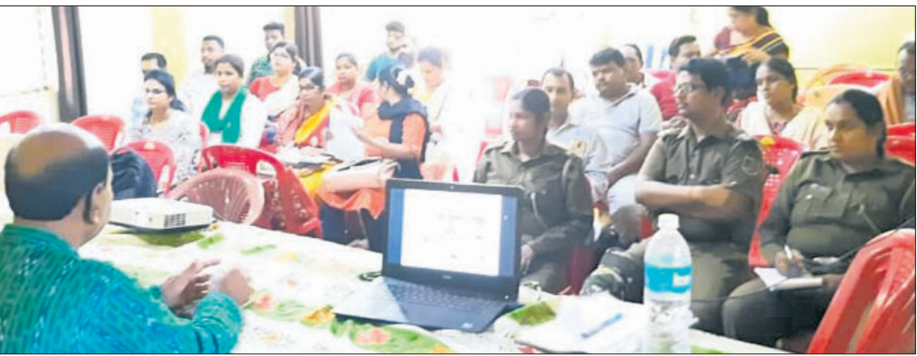
ଜଙ୍ଗଲ ଅଧିକାର ଶିରୋନାମା ବନ୍ଧନ ସମ୍ବନ୍ଧୀୟ ବୈଠକରେ ଉପସ୍ଥିତ ଅଧିକାରୀ।