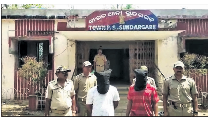
ସୁନ୍ଦରଗଡ଼ ସଦର ଥାନା ପୋଲିସ ଦ୍ଵାରା ଗିରଫ ଅଭିଯୁକ୍ତ।