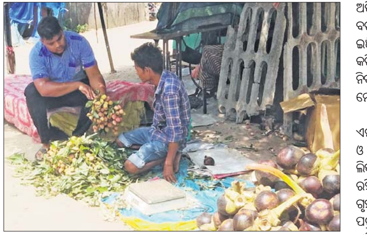
ବରଗଡ଼ ସହର ରାସ୍ତାପାର୍ଶ୍ଵରେ ଫଳ ପସରା ।

ବରଗଡ଼ ଅଫିସ୍, ୨୧।୫ ବରଗଡ଼ ଜିଲ୍ଲାରେ ତାତି ଅଧିକାରୀ ନାଁ ନେଉନାହିଁ । ଦିନକୁ ଦିନ ଏହା ବଢ଼ିଚାଲିଛି । ଶନିବାର ଜିଲ୍ଲାରେ ସର୍ବାଧିକ ତାପମାତ୍ରା ୪୩.୫ ଡିଗ୍ରୀ ରେକର୍ଡ କରାଯାଇଛି । ଏଥିଯୋଗୁ ଜନଜୀବନ ଅସୁବିଧା ସୃଷ୍ଟି ହୋଇପଡିଛି । ଘରୁ ପକାଇ ବାହାରିବା ପୁସ୍ତିକ ହୋଇପଡିଛି । ଏଭଳି ସମୟରେ ବାରମ୍ବାର ବିଦ୍ୟୁତ କାଟି ଜୀବନକୁ ଆହୁରି ଦହରାଞ୍ଜି କରିପାରେ । ତାତି ବୃଦ୍ଧି ଯୋଗୁ ଅଂଶୁଯାତ ଭୟ ମଧ୍ୟ ଦେଖାଯାଇଛି । ଏପ୍ରକା ମାସ ପରେ ଜିଲ୍ଲାରେ ତାପମାତ୍ରା ହ୍ରାସ ପାଇବାରେ ଲାଗିଥିଲା । ଏପ୍ରକା ୨୮ ଡିଗ୍ରୀରେ ଜିଲ୍ଲାରେ ତାପମାତ୍ରା ସର୍ବାଧିକ ୪୪.୪ ଡିଗ୍ରୀ ପାହାଚିଲି କରୁଥିବା ବେଳେ ମୃତଦେହ ଦେଖି ପୋଲିସକୁ ଖବର ଦେଇଥିଲେ । ଏସଂସ୍ଥାରେ କେତେ ଧରଣର ନେକ୍ରୋସିସ ପୋଲିସ ଟିମ୍ ଘଟଣାସ୍ଥଳକୁ ଯାଇ ମୃତଦେହକୁ ଜବତ କରିଥିଲେ । ମୃତଦେହ ବ୍ୟବଚ୍ଛେଦ ପାଇଁ ଉପଖଣ୍ଡ ଚିକିତ୍ସାଳୟକୁ ପଠାଯାଇଛି । ଏ ନେଇ ଏକ ଅପମୃତ୍ୟୁ ମାମଲା (ନଂ. ୨୨୨) ଗୁରୁ ହୋଇଛି ।