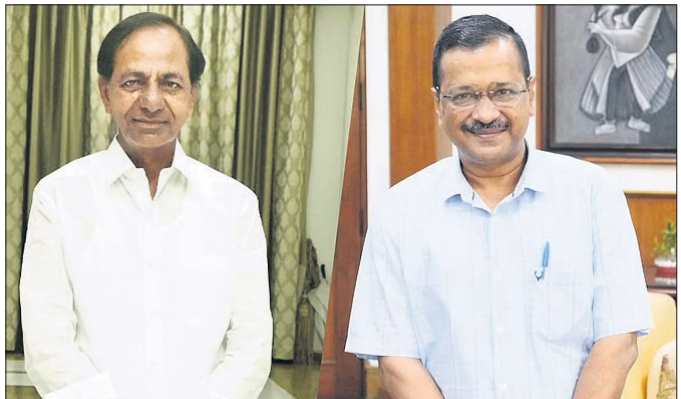
କେ. ଚନ୍ଦ୍ରଶେଖର ରାଓ