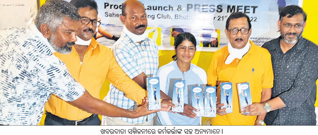
ଖବରଦାତା ସମ୍ମିଳନୀରେ କର୍ମକର୍ତାଙ୍କ ସହ ଅନ୍ୟମାନେ ।

ଏକ ଉପସଭାପତି ସମିତି ଗଠନ କରାଯାଇଛି। ଏହି ସମିତିର ଉଦ୍ଦେଶ୍ୟ ହେଉଛି ଉପସଭାପତି ସମିତି ଗଠନ କରାଯାଇଛି। ଏହି ସମିତିର ଉଦ୍ଦେଶ୍ୟ ହେଉଛି ଉପସଭାପତି ସମିତି ଗଠନ କରାଯାଇଛି।