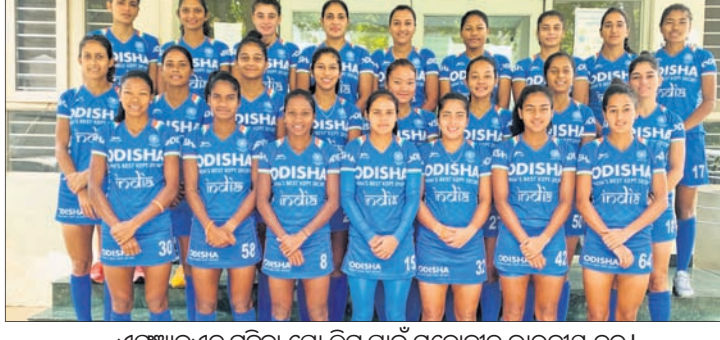
ଏପିଆଇଏସ୍ ମହିଳା ପ୍ରୋ ଲିଗ୍ ପାଇଁ ମନୋନୀତ ଭାରତୀୟ ଦଳ ।

ପ୍ୟାରିସ୍, ୨୧୫ (ଏସି) ଚଳିତ ବର୍ଷର ଓଡ଼ିଶା ଉପ ଅଧିନାୟିକା ପଦାଧିକାର ପାଇଁ ଓଡ଼ିଶା ଦଳ ମନୋନୀତ ହୋଇଛି। ଓଡ଼ିଶା ଦଳର ମୁଖ୍ୟ ଟ୍ରେନର ଶ୍ରୀ ରାମଚନ୍ଦ୍ର ମିଶ୍ର ଓ ବାଲିକା ଦଳର ମୁଖ୍ୟ ଟ୍ରେନର ଶ୍ରୀ ବିନୟ ମିଶ୍ରଙ୍କ ନେତୃତ୍ୱରେ ଏହି ଦଳ ଗଠନ କରାଯାଇଛି।