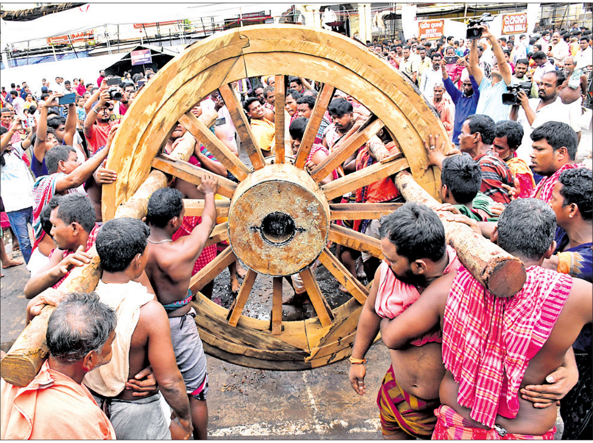
ମହାପ୍ରଭୁଙ୍କ ଭଉଁରୀ ଯାତ୍ରା ଅବସରରେ ରବିବାର ଭୋଇ ସେବକମାନେ ଚିନିଉପର ଅଖରେ ଚକ ସଂଯୋଗ କରୁଛନ୍ତି ।