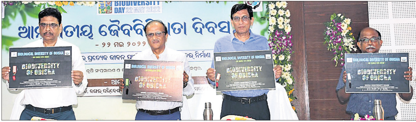
ଓଡ଼ିଶାର ଜୈବବିବିଧତା ସମ୍ପର୍କିତ ଏକ ପ୍ରାମାଣିକ ଚଳଚ୍ଚିତ୍ରକୁ ଅର୍ଥମାନେ ଉନ୍ମୋଚନ କରୁଛନ୍ତି।