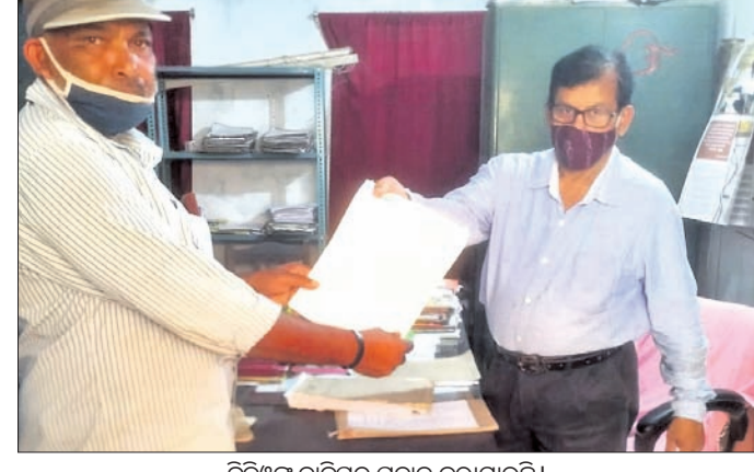
ବିଡ଼ିଓଙ୍କୁ ଦାବିପତ୍ର ପ୍ରଦାନ କରାଯାଇଛି।

ହୋଇଛି। ଗାଁ ଗହଳିର ଲୋକେ ଗାଡିଆ, ରୁଆ ନଦୀ, ପୋଖରୀର ଦୂଷିତ ପାଣି ପିଇ ଅନେକ ସମୟରେ ବିଭିନ୍ନ ରୋଗରେ ପଡୁଛନ୍ତି। କେତେକ ପଞ୍ଚାୟତରେ ବସୁଧା ଯୋଜନା ଫଳପ୍ରସ୍ତ ହୋଇଥିବା ବେଳେ କେତେକ ପଞ୍ଚାୟତରେ ତାହା ଫଳପ୍ରସ୍ତ ହୋଇନାହିଁ। ଗାଁ ଗାଁରେ ପାଇପ ଟ୍ୟାପ ଅଛି କିନ୍ତୁ ପାଣି ଆସୁନାହିଁ। ତେଣୁ ପିଇବା ପାଣି ସମସ୍ୟା ସମାଧାନ କରିବା ପାଇଁ ବିଡ଼ିଓଙ୍କୁ ଜାବିକା ସୁରକ୍ଷା ମଞ୍ଚ ତରଫରୁ ଅନୁରୋଧ କରାଯାଇଛି।