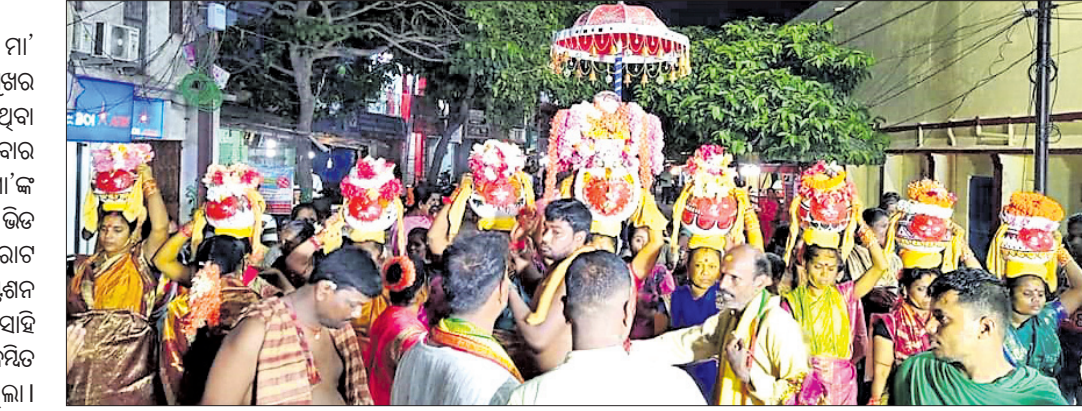
ବିରାଟ ପରୁଆରେ ମା'ଙ୍କ ଘଟ ସହର ପରିକ୍ରମା କରାଯାଇଛି।