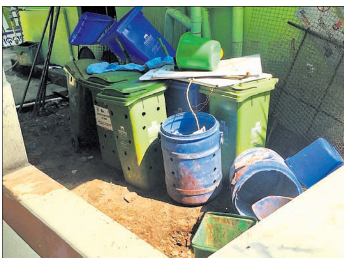
ବିଏମ୍‌ସି କାର୍ଯ୍ୟାଳୟରେ ପଡ଼ି ରହିଥିବା ତଷ୍ଟିଦିନ।

ବ୍ରହ୍ମପୁର ମହାନଗରକୁ ସ୍ୱଳ୍ପ ସର୍ବେକ୍ଷଣ ଦୌତରେ ପ୍ରଥମ ଘ୍ନାନକୁ ନେଇ ବିଏମ୍‌ସି ଆଶା ରଖିଛି। ବିଏମ୍‌ସି ପକ୍ଷରୁ ସ୍ୱଳ୍ପତାକୁ ନେଇ ଜନସାଧାରଣଙ୍କ ମତାମତ ସଂଗ୍ରହ ପ୍ରକ୍ରିୟା ମଧ୍ୟ ସରିଛି। କେବଳ ଫଳାଫଳକୁ ଅପେକ୍ଷା ରହିଛି। ଅନ୍ୟପଟେ ବିଏମ୍‌ସି ପକ୍ଷରୁ ସଫେଇ କର୍ମଚାରୀଙ୍କୁ ସୁରକ୍ଷା ସରଞ୍ଜାମ ସହ ଡ୍ରେନ ସଫେଇ ପାଇଁ ଆଧୁନିକ ଯନ୍ତ୍ରପାତି ଉପଲବ୍ଧି କରାଯାଇଛି। ସହରର ବିଶେଷ କରି ବ୍ୟବସାୟ ପ୍ରତିଷ୍ଠାନ ରୂପେ ପରିଣତ ପାଇଁ ଅଧିକ ଦୃଷ୍ଟି ଦିଆଯିବ। ଏଥିସହ ଅଳ୍ପ ଆର୍ଦ୍ରତା ଏଣେ ତେଣେ ନ ପକାଇ ଅଳ୍ପା ହୁଆ ଗାଡ଼ିରେ ପକାଇବା ସତ୍ତ୍ୱେତନ କରାଯାଉଛି। ଏଥିସହ ନିୟମ ଉଲ୍ଲଙ୍ଘନ କରୁଥିବା ବ୍ୟବସାୟୀଙ୍କ ନିକଟରୁ ଜୋରୀନା ଆଦାୟ ମଧ୍ୟ କରାଯାଉଛି। କିନ୍ତୁ ବିଏମ୍‌ସି ପକ୍ଷରୁ ସ୍ୱଳ୍ପ ସର୍ବେକ୍ଷଣ ମତାମତ ସଂଗ୍ରହ ସମୟରେ ସାମାଜିକ