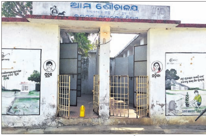
ଅବ୍ୟବସ୍ଥା ଭେତରେ ଥିବା ଆମ ଶୌଚାଳୟ ।

ବ୍ରହ୍ମପୁର ମହାନଗର ନିଗମ (ବିଏମ୍‌ସି) ଅନ୍ତର୍ଗତ ବିଭିନ୍ନ ଖର୍ଚ୍ଚରେ ସାହି ଓ ପୋଖରୀରୁ ତିନିସ୍ତ୍ରୁଣ୍ଡ ଲକ୍ଷ୍ୟରେ ବିଏମ୍‌ସି ପକ୍ଷରୁ ବିଭିନ୍ନ ଖର୍ଚ୍ଚରେ ଆମ ଶୌଚାଳୟ ନିର୍ମାଣ କରାଯାଇଛି। ଯେଉଁଠାରେ ଉଭୟ ପୁରୁଷ ଓ ମହିଳାଙ୍କ ନିମନ୍ତେ ପାଇଖାନା ବ୍ୟବସ୍ଥା ସହ ପାଣି ପୁରୁଣା ମଧ୍ୟ ରହିଛି। କିନ୍ତୁ ଏହି ଶୌଚାଳୟରୁ ପରିଷ୍କାର ପରିଚ୍ଛନ୍ନତା ରଖାଯାଉ ନ ଥିବାରୁ ଗ୍ଲାନାୟ ବାସିନ୍ଦା ଏହି ଶୌଚାଳୟ ବ୍ୟବହାର କରୁ ନ ଥିବା ଦେଖିବାକୁ ମିଳିଛି। ଫଳରେ ଲୋକେ ଗ୍ଲାନାୟ ପୋଖରୀ ଉପରେ ନିର୍ଜଳ କରିବାକୁ ପାଣି ଦୂଷିତ ହେଉଛି। ଏହା ଦେଖିବାକୁ ମିଳିଛି ବ୍ରହ୍ମପୁର ମହାନଗର ନିଗମ ୧୦ ନଂ. ଖର୍ଚ୍ଚ ଅନ୍ତର୍ଗତ ଆଇନା ବନ୍ଧସାହିରେ। ଏହି ସାହିରେ ଥିବା ରାଜୀବ ଆବାସ ଆପାର୍ଟମେଣ୍ଟ ନିକଟରେ ଆମ ଶୌଚାଳୟ ନିର୍ମାଣ କରାଯାଇଛି। ଯେଉଁଠାରେ ଉଭୟ ପୁରୁଷ ଓ ମହିଳାଙ୍କ ନିମନ୍ତେ ପାଇଖାନା ବ୍ୟବସ୍ଥା ରହିଛି। କିନ୍ତୁ ଏହାକୁ ସଫେଇ ହେଉ ନ ଥିବାରୁ ବର୍ତ୍ତମାନ ଏହା ଅବ୍ୟବସ୍ଥିତ ହୋଇଥିଲା। ପ୍ରଥମ ମ୍ୟାଟରେ ଶେଷ ସୁଦ୍ଧା ମତର୍ନ ସ୍ତ୍ରୀ କ୍ଲବ୍ ୧୩ ପଏଣ୍ଟ କରିଥିବା ବେଳେ ଏସ୍‌ଏସ୍ ପିକ୍‌ଉପ୍ ସ୍କୁଲ ମାତ୍ର ୨ ପଏଣ୍ଟରେ ସୀମିତ ରହିଥିଲା। ଏହି ମ୍ୟାଟରେ ମତର୍ନ ସ୍ତ୍ରୀ କ୍ଲବ୍ ୧୨ ପଏଣ୍ଟରେ ମ୍ୟାଟ ବିକୟା ହୋଇଥିଲା। ସେହିପରି ୧୭ ବର୍ଷରୁ କମ୍ ବାଳକ ବର୍ଗରେ ଅନୁଷ୍ଠିତ ଦ୍ୱିତୀୟ ମ୍ୟାଟ ଶେଷ ସୁଦ୍ଧା କେସି ପିକ୍‌ଉପ୍ ସ୍କୁଲ ୧୪ ପଏଣ୍ଟ କରିଥିବା ବେଳେ ବ୍ରହ୍ମପୁର ଜୁଡ଼ା ଛାତ୍ରାବାସ ଦଳ ୩୨ ପଏଣ୍ଟ କରିଥିଲେ। ଦ୍ୱିତୀୟ ମ୍ୟାଟରେ ଜୁଡ଼ା ଛାତ୍ରାବାସ ଦଳ ୮ ପଏଣ୍ଟରେ ବିକୟା ହୋଇଥିଲେ। ଶେଷ ମ୍ୟାଟ ସଂକଳ୍ପ ସ୍କୁଲ ଓ ବିକୟା ବ୍ରହ୍ମପୁର ଜୁଡ଼ା ଛାତ୍ରାବାସ ଟ୍ରଷ୍ଟ ମଧ୍ୟରେ ଅନୁଷ୍ଠିତ ହୋଇଥିଲା। ଶେଷ ମ୍ୟାଟରେ ସଂକଳ୍ପ ସ୍କୁଲ ଦଳ ମାତ୍ର ୨୦ ପଏଣ୍ଟରେ ସୀମିତ ରହିଥିବା ବେଳେ ବ୍ରହ୍ମପୁର ଜୁଡ଼ା ଛାତ୍ରାବାସ ଦଳ ୪୪ ପଏଣ୍ଟ କରିଥିଲେ। ଆମ ଶୌଚାଳୟ ଦଳ ଶେଷ ମ୍ୟାଟରେ ୨୨ ପଏଣ୍ଟରେ ବିକୟା ହୋଇଛନ୍ତି।