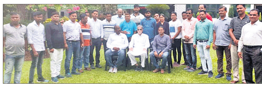
ରାଜ୍ୟ ଫେନ୍‌ସିଂ ଆସୋସିଏସନର ପ୍ରସ୍ତୁତି ବୈଠକ।

ଭୁବନେଶ୍ୱର, ୨୨।୫ (ସ୍ପୋର୍ଟ୍ସ୍ ଟ୍ୟୁବୋ) ୩୦ତମ ଜାତୀୟ ଭୂମିୟର ଫେନ୍‌ସିଂ ପ୍ରତିଯୋଗିତା କଟକସ୍ଥିତ ଜବାହରଲାଲ ନେହେରୁ ସ୍ମୃତିୟମରେ ଛୁନ୍ ୧୭ରୁ ୨୦ ପର୍ଯ୍ୟନ୍ତ ଅନୁଷ୍ଠିତ ହେବ। ଏହି ପରିପ୍ରେକ୍ଷାରେ କଟକସ୍ଥିତ ଭୂମିୟର କ୍ଲବଠାରେ ରାଜ୍ୟ ଫେନ୍‌ସିଂ ଆସୋସିଏସନର ଏକ ପ୍ରସ୍ତୁତି ବୈଠକ ଅନୁଷ୍ଠିତ ହୋଇଯାଇଛି। ପୁରୁବଲ ମନୁା ତଥା ଆସୋସିଏସନର ସଭାପତି ଅନଜ