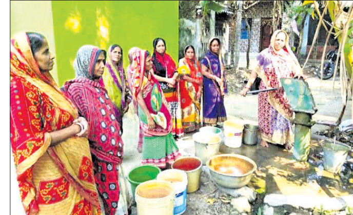
ନଳକୂପ ପାଖରେ ଭିଡ଼ ଲାଗିଛି ।

ଭଦ୍ରକ ଜିଲାର ପ୍ରସିଦ୍ଧ ଶୈବପୀଠ ଆରଡ଼ି ଓ ଏହାର ଆଖପାଖ ଅଞ୍ଚଳରେ ବାରମ୍ବାର ବିଦ୍ୟୁତ୍‌କାଟ ହେଉଥିବାରୁ ଲୋକେ ଅସତ୍ୟୋଷ ରହିଛନ୍ତି । ଗତ ଶନିବାର ରାତି ୯ଟାରୁ ବିଦ୍ୟୁତ୍‌କାଟ ହୋଇଥିଲେ ମଧ୍ୟ ରବିବାର ସନ୍ଧ୍ୟା ପର୍ଯ୍ୟନ୍ତ ସ୍ୱାଭାବିକ ହୋଇପାରିନି । ଫଳରେ ଲୋକମାନେ ନାହିଁ ନ ଥିବା ଅସୁବିଧାର ସମ୍ମୁଖୀନ ହୋଇଛନ୍ତି । ବିଦ୍ୟୁତ୍ ବିଭାଗର ଖାମଖିଆଳି ଓ ଅସହଯୋଗ ମନୋଭାବ ଯୋଗୁ ଏକଲି ପରିସ୍ଥିତି ସୃଷ୍ଟି ହୋଇଥିବା ଅଭିଯୋଗ ହୋଇଛି । ସୁନା ଅନୁସାରେ ଚାନ୍ଦବାଳିଠାରେ ହେବାକୁ ଥିବା ମେଗା ପ୍ରକଳ୍ପ ନିର୍ମାଣ କାର୍ଯ୍ୟ ଚାଲୁଥିବାରୁ ସ୍ଥାନୀୟ ଅଞ୍ଚଳରେ ପ୍ରାୟ ୪୫୫ ହେକ୍ଟର ନୂତନ ନଳକୂପ ଖନନ କରାଯାଇନାହିଁ । ଗାଁଗୁଡିକରେ କାଁ ଭାଁ କେତୋଟି ପୁରୁଣା ନଳକୂପ