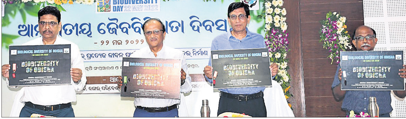
ଓଡ଼ିଶାର ଜୈବବିବିଧତା ସମ୍ପର୍କିତ ଏକ ପ୍ରାମାଣିକ ଚଳଚ୍ଚିତ୍ରକୁ ଅର୍ଥମାନେ ଉନ୍ମୋଚନ କରୁଛନ୍ତି ।