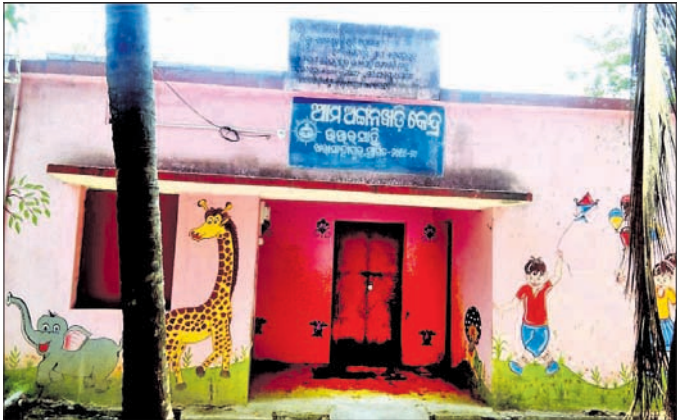
ଅଜନପ୍ରାଣିର ନୂତନ ଗୃହ ।

ଅଜନପ୍ରାଣି କେନ୍ଦ୍ରର ନୂତନ ଗୃହ ନିର୍ମାଣକୁ ୨୨ର୍ଷ ପୂରିଲାଣି । ହେଲେ ହସ୍ତାନ୍ତର ହୋଇ ନ ଥିବାରୁ ଏବେ ବି ଛୋଟ ଛୋଟ ପିଲାମାନେ ସେହି ନୂତନ ଘରେ ନ ପଢି ଅଜନପ୍ରାଣି କର୍ମୀଙ୍କ ବାରଣ୍ଡାରେ ବସି ପଢୁଛନ୍ତି । ଏକଲି ଚିତ୍ର ଦେଖିବାକୁ ମିଳିଛି ବାଲେଶ୍ୱର ଜିଲ୍ଲା ବାହାନଗା ବ୍ଲକ୍ ଖରାସାହାର ଗ୍ରାମର ୫ନମ୍ବର ଓଡ଼ି ଖପରପଦା ଗ୍ରାମରେ । ଏହି ଗ୍ରାମରେ ରାଜ୍ୟ ସରକାର ଏକ ଆଦର୍ଶ ଅଜନପ୍ରାଣି କେନ୍ଦ୍ର ନୂତନ ଗୃହ ନିର୍ମାଣ ପାଇଁ ୬ଲକ୍ଷ ୯୩ହଜାର କଲିଥିଲେ । ଘର କାମ ୨୦୨୦ରେ ଆରମ୍ଭ ହୋଇ ସେହିବର୍ଷ ସରିଥିଲେ ମଧ୍ୟ ଏପର୍ଯ୍ୟନ୍ତ ସେହି ନୂତନ ଘର ଭିତରେ ପିଲାମାନେ ପାଠ ପଢିବାର ପାଇପାରିନାହାନ୍ତି । ଘର ଘାଟିରେ ପଡିଯାଇଛି କେବଳ ୨୨ର୍ଷ ବିତିଯାଇଥିଲେ ମଧ୍ୟ ନରୀ ତାଲା ଖୋଲୁନାହିଁ । କାନ୍ଧରେ ବିଜିନ ରଙ୍ଗବେରଙ୍ଗ ଚିତ୍ର ଅଙ୍କାଯାଇଥିଲା । ତାହା ଏବେ