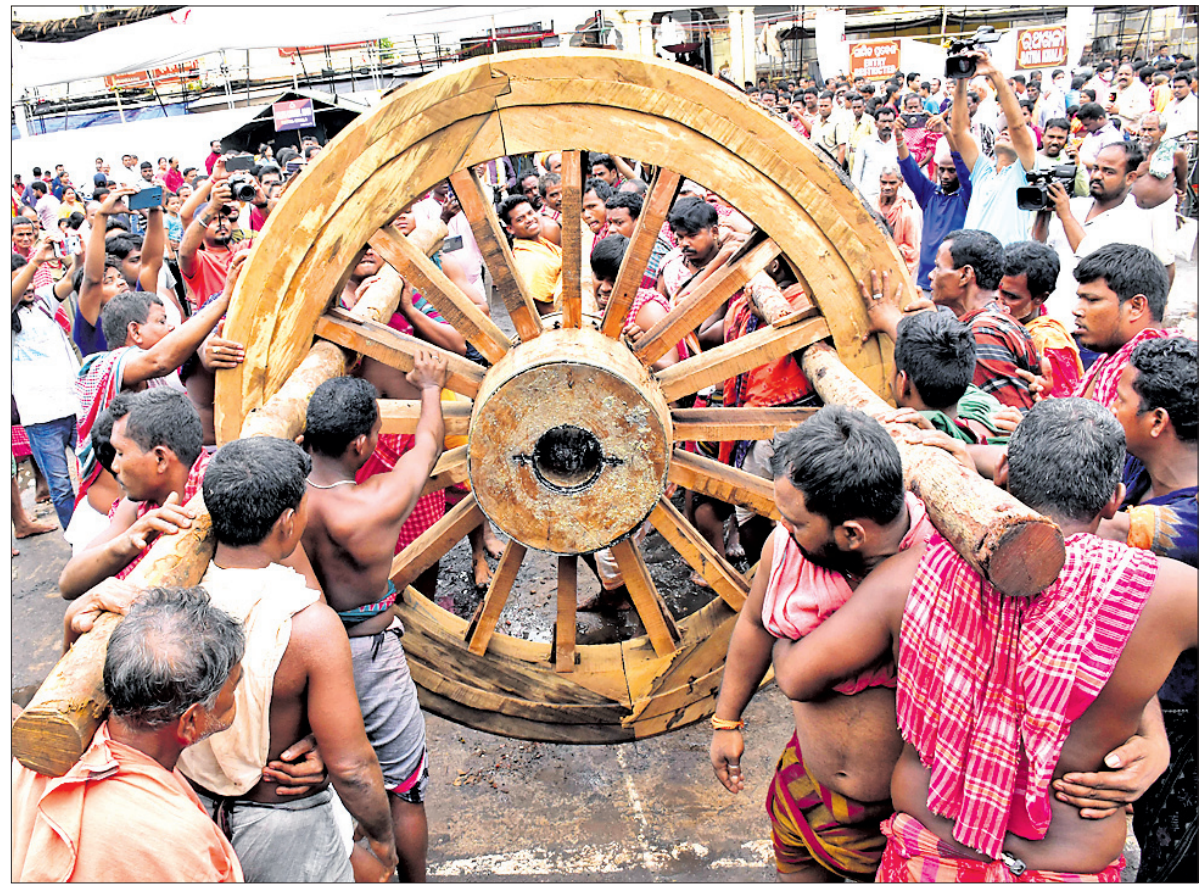
ମହାପ୍ରଭୁଙ୍କ ଭଉଁରୀ ଯାତ୍ରା ଅବସରରେ ରବିବାର ଭୋଇ ସେବକମାନେ ଚିନିଉପର ଅଖରେ ଚକ ସଂଯୋଗ କରୁଛନ୍ତି ।