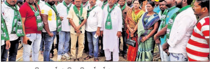
ପ୍ରଚାରରେ ସାମିଲ ପ୍ରାଥୀ ଓ ବିଜେଡି କର୍ମଚାରୀ ।