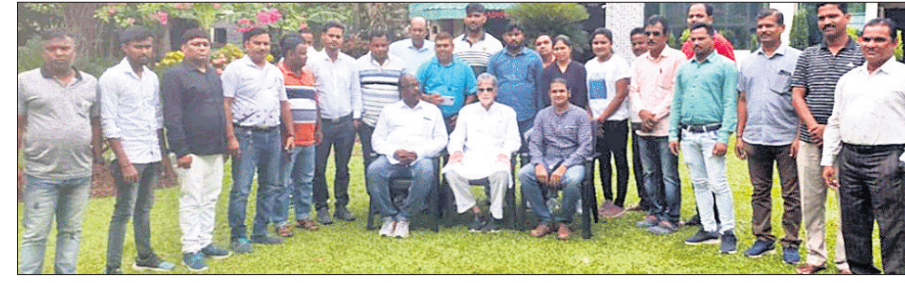
ରାଜ୍ୟ ଫେନ୍‌ସିଂ ଆସୋସିଏସନର ପ୍ରସ୍ତୁତି ବୈଠକ।