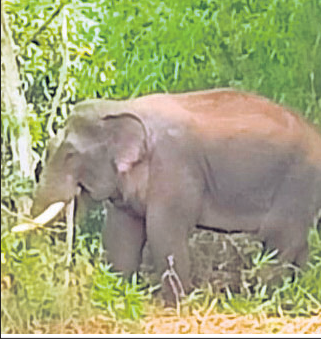
ସାକନ୍ଦା କୂଳରେ ଥିବା ଦନ୍ତା ହାତୀ।

ନଦୀ କୂଳ ଆସନ୍ତାରେ ରହିଥିବା ସ୍ଥାନୀୟ ଲୋକେ ଦେଖିବାକୁ ପାଇଥିଲେ। ଏହି ଖବର ଜାଣିବା ପରେ ସ୍ଥାନୀୟ ଅଞ୍ଚଳରେ ଭୟର ବାତାବରଣ ସୃଷ୍ଟି ହୋଇଥିବା ବେଳେ ବନ ବିଭାଗ ପକ୍ଷରୁ ତାକବଳି ଯନ୍ତ୍ର ଦ୍ୱାରା ଲୋକମାନଙ୍କୁ ସତରତ ନ ହେବାକୁ କୁହାଯାଇଛି। ସୂଚନାଯୋଗ୍ୟ, କେନ୍ଦ୍ରରେ ଜିଲ୍ଲା ହସବତ ହସ୍ତୀ ଅଭୟାରଣ୍ୟକୁ ହାତୀଟି ଖାଦ୍ୟ ଅବେଶରେ ଆସି ଏହି ଅଞ୍ଚଳରେ ବ୍ୟାପକ ଫସଲ ନଷ୍ଟ