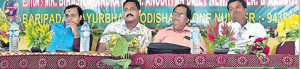
ଆଲୋଚନା ଚକ୍ରରେ ଉପସ୍ଥିତ ଅତିଥିମାନେ ।

କୌଣସି ନିର୍ଦ୍ଦେଶନାମା ଠିକ୍ ଭାବେ ପାଳନ କରାଯାଇନାହିଁ । ଶିବବିବାହ ପ୍ରସ୍ତୁତ ବୈଠକରେ ପ୍ରଭୁଙ୍କ ଲକ୍ଷୋତ୍ସବ ଓ ବିବାହ ଉତ୍ସବ ୨୪ ଘଣ୍ଟା ବିଦ୍ୟୁତ୍ ସେବା ଯୋଗାଇ ଦିଆଯିବା ଉପରେ ଜିଲା ପ୍ରଶାସନ ଗୁରୁତ୍ୱ ଦେଇଥିଲେ । ହେଲେ ଗତ ସୋମବାର ପାଠରେ ଅନୁଷ୍ଠିତ ବାବାମଣିଙ୍କ ଲକ୍ଷ୍ମ ମହୋତ୍ସବରେ ମଧ୍ୟ ବିଦ୍ୟୁତ୍ ବିଭାଗ ଦେଖିବାକୁ ମିଳିଥିଲା । ବିଦ୍ୟୁତ୍ ବିଭାଗ ଯୋଗୁ କେବଳ ପାନୀୟ ଜଳ ନୁହେଁ ଲକ୍ଷ୍ମରେନେତ ସେବା ମଧ୍ୟ ବାଧାପ୍ରାପ୍ତ ହୋଇଛି । ବିଦ୍ୟୁତ୍ ସେବା ଯୋଗାଇ ବନ୍ଦ ଥିବା ବେଳେ ବିଭାଗୀୟ ଅଧିକାରୀ ଓ କର୍ମଚାରୀଙ୍କ ମୋବାଇଲ୍ ଫୋନ୍ ସୁଇଚ୍‌ଅପ୍ ରଖିଥିବାରୁ ବିଦ୍ୟୁତ୍ ଗ୍ରାହକମାନେ ଅସତ୍ୟୋଷ ବ୍ୟକ୍ତ କରିଛନ୍ତି । ଯଦି ବାରମ୍ବାର ଏହିଭଳି ବିଦ୍ୟୁତ୍ କାଟ କରାଯାଏ ତେବେ ପ୍ରତିମାସ ପୈଠ କରାଯାଉଥିବା ବିଲ୍ ଆଉ ଦେବେନାହିଁ ବୋଲି ଗ୍ରାହକମାନେ ଚେତାବନୀ ଦେଇଛନ୍ତି ।