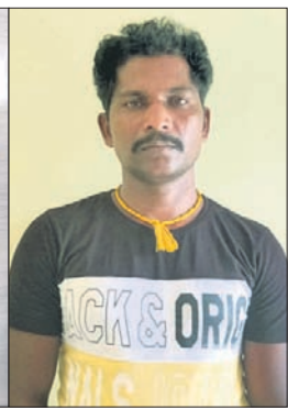
ଜବତ ବାଘଛାଲ। ଗିରଫ ଶିକାରୀ ଜଣକ।

ରୁଣ୍ଡପୁର ବନ ବିଭାଗକୁ ଜଣାଇଥିଲା। ପରେ ବନ ବିଭାଗ ଓ ଏସ୍‌ଏଫ୍‌ଏସ୍ ଏକ ମିଳିତ ଏକ ମାମଲା ରୁଚ୍ଛୁ କରାଯାଇ ସୋମବାର ଅଭିଯୁକ୍ତଙ୍କୁ କୋର୍ଟ ଚାଲାଣ କରାଯାଇଛି।