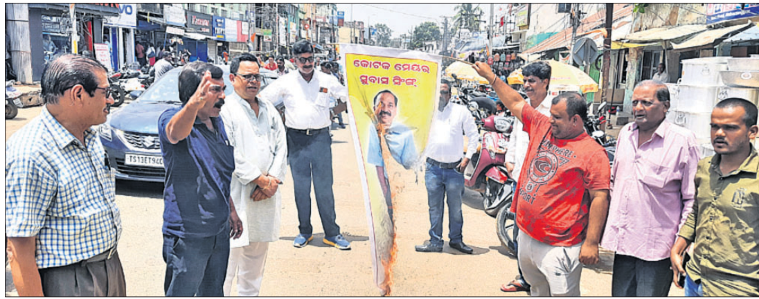
କଟକ ମେୟରଙ୍କ ପୋଷ୍ଟର ପୋଡ଼ି ହେଉଛି ଏକ ସାମାଜିକ ସେବା କାର୍ଯ୍ୟକ୍ରମର ଅଂଶ।

ମହଙ୍ଗା ପଢ଼ିଲା 'ମାଲକାନଗିରି ପଠେଇଦେବି' ପତ୍ରରୁ କଟକ ମେୟରଙ୍କ ପୋଷ୍ଟର ପୋଡ଼ି