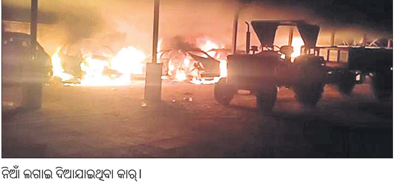
ନିଆଁ ଲଗାଇ ଦିଆଯାଇଥିବା କାର୍