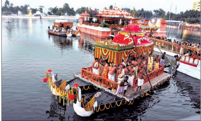
ନରେନ୍ଦ୍ର ପୁଷ୍କରିଣୀରେ ମହାପ୍ରଭୁଙ୍କ ଚଳନ୍ତି ପ୍ରତିମା ଚାପ ଖେଳୁଛନ୍ତି ।

କରାଯାଇଥିଲା। ସେଠାରେ ମଲଲମ ଆଦି ନୀତି ସମ୍ପାଦନା କରାଯାଇ ଠାକୁରଙ୍କ ବେଶ ଅନୁଷ୍ଠିତ ହୋଇ ଭୋଗ ମନୋହାରୀ ଓ ଆକର୍ଷଣୀୟ ହୋଇଥିଲା। ସମସ୍ତ ନୀତି ସମ୍ପନ୍ନ ପରେ ଠାକୁରମାନେ ଶ୍ରୀମନ୍ଦିରକୁ ବାହୁଡ଼ା ବିଜେ କରିଥିଲେ। ତେବେ ହଳଦୀ ପାଣି ନୀତି ମହାପ୍ରଭୁଙ୍କ ରାତ୍ରି ଚାପ ହୋଇ ନ ଥାଏ। କେବଳ ଦିନ ଚାପ ଅନୁଷ୍ଠିତ ହୋଇଥାଏ।