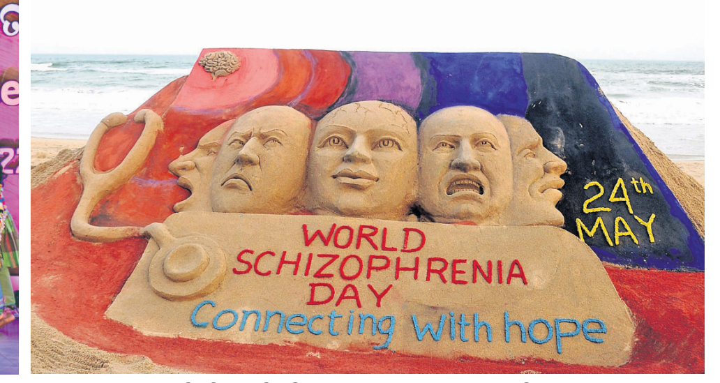
ବିଶ୍ୱ ସିକୋପ୍ରେନିଆ ଦିବସ ଉପଲକ୍ଷେ ସାମ୍ବଲପୁରରେ ପୁରୀ ବେଳାଭୂମିରେ ଶିଳ୍ପୀ ମାନସ କୁମାର ସାହୁଙ୍କ ବାଲୁକା କଳା।