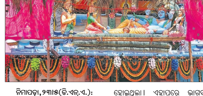
ନିମାପଡ଼ା, ୨୩୫ (ଡି.ଏନ୍.ଏ.):

ହୋଇଥିଲା। ଏହାପରେ ଭାଗବତ, ନାମ ସଂକୀର୍ତ୍ତନ କରାଯାଇଥିଲା। ଏହି ଅବସରରେ ମନ୍ଦିର ସମ୍ମୁଖରେ ବିଭିନ୍ନ ସାଂସ୍କୃତିକ କାର୍ଯ୍ୟକ୍ରମ କରାଯାଇଥିଲା। ଯାତ୍ରା ସୋମବାର ବହୁ ଆଡ଼ମ୍ବରରେ ପାଳନ କରିବା ପାଇଁ ନୀଳାଚଳ ସାରସ୍ୱତ ପାଳନ କରାଯିବ। ଏଥିପାଇଁ ମହୋତ୍ସବରୁ କଳ୍ପ ଶୋଭାଯାତ୍ରା, କୃତ୍ତିର ପରିସରକୁ ବ୍ରହ୍ମକୋପିତ ରଥ ବାହାରିବା ସମେତ ବିଭିନ୍ନ କାର୍ଯ୍ୟକ୍ରମ ଆୟୋଜନ ହେବ। ବ୍ରହ୍ମକୋପିତ ରଥ ବାହାରିବା ପରିକ୍ରମା କରି ଆସାମ କୋକିଳାମୁଖ ଆଶ୍ରମକୁ ଯିବ। ସେଠାରେ କିଛି ଦିନ ବିଶ୍ରାମ ପରେ କୋପିତ ପୁନର୍ବାର ବିଭିନ୍ନ ଗ୍ରାମ ଗ୍ରାମକୁ କୃତ୍ତିରକୁ ପ୍ରତ୍ୟାବର୍ତ୍ତନ କରିବ। ଉଲ୍ଲେଖଯୋଗ୍ୟ, ଠାକୁର ମହାରାଜଙ୍କ ଜନ୍ମ ୧୨୬୭ ସାଲ ବା ୧୮୨୯ ମସିହା ଝୁଲଣ ପୂର୍ଣ୍ଣିମା ଦିନ ବଙ୍ଗ ପ୍ରଦେଶର ନଦିଆ ଜିଲ୍ଲାରେ ହୋଇଥିଲା। ସେ ଅଳ୍ପ ବୟସରେ ତନ୍ତ୍ର, ଜ୍ଞାନ, ଯୋଗ ଓ ପ୍ରେମ ଏହି ଚତୁର୍ବିଧ ସାଧନରେ ସିଦ୍ଧି ଲାଭ କରିଥିଲେ। ଭଗବାନ ଶଙ୍କରାଚାର୍ଯ୍ୟଙ୍କ ମତ ଓ ଗୌରାଙ୍ଗ ଦେବଙ୍କ ପଥ ହିଁ ଥିଲା ତାଙ୍କର ଆଦର୍ଶ। ଜନଶରଣୀ ପୁତ୍ରିର ମାର୍ଗ ପ୍ରଦର୍ଶନ କରିବା ଉଦ୍ଦେଶ୍ୟରେ ପ୍ରଥମେ ଆସାମର କୋକିଳାମୁଖରେ ଆସାମ ବଙ୍ଗୀୟ ସାରସ୍ୱତ ମଠ ପ୍ରତିଷ୍ଠା କରିଥିଲେ। ତାଙ୍କ ଭାବଧାରାର ପ୍ରଚାର ପ୍ରସାର ପାଇଁ ବଙ୍ଗପ୍ରଦେଶରେ ୪ଟି ବିଭାଗୀୟ ଆଶ୍ରମ ପ୍ରତିଷ୍ଠା କରିଥିଲେ। ପରେ ଜଗନ୍ନାଥ ଧାମ ଅଭିମୁଖେ ଆସିଥିଲେ। ୧୯୩୪ରେ ଜଗନ୍ନାଥକୁ ପ୍ରେରଣାରେ ନୀଳାଚଳ ସାରସ୍ୱତ ସଂଘ ଗଠନ କରି ସଭାପତି ରହିଥିଲେ। ୧୯୩୫ ନଭେମ୍ବରରେ ଶ୍ରୀଶ୍ରୀ ଠାକୁର ମହାସାମାଧି ଗ୍ରହଣ କରିଥିଲେ।