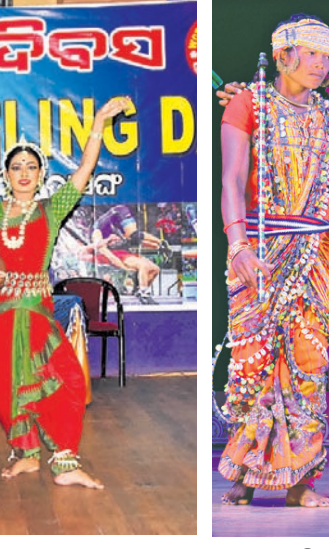
ପୁରୀ କୁସୁ ସଂଘ ପକ୍ଷରୁ ସାମ୍ବଲପୁରରେ କୁସୁ ଦିବସ ପାଳନ ଅବସରରେ ପରିବେଷିତ ସାଂସ୍କୃତିକ କାର୍ଯ୍ୟକ୍ରମ।