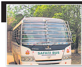
ବାରଙ୍ଗ, ୨୩।୫ (ଡି.ଏନ୍.ଏ.)