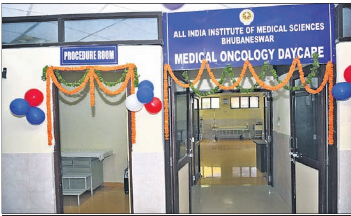
ଆଲଗା ହୋଇ ମେଡିକାଲ ଅନୁକୋଳନ ଯୁନିଟ୍ ସ୍ୱତନ୍ତ୍ର ମିଳିବ ଡେ' କେୟାର, ମଙ୍ଗଳବାର ଓ ଗୁରୁବାର ଓପିଡି ସେବା ଆରମ୍ଭ ହେବ ମେଡିକାଲ ଅନୁକୋଳନରେ ଡିଏମ୍ ପାଠ୍ୟକ୍ରମ