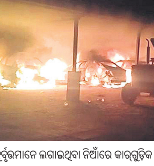
ଦୁର୍ଭୂତମାନେ ଲଗାଇଥିବା ନିଆଁରେ କାରଗୁଡ଼ିକ କନିଷ୍ଠାଭୁକ୍ତ।

ପାରଳାଖେମୁଣ୍ଡି, ୨୩୩୫(ଡି.ଏନ୍.ଏ.): ରକ୍ତପତି ଜିଲ୍ଲା ପାରଳାଖେମୁଣ୍ଡି ଚାଉଳ ହଲ୍ ପାର୍କିଂରେ ଥିବା ୬ଟି କାରକୁ ରବିବାର ବିଳମ୍ବିତ ରାତିରେ ଦୁର୍ଭୂତମାନେ ପୋଡ଼ିଦେଇଛନ୍ତି। ପ୍ରଥମ ଥର ପାଇଁ ଏଭଳି ଘଟଣା ପାରଳାଖେମୁଣ୍ଡି ସହରରେ ଦେଖିବାକୁ ମିଳିଛି। ରାତି ପ୍ରାୟ ସାଢ଼େ ୧୨ଟିରେ ଚାଉଳ ହଲ୍ ପରିସରରେ ଥିବା ସରକାରୀ ପାର୍କିଂରେ ବେସରକାରୀ ଗାଡ଼ିରେ ହଠାତ୍ ନିଆଁ ଲାଗିଥିବା ସ୍ଥାନୀୟ ଲୋକେ ଦେଖି ଅଶ୍ରୁମୟ ବିଭୀତ ଓ ପୋଲିସକୁ ଖବର ଦେଇଥିଲେ। ପୋଲିସ ଓ ଅଶ୍ରୁମୟ ବିଭୀତ କର୍ମଚାରୀ ପହଞ୍ଚି ନିଆଁ ଲିଭାଇବା ସହ ପୋଲିସ ଘଟଣାସ୍ଥଳରେ ଆରମ୍ଭ କରିଛନ୍ତି। ଦୀର୍ଘ ବର୍ଷ ଧରି ପୌରପାଳିକାର ପାର୍କିଂ ସେକ୍ଟରେ ଘରୋଇ କାର୍ ରହୁଥିଲେ ମଧ୍ୟ ପୌରପାଳିକାର ଗାଡ଼ି ବାହାରେ ରଖାଯାଇଲେ ମଧ୍ୟ ଏଥିପ୍ରତି କାହାର ନଜର ପଡ଼ୁ ନ ଥିଲା। ବେଆଇନ ପାର୍କିଂକୁ ପୌରପାଳିକା ନିର୍ବାହୀ ଅଧିକାରୀ ଓ ଗାଡ଼ି ମାଲିକ ସ୍ୱୀକାର କରୁଥିବା ବେଳେ