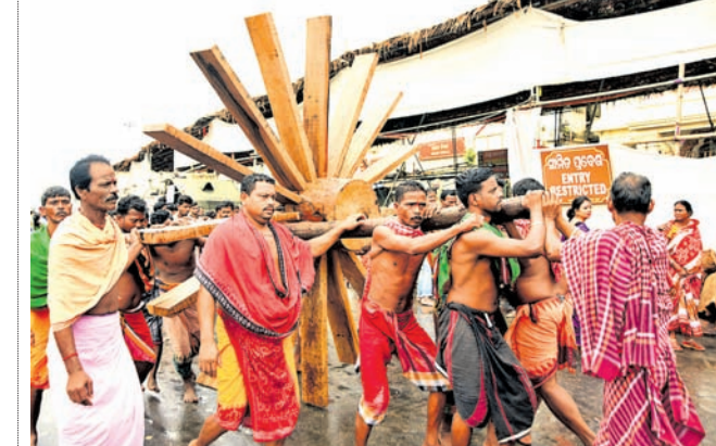
ପୁରୀ ଅଫିସ, ୨୩୫:

ଭଉଁରୀ ଯାତ୍ରା ଅବସରରେ ତିନି ରଥର ଚକ ତରା ନୀତି ପରେ ରଥ ନିର୍ମାଣ ଆଉ ଏକ ପର୍ଯ୍ୟାୟ ଆରମ୍ଭ ହୋଇଛି। ରଥ ନିର୍ମାଣରେ କାରିଗର ଓ ସେବକମାନେ ଲାଗିପଡ଼ିଛନ୍ତି। ସୋମବାର ପୁଣି ତିନିରଥ ମୋଟ ୪୨ଟି ଚକରୁ ୨୪ଟି ଚକ ନିର୍ମାଣ ସରିଛି। ସେହିପରି ପ୍ରଥମ ଭୂଇଁ ପାଇଁ ୪ଟି ଭୂଇଁ ଚକର ଚକପଟ ଶେଷ ହୋଇଛି। ଦ୍ୱିତୀୟ ଭୂଇଁ ପାଇଁ ଆରମ୍ଭ ହୋଇଥିବା ଦୁଇଟି ଲେଖାଏ ଭୂଇଁଚକର ଓ ଦୁଇଟି ଲେଖାଏ ପୁହାଁ ଚକପଟ ସରିଛି। ତାଳଧୁଳ ରଥର ୮ଟି ଚକ ନିର୍ମାଣ ଶେଷ ହୋଇଛି। ଏଥିସହ ୯ ନୟର ଚକର ପଲ କଳସା, ପଦାରୀ ଗାଡ଼ ଚାଲିବା ସହ ୧୦ଟି ଚକ ଚକ୍ଷୁରେ ଅର ସଂଯୋଗ ହୋଇ ଅର କଟି ଚାଲୁଛି। ଏହାପରେ ଦଶମ ଚକର ପଲ ସଂଯୋଗ ହୋଇ ପଲ କଳସା ହେବ। ଦ୍ୱିତୀୟ ଭୂଇଁ ଲାଗି ଦୁଇଟି ଭୂଇଁଚକର ଓ ଦୁଇଟି ପୁହାଁ ଚକ ଚକପଟ ଶେଷ ହୋଇଛି। ଦେବଦଳନ ରଥର ୬ଟି ଚକ ନିର୍ମାଣ ସରି ଅଷ୍ଟମ ଚକର ପଲ କଳସା ହେଉଛି। ନବମ ଚକ୍ଷୁରେ ସଂଯୋଗ ହୋଇଥିବା ଅର କଟା ପରେ ବଳା ଓ ପଦାରୀ ବସି ପଦାରୀ ଗାଡ଼ ଖୋଦେଇ ଶେଷ ପର୍ଯ୍ୟାୟରେ ପହଞ୍ଚିଛି। ଦୁଇଟି ପୁହାଁ ଚକପଟ ଶେଷ ପରେ ଏକ ନିରାଡ଼ି ଚକପଟ କାମ ଶେଷ ପର୍ଯ୍ୟାୟରେ ପହଞ୍ଚିଛି। ନନ୍ଦିଘୋଷ ରଥର ୯ଟି ଚକ ନିର୍ମାଣ ସହ ୧୦ଟି ଚକର ପଲ ପିଞ୍ଜା କାର୍ଯ୍ୟ ସରିଛି। ଦ୍ୱିତୀୟ ଭୂଇଁ ଲାଗି ଚକପଟ ହେଉଥିବା ଏକ ଭୂଇଁ ଚକର ଚକପଟ ଶେଷ ହେବା ସହ ଦୁଇଟି ପୁହାଁ ଚକପଟ ଶେଷ ହୋଇଛି। ରଥକାର ସେବକମାନେ ତିନିରଥର ଚାଖୁଣ୍ଟୁରେ ସିଂହ ବିରାଜ ରୂପ ଖୋଦେଇ ଭାରି ରଖୁଛନ୍ତି। ଅପରପକ୍ଷରେ ବୋଲିବେଦିରୁ ଅୟୋଧ୍ୟା କମାରଶାଳରେ କମାର ସେବକମାନେ ବଳା ନିର୍ମାଣ ଏବଂ ସର୍ବପୂର୍ଣ୍ଣ ଦଶାଳକ୍ଷ୍ୟ ନିର୍ମାଣରେ ବ୍ୟସ୍ତ ରହିଛନ୍ତି।