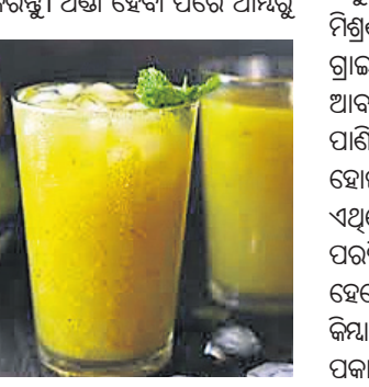
ଗୋପାଳୁ କାଢ଼ି ତା' ରସ ବାହାର କରିଦିଅନ୍ତୁ। ଏବେ ଏହି କଞ୍ଚା ଆୟ ରସରେ ପୁନିନାପତ୍ରକୁ କାଟି ପକାନ୍ତୁ। ଏହାପରେ ସେଥିରେ ଗୁଡ଼ କିମ୍ବା ଚିନି, ଜିରାଗୁଣ୍ଡ, ସୈନ୍ଧବ ଲୁଣ, ଗୋଲମରିଚ ଓ ସାଦ ଅନୁସାରେ ଲୁଣ ପକାନ୍ତୁ। ଏହି ମିଶ୍ରଣକୁ ଏବେ ଭଲଭାବେ ଗ୍ରାଜିଙ୍ଗ୍ କରି ଦିଅନ୍ତୁ। ଆବଶ୍ୟକ ଅନୁସାରେ ଏଥିରେ ପାଣି ମିଶାନ୍ତୁ। ଏବେ ପ୍ରସ୍ତୁତ ହୋଇଗଲା ଆୟପଣା। ଏଥିରେ ବରଫ ଖଣ୍ଡ ପକାଇ ପରଷିଦିଅନ୍ତୁ। ଆବଶ୍ୟକ ହେଲେ ଏଥିରେ ଅଧିକ ଚିନି କିମ୍ବା ଲୁଣ ଅବା ଜିରାଗୁଣ୍ଡ ପକାନ୍ତୁ।

ଆବଶ୍ୟକ ସାମଗ୍ରୀ: କଞ୍ଚା ଆୟ- ୪ଟି, ଜିରା ଗୁଣ୍ଡ- ୨ ଚାମଚ (ଭଜା), ଗୁଡ଼ କିମ୍ବା ଚିନି- ୬ ବଡ଼ ଚାମଚ, ସୈନ୍ଧବ ଲୁଣ- ୩ ଚାମଚ, ପୁନିନାପତ୍ର- ୧ ବଡ଼ ଚାମଚ, ଗୋଲମରିଚ ଗୁଣ୍ଡ- ୧ ଚାମଚ, ଲୁଣ- ସାଦ ଅନୁସାରେ। ପ୍ରସ୍ତୁତି ପ୍ରଣାଳୀ: ପ୍ରଥମେ ଆୟକୁ ଭଲଭାବେ ଧୋଇ ପ୍ରେସର କୁକରରେ ସିଝାଇ ଦିଅନ୍ତୁ। କୁକରରେ ୩-୪ଟି ସିଟି ଆସିବା ପରେ ଗ୍ୟାସ୍ ବନ୍ଦକରି କିଛି ସମୟ ଛାଡ଼ି ଦିଅନ୍ତୁ। ପ୍ରେସର ଖୋଲି ଆୟ ଅଧା ହେବା ପର୍ଯ୍ୟନ୍ତ ଅପେକ୍ଷା କରନ୍ତୁ। ଅଧା ହେବା ପରେ ଆୟକୁ