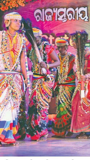
ଅନୁସୂଚିତ ଜନଜାତି ଓ ଅନୁସୂଚିତ ଜାତି ଉତ୍ତମ ବିଭାଗ ପକ୍ଷରୁ ସାମ୍ବଲପୁରରେ ଉଦ୍‌ଘାଟନ ହେଉଥିବା 'ରାଜ୍ୟସ୍ତରୀୟ ଆଦିମ ଜନଜାତି ନୃତ୍ୟ ମହୋତ୍ସବ'ରେ ଆଦିମ ଜନଜାତି ନୃତ୍ୟ ପରିବେଷଣ କରୁଛନ୍ତି।