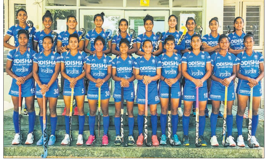
ଭାରତୀୟ ଜୁନିୟର ମହିଳା ହକି ଦଳ।