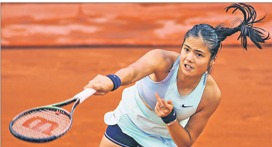
ଫ୍ରେଞ୍ଚ ଓପନ ଗ୍ରାଣ୍ଡସ୍ଲାମ ଟେନିସ ମହିଳା ସିଙ୍ଗଲ୍ସ ବିତାଣ ରାଉଣ୍ଡ ମ୍ୟାଚ ଅବସରରେ ବେଲାରୁଷର ଭିକ୍ଟୋରିଆ ଆଜାରେଙ୍କା ଓ ବ୍ରିଟେନର ଜମା ରାଜୁକାନୁ।