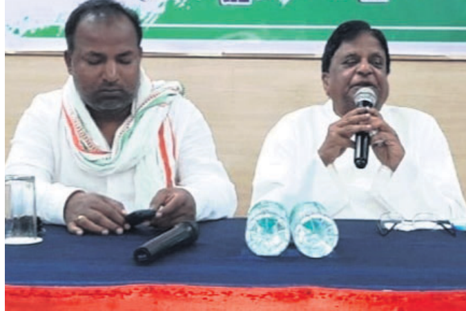
ଖବରଦାତା ସମ୍ମିଳନୀରେ କଂଗ୍ରେସ ନେତୃବୃନ୍ଦ ।