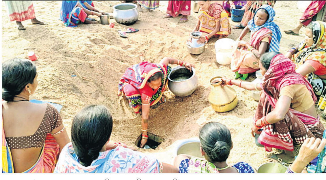
ସୁକତେଲ ନଦୀରେ ଖୋଳା ଯାଇଥିବା ତୁଆ ମହିଳାମାନେ ପାଣି ସଂଗ୍ରହ କରୁଛନ୍ତି ।