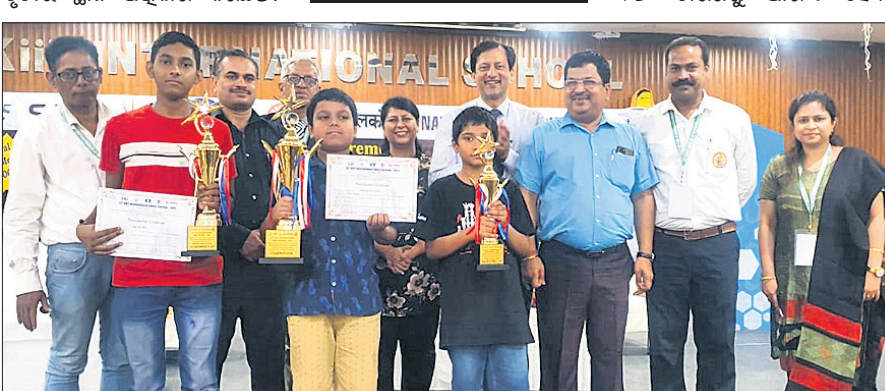
କିଏ ଇଷ୍ଟରନାଶନାଲ ଚେଷ୍ଟା ଫେଷ୍ଟିଭାଲ 'ବି' ବର୍ଗ ଚୁର୍ନାମେଷ୍ଟର କୃତୀ ପ୍ରତିଯୋଗିନୀମାନେ ଅତିଥିଙ୍କ ସହ।