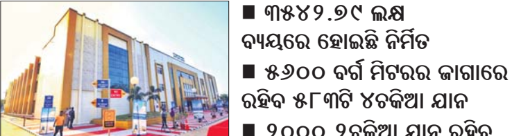
ଯୋଗଦେଇ କହିଛନ୍ତି ପାର୍କ ନିକଟରେ ପର୍ଯ୍ୟଟକଙ୍କ ସୁବିଧା ପାଇଁ ଟିକଟ ଘର, ପାନୀୟ ଜଳ ସୁବିଧା, ଶୌଚାଳୟ, ଡ୍ରାଲଭର