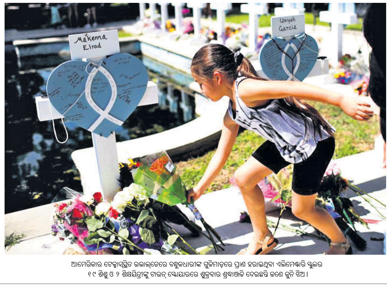
ଆମେରିକାର ଚେନ୍ନାୟ୍‌ସ୍ଥିତ ଉତ୍କଳାମାତାଙ୍କ ବନ୍ଧୁକଥାଚାଳକ ଗୁଲିମାଡ଼ରେ ପ୍ରାଣ ହରାଇଥିବା ଏଲିମେଣ୍ଟାରି ସ୍କୁଲର ୧୯ ଶିଶୁ ଓ ୨ ଶିକ୍ଷୟିତ୍ରୀଙ୍କୁ ଚାଉନ୍ ଷ୍ଟୋୟାରରେ ଶୁକ୍ରବାର ଶ୍ରଦ୍ଧାଞ୍ଜଳି ଦେଉଛନ୍ତି ଜଣେ କୁନି ଝିଅ ।