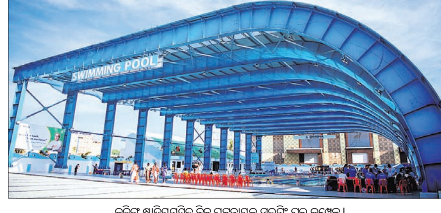
କଳିଙ୍ଗ ଷ୍ଠିୟମରୁ ବିଭୁ ପଟ୍ଟନାୟକ ପୁଲ୍ କମ୍ପ୍ଲେକ୍ସ।

ଭୁବନେଶ୍ଵର, ୨୭।୫ (କ୍ରୀଡ଼ା ପ୍ରତିନିଧି) କଳିଙ୍ଗ ଷ୍ଠିୟମର ବିଭୁ ପଟ୍ଟନାୟକ ପୁଲ୍ କମ୍ପ୍ଲେକ୍ସରେ ୨୦୨୦ର ଅଲମ୍ପିକ୍ ସାଇଜର ସନ୍ତରଣ ଶିବିର ଆରମ୍ଭ ହେବ। ଜୁନିୟର ଓ ସବ୍-ଜୁନିୟର ଉଭୟ ବାଳିକା ଓ ବାଳକ ବର୍ଗରେ ଏହି ପ୍ରତିଯୋଗିତା ୩୦ ତାରିଖ ପର୍ଯ୍ୟନ୍ତ ଚାଲିବ। ପୁଲ୍ କମ୍ପ୍ଲେକ୍ସରେ ୨୦୨୦ର ଅଲମ୍ପିକ୍ ସାଇଜର ସନ୍ତରଣ ଶିବିର ଆରମ୍ଭ ହେବ। ଜୁନିୟର ଓ ସବ୍-ଜୁନିୟର ଉଭୟ ବାଳିକା ଓ ବାଳକ ବର୍ଗରେ ଏହି ପ୍ରତିଯୋଗିତା ୩୦ ତାରିଖ ପର୍ଯ୍ୟନ୍ତ ଚାଲିବ। ପୁଲ୍ କମ୍ପ୍ଲେକ୍ସରେ ୨୦୨୦ର ଅଲମ୍ପିକ୍ ସାଇଜର ସନ୍ତରଣ ଶିବିର ଆରମ୍ଭ ହେବ। ଜୁନିୟର ଓ ସବ୍-ଜୁନିୟର ଉଭୟ ବାଳିକା ଓ ବାଳକ ବର୍ଗରେ ଏହି ପ୍ରତିଯୋଗିତା ୩୦ ତାରିଖ ପର୍ଯ୍ୟନ୍ତ ଚାଲିବ। ପୁଲ୍ କମ୍ପ୍ଲେକ୍ସରେ ୨୦୨୦ର ଅଲମ୍ପିକ୍ ସାଇଜର ସନ୍ତରଣ ଶିବିର ଆରମ୍ଭ ହେବ। ଜୁନିୟର ଓ ସବ୍-ଜୁନିୟର ଉଭୟ ବାଳିକା ଓ ବାଳକ ବର୍ଗରେ ଏହି ପ୍ରତିଯୋଗିତା ୩୦ ତାରିଖ ପର୍ଯ୍ୟନ୍ତ ଚାଲିବ।