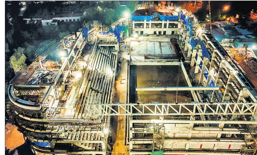
ପ୍ରସ୍ତୁତ ପଥେ କଳିଙ୍ଗ ଷ୍ଠିୟମର ଆକୃତିକ ସେଣ୍ଡର। ୧୦୦୦ ସିଟ୍ସିଷ୍ଟି ଆକୃତିକ କମ୍ପ୍ଲେକ୍ସରେ ୫୦ ମିଟର ଅଲମ୍ପିକ୍ ସାଇଜର ପୁଲ୍ ଏବଂ ୨୫ ମିଟର ପ୍ରାକୃତିକ ପୁଲ୍ ରହିଛି।

ବାଂଲାଦେଶ ବିପକ୍ଷ ଦ୍ଵିତୀୟ ଟ୍ରେଜେଟ ଟେଷ୍ଟରେ ଶ୍ରୀଲଙ୍କା ୧୦ ଉଇକେଟରେ ବିଜୟ ହାସଲ କରିଛି। ଏଥିପାଇଁ ଦଳ ଦୁଇ ମ୍ୟାଚ୍ରେ ଶେଷ ସିରିଜ୍ରେ ୧-୦ରେ ଜିତିନେଇଛି। ବାଂଲାଦେଶ ପୂର୍ବନିର୍ଣ୍ଣ ଅସମାପ୍ତ ଦ୍ଵିତୀୟ ଇନିଂସ୍ ଟେଷ୍ଟରେ ୧୫୬/୫ରୁ ଖେଳ ଆରମ୍ଭ କରି ୧୬୭ ରନରେ ଅଲଆଉଟ୍ ହୋଇଯାଇଥିଲା। ଶୁକ୍ରବାର ମ୍ୟାଚ୍ରେ ୫୮୦ ତଥା ଅଦ୍ଵିତୀୟ ଦିନରେ ଶ୍ରୀଲଙ୍କା ଏହାର ଦ୍ଵିତୀୟ ଇନିଂସ୍ରେ ୩ ଓଭରରେ ବିନା କୌଣସି ଉଇକେଟରେ ୨୯ ରନ କରି ବିଜୟ ଲକ୍ଷ୍ୟ ହାସଲ କରିନେଇଥିଲା। ଓଶାଡା ଫର୍ନାଣ୍ଡୋ ୯୯ ବଲ୍ରେ ୨୧ ରନ କରିଥିଲେ। ଅଧିନାୟକ ଦିପ୍ତୀ କରୁଣାରତ୍ନେ ୭୨ ରନ ଅପରାଜିତ ଥିଲେ। ଶ୍ରୀଲଙ୍କା ତରଫରୁ ବାଂଲାଦେଶର ସବୁଠାରୁ ବେଶି ଶତ ଘଟାଇଥିବା ଖେଳାଳି ଜଣକ ହେଲେ ଫାଷ୍ଟ ବୋଲର ଆସିଫା ଫର୍ନାଣ୍ଡୋ। ସେ ମ୍ୟାଚ୍ରେ ଟାକ୍ ପ୍ରଥମ ୧୦ ଉଇକେଟ ସଫଳତା ହାସଲ କରିଥିଲେ। ପ୍ରଥମ ଇନିଂସ୍ରେ ସେ ୯୩ ରନ ଦେଇ ୪ ଉଇକେଟ ଏବଂ ଦ୍ଵିତୀୟ ଇନିଂସ୍ରେ ୫୧ ରନ ଦିନିୟରେ ୬ ଉଇକେଟ ହାସଲ କରିଥିଲେ। ଆସିଫା ଫର୍ନାଣ୍ଡୋ ପୂର୍ଣ୍ଣ ଅଫ୍ ଦି ମ୍ୟାଚ୍ ଓ ଆଞ୍ଜେଲୋ ମାଥୁସ ପୂର୍ଣ୍ଣ ଅଫ୍ ଦି ସିରିଜ୍ ବିବେଚିତ ହୋଇଥିଲେ। ଏସିପି ଟେଷ୍ଟରେ ବାଂଲାଦେଶ ପ୍ରଥମ ଇନିଂସ୍: ୩୨୫, ଶ୍ରୀଲଙ୍କା ପ୍ରଥମ ଇନିଂସ୍: ୫୦୬, ବାଂଲାଦେଶ ଦ୍ଵିତୀୟ ଇନିଂସ୍: ୧୬୯ (ଶକିବ ଅଲ୍ ହସନ-୫୮, ଲିତନ ଦାସ-୫୨; ଆସିଫା ଫର୍ନାଣ୍ଡୋ-୬/୫୧, କାପୁନ ରଥ୍-୯/୪୦)। ଶ୍ରୀଲଙ୍କା ଦ୍ଵିତୀୟ ଇନିଂସ୍: ୨୯୦ (ଓଶାଡା ଫର୍ନାଣ୍ଡୋ-୨୧, ଦିପ୍ତୀ କରୁଣାରତ୍ନେ-୭)।