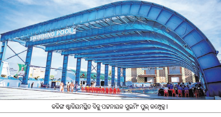
କଳିଙ୍ଗ ଷ୍ଟାଡିୟମରୁ ବିକ୍ରମ ପଟ୍ଟନାୟକ ପୁଲ୍‌କିଂ ପୁଲ୍ କମ୍ପ୍ଲେକ୍ସ।

୩ ଦିନିଆ ଜୁନିୟର ଓ ସବ୍‌ଜୁନିୟର ପୁଲ୍‌କିଂ ଚାମ୍ପିୟନଶିପ୍‌ରେ ରାଜ୍ୟର ୨୦ ଜିଲାରୁ ମୋଟ ୨୫୮ ପ୍ରତିଯୋଗୀ ଅଂଶଗ୍ରହଣ କରିବେ। ଏହା ମଧ୍ୟରେ ୬୧ ବାଲିକା ଓ ୧୮୧ ବାଲକ ପ୍ରତିଯୋଗୀ ସାମିଲ। ପାଖାପାଖି ୫୦ ଟେକ୍ନିକାଲ ଅଫିସିଆଲ ପ୍ରତିଯୋଗିତା ପରିଚାଳନା ଦାୟିତ୍ଵରେ ରହିବେ। ଇଲେକ୍ଟ୍ରୋନିକ୍ ଟର୍ପିଆଲ୍ ସହିତ ପ୍ରତିଯୋଗିତାର ପ୍ରକ୍ରିୟାକୁ ସମ୍ପୂର୍ଣ୍ଣ ଡିଜିଟାଲାଇଜ୍ କରାଯାଇଛି। ଫଳରେ ପ୍ରତିଯୋଗୀ ଫିନିଶିଂ ଲାଇନ୍ ଟର୍ କରାଯାଏ ମାତ୍ର ଫର୍ମାଲ୍ ଟାଉଣ୍ଡ ଓ ଫଳାଫଳ ଆପେ ଆପେ ପ୍ରତିଫଳିତ ହେବ।