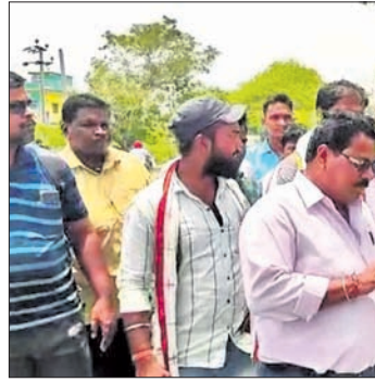
ଅସ୍ଥାୟୀ ମିଟର ରିଡିଂ କର୍ମଚାରୀମାନେ ସହକାରୀ ଯନ୍ତ୍ରୀଙ୍କୁ ଘେରିବା କରୁଛନ୍ତି।

ଖଇରା, ୨୭।୫(ଡି.ଏନ.ଏ.) ବାଲେଶ୍ୱର ଜିଲ୍ଲା ଖଇରା ବିନ୍ଦୁପତ ଉପଖଣ୍ଡ ଅଧୀନରେ କାର୍ଯ୍ୟରତ ମିଟର ରିଡିଂ କର୍ମଚାରୀଙ୍କୁ ସହକାରୀ ଯନ୍ତ୍ରୀ ଘେରିବା ପାଇଁ ଗଠନ କରାଯାଇଛି। ଖଇରା ବିନ୍ଦୁପତ ଉପଖଣ୍ଡରେ ସାଲ