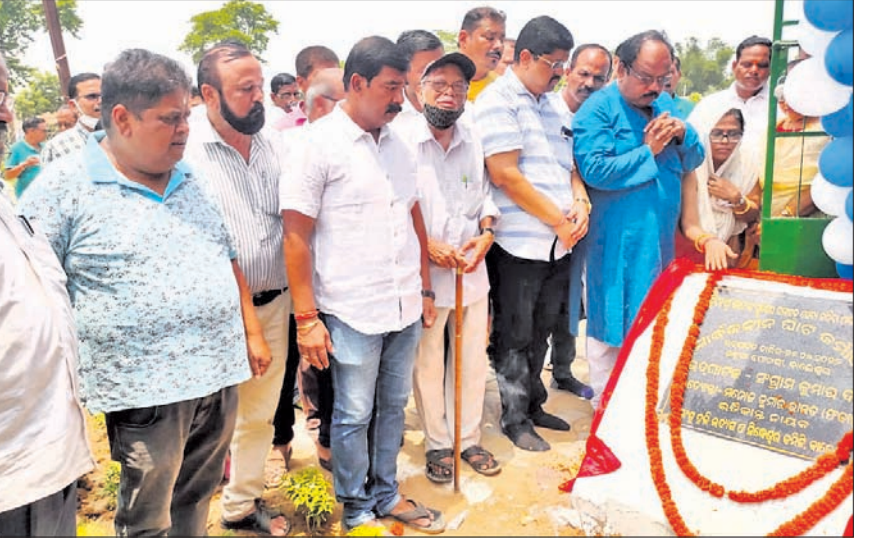
ଅତିଥିଙ୍କ ଦ୍ୱାରା ଘାଟ ଗୃହ ଉଦ୍ଘାଟନା କରାଯାଇଛି।