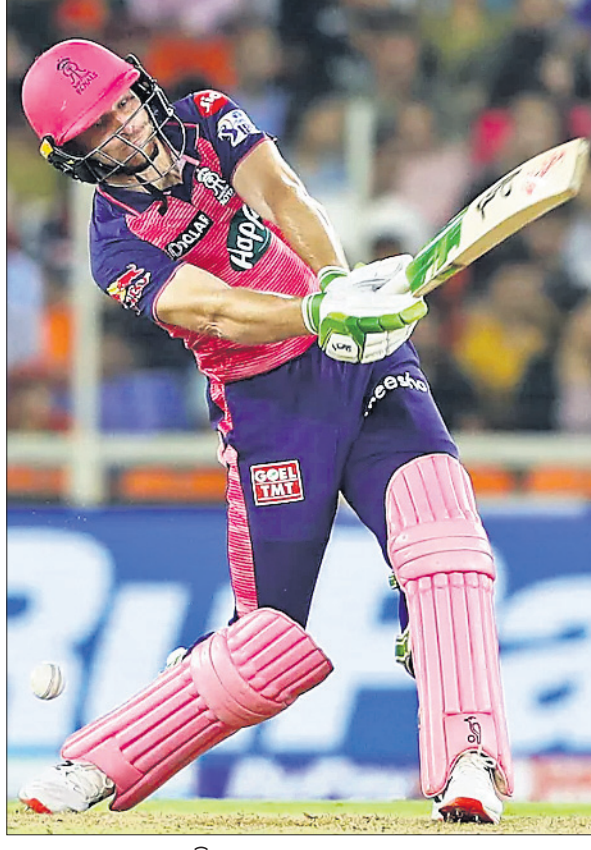
ଶର୍ ଖେଳିବା ଅବସରରେ ଶେଷ ବଲ୍ ଚଳାଇବା।

ଦିନିକର ବ୍ୟାଟରଙ୍କ ଦାୟିତ୍ଵହୀନ ପ୍ରଦର୍ଶନ ରୟାଲ ଚ୍ୟାଲେଞ୍ଜର୍ସ (ଆରସିସି) ବାଙ୍ଗାଲୋର ପାଇଁ ଯୁଦ୍ଧରେ ମହଙ୍ଗା ପଡ଼ିଛି। ଫଳରେ ଇଣ୍ଡିଆନ ପ୍ରିମିୟର ଲିଗର ଶୁକ୍ରବାର ଅନୁଷ୍ଠିତ ଗୁରୁତ୍ଵପୂର୍ଣ୍ଣ ବ୍ୟାଟିଂ ମ୍ୟାଚରେ ୨୦୦୮ରେ ରାଜସ୍ଥାନ ଚାମ୍ପିୟନ ହୋଇଥିଲା। ରିପୋର୍ଟ ଲେଖା ହେବା ବେଳକୁ ରାଜସ୍ଥାନ ୧୨ ଓଭରରେ ୨ ଉଇକେଟ ହରାଇ ୧୧୪ ରନକରି ବିଜୟ ପଥରେ ଅଗ୍ରସର ହୋଇଛି। ଓପନର ଯଶ୍ଵି କମ୍ପାଣ୍ଡ ୨୧ ଓ ସଞ୍ଜୁ ସାମସନ ୨୩ ରନକରି ଆଉଟ ହୋଇଥିବାବେଳେ ଶେଷ ଓଭରରେ ୩୭ ବଲ୍ ୬୯ ରନ କରି ଅପରାଜିତ ରହିଛନ୍ତି।