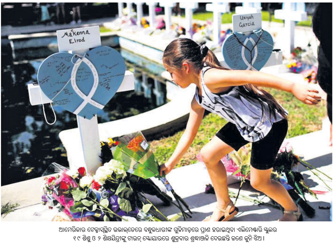
ଆମେରିକାର ଚେନ୍ନାୟ୍‌ସ୍ଥିତ ଉତ୍କଳାମାତାଙ୍କ ବନ୍ଧୁକଥାରିକା ଗୁଲିମାଡ଼ରେ ପ୍ରାଣ ହରାଇଥିବା ଏଲିମେଣ୍ଟାରି ସ୍କୁଲର ୧୯ ଶିଶୁ ଓ ୨ ଶିକ୍ଷୟିତ୍ରୀଙ୍କୁ ଚାଉନ୍ ଷ୍ଟୋୟାରରେ ଶୁକ୍ରବାର ଶ୍ରଦ୍ଧାଞ୍ଜଳି ଦେଉଛନ୍ତି ଜଣେ କୁନି ଝିଅ ।