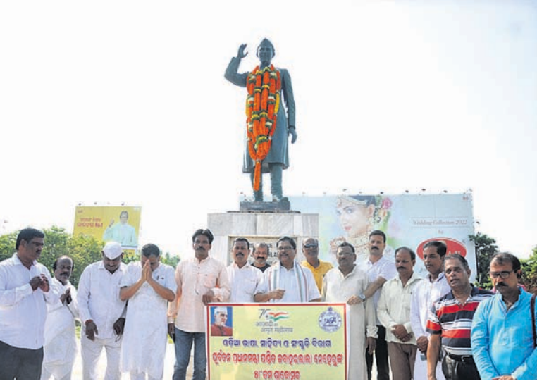
ପୂର୍ବତନ ପ୍ରଧାନମନ୍ତ୍ରୀ ପଣ୍ଡିତ ଜବାହରଲାଲ ନେହେରୁଙ୍କ ୫୮ତମ ଶ୍ରାଦ୍ଧ ଦିବସ ପାଇଁ ଅବସରରେ ଶୁକ୍ରବାର ଭୁବନେଶ୍ୱର ମାଷ୍ଟରକ୍ୟାଣ୍ଟିନ ଛକସ୍ଥିତ ତାଙ୍କ ପ୍ରତିମୂର୍ତ୍ତିରେ ଶ୍ରଦ୍ଧାଞ୍ଜଳି ଅର୍ପଣ କରାଯାଇଛି।