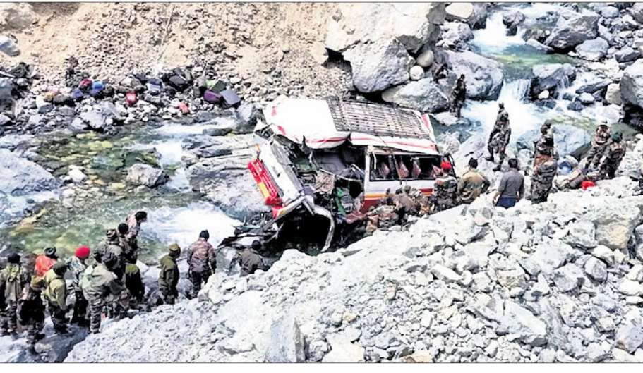
ଲବାଖର ରୁକ୍ମେଶ୍ୱର ସେତୁର ଦେଇ ପ୍ରବାହିତ ଶୋକାଳ ନଦୀକୁ ଶୁକ୍ରବାର ଖସିପଡ଼ିଥିବା ସେନା ଗାଡ଼ି ।

ଆହତ ୧୯ ଜଣଙ୍କୁ ପ୍ରଥମେ ଗ୍ଲାନାୟ ପରତାପୁର ହସ୍ପିଟାଲରେ ଭର୍ତ୍ତି କରାଯାଇଥିଲା। ପରେ ସେମାନଙ୍କୁ ଚାନ୍ଦିସର ହେଲିକପ୍ଟରରେ ହରିୟାଣାର ପଞ୍ଚକୁଳା ଜିଲ୍ଲାରେ ଥିବା କମାଣ୍ଡ ହସ୍ପିଟାଲକୁ ସ୍ଥାନାନ୍ତର କରାଯାଇଛି।