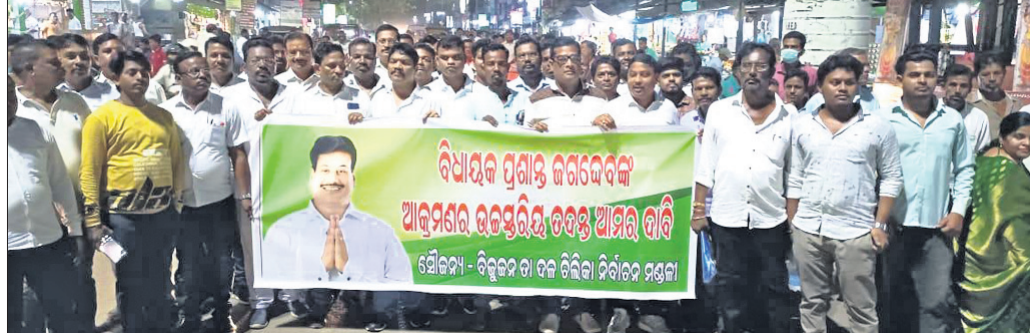
ବାଲୁଗା ବଜାରରେ ବିଜେଡି କାର୍ଯ୍ୟକ୍ରମର ବାହାରିଥିବା ପଦଯାତ୍ରା।

ଖୋର୍ଦ୍ଧା ଅଫିସ, ୨୭।୫(ଡି.ଏନ୍.ଏ.): ଖୋର୍ଦ୍ଧା ଅଫିସର ଉଚ୍ଚପୁରୀୟ ତଦନ୍ତ ଦାବି କରିଛନ୍ତି। ଏଥିରେ ଉଲ୍ଲେଖ ରହିଛି ଯେ, ନେତୃତ୍ୱ ପକ୍ଷରୁ ଉଚ୍ଚପୁରୀୟ ତଦନ୍ତ ଦାବି କରାଯାଇଛି।