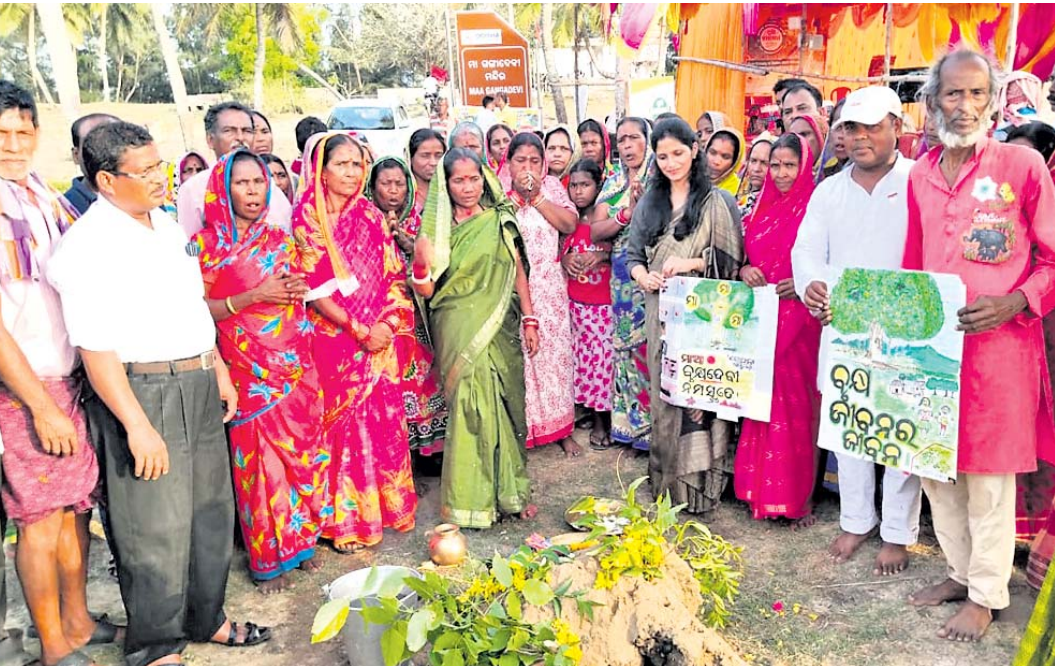
ବୃକ୍ଷ ସଚେତନତା କାର୍ଯ୍ୟକ୍ରମରେ ଉପସ୍ଥିତ ସ୍ଥାନୀୟ ଗ୍ରାମବାସୀ, ପରିବେଶବିତ୍ ଓ ଅତିଥି।