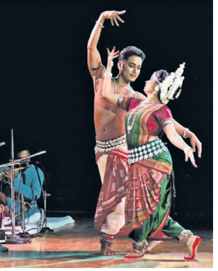
ଓଡ଼ିଆ ଭାଷା, ସାହିତ୍ୟ ଓ ସଂସ୍କୃତି ବିଭାଗ ପକ୍ଷରୁ ଭୁବନେଶ୍ୱରସ୍ଥିତ ଉତ୍କଳ ମହାବିଦ୍ୟାଳୟରେ ଚାଲିଥିବା ନାଟ ଓ ନୃତ୍ୟ ଉତ୍ସବର ଦ୍ୱିତୀୟ ଦିନରେ ପରିବେଷିତ ନୃତ୍ୟ।

ଏବେ ବହୁତ ଚାହିଦା ରହୁଛି। କାରଣ ପୂର୍ବରୁ ବୁଣାକାରମାନେ ଏକ ନିର୍ଦ୍ଦିଷ୍ଟ ପରମ୍ପରାରେ ଲୁଗା ବୁଣି ଆସୁଥିଲେ। ମାତ୍ର ଏବେ ଆର୍ଟ କଲେଜର ପିଲାମାନେ ଏ କ୍ଷେତ୍ରକୁ ଆସିବା ପରେ ଆମ ଦୃଷ୍ଟିକୋଣରେ ବୁଣା ଯାଉଛି, ଯାହା ଖୁବ୍ ଆଦୃତ ହେଉଛି।