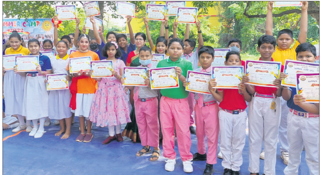
ଖୋର୍ଦ୍ଧା ସିଗମା ପବ୍ଲିକ୍ ସ୍କୁଲ ପକ୍ଷରୁ ପ୍ରାପ୍ତକାରୀ ଶିବିରର ଉଦ୍‌ଯାପନା ଦିବସରେ ଛାତ୍ରଛାତ୍ରୀଙ୍କୁ ପ୍ରମାଣପତ୍ର ପ୍ରଦାନ କରାଯାଇଛି।

ଏଥିରେ ଦର୍ଶାଯାଇଛି ଯେ, ପ୍ରତିବର୍ଷ ପ୍ରକୃତି ବନ୍ଧୁ ଓ ପ୍ରକୃତି ମିତ୍ର ପୁରସ୍କାର ଲାଭି ଉପଯୁକ୍ତ ବ୍ୟକ୍ତିଙ୍କୁ ମନୋନୀତ ନିମନ୍ତେ ଜିଲ୍ଲାସ୍ତରରେ ଜିଲ୍ଲା ପରିବେଶ ସମିତି ଜିଲ୍ଲା ବୋଲଗଡ଼ କୁଳକୁ ଆସିଛି ଏବଂ କିଛି ଅଭିଯୋଗ ବୋଲଗଡ଼ କୁଳ ବନ ସୁରକ୍ଷା ସମିତି ମହାସଂଘ ଓ ପରିବେଶପ୍ରେମୀ ଖୋର୍ଦ୍ଧା ବନଖଣ୍ଡ ଅଧିକାରୀଙ୍କ ନିକଟରେ ଅଭିଯୋଗ କରିଛନ୍ତି।