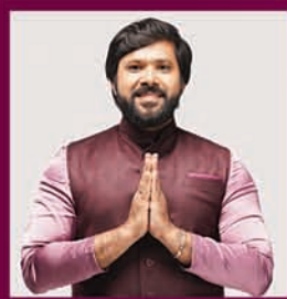
CHIEF GUEST Mr SBYASACHI MISHRA Indian Film Actor

NEAR POLICE STATION, CHANDRASEKHARPUR, BHUBANESWAR. ☎ 96689 88916