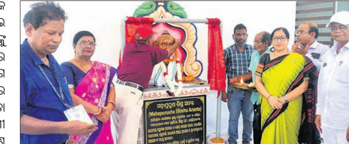
ମହାପୁରୁଷ ଶିଶୁ ଅନନ୍ତ ଦାସଙ୍କ ପ୍ରତିମୂର୍ତ୍ତି ଅନାବରଣ କରାଯାଇଛି।

ଖୋର୍ଦ୍ଧା ଅନନ୍ତ ଦାସଙ୍କ ପ୍ରତିମୂର୍ତ୍ତି ଅନାବରଣ କାର୍ଯ୍ୟକ୍ରମ ଅନୁଷ୍ଠିତ ହୋଇଯାଇଛି। ଏଥିରେ ଉତ୍କଳ ଗ୍ରାମ୍ଭିକାଳୀନ ଶିବିରର ଉଦ୍‌ଯାପନା କରାଯାଇଛି।