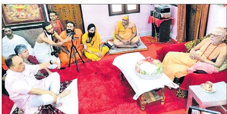
ଶକରାଚାର୍ଯ୍ୟଙ୍କ ସହ ସ୍ୱପ୍ନମଣ୍ୟମ୍ ସ୍ତାମୀ ଓ ତ୍ରିଭେନ୍ଦ୍ରନାଥ ରାଣୀ ଆଲୋଚନା କରୁଛନ୍ତି।