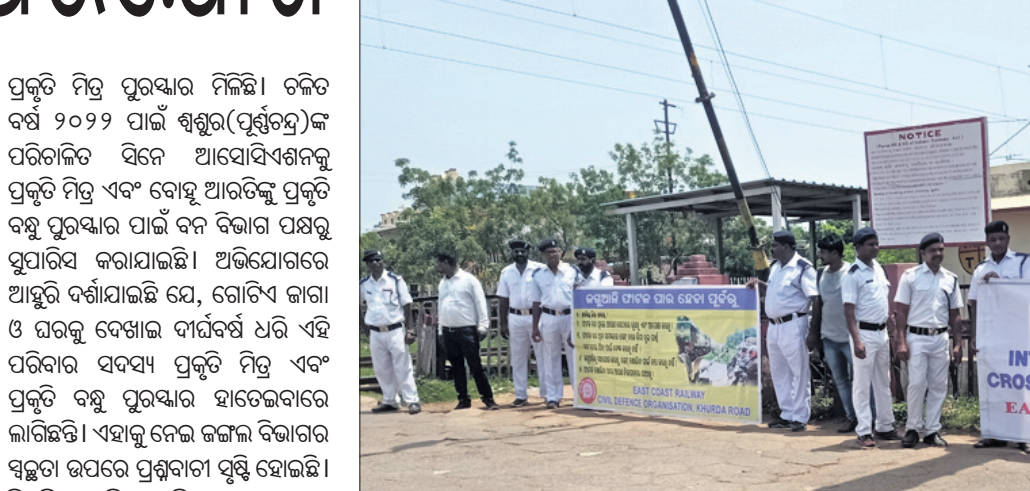
ଖୋର୍ଦ୍ଧା ରେଳ ଡିଭିଜନ ପକ୍ଷରୁ ଜନସାଧାରଣଙ୍କୁ ସଚେତନ କରାଯାଇଛି।