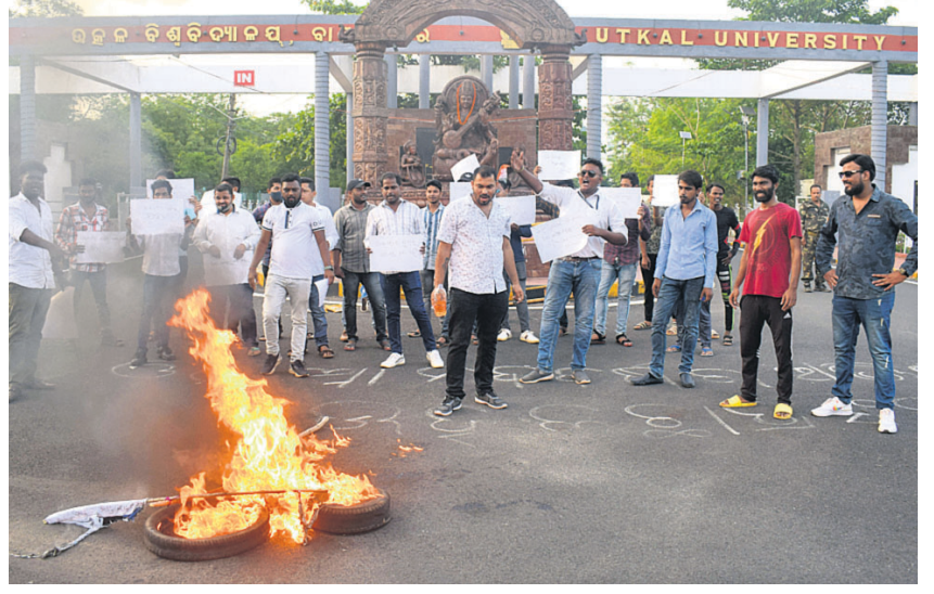
ବିଶ୍ୱବିଦ୍ୟାଳୟଗୁଡ଼ିକରେ ଚାଲିଥିବା ସେଲ୍ ଫାଇନାଲିଂ କୋର୍ସରେ ଅକ୍ଟୋ ୨୦ ପ୍ରତିଷ୍ଠିତ ହୁଏଲ୍ ବିରୋଧ କରି ଉତ୍କଳ ବିଶ୍ୱବିଦ୍ୟାଳୟ ଛାତ୍ର କଂଗ୍ରେସ ପକ୍ଷରୁ ବିଶ୍ୱବିଦ୍ୟାଳୟ ପାଟକ ସମ୍ମୁଖରେ ନିଆଁ ଜାଳି ବିକ୍ଷୋଭ।