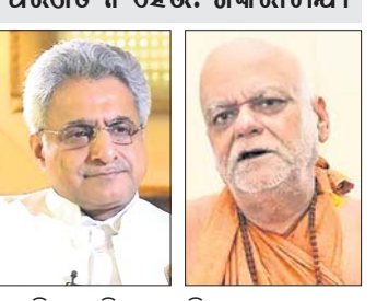
ପିନାକୀ ମିଶ୍ର ନିଶ୍ଚଳାନନ୍ଦ ସରସ୍ୱତୀ

ଡାଏନିଟିଭି ଭୋଗ ଭୂମିରେ ପରିଣତ ନ ହେଉ: ଶଙ୍କରାଚାର୍ଯ୍ୟ