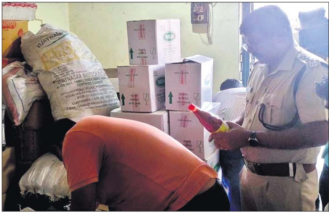
ମାଲଗୋଦାମ ଅଞ୍ଚଳର ଏକ ଗୋଦାମରେ ପୋଲିସର ଚଢ଼ାଉ। ଜବତ ଅପମିଶ୍ରିତ ସସ୍।