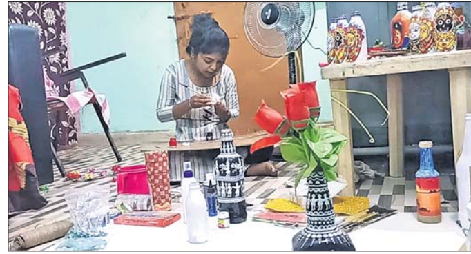
ଚିତ୍ର ଆଙ୍କିବାର ନିମନ୍ତ ଶାଶ୍ୱତୀ ।