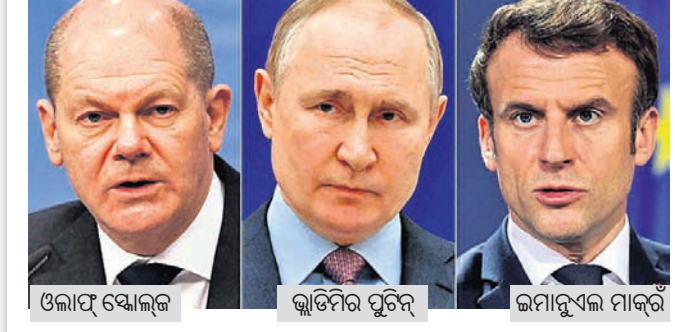
ଓଲାଫ୍ ଷୋଲ୍‌ଜ, ଭାଡିମିର ପୁଟିନ୍, ଇମାନ୍‌ଉଏଲ ମାକ୍ରନ୍

ମସ୍କୋ, ୨୮୫: ମୁକ୍ତେନ୍ଦ୍ର ମୁଖି ଯୋଗୁ ସୀମା ବିଷ୍ଣୁରେ ଖାଦ୍ୟସଂକଟ ଦେଖାଦେଇଛି। କୃଷି ସାଗର ଓ ଆଲୋକ ସାଗରକୁ ରୁଷିଆ ବୁକ୍ କରିଥିବାରୁ ମୁକ୍ତେନ୍ଦ୍ର ଖାଦ୍ୟସଂକଟ ପରିବହନ ବାଧାପ୍ରାପ୍ତ ହୋଇଛି।