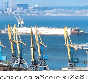
ଲୁଟ୍‌ଥିବା ସେ ଅଭିଯୋଗ ଆଣିଛନ୍ତି।

ରୁଷିଆ ଦଖଲରେ ଥିବା ବନ୍ଦର ସହର ମାରିଉପୋଲରୁ ମସ୍କୋ ମେଟାଲ ଏବଂ କାହାଳି ବୋହାଣେଇଛି। ବନ୍ଦରର ଜଣେ ମୁଖପାତ୍ରଙ୍କ ସୂଚନା ଅନୁସାରେ, ଏକ ଭେଦେଲରେ ପ୍ରାୟ ୨୭ ଶହ ଟନ୍ ମେଟାଲ ଭର୍ତ୍ତି କରାଯାଇ ଚାହାଳୁ ରୁଷିଆ ସହର ରୋସ୍ତୋଭ-ଅର୍-ଡିନକୁ ନିଆଯାଇଛି।