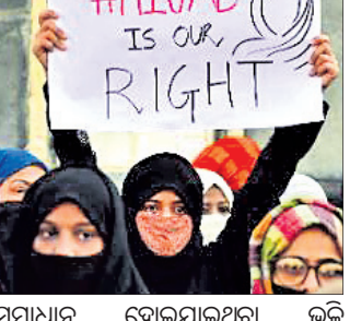
ସମାଧାନ ହୋଇଯାଇଥିବା ଭଳି ଜଣାପଡୁଥିଲେ ମଧ୍ୟ ପୂଣିଥରେ ଉପକୂଳ ଅଞ୍ଚଳରେ ଏହାକୁ ନେଇ ସାମ୍ପ୍ରଦାୟିକ ବିବାଦ ଏବେ ଅନ୍ତର୍ଜାତୀୟ ସ୍ତରରେ ପହଞ୍ଚିଛି।

ବେଙ୍ଗାଳୁରୁ, ୨୮୫ (ଆଇଏଏନଏସ) ହିଜାବ ବିବାଦ ପୂଣିଥରେ ଉପକୂଳ କର୍ମଚାରୀଙ୍କ ମଧ୍ୟ ଚେତାଇଛି। ଏଥିସହିତ ମାଲି ମିନି-ମସ୍କିବ ବିବାଦକୁ ନେଇ ଉତ୍ତର କନ୍ନଟ, ଦକ୍ଷିଣ କନ୍ନଟ ଏବଂ ଉତ୍ତରୀୟ ସାମ୍ପ୍ରଦାୟିକ ଉତ୍ତେଜନା ଦେଖାଦେଇଛି।