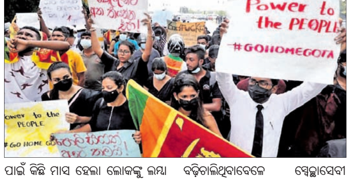
ପାଇଁ କିଛି ମାସ ହେଲା ଲୋକଙ୍କୁ ଲମ୍ବା ଅର୍ଥନୈତିକ ସକଟ ଯୋଗୁ ରାଜନୈତିକ ଅସ୍ଥିରତା ଦେଖାଦେଇଛି।

ଶ୍ରୀଲଙ୍କାରେ ଗଣତା ଅର୍ଥକ ସକଟକୁ ନେଇ ରାଷ୍ଟ୍ରପତି ଗୋଟାବାୟା ରାଜପାକ୍‌ସେଙ୍କ ଇସ୍ତଫା ଦାବିରେ ସରକାର ବିରୋଧୀ ଆନ୍ଦୋଳନ ଶନିବାର ୫୦ ଦିନରେ ପହଞ୍ଚିଛି।