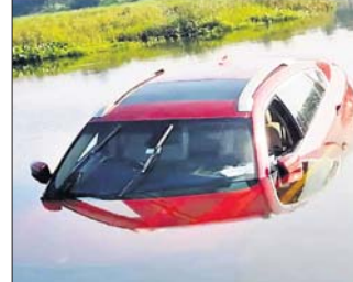
ଗାଡ଼ି ନୟର ବ୍ୟବହାର କରି ପୋଲିସ୍ ଟା' ମାଲିକଙ୍କୁ ଡକେଇଥିଲା । ମାଲିକ ପୋଲିସ୍

ବେଙ୍ଗାଳୁରୁ: ମା'ଙ୍କ ବିୟୋଗ ଦୁଃଖରେ କର୍ମଚରୀ ଜଣେ ଯୁବକ ୧.୩୦ କୋଟିର ବିଏମ୍‌ପ୍ଲୁ କାର୍‌କୁ କାବେରୀ ନଦୀରେ ଭସେଇ ଦେଇଛନ୍ତି ।