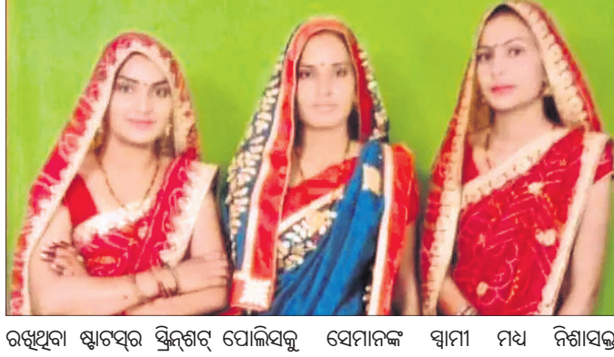
ରଖୁଥିବା ଷ୍ଟରଟର ସ୍ତ୍ରୀଙ୍କର ପୋଲିସ୍‌କୁ ପିଲିଛି। ସବୁଦିନ ମରିବା ଅପେକ୍ଷା ଏକାଧରେ ମରିଯିବା ଭଲ ବୋଲି ଏଥିରେ ସେମାନଙ୍କୁ ଚ୍ୟାଲେଞ୍ଜ କରିଛନ୍ତି।

ରାଜସ୍ଥାନର ଜୟପୁରରେ ଏକ ହୃଦୟ ବିଚାରକ ଘଟଣା ଘଟିଛି। ଦୀର୍ଘଦିନ ହେଲା ଯୌତୁକ ନିର୍ଯ୍ୟାତନା ଓ ଘରୋଇ ହିଂସାର ଶିକାର ହୋଇଆସୁଥିବା ୩ ଭଉଣୀ ଏକାସଙ୍ଗେ ୨ ପିଲାଙ୍କୁ ଧରି ଆତ୍ମହତ୍ୟା କରିଥିବା ଜଣାପଡ଼ିଛି।