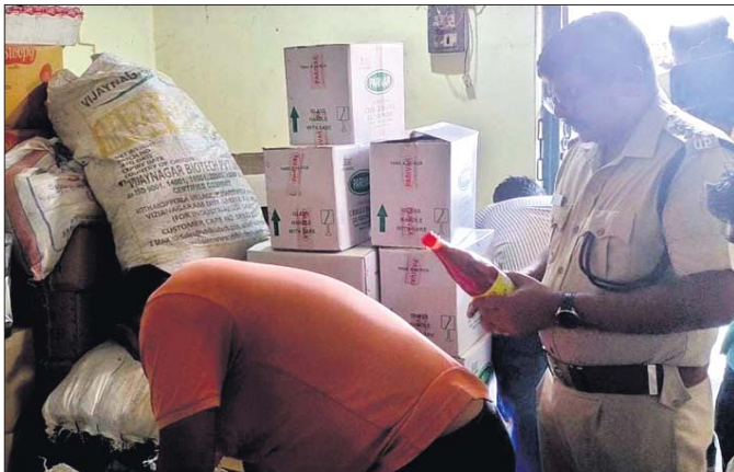
ମାଲଗୋଦାମ ଅଞ୍ଚଳର ଏକ ଗୋଦାମରେ ଯୋଗାଣ କରାଯାଇଥିବା ଅପମିଶ୍ରିତ ସସ୍

ନକଲି ଓ ଅପମିଶ୍ରିତ ସାମଗ୍ରୀ ଚିଆରିର ପେଣ୍ଠପଞ୍ଜୀ ପାଳିକାକଟକ ସହର। ଶୁକ୍ରବାର ଜଗତପୁର ଥାନା ଅଧୀନ ତରୋଳ ନିକଟ ଏକ ନକଲି ମୁଦୁପାମାୟ କାରଖାନାରେ ଚଢ଼ାଇ କରାଯାଇ ପ୍ରାୟ ୪ ଲକ୍ଷ ଟଙ୍କାର ସାମଗ୍ରୀ ଜବତ କରାଯାଇଥିବାବେଳେ ଶନିବାର ମାଲଗୋଦାମର ଏକ ଅପମିଶ୍ରିତ ସସ୍ ଗୋଦାମ ଓ ବାରଙ୍ଗର ଏକ ସସ୍ କାରଖାନାରେ ଯୋଗାଣ କରାଯାଇଥିଲା। ମିଳିଥିବା ସୂଚନା ଅନୁଯାୟୀ, ମାଲଗୋଦାମ ଥାନା ଅଞ୍ଚଳର ଏକ ଗୋଦାମରେ ଅପମିଶ୍ରିତ ସସ୍ ବିକ୍ରି ହେଉଥିଲା। ବିଶେଷ ସୂତ୍ରରୁ ସ୍ଥାନୀୟ ପୋଲିସ୍ ଖବରପାଇ ଶନିବାର ଉକ୍ତ ଗୋଦାମରେ ଚଢ଼ାଇ କରି ୨୦ ଯେତି ଅପମିଶ୍ରିତ ସସ୍ ଜବତ କରାଯାଇଥିଲା। ଏଥିସହ ଗୋଦାମର ବୁକ୍ କଣ୍ଟ୍ରୋଲ ଅଟକ ରଖାଯାଇଥିଲା। ସେମାନଙ୍କୁ ପଚରାଉଚରାବେଳେ ଉକ୍ତ