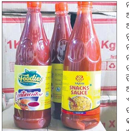
ଜବତ ଅପମିଶ୍ରିତ ସସ୍

ସସ୍ ବାରଙ୍ଗ ଥାନା ଅଧୀନ ସାତଗ୍ରାମ ଯାତ୍ରାରେ ଥିବା ଏକ କାରଖାନାରେ ଚଢ଼ାଇ କରାଯାଇଥିବା ସସ୍ ପ୍ରାୟ ୨୦ ଯେତି ଅପମିଶ୍ରିତ ସସ୍ ଜବତ କରାଯାଇଥିଲା। ପରେ ବାରଙ୍ଗ ପୋଲିସ୍ ଦସ୍ତଖତ କରି ଗୋଦାମ ଓ ଚଢ଼ାଇ କରି ୨୦ ଯେତି ଅପମିଶ୍ରିତ ସସ୍ ଜବତ କରାଯାଇଥିଲା। ଏଥିସହ ଗୋଦାମର ବୁକ୍ କଣ୍ଟ୍ରୋଲ ଅଟକ ରଖାଯାଇଥିଲା। ସେମାନଙ୍କୁ ପଚରାଉଚରାବେଳେ ଉକ୍ତ